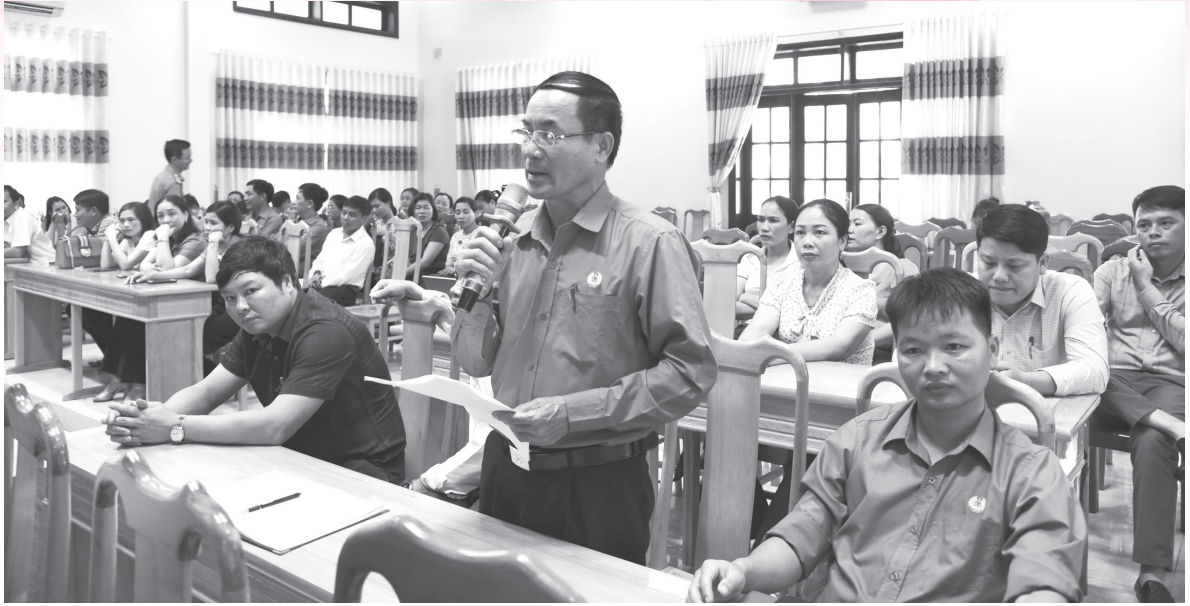
Cán bộ, đoàn viên công đoàn cơ sở huyện Lộc Hà đối thoại với Bí thư Huyện ủy (ngày 20/4/2021)