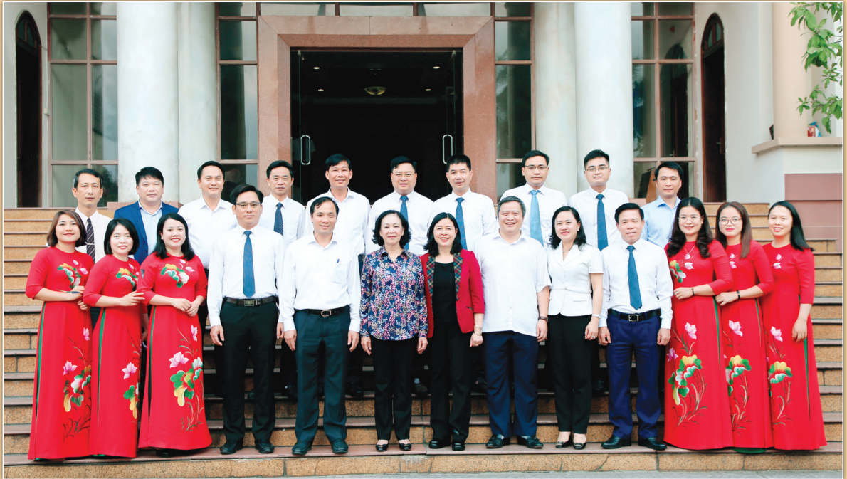
Các đồng chí lãnh đạo Trung ương chụp ảnh lưu niệm với lãnh đạo Tỉnh và tập thể lãnh đạo, cán bộ Ban Dân Vận Tỉnh ủy Hà Tĩnh (tháng 3/2021)