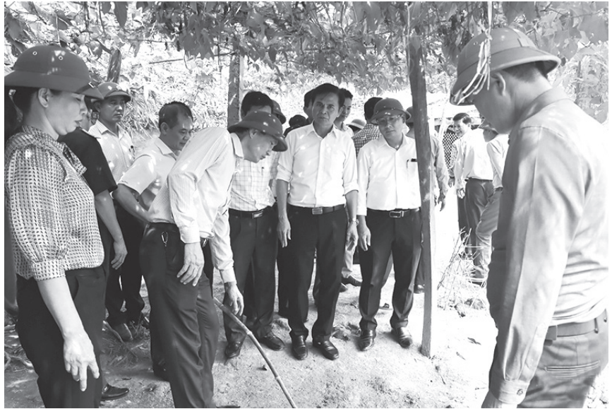
Đoàn công tác BCD chương trình mục tiêu Quốc gia xây dựng NTM tham quan mô hình xử lý nước thải tại Thôn Yên Khánh xã Cẩm Vịnh

Để triển khai hiệu quả các phong trào thi đua Dân vận khéo trong xây dựng NTM, Ban Thường vụ Huyện ủy đã ban hành Nghị quyết chuyên đề về tăng cường sự lãnh đạo của Đảng đối với hoạt động của Mặt trận Tổ quốc