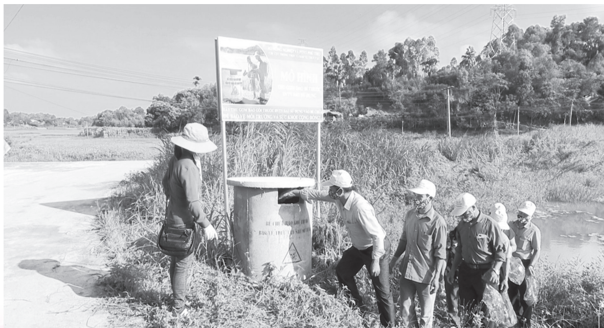
Mô hình thu gom, phân loại rác thải nhựa trên đồng ruộng được Hội nông dân các cấp thực hiện có hiệu quả

hợp ủ phân vi sinh tại hộ gia đình và cụm dân cư ”, đồng thời xây dựng kế hoạch triển khai thực hiện. Nghị quyết ra đời với mục đích góp phần biến một lượng lớn rác thải hữu cơ thành phân bón vi sinh, phục vụ sản xuất nông nghiệp, nhằm giảm chi phí sản xuất, tăng thu nhập cho nông dân; đồng thời giảm chi phí thu gom, vận chuyển, xử lý và diện tích các bãi chứa rác, góp phần hoàn thành tiêu chí môi trường trong xây dựng nông thôn mới. Cùng với việc ban hành nghị quyết, xây dựng kế hoạch triển khai thực hiện, Ban Thường vụ Hội Nông dân tỉnh đã phối hợp với Trung tâm Ứng dụng tiến bộ khoa học công nghệ của Sở