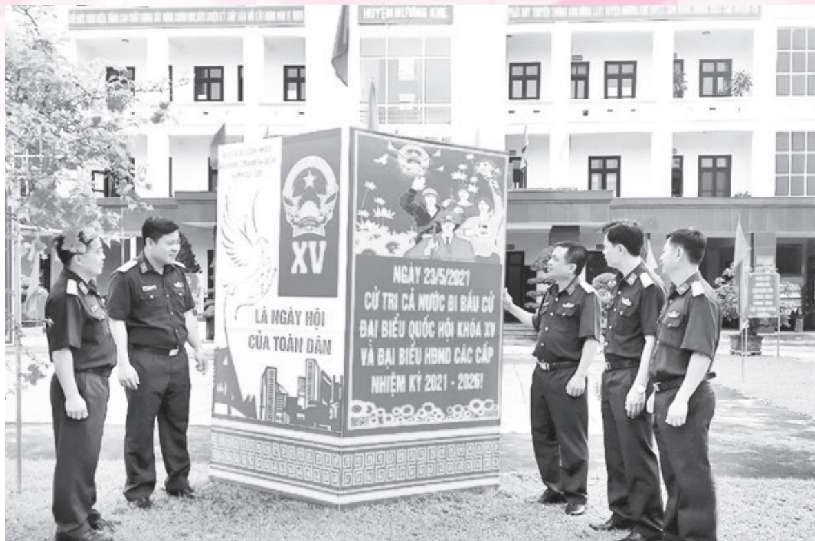
Cán bộ, nhân viên Ban chỉ huy quân sự huyện Hương Khê triển khai hệ thống pano, áp phích tuyên truyền, cổ động về bầu cử (ngày 20/4/2021)