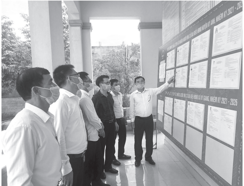
Kiểm tra công tác bầu cử tại huyện Kỳ Anh

Với chức năng, nhiệm vụ của mình, bám sát các văn bản chỉ đạo của Trung ương, của tỉnh, MTTQ các cấp đã và đang thực hiện đúng tiến độ, chất lượng các công việc được giao trong công tác bầu cử. Việc hiệp thương, lựa chọn người ứng cử đại biểu Quốc hội khóa XV và đại biểu HĐND các cấp được tiến hành bảo đảm chặt chẽ, đúng quy định về số lượng, cơ cấu thành phần, nhất là chất lượng người ứng cử. Ban Thường trực Ủy ban Mặt trận Tổ quốc (MTTQ) các cấp đã chủ động chuẩn bị tốt các điều kiện cho hội nghị hiệp thương, từ kịch bản, nội dung, chương trình về công tác bầu cử; tham gia chuẩn bị dự kiến cơ cấu, thành phần và phân bổ số lượng người ứng cử đại biểu Hội đồng nhân dân (HĐND) cùng cấp cho các cơ quan, tổ chức, đơn vị và các địa phương; tổ chức hội nghị lấy ý kiến và tín nhiệm của cử tri nơi cư trú của người ứng cử; in ấn các văn bản thực hiện