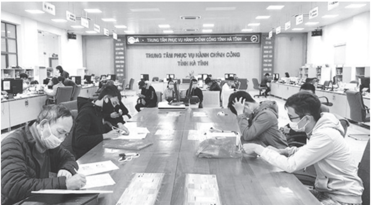
Người dân giao dịch tại Trung tâm phục vụ hành chính công Tỉnh

Nhận thức đúng vai trò quan trọng của công tác dân vận chính quyền, trong những năm qua, các cấp chính quyền đã quan tâm chỉ đạo quán triệt, tổ chức thực hiện tốt các chủ trương, nghị quyết, chỉ thị của Trung ương có liên quan trực tiếp đến công tác dân vận, trọng tâm là chỉ đạo thực hiện có hiệu quả Nghị quyết số 25-NQ/TW, ngày 03/6/2013 của BCH Trung ương Đảng (Khóa