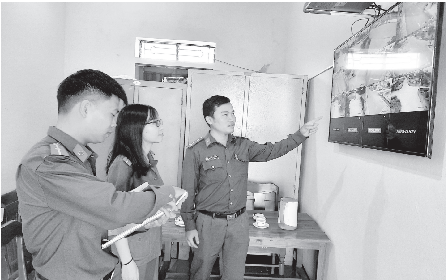
Lực lượng công an chính quy ở Hà Tĩnh đã chủ động vượt khó, giữ vững ANTT trên địa bàn và không ngại bất cứ việc gì, luôn vì dân phục vụ.