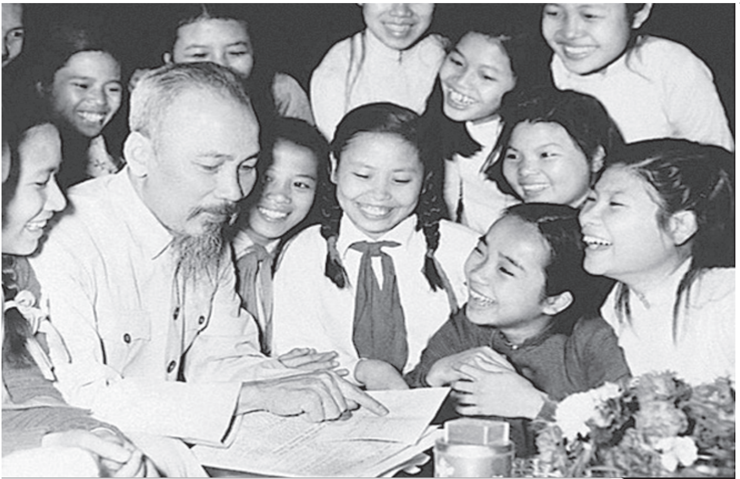
Bác Hồ với các cháu thiếu nhi. Ảnh tư liệu