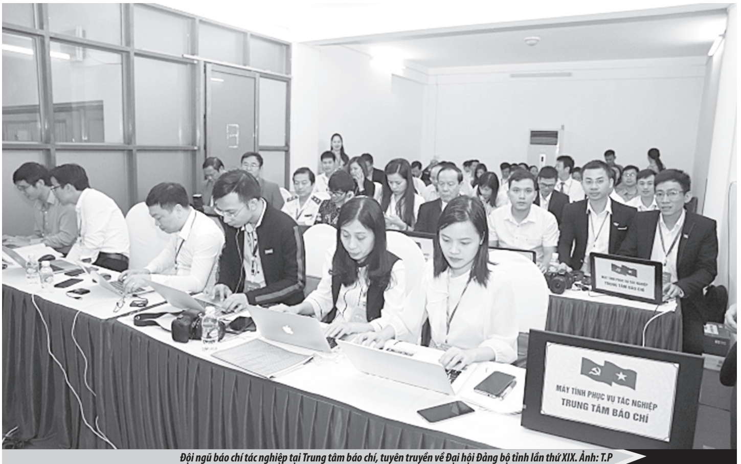
Đội ngũ báo chí tác nghiệp tại Trung tâm báo chí, tuyên truyền về Đại hội Đảng bộ tỉnh lần thứ XIX.