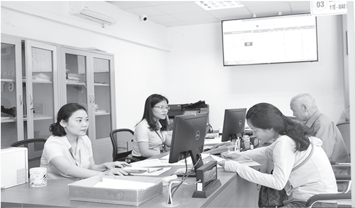
Cán bộ Bảo hiểm Xã hội tỉnh Hà Tĩnh thực hiện các thủ tục tại Trung tâm hành chính công TP Hà Tĩnh.