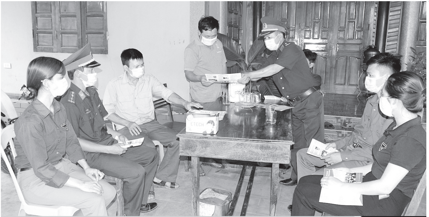
Cán bộ Đồn Biên phòng Cửa khẩu Quốc tế Cầu Treo cùng đoàn viên thanh niên xã Sơn Kim 2, huyện Hương Sơn đến các hộ gia đình trên địa bàn phát tờ rơi tuyên truyền, hướng dẫn người dân phòng, chống dịch Covid-19