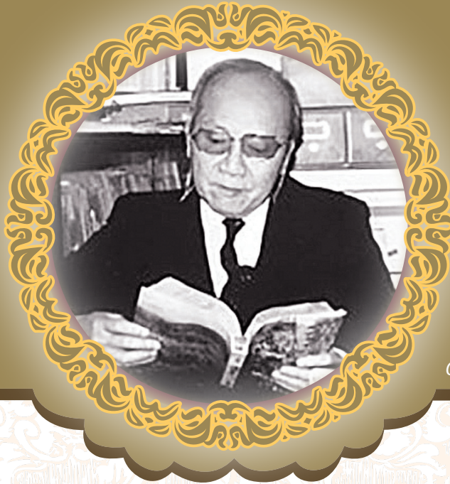
GS Hoàng Xuân Hãn (1908 - 1996)