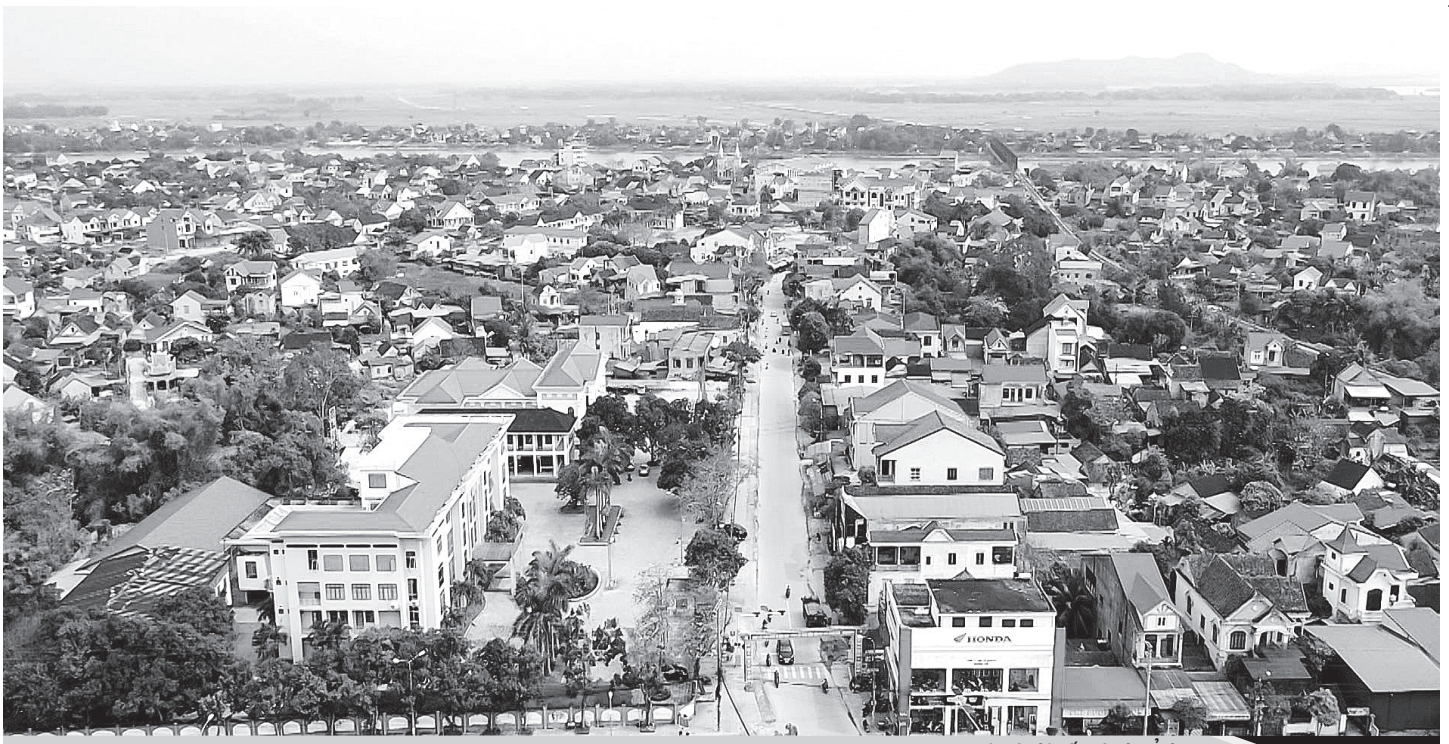
Một góc thị trấn Đức Thọ.