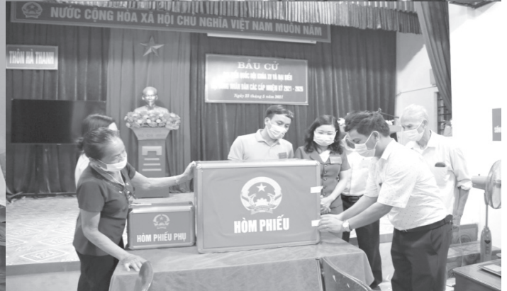
Một số hình ảnh bầu cử đại biểu Quốc hội khóa XV, đại biểu HĐND các cấp nhiệm kỳ 2021 - 2026 tại Hà Tĩnh.