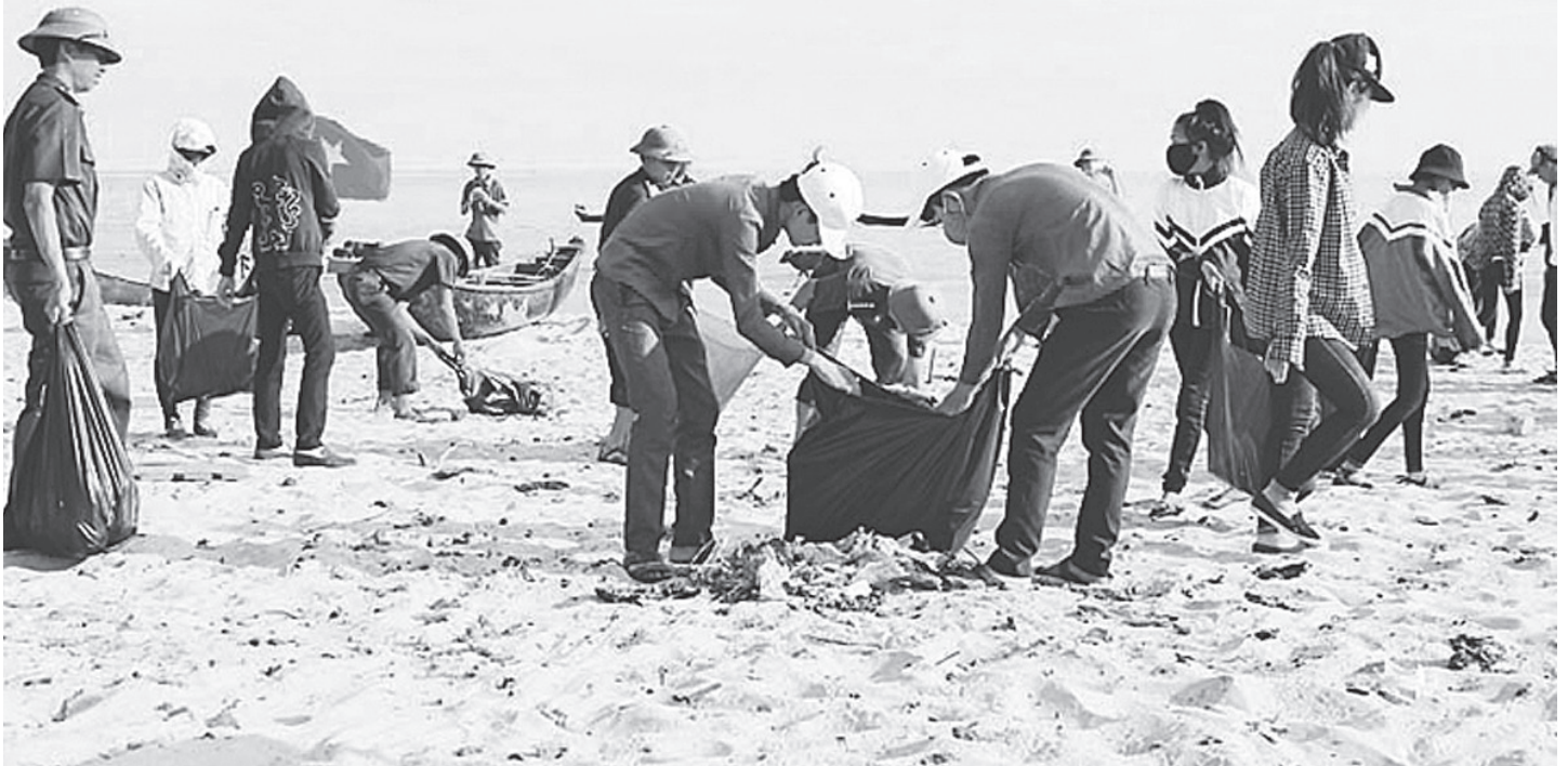
Vệ sinh môi trường bờ biển Thạch Hải, Thạch Hà.