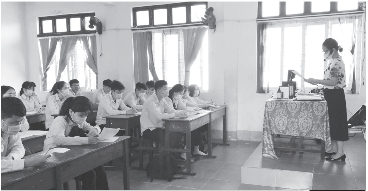
Trường PTTH Phan Đình Phùng tập huấn, quán triệt Quy chế thi Tốt nghiệp THPT năm 2021.