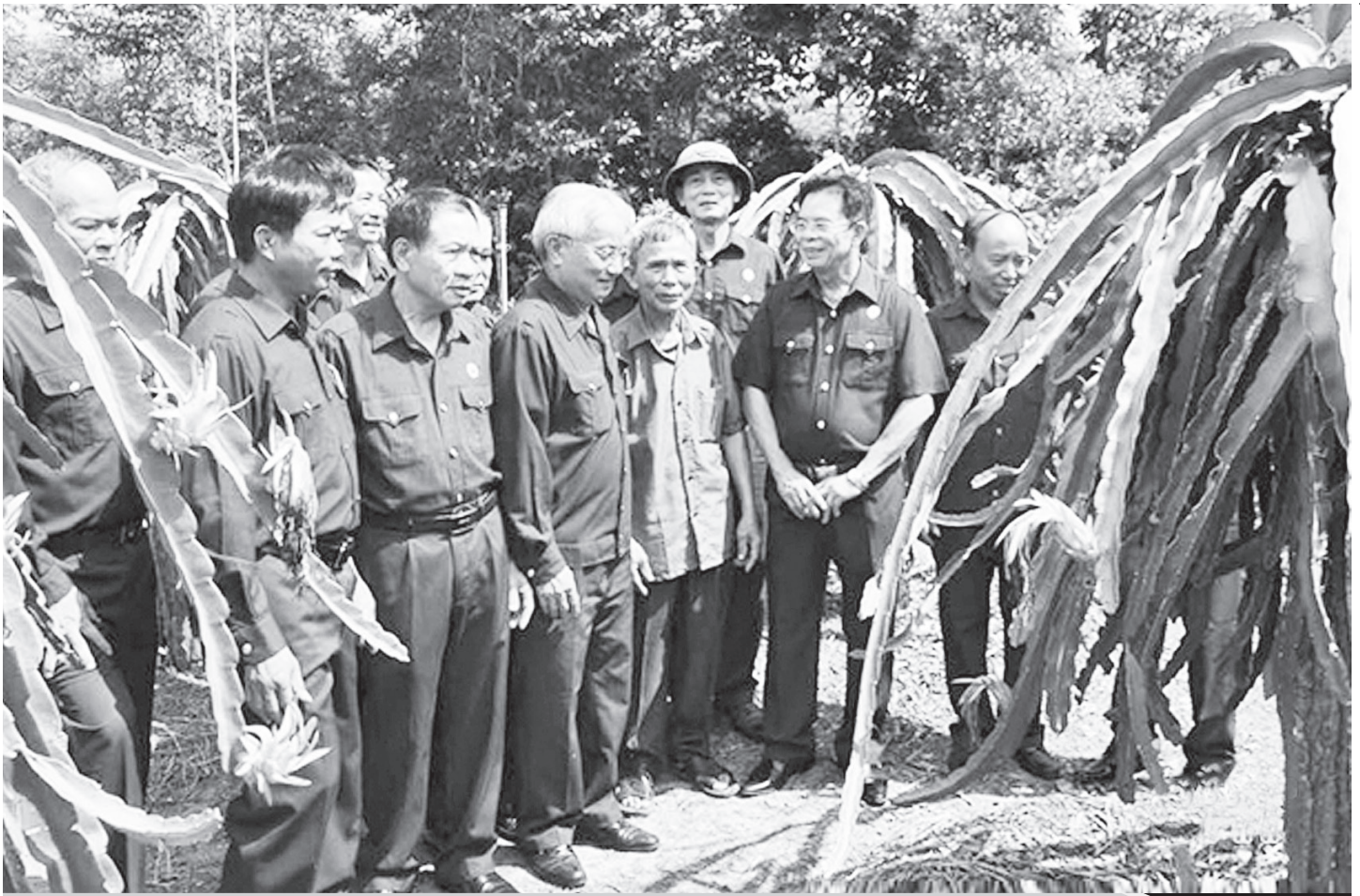
Cựu chiến binh Hà Tĩnh học hỏi kinh nghiệm trong xây dựng vườn mẫu, giúp nhau thoát nghèo.