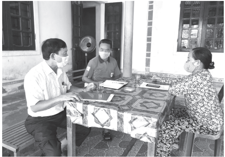
Tổ Covid cộng đồng thôn Đoài Thịnh, xã Thạch Trung, thành phố Hà Tĩnh tuyên truyền vận động nhân dân

Với phương châm "đi từng ngõ, gõ từng nhà, rà từng người" các Tổ Covid cộng đồng trên địa bàn toàn tỉnh có vai trò rất quan trọng trong việc theo dõi, giám sát các đối tượng