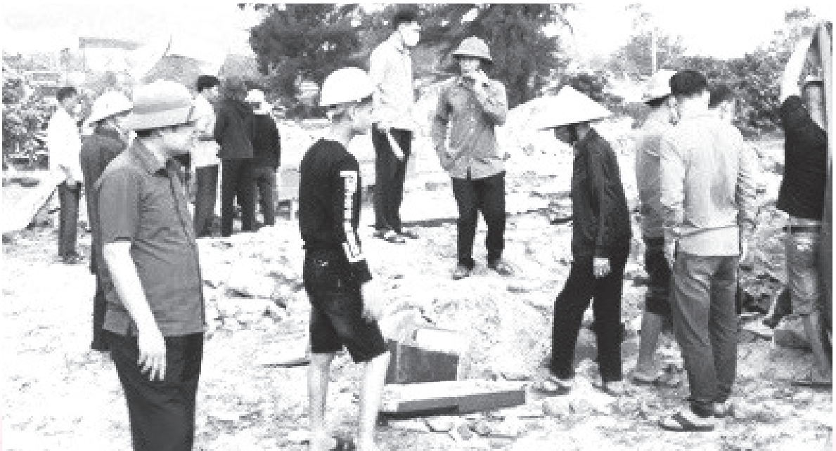
Cán bộ dân vận trực tiếp kiểm tra công tác di dời cát bốc mộ để giải phóng mặt bằng

chuyển tiếp từ năm 2020, 06 dự án triển khai mới, 35 dự án đang tạm dừng thực hiện). Các dự án bị chậm tiến độ chủ yếu là do vướng mắc trong công tác giải phóng mặt bằng và bố trí nguồn vốn, gặp khó khăn trong việc xác định nguồn gốc đất và một