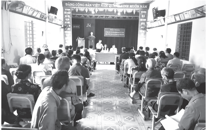
Hội nghị đối thoại trực tiếp giữa người đứng đầu cấp ủy Đảng, chính quyền xã Thạch Văn với nhân dân thôn Tân Văn (tháng 3/2021)

Những năm qua, việc thực hiện Quy chế dân chủ (QCDC) ở cơ sở ngày càng đi vào nền nếp. Dân chủ, thực hành dân chủ được mở rộng và phát huy. Phương châm “Dân biết, dân bàn, dân làm, dân kiểm tra, dân thụ hưởng” được tôn trọng và triển khai thực hiện trên tất cả các lĩnh vực của đời sống xã hội, góp phần củng cố mối quan hệ gắn bó giữa cấp ủy đảng, chính quyền với nhân dân.