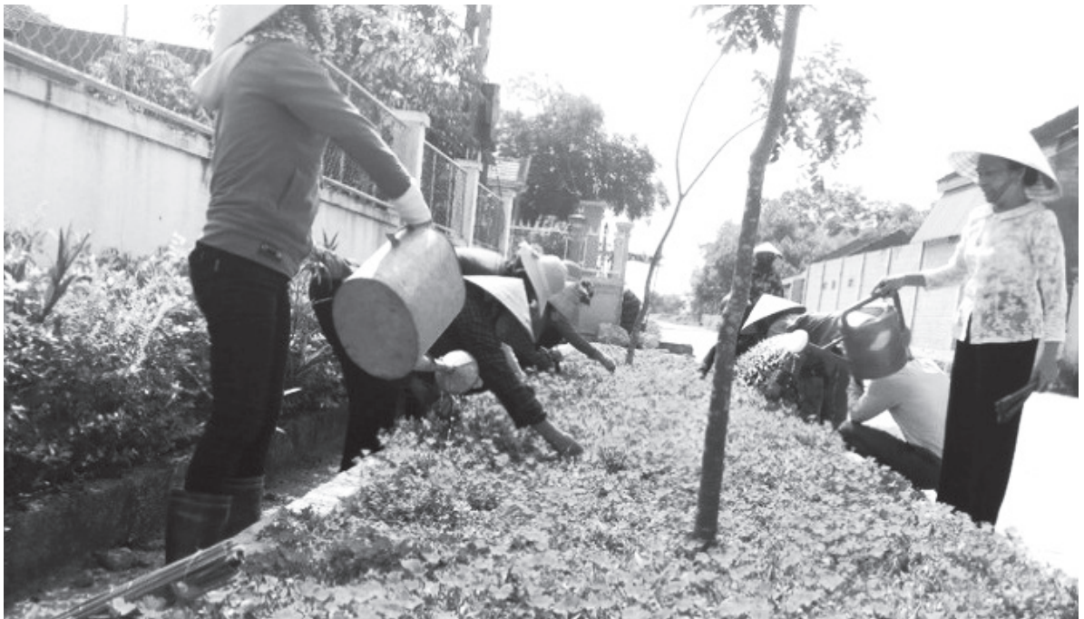
Con đường hoa của giáo xứ Bình Yên được chị em phụ nữ thôn hàng ngày chăm sóc.

Cùng với nhiệm vụ xây dựng Nông thôn mới, Nhân dân trong thôn Bình Yên đã và đang tích cực tham gia tốt mọi nhiệm vụ chính trị của địa phương và các phong trào thi đua, nhất là chấp hành tốt các chủ trương, chính sách của Đảng, pháp luật của Nhà nước, đóng nộp đầy đủ các khoản theo quy định; thi đua lao động sản xuất; hưởng ứng các phong trào văn hóa, văn