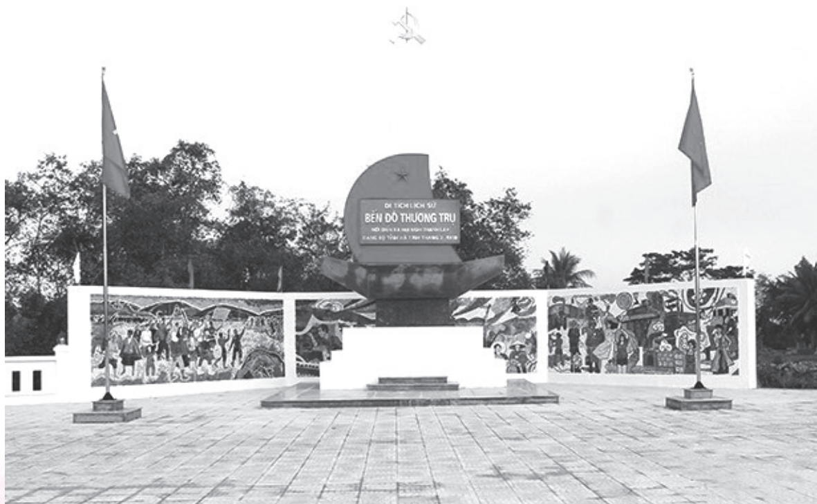
Di tích lịch sử bến đò Thượng trụ ở xã Thiên Lộc, huyện Can Lộc

trang giành chính quyền ở huyện lỵ và các địa phương trong huyện. Từ kết quả giành chính quyền an toàn và mau lẹ ở Can Lộc, cùng với việc nhận được lệnh khởi nghĩa của Việt Minh liên tỉnh (Nghệ An- Hà Tĩnh), ngày 17-8-1945, Ủy ban khởi nghĩa phân khu Nam Hà đã ra lệnh cho Ủy ban khởi nghĩa hai huyện Thạch Hà và Cẩm Xuyên đứng lên giành chính quyền để làm hậu thuẫn cho việc giành chính quyền ở thị xã Hà Tĩnh. Quần chúng cách mạng từ các xã ở huyện Cẩm Xuyên đã rầm rập kéo về bao