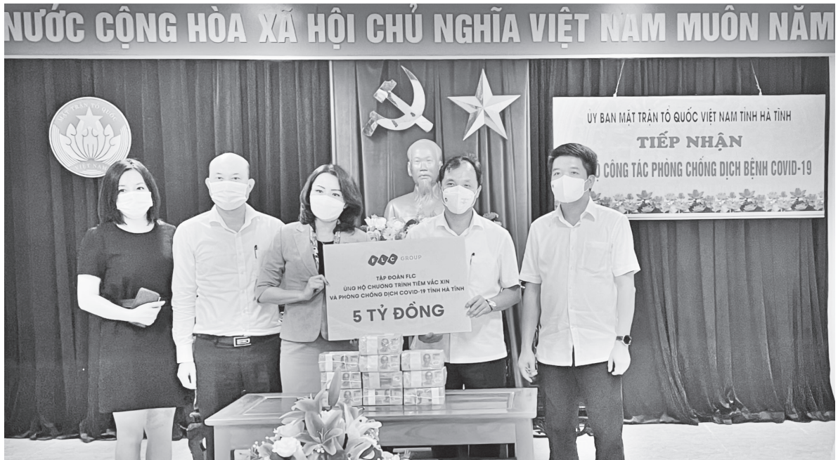
Bí thư Tỉnh uỷ và chủ tịch Ủy ban MTTQ Việt Nam tỉnh tiếp nhận tiền ủng hộ phòng chống Covid - 19

Trước diễn biến hết sức phức tạp của dịch Covid -19 xảy ra trên địa bàn tỉnh, Mặt trận Tổ quốc cùng với các tổ chức chính trị - xã hội các cấp đã phát huy vai trò, đoàn kết và triển khai nhiều hoạt động thiết thực tạo hiệu ứng lan toả rộng lớn trong các tầng lớp nhân dân, góp phần chung tay đẩy lùi dịch Covid-19.