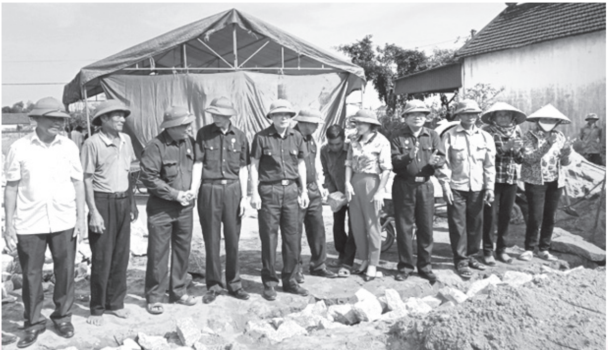
Hội Cựu chiến binh tỉnh khởi công xây dựng “ngôi nhà đồng đội” cho Hội viên tại xã Thịnh Lộc, huyện Lộc Hà (tháng 4/2021)

Bí thư chi bộ, trưởng thôn; hơn 4.700 đồng chí tham gia vào cấp ủy cơ sở. Trong đợt bầu cử Hội đồng nhân dân các cấp nhiệm kỳ 2021 - 2026, toàn tỉnh có 1.276 đồng chí là cán bộ, hội cựu chiến binh trúng cử, trong đó có 4 đại biểu cấp tỉnh, 44 đại biểu cấp huyện và 1128 đại biểu cấp xã, phường, thị trấn. Đây được xác định là lực lượng có vai trò quan trọng trong hệ thống chính trị, xung kích trên lĩnh vực chính trị, tư tưởng. Để làm tốt nội dung này, Hội CCB tỉnh Hà Tĩnh đã không ngừng