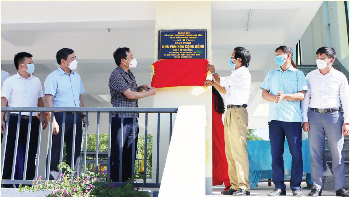
Đ/c Hoàng Trung Dũng, UV BCH TƯ Đảng, Bí thư Tỉnh ủy cùng đại diện chính quyền địa phương gắn biển công trình nhà văn hóa cộng đồng kết hợp tránh bão, lũ tại thôn Trung Nam, xã Cẩm Thành, huyện Cẩm Xuyên

Trải qua các chặng đường cách mạng, Đảng ta đã vận dụng sáng tạo, có hiệu quả bài học “Lấy dân làm gốc”. Trước đòi hỏi của thực tiễn ở từng giai đoạn lịch sử, Đảng bộ Hà Tĩnh đã không ngừng đổi mới nội dung, phương thức vận động nhân dân đoàn kết, cùng nhân dân cả nước lập nên những chiến công vang dội, bảo vệ thành công mục tiêu độc lập dân tộc, xây chủ nghĩa xã hội, đặc biệt là củng cố và tăng cường mối quan hệ máu thịt giữa Đảng, Nhà nước với Nhân dân.