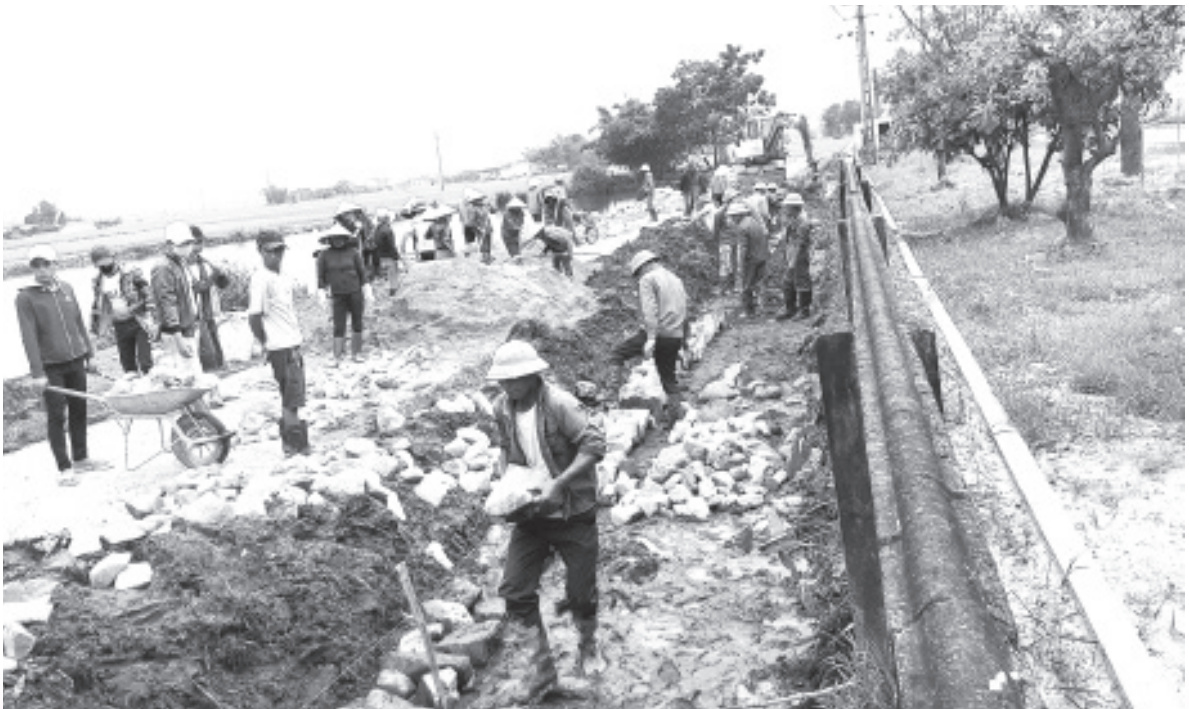
Nhân dân thôn Tiến Thành, xã Kỳ Khang xây dựng rãnh thoát nước khu dân cư nông thôn mới kiểu mẫu

công tác chỉ đạo cơ sở, cụ thể hóa các chủ trương, nghị quyết về công tác dân vận sát với thực tiễn, đáp ứng tâm tư, nguyện vọng chính đáng của Nhân dân. Phương châm “Dân biết, dân bàn, dân làm, dân kiểm tra, dân hưởng thụ” được thực hiện sâu rộng. Trong đó nổi bật là hoạt động của Đoàn công tác xây dựng nông thôn mới khối dân