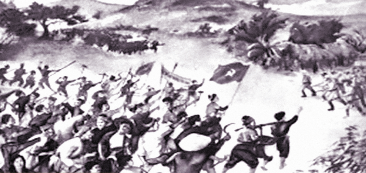
Cao trào Xô Viết Nghệ - Tĩnh năm 1930 - 1931.