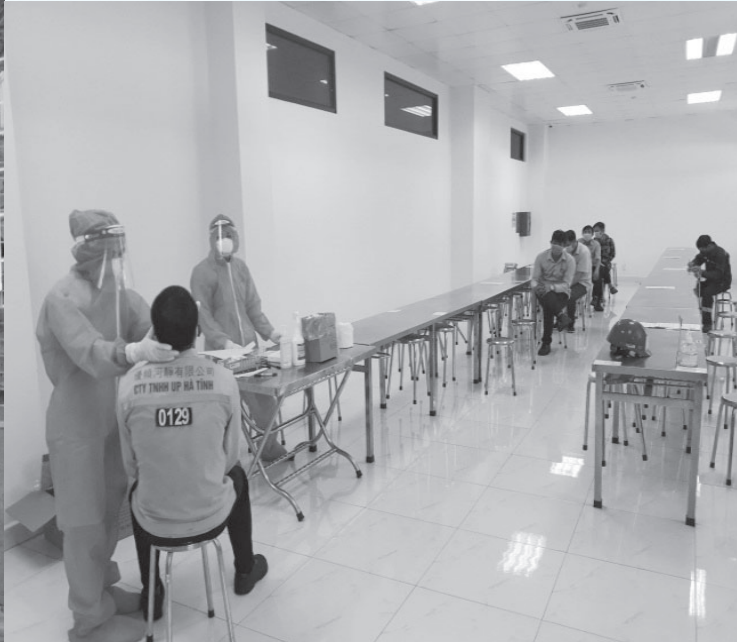
Thực hiện mục tiêu kép vừa chống dịch, vừa phát triển sản xuất tại KKT Vũng Áng.