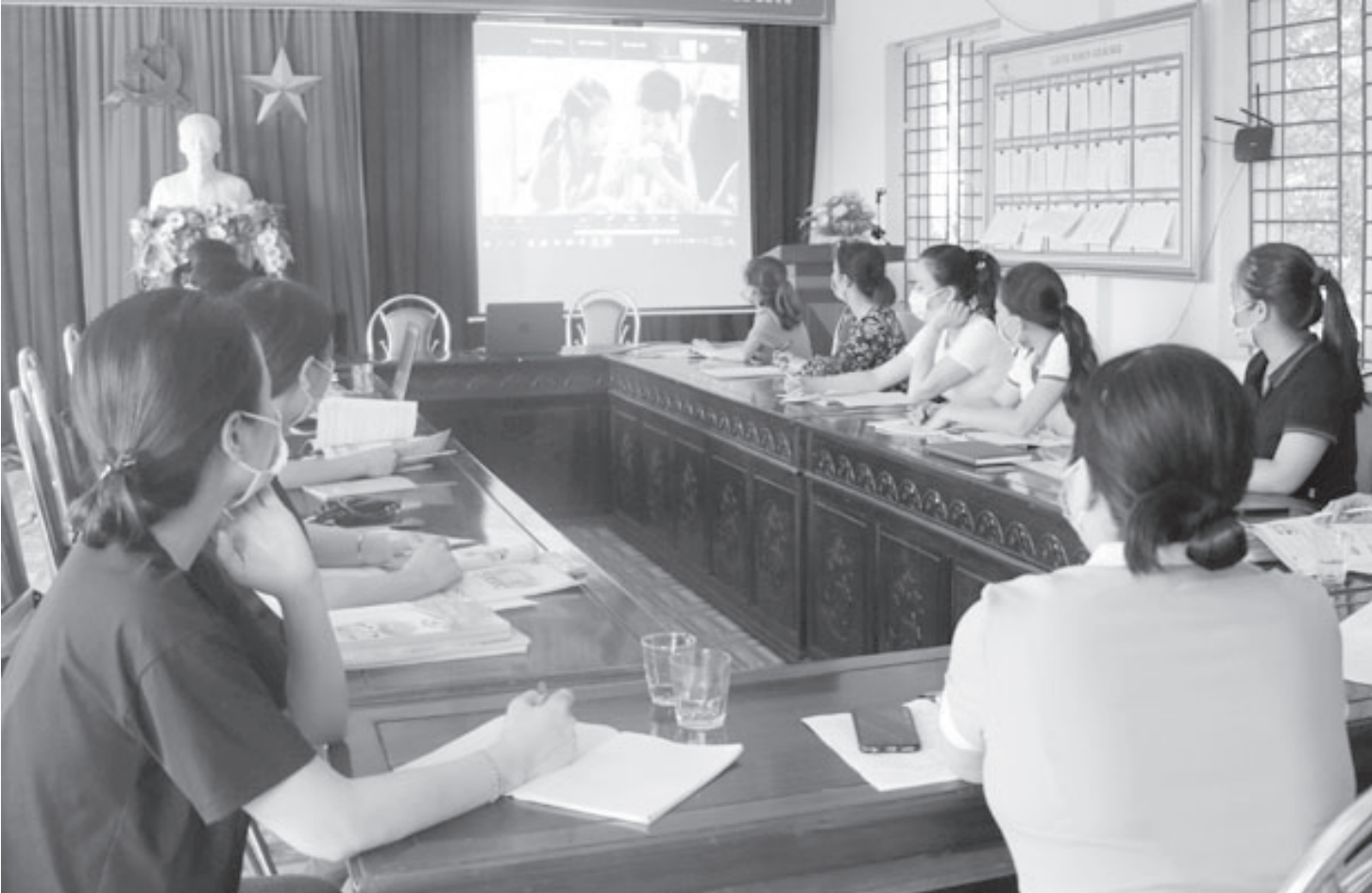
Giáo viên Trường Tiểu học Ngô Đức Kế (Can Lộc) tập huấn sách giáo khoa Cánh diều.