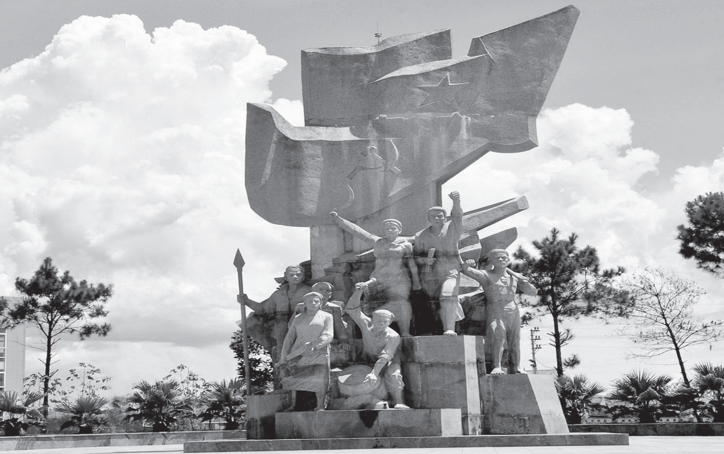
Tượng đài Xô viết - Nghệ Tĩnh (thị trấn Nghèn, Can Lộc)