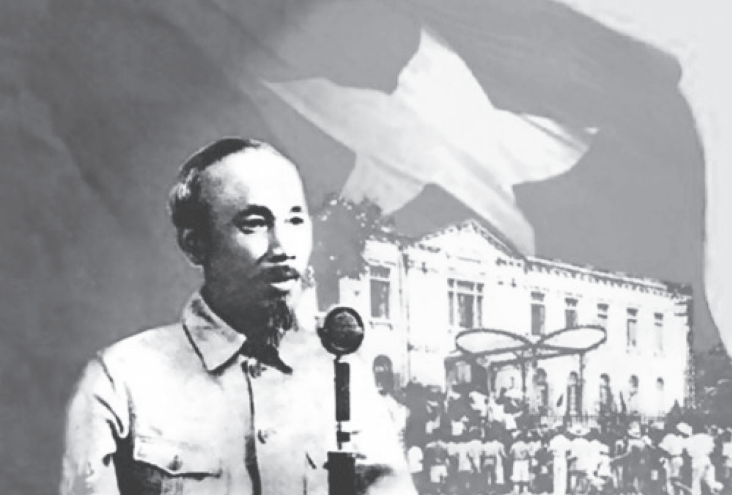
Chủ tịch Hồ Chí Minh đọc bản tuyên ngôn độc lập.