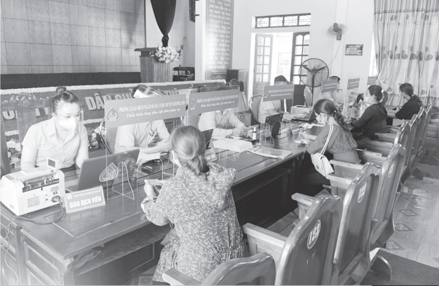
Trước diễn biến phức tạp của dịch Covid-19, NHCSXH Hà Tĩnh vẫn đảm bảo chuyển tài nguồn vốn đầy đủ, kịp thời đáp ứng nhu cầu sản xuất, kinh doanh của hộ nghèo và các đối tượng chính sách khác