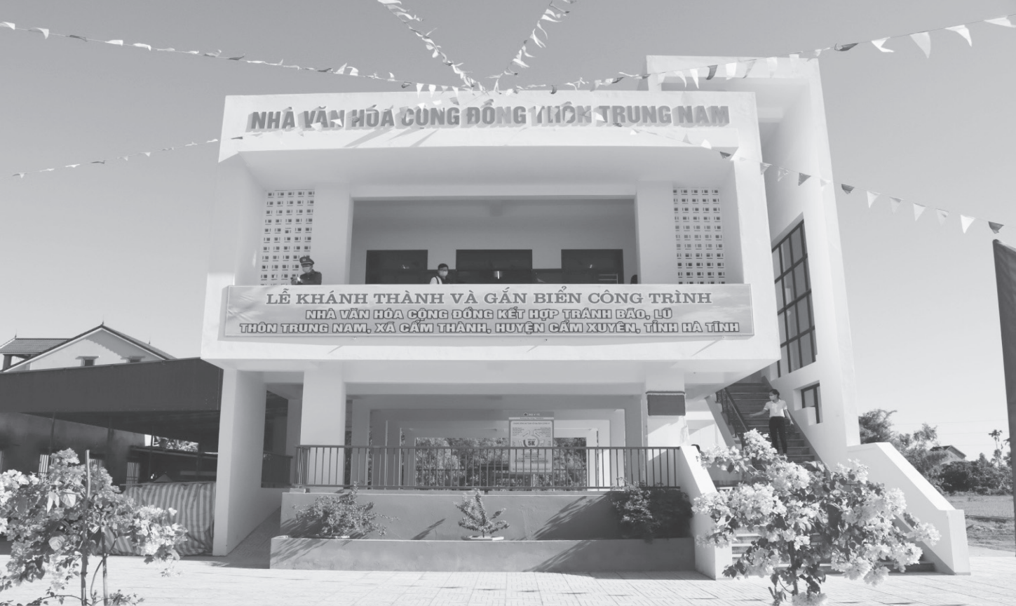
Một góc Khu dân cư NTM kiểu mẫu thôn Nam Trà, xã Hương Trà, huyện Hương Khê.