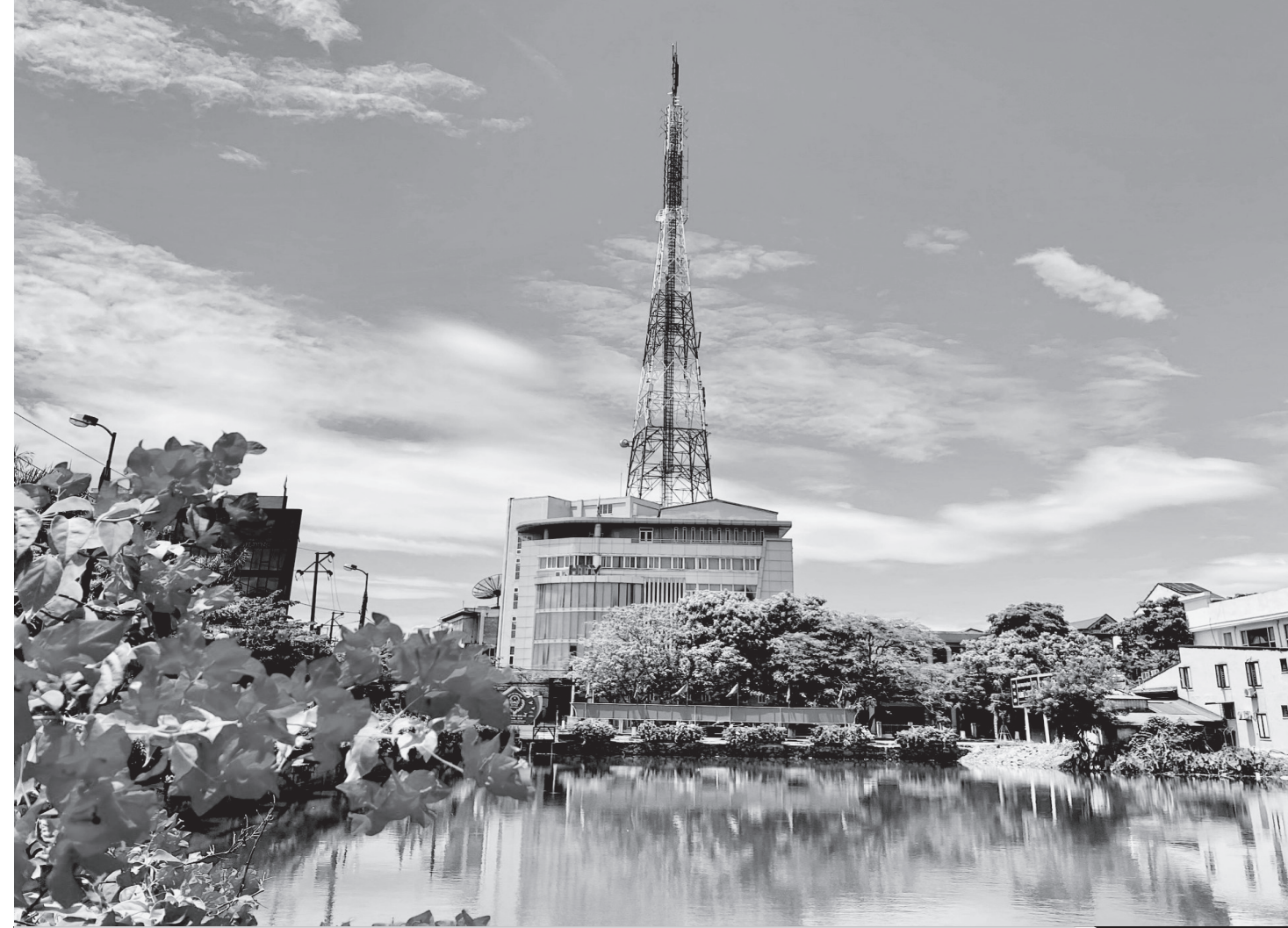
Toàn cảnh Đài Phát thanh và Truyền hình Hà Tĩnh.