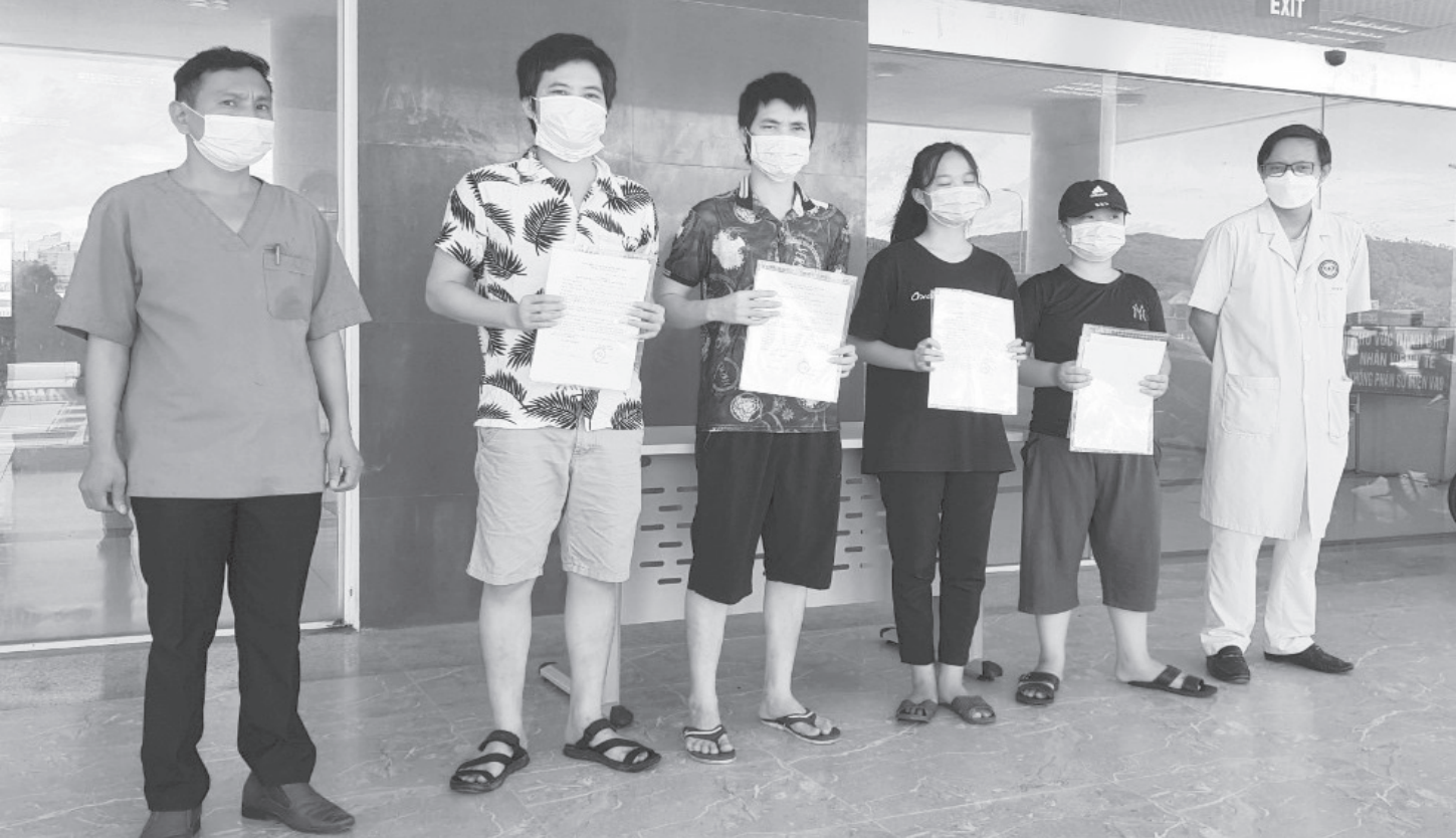
Bác sĩ Bệnh viện Đa khoa khu vực Cửa khẩu quốc tế Cầu Treo trao giấy chứng nhận xuất viện cho bệnh nhân