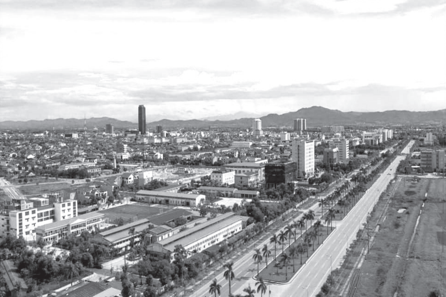
Thành phố Hà Tĩnh một sáng mùa Thu.