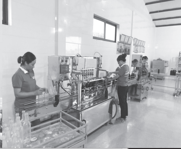
HTX Phú Khương, huyện Kỳ Anh áp dụng hệ thống đóng chai nước mắm tự động