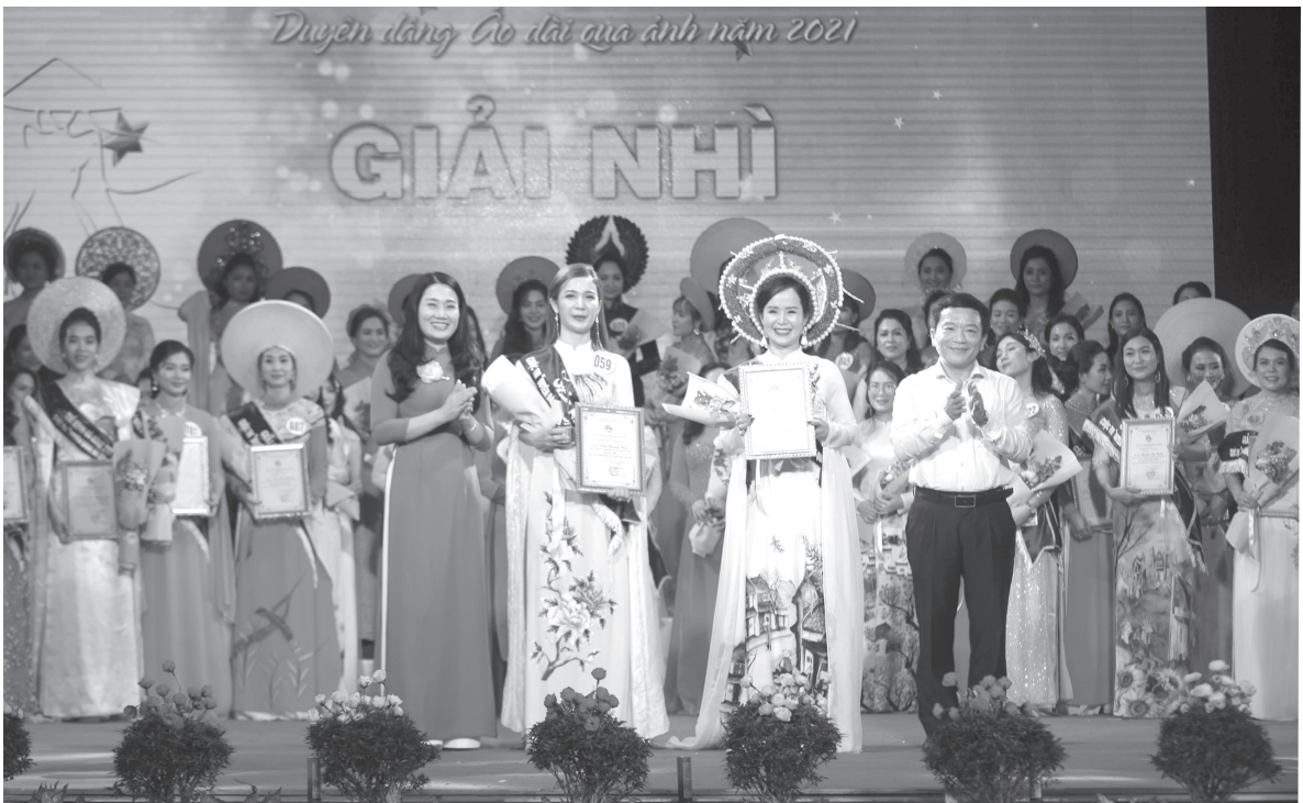
Phụ nữ Hà Tĩnh tự tin, tỏa sáng tại cuộc thi duyệt dáng áo dài qua ảnh năm 2021 do Hội LHPN tỉnh Hà Tĩnh tổ chức

Trong quá trình hình thành và phát triển của tỉnh nhà, phụ nữ Hà Tĩnh luôn có những cống hiến, đóng góp hết sức quan trọng. Chiếm trên 50% về dân số và lao động, phụ nữ có mặt trong mọi lĩnh vực, trên mọi địa bàn, chủ động tham gia các hoạt động của đời sống xã hội, thực hiện tốt chủ trương, đường lối của Đảng, chính sách, pháp luật của Nhà nước, của tỉnh; tích cực hưởng ứng các phong trào thi đua yêu nước, nỗ lực, bền bỉ góp phần vào sự phát triển của tỉnh nhà.