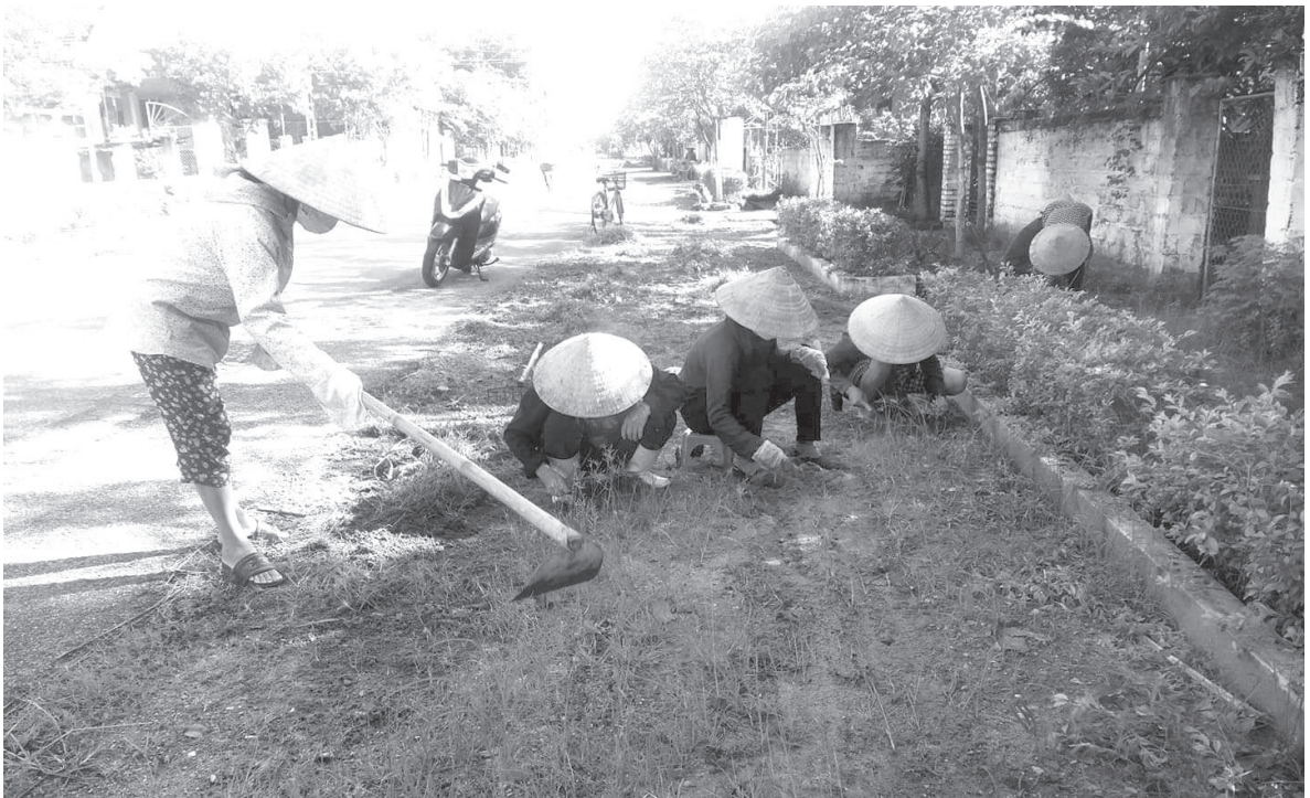
Hội viên phụ nữ xã Thạch Thắng trồng và chăm sóc tuyến đường hoa