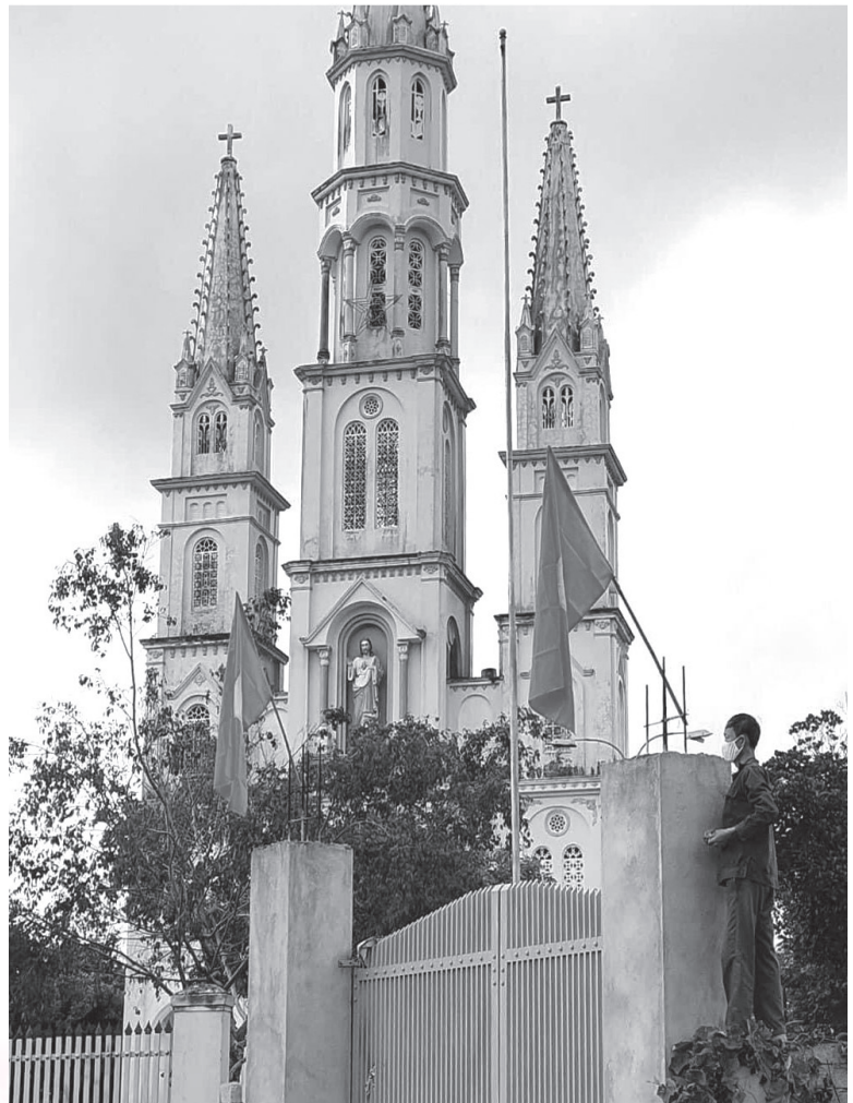
Các cơ sở tôn giáo treo cờ Tổ quốc nhân ngày dịp Quốc khánh 2-9

Hà Tĩnh có 575/1.925 khu dân cư, 131/216 xã, phường, thị trấn có đồng bào có đạo sinh sống, trong đó 71 thôn giáo toàn tòng. Trong những năm qua, các cơ quan trong hệ thống chính trị ở các cấp đã luôn quan tâm, tạo điều kiện thuận lợi các tổ chức tôn giáo hoạt động; kịp thời nắm bắt, giải quyết các kiến nghị, đề xuất, nguyện vọng chính đáng của các tổ chức tôn giáo. Đồng bào các tôn giáo đồng hành tham gia tích cực, hiệu quả nội dung các phong trào thi đua yêu nước, xây dựng nông thôn mới, đô thị văn minh, góp phần thực hiện các nhiệm vụ phát triển kinh tế - xã hội của địa phương. Nhiều vùng giáo là điển hình trong phong trào phát triển sản xuất, chuyển đổi cơ cấu mùa vụ, cây trồng vật nuôi,