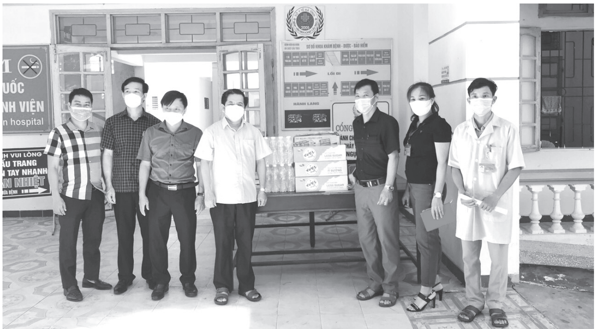
Ban Chỉ đạo phòng chống dịch Covid - 19 huyện Hương Sơn kiểm tra công tác điều trị bệnh nhân Covid và động viên, tặng quà cho đội ngũ y tế tại Bệnh viện Cầu Treo

Thực hiện nhiệm vụ 9 tháng đầu năm 2021 trong bối cảnh gặp nhiều khó khăn, thách thức, đặc biệt là tình hình thời tiết, dịch Covid-19 diễn biến phức tạp, tác động tiêu cực đến việc thực hiện các nhiệm vụ chính trị và mọi mặt đời sống xã hội. Nhờ phát huy tốt Phong trào thi đua “Dân vận khéo” nên huyện Hương Sơn đã huy động được sức mạnh tổng hợp của cả hệ thống chính trị và người dân cùng vào cuộc, triển khai thực hiện thành công mục tiêu kép: vừa thực hiện tốt việc phát triển kinh tế - xã hội, đảm bảo quốc phòng - an ninh, vừa phòng chống dịch Covid-19 hiệu quả; đạt được nhiều kết quả khá toàn diện trên các lĩnh vực.