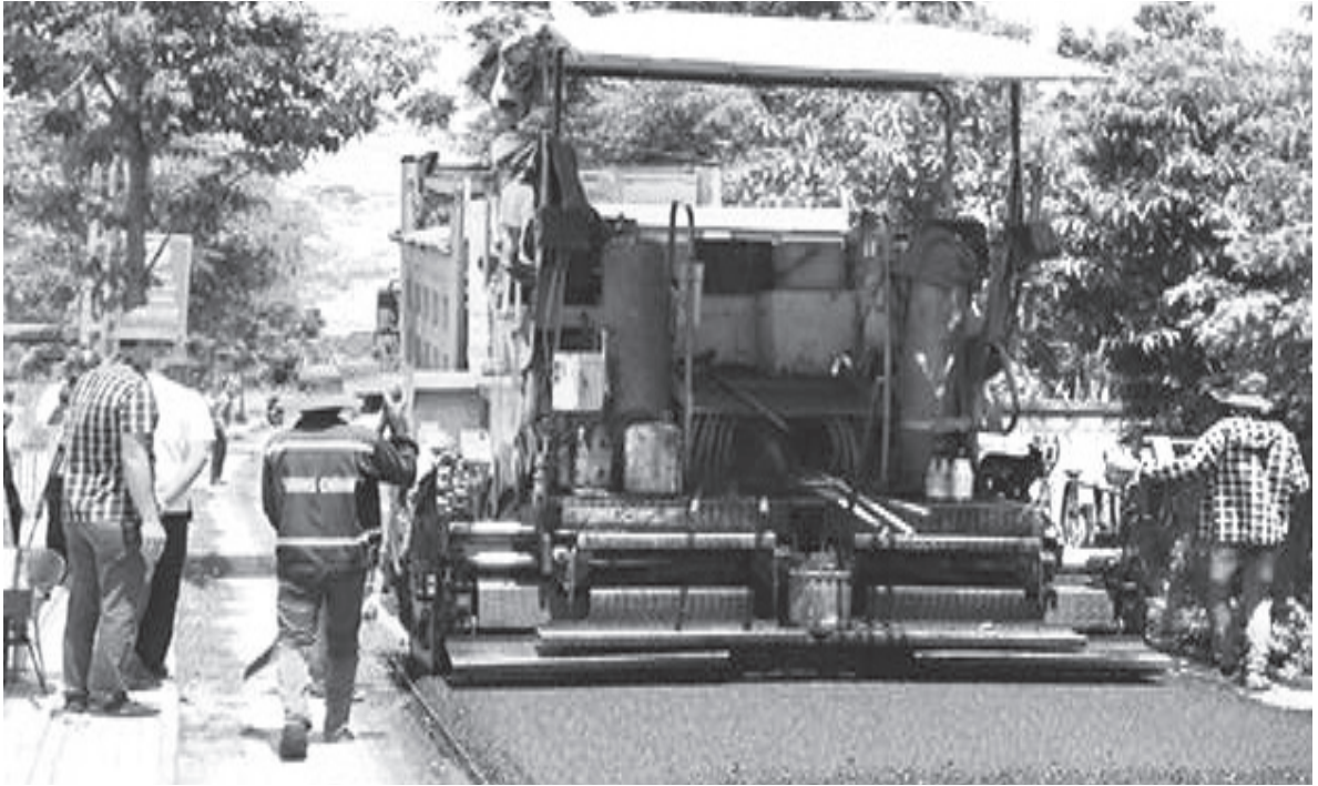
Nhân dân xã Xuân Phổ đóng góp kinh phí xây dựng đường trục thôn bằng thảm nhựa