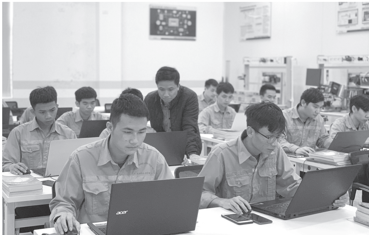
Tiết học của lớp đào tạo chất lượng cao theo tiêu chuẩn Quốc tế tại trường Cao đẳng Công nghệ Hà Tĩnh