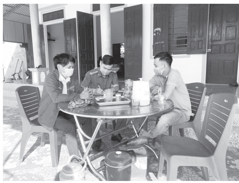
Tổ COVID cộng đồng đến tận nhà người dân để tuyên truyền, ký cam kết hoãn đám cưới trong mùa dịch

thực hiện việc phòng chống dịch; thực hiện nghiêm túc quy định 5K của Bộ Y tế, nắm tình hình các công dân đi từ vùng dịch về trên địa bàn; giám sát công dân khai báo y tế và cách ly y tế tại nhà; phát giác, tố giác các trường hợp vi phạm trong phòng chống dịch; các hoạt động được báo cáo về cho