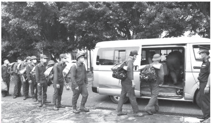
Lực lượng dân quân tự vệ sẵn sàng lên đường làm nhiệm vụ

quản ngại khó khăn, ngày đêm túc trực bám chốt, bám địa bàn giữ gìn an ninh trật tự, phòng chống các tội phạm, ngăn chặn, kiểm soát xuất nhập cảnh trái phép,... tạo thành lá chắn vững chắc, bảo vệ an toàn tuyến biên giới trên địa bàn. Lực lượng Dân quân tự vệ đã phối hợp các ban ngành, đoàn thể tham gia phòng chống dịch bệnh COVID-19 trên địa bàn, nhất là tuần tra kiểm soát tình hình trên tuyến biên giới và nội địa; phân công trực tại các chốt kiểm soát biên giới và các tuyến đường giáp ranh với các địa phương, nhằm ngăn chặn kịp thời những trường hợp vượt biên trái phép và những trường hợp từ vùng dịch vào địa bàn; bên cạnh, phối hợp cùng lực lượng Công an tổ chức các cuộc tuần tra giữ gìn an ninh trật tự địa bàn, đã kịp thời xử