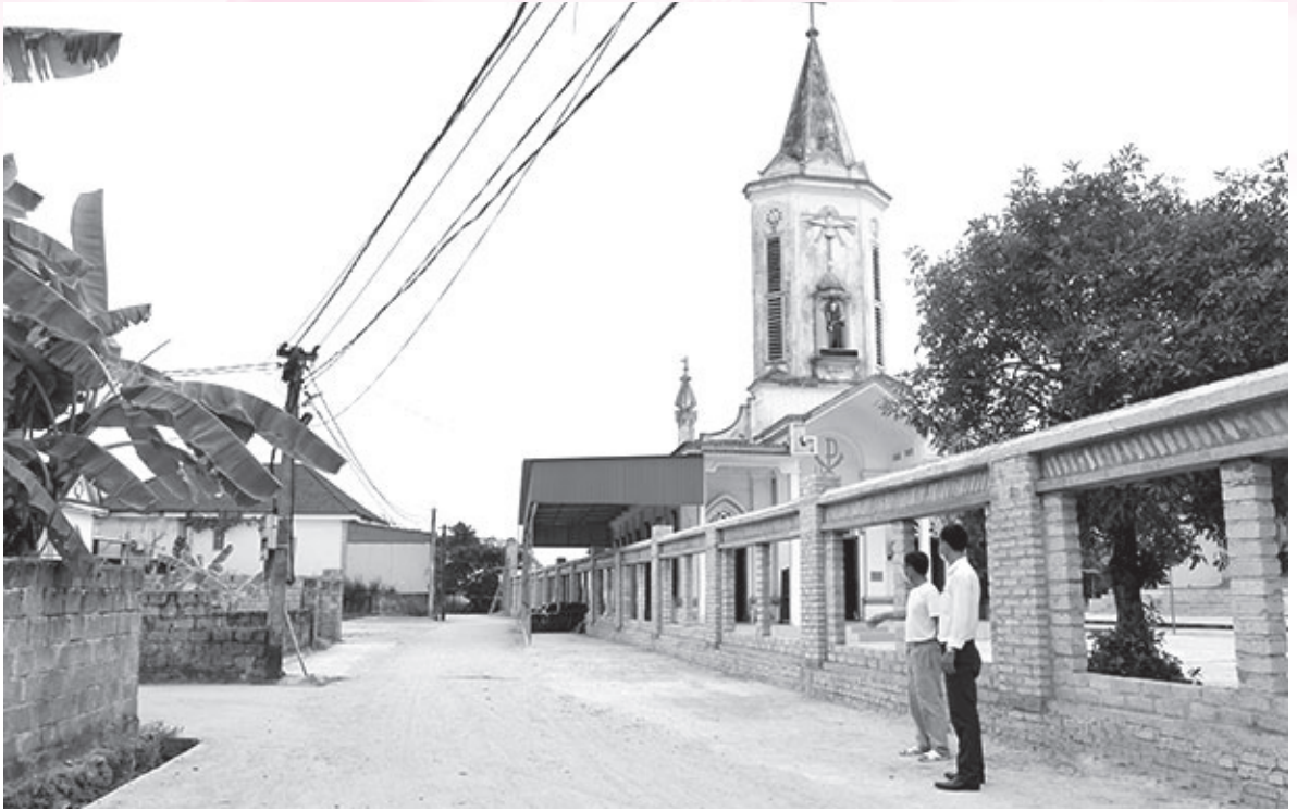
Giáo họ Vạn Thọ thuộc giáo xứ Kim Lâm tự nguyện hiến hơn 400m 2 đất thuộc khuôn viên giáo họ để mở rộng đường của thôn