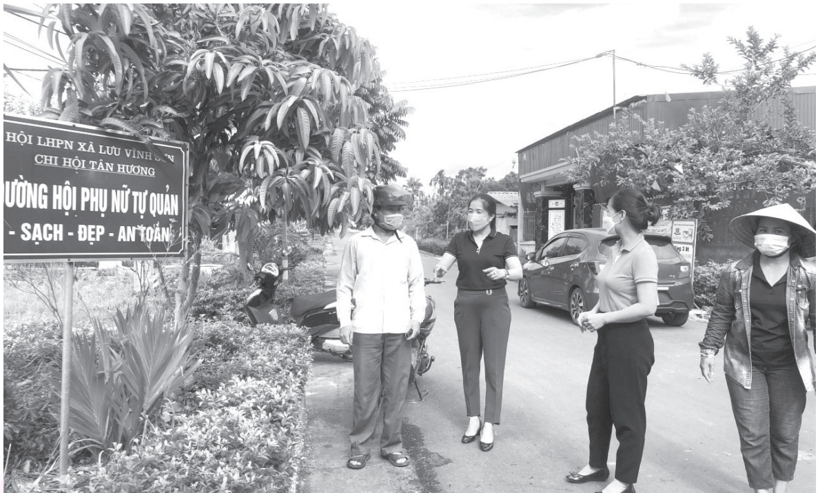
Hội viên Hội phụ nữ Tân Lâm Hương (Thạch Hà) kiểm tra tuyến đường xanh, sạch, đẹp an toàn

hợp tổ chức tập huấn phổ biến về các chủ trương, đường lối, chính sách, pháp luật của Đảng và Nhà nước về công tác bảo vệ môi trường, thực trạng ô nhiễm môi trường, kiến thức về bảo vệ môi trường phục vụ phát triển bền vững và xây dựng nông thôn