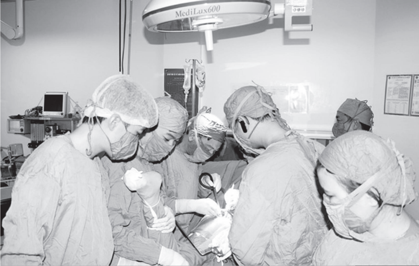
Bệnh viện Đa khoa tỉnh tỉnh làm chủ kỹ thuật phẫu thuật khớp gối.