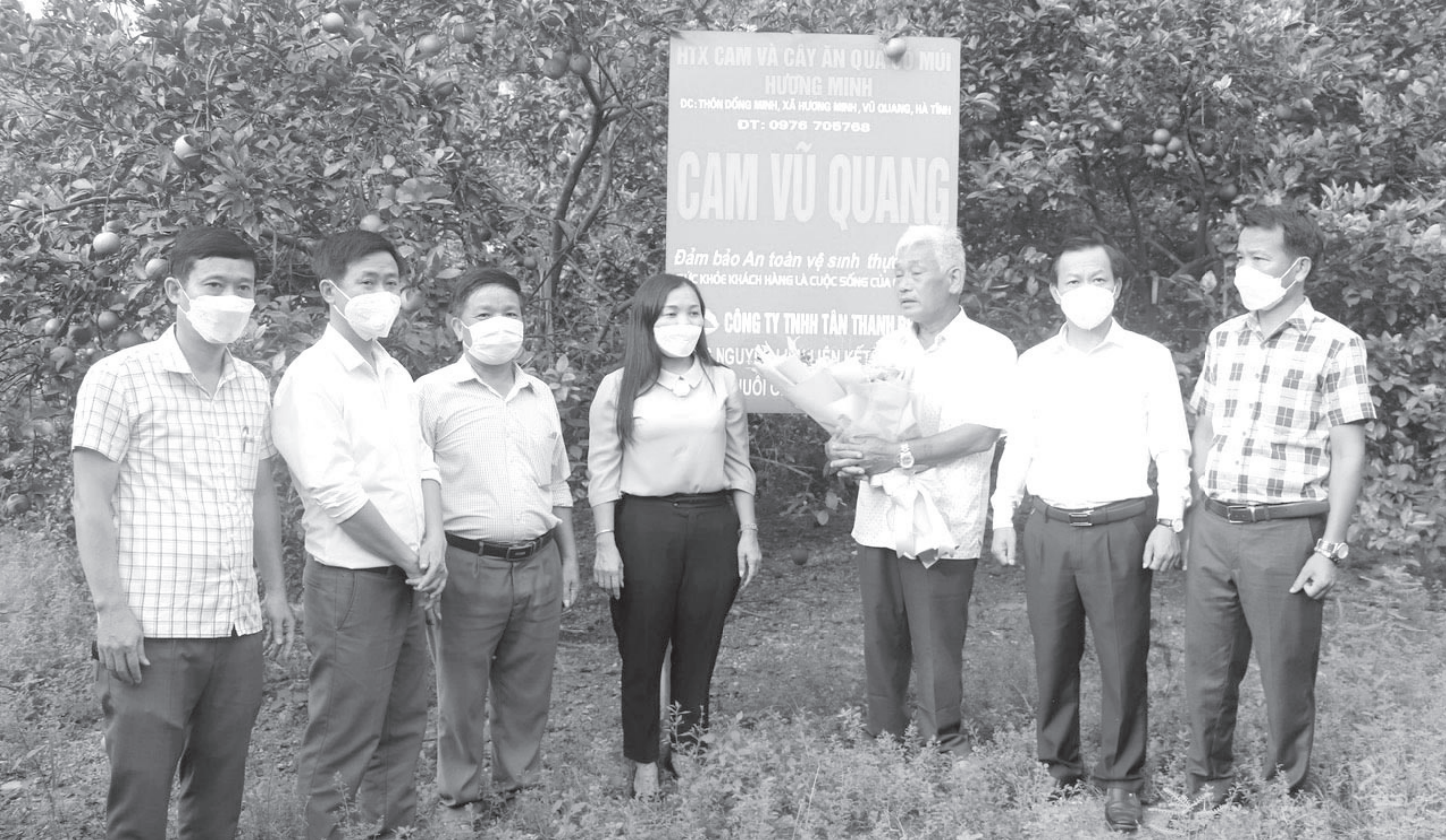
Lãnh đạo huyện Vũ Quang đến thăm Hợp tác xã cam và ăn quả có mùi Hương Minh.