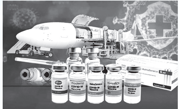
Những hoạt động của Hội Chữ thập đỏ góp phần phòng, chống dịch Covid-19.

Hiện nay trong đợt dịch lần thứ tư, công tác Ngoại giao vaccine càng được triển khai quyết liệt; các hoạt động đối ngoại cấp cao qua kênh đối ngoại Đảng, ngoại giao Nhà nước và đối ngoại Nhân dân, đã được triển khai hết sức thận