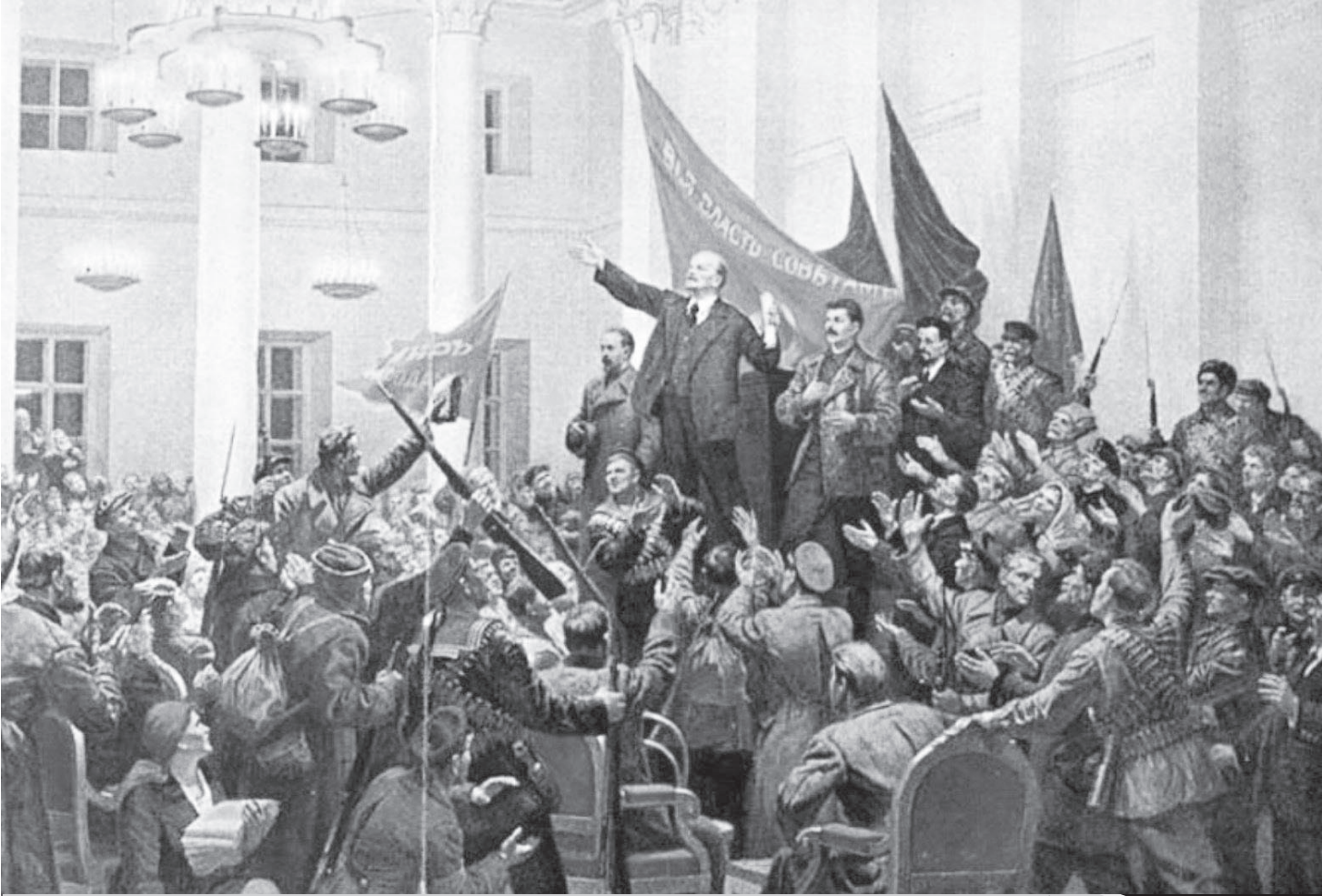
Ảnh tư liệu