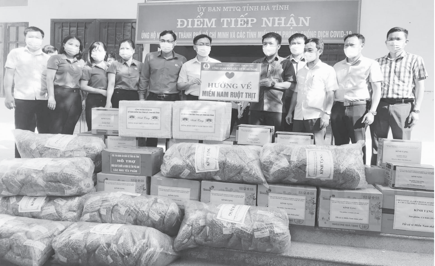
Phó Bí thư Thường trực Tỉnh ủy Trần Thế Dũng và Chủ tịch Ủy ban MTTQ tỉnh Trần Nhật Tân tiếp nhận hàng hóa, nhu yếu phẩm Nhân dân Hà Tĩnh ủng hộ các tỉnh phía Nam.