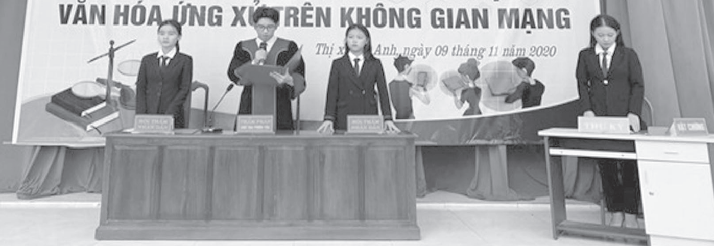
Giờ ngoại khóa tuyên truyền, phổ biến pháp luật về văn hóa ứng xử.

Thị xã Kỳ Anh, ngày 09 tháng 11 năm 2020