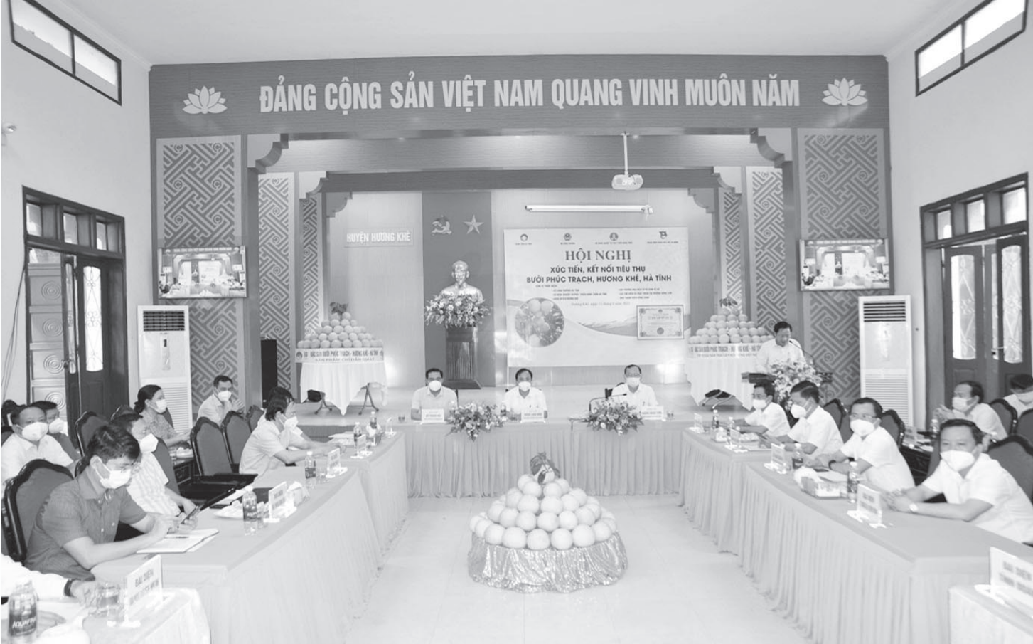
Hội nghị xúc tiến, kết nối tiêu thụ bưởi Phúc Trạch, Hương Khê