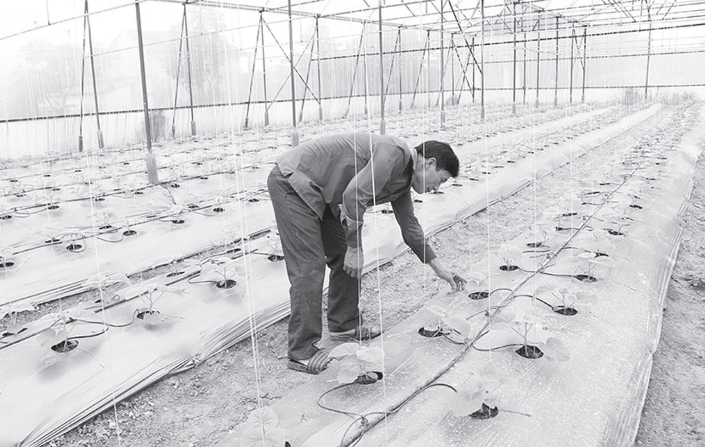
Nhiều mô hình trồng dưa trong nhà màng tại nhiều địa phương ở Hà Tĩnh đã ứng dụng công nghệ tưới nhỏ giọt, điều khiển bằng smartphone.