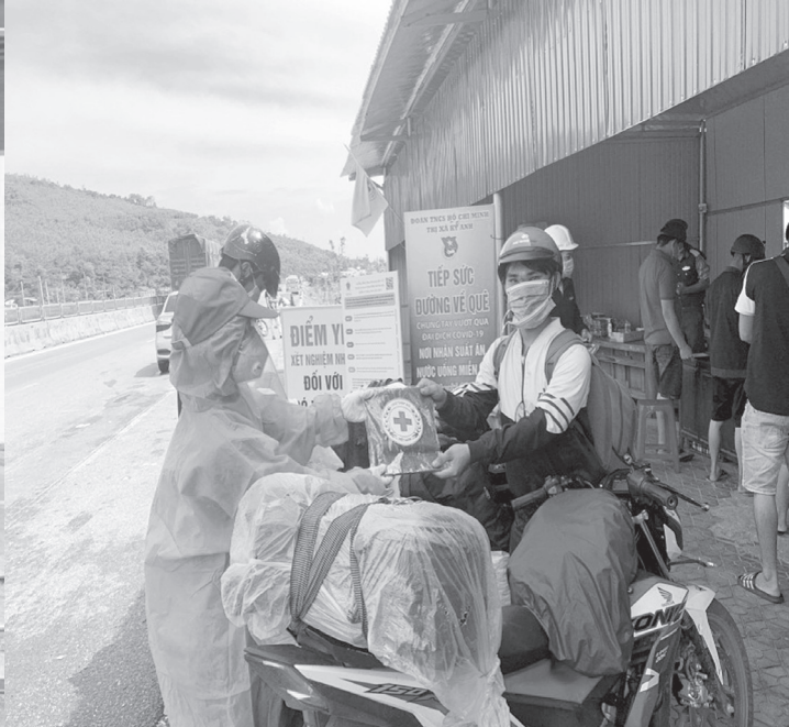
Những hoạt động của Hội Chữ thập đỏ góp phần phòng, chống dịch Covid-19.