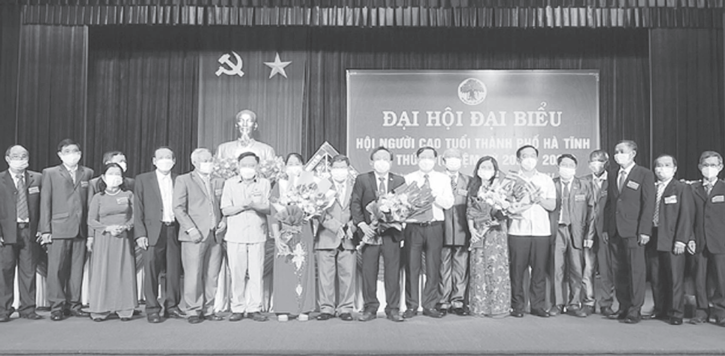
Hội NCT tỉnh và lãnh đạo thành phố tặng hoa chúc mừng Ban Chấp hành Hội NCT thành phố Hà Tĩnh nhiệm 2021 - 2026