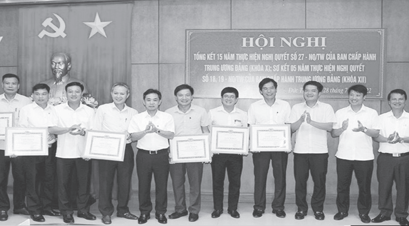
Lãnh đạo tỉnh, Lãnh đạo huyện Đức Thọ khen thưởng các đơn vị có thành tích xuất sắc trong thực hiện Nghị quyết số 18, 19 của BCH Trung ương Đảng khóa XII