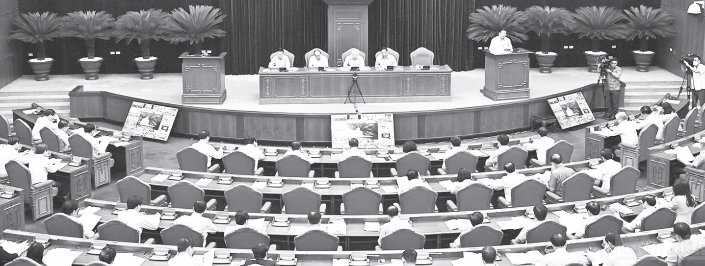
Hội nghị toàn quốc tổng kết 10 năm công tác phòng, chống tham nhũng, tiêu cực.