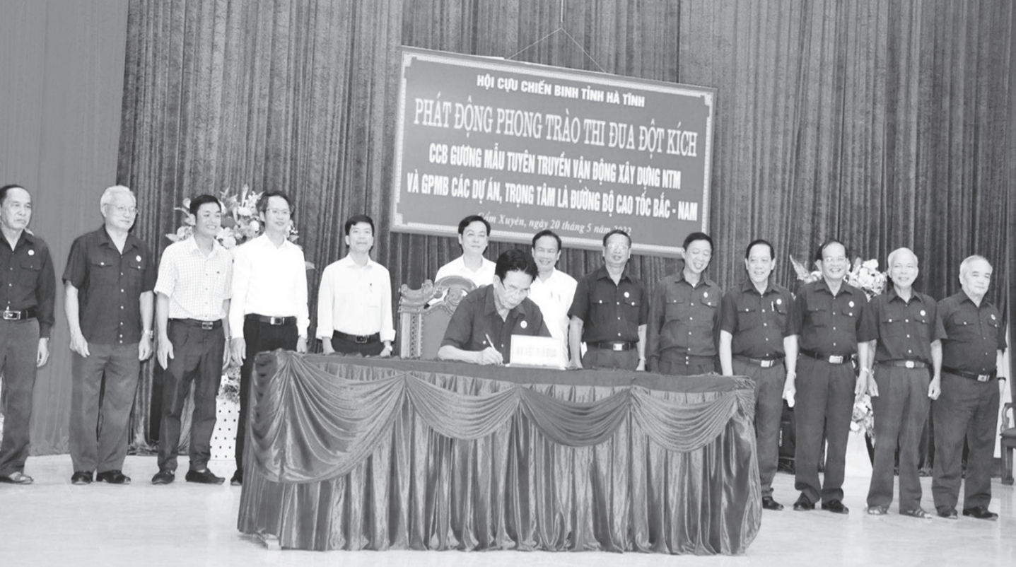
Lễ Phát động phong trào thi đua đột kích CCB gương mẫu tuyên truyền vận động xây dựng NTM và GPMB các dự án, trọng tâm là Dự án đường bộ cao tốc Bắc - Nam đoạn qua Hà Tĩnh.