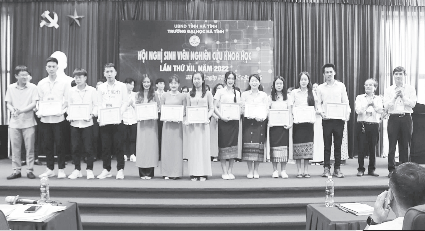
Nhóm lưu học sinh Lào đạt giải trong Hội nghị sinh viên nghiên cứu khoa học cấp trường.