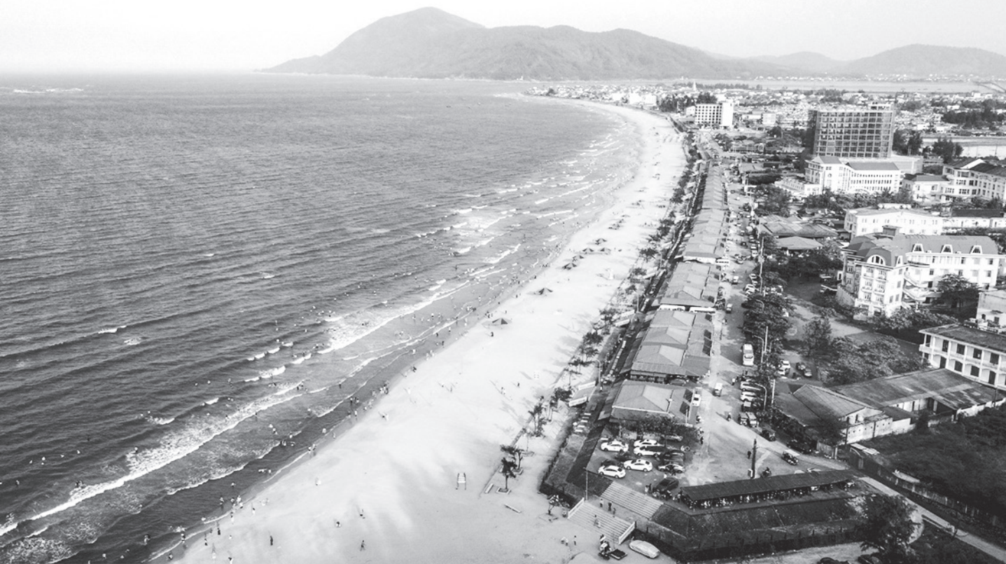
Một góc Khu du lịch biển Thiên Cẩm trong mùa hè năm 2022.