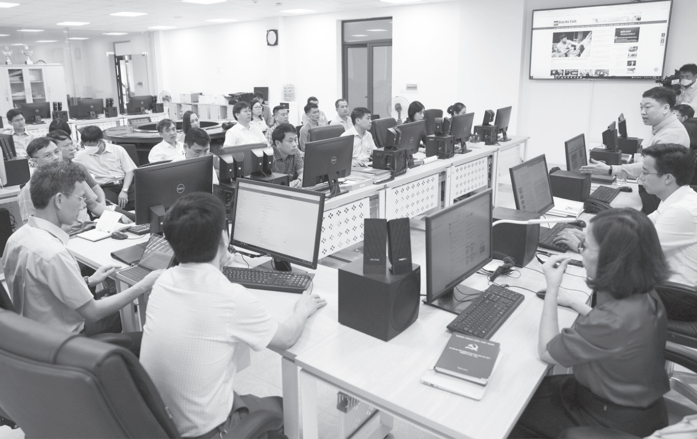
Trung tâm xuất bản - Tòa soạn hội tụ của Báo Hà Tĩnh.