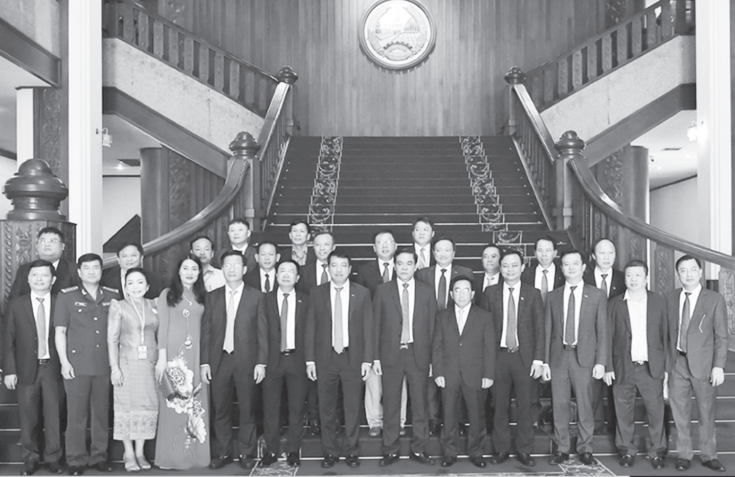
Đoàn công tác cấp cao tỉnh Hà Tĩnh chào xã giao Thủ tướng nước CHDCND Lào Phăn Khăm Vi Pha Văn tại Thủ đô Viêng Chăn (tháng 7/2022).