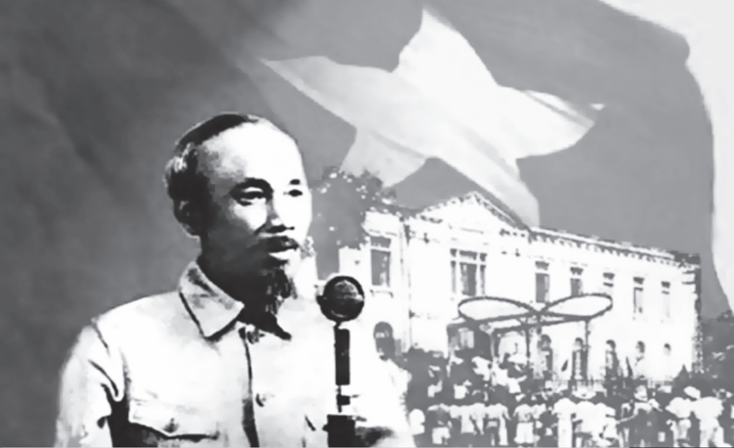
Chủ tịch Hồ Chí Minh đọc bản Tuyên ngôn độc lập tại Quảng trường Ba Đình.