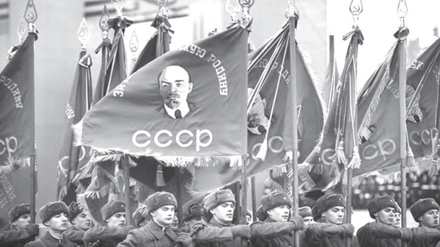
Nước Nga ngày nay luôn trân trọng những giá trị của cuộc Cách mạng Tháng Mười vĩ đại. Ảnh tư liệu