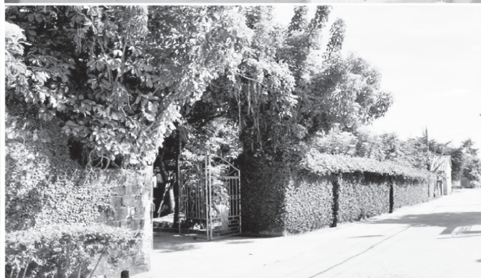
Những khu dân cư kiểu mẫu mang đậm dấu ấn của các trưởng ban công tác mặt trận khu dân cư