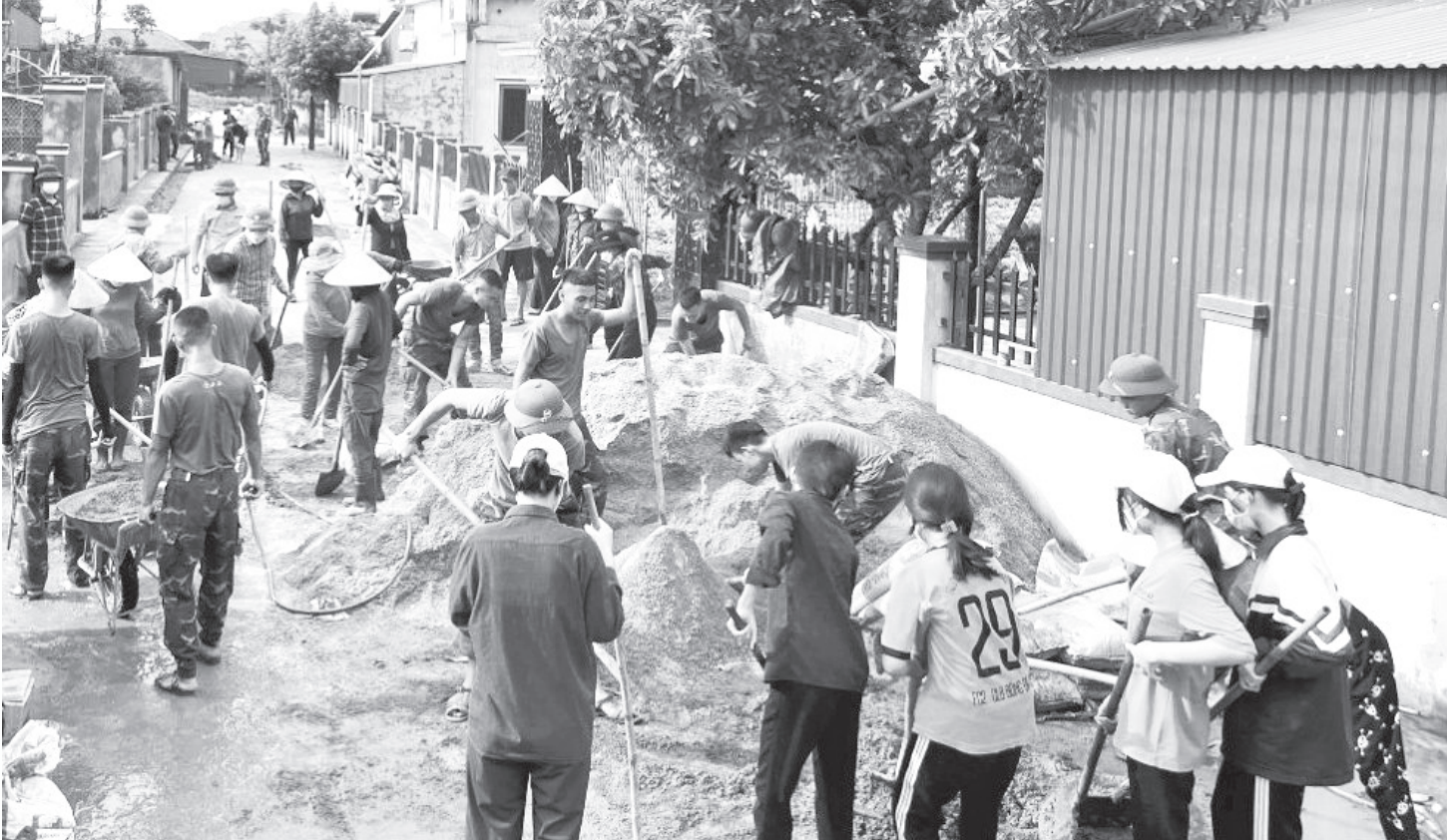
Các tầng lớp Nhân dân tham gia làm đường, xây dựng nông thôn mới.