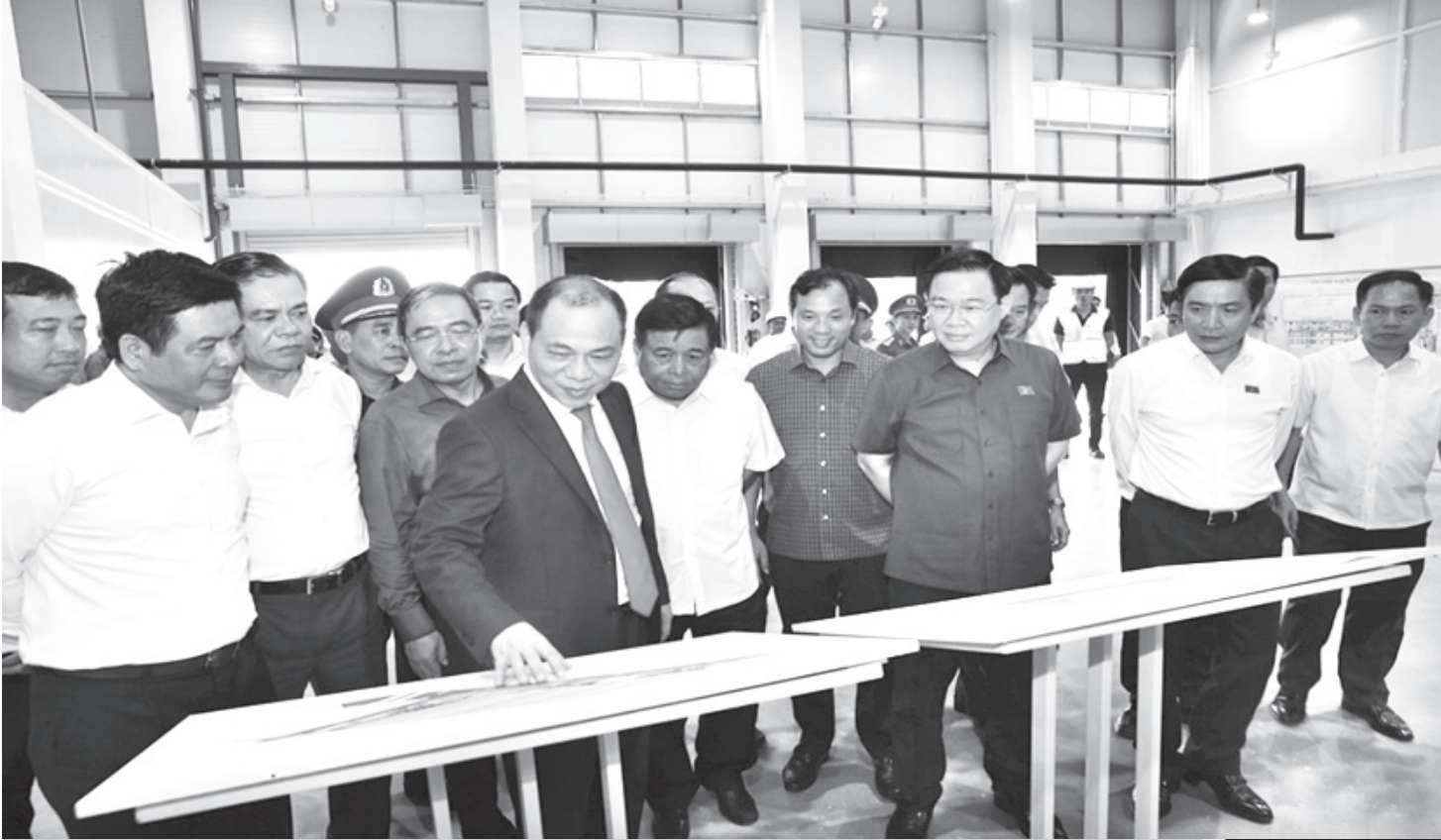
Chủ tịch Tập đoàn Vingroup Phạm Nhật Vượng giới thiệu về Dự án Nhà máy sản xuất Pin VinES với đoàn công tác của Chủ tịch Quốc hội Vương Đình Huệ.