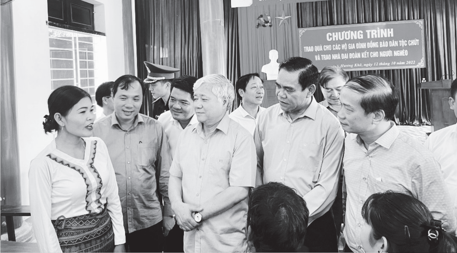
Đồng chí Đỗ Văn Chiến - Bí thư Trung ương Đảng, Chủ tịch Ủy ban Trung ương MTTQ Việt Nam và các đồng chí lãnh đạo tỉnh khảo sát việc Nghị quyết số 23-NQ/TW của Ban Chấp hành Trung ương Đảng khoá IX về phát huy sức mạnh đại đoàn kết toàn dân tộc vì dân giàu, nước mạnh, xã hội công bằng, dân chủ, văn minh tại huyện Hương Khê.