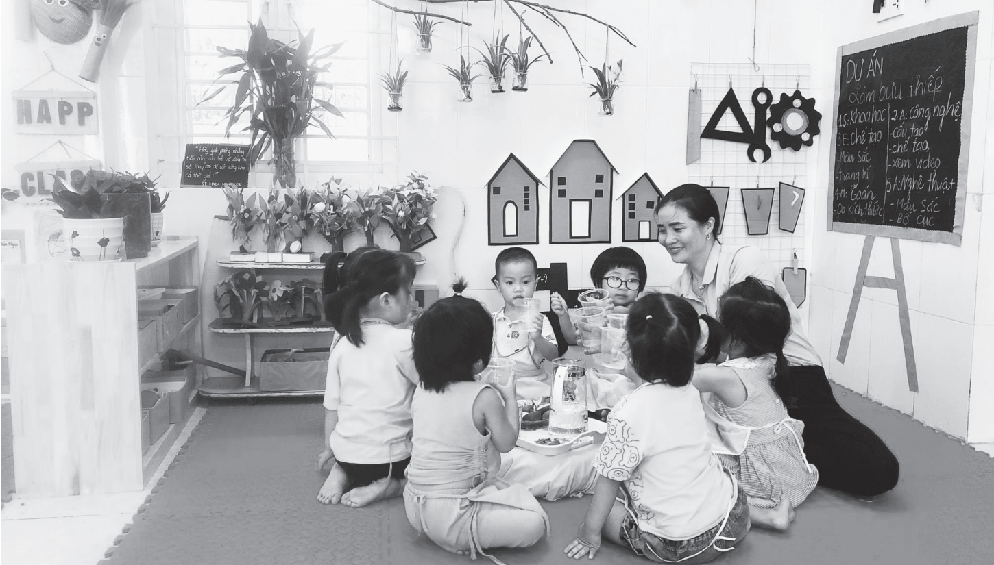
Một tiết học trải nghiệm ở Trường Mầm non Tân Giang (Tp Hà Tĩnh).