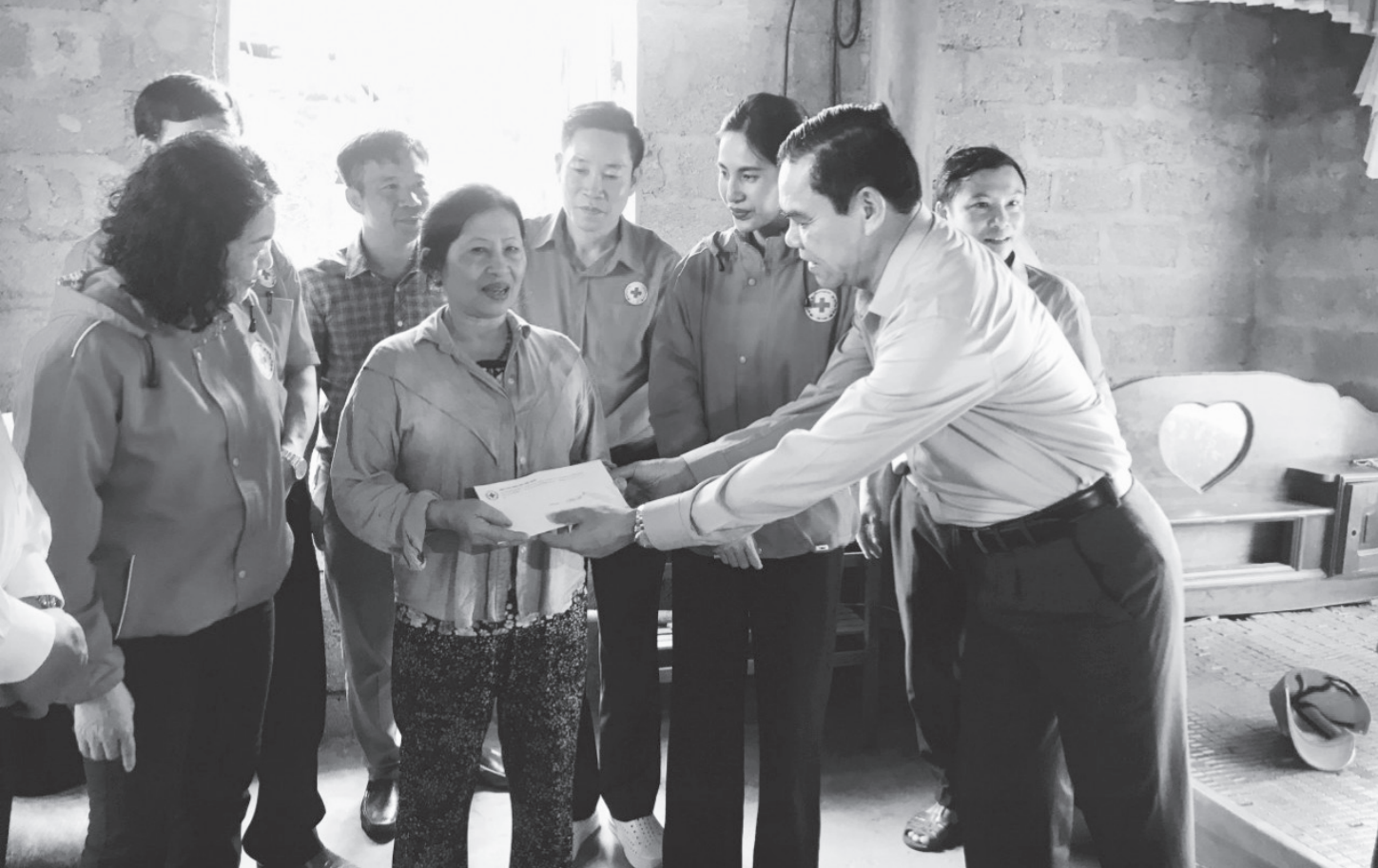
Đồng chí Võ Trọng Hải - Phó Bí thư Tỉnh uỷ, Chủ tịch UBND tỉnh tặng quà cho bà con Hương Sơn bị ảnh hưởng bởi bão số 4.