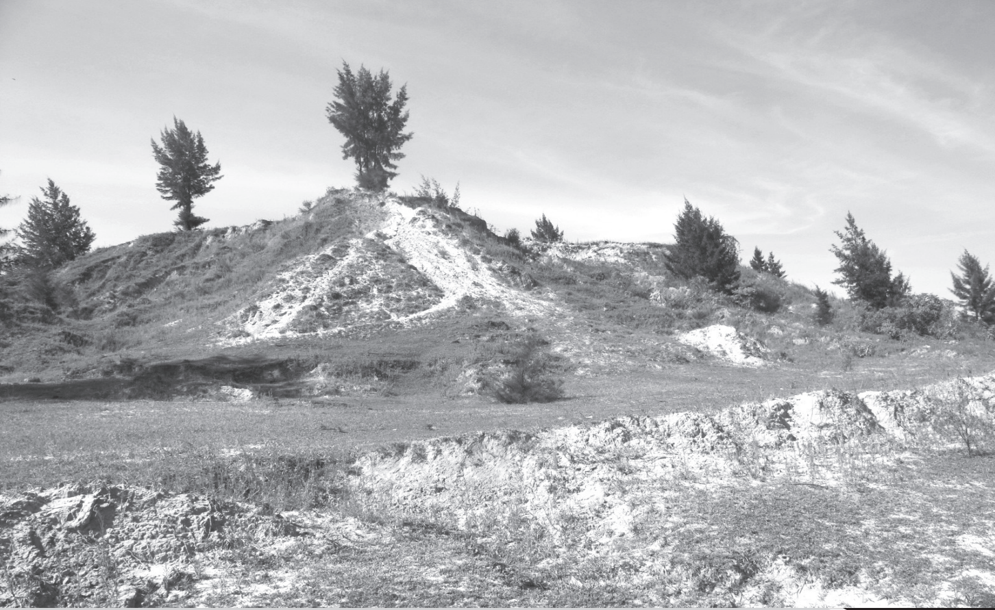
Bãi thải đất tầng phủ cao 50-60m đã bị xói mòn, trôi chảy xuống đồng ruộng và mong mả