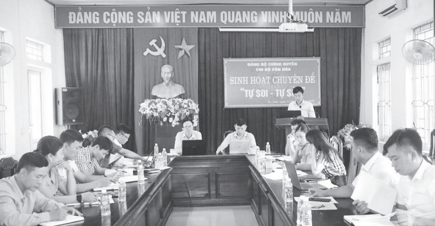
Sinh hoạt chuyên đề "Tự soi, tự sửa" ở chi bộ Văn hóa, Đảng bộ Chính quyền huyện