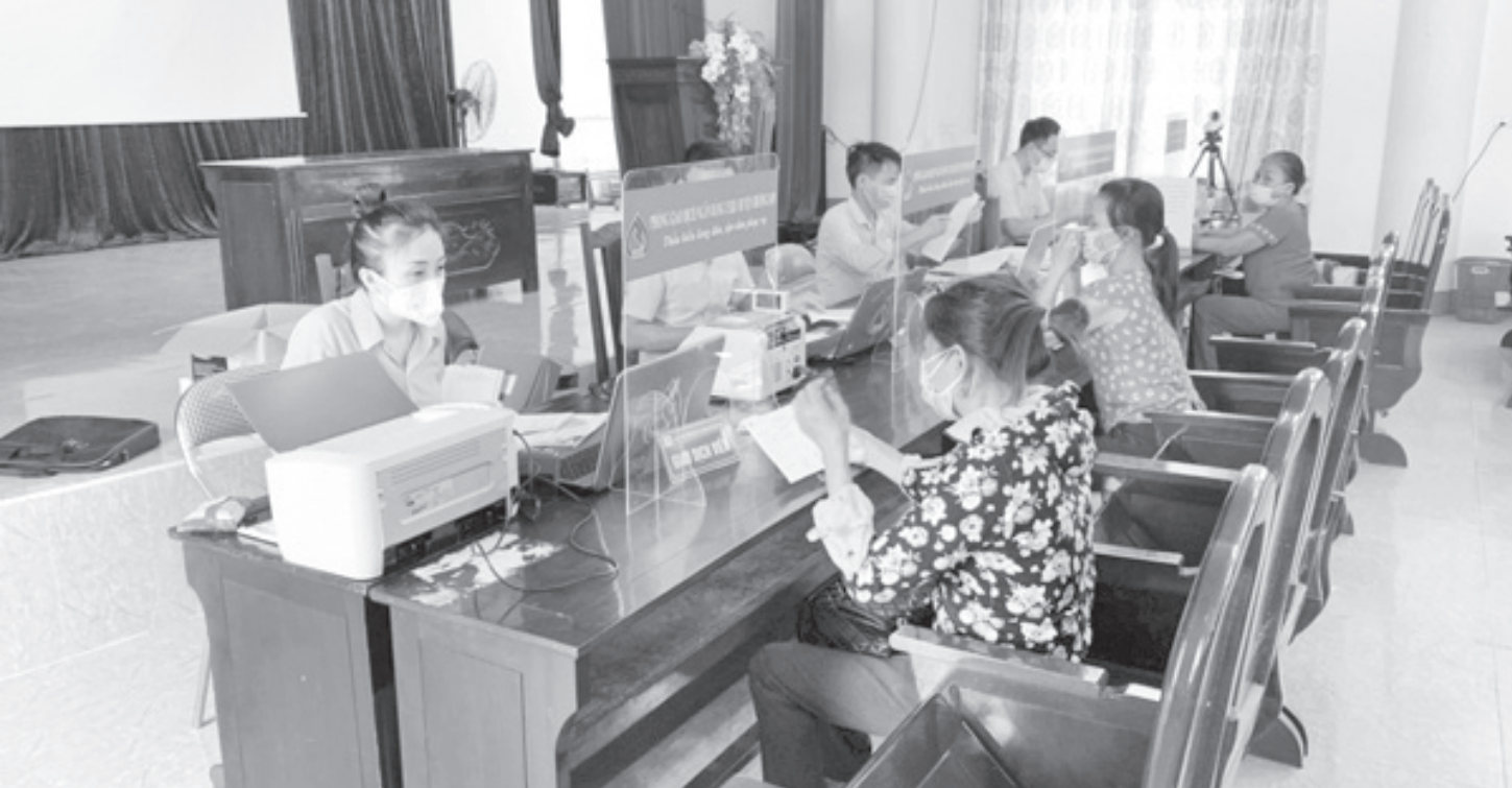
Ngân hàng Chính sách xã hội Hà Tĩnh tổ chức giao dịch với người dân tại điểm giao dịch xã.