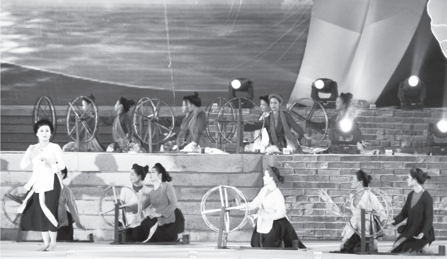
Một tiết mục hát ví phường vải trong Lễ vinh danh Dân ca Ví, Giặm Nghệ Tĩnh trở thành di sản văn hóa phi vật thể đại diện của nhân loại.