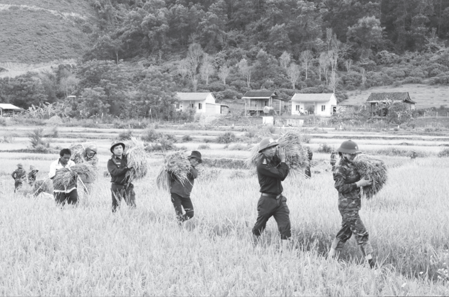
Bộ đội Biên phòng tỉnh Hà Tĩnh giúp bà con dân tộc Chứt thu hoạch mùa.