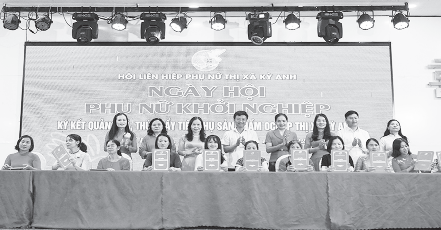
Ký kết tiêu thụ sản phẩm tại Ngày hội phụ nữ khởi nghiệp Thị xã Kỳ Anh.