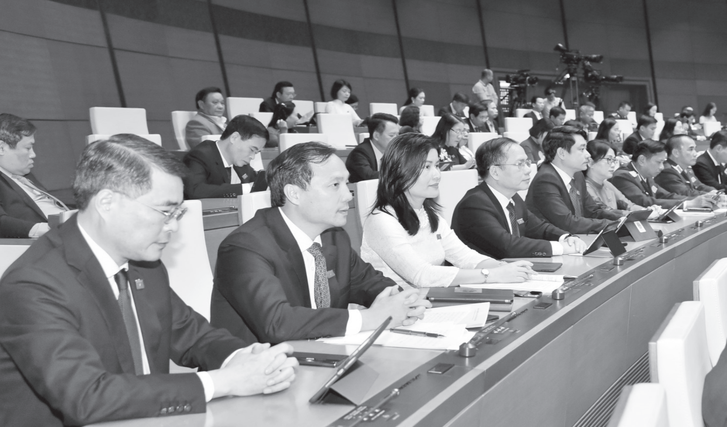
ĐBQH Đoàn Hà Tĩnh tại kỳ họp thứ 4, Quốc hội khóa XV.