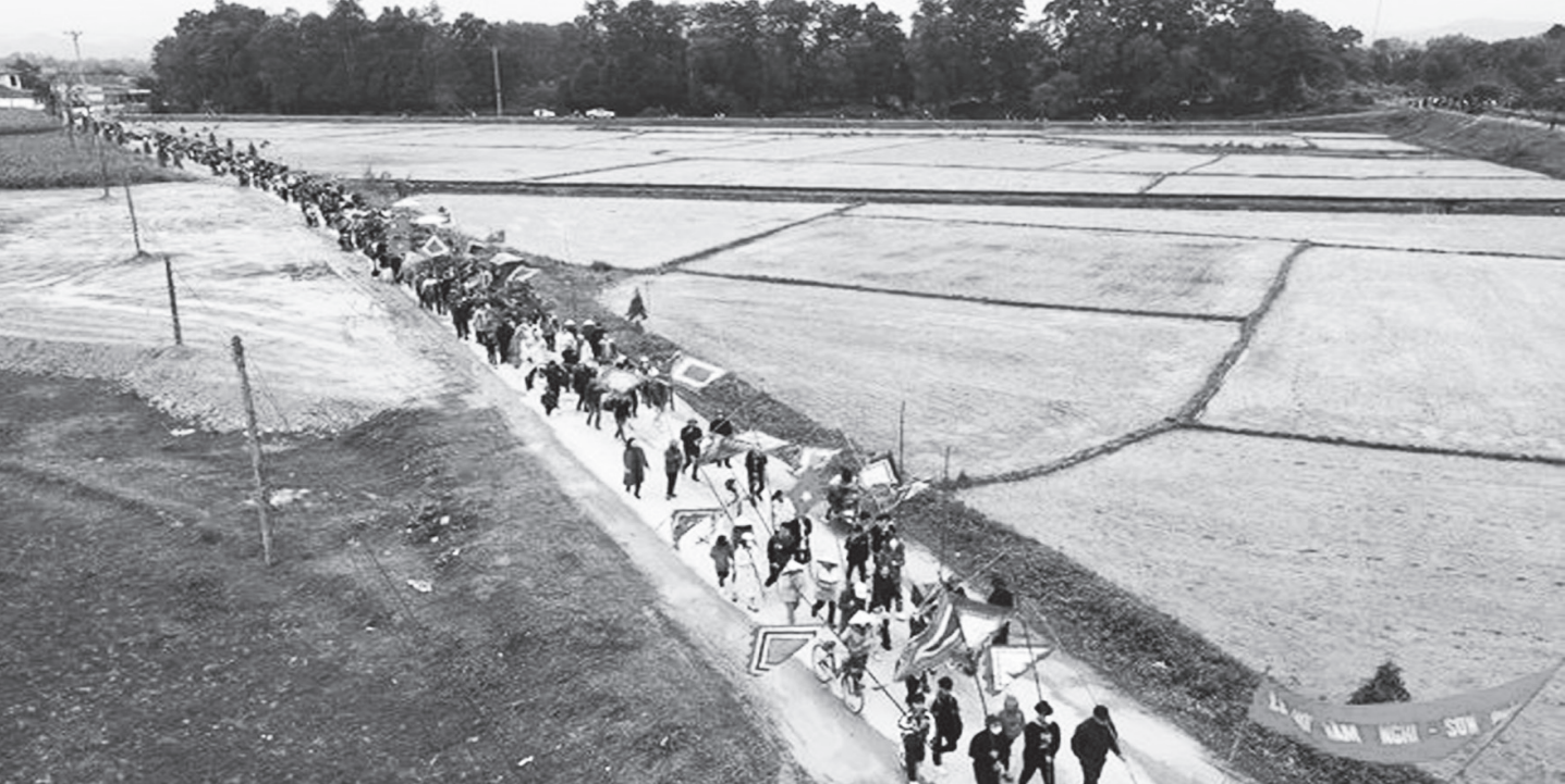
Sáng 28/1 (tức mùng 7 tháng Giêng) chính quyền địa phương và hàng ngàn người dân xã Phú Gia Long (Hương Khê) long trọng tổ chức lễ hội rước sắc phong vua Hàm Nghi hay còn gọi là Lễ hội Hàm Nghi - Sơn Phòng.