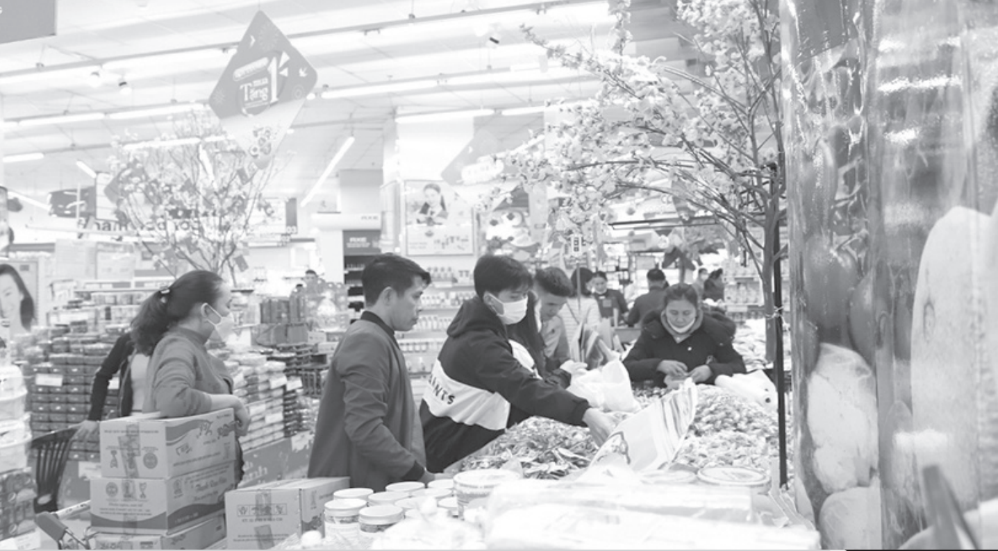
Thời điểm trong tết, tại các chợ, cửa hàng, siêu thị, trung tâm thương mại, hàng hóa được bày bán với sản phẩm đa dạng, giá cả hợp lý.