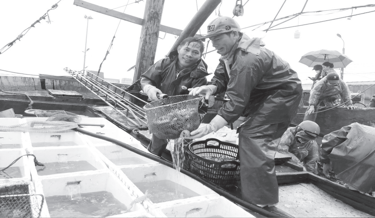
Ngư dân huyện Lộc Hà ra khơi, phấn khởi khi trúng nhiều hải sản có giá trị kinh tế cao.