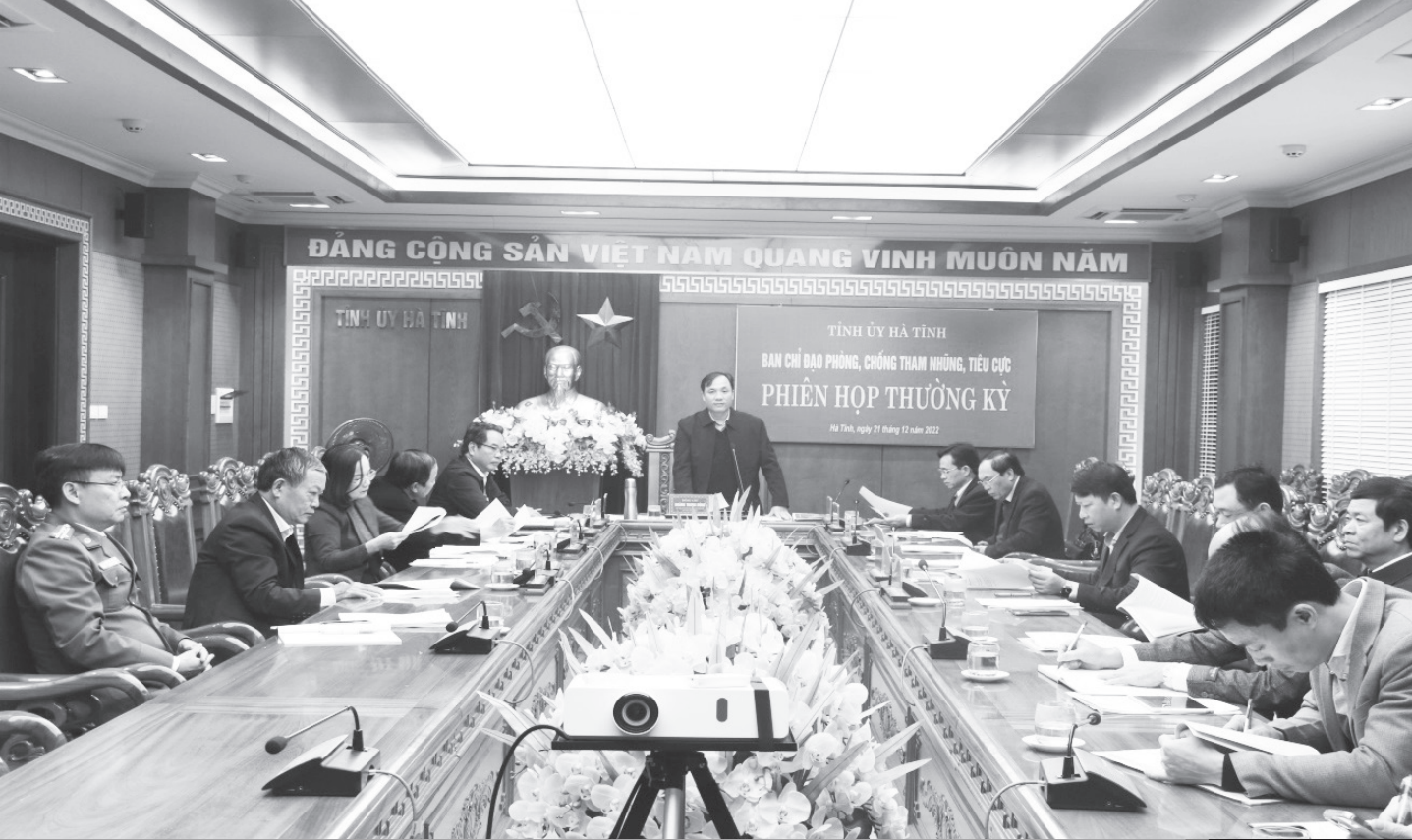
Ban Chỉ đạo phòng chống tham nhũng, tiêu cực tỉnh họp phiên thường kỳ.