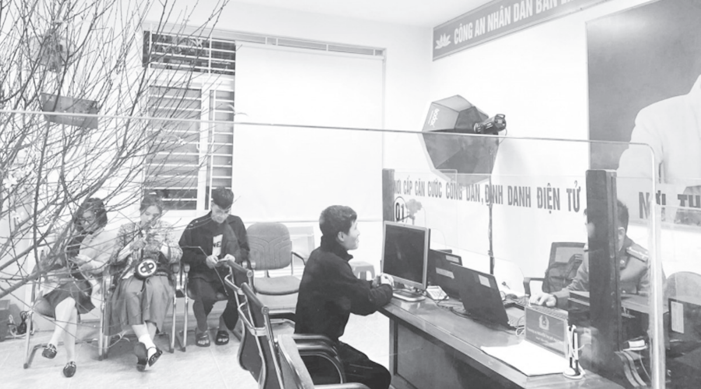
Công an Hà Tĩnh cấp CCCD và định danh điện tử sáng mùng 1 Tết Quý Mão cho công dân trên địa bàn.