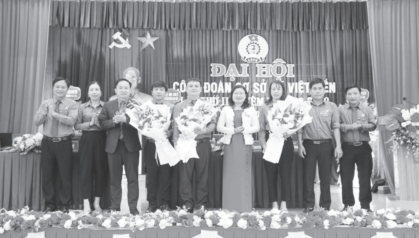
Đại hội Công đoàn cơ sở xã Việt Tiến - huyện Thạch Hà.