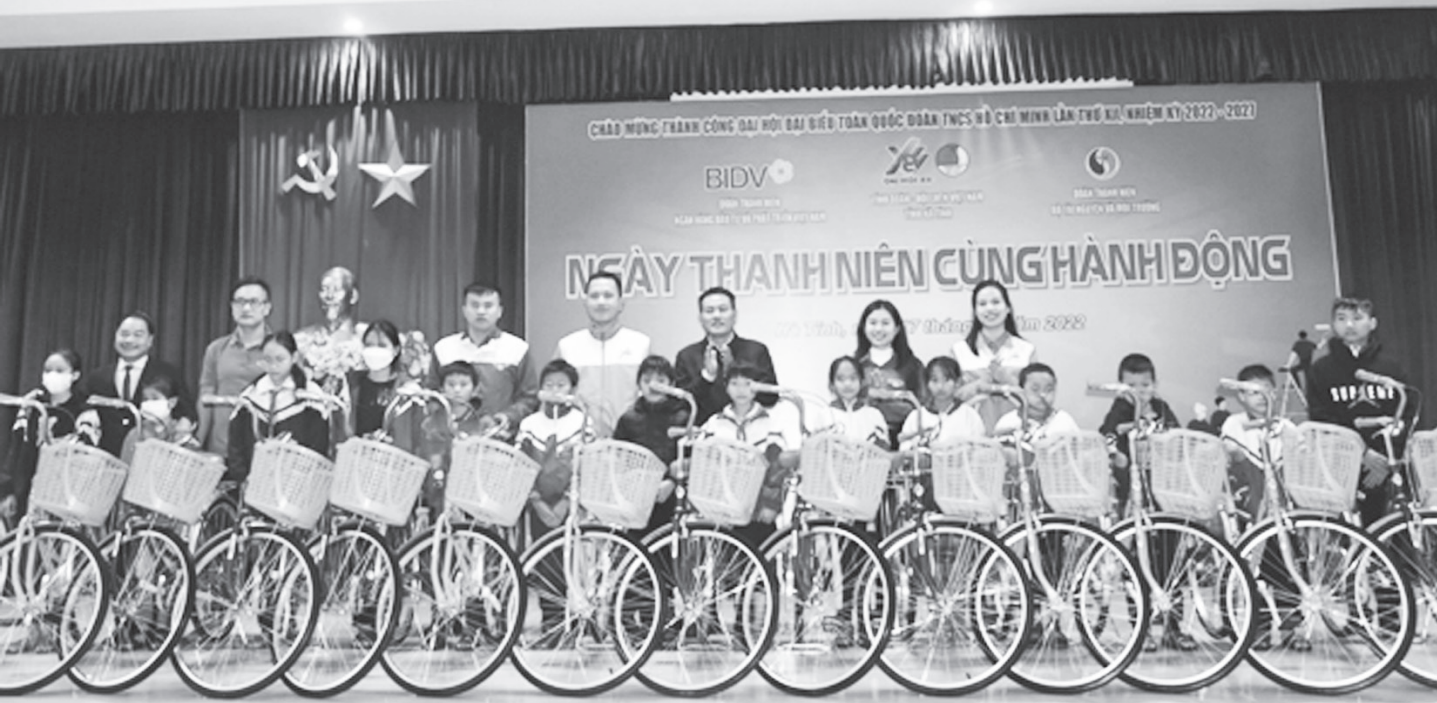
Tỉnh đoàn đã chủ trì tổ chức nhiều hoạt động thiết thực trong Chương trình “Ngày thanh niên cùng hành động” chào mừng thành công Đại hội đại biểu toàn quốc Đoàn TNCS Hồ Chí Minh lần thứ XII, nhiệm kỳ 2022 - 2027.