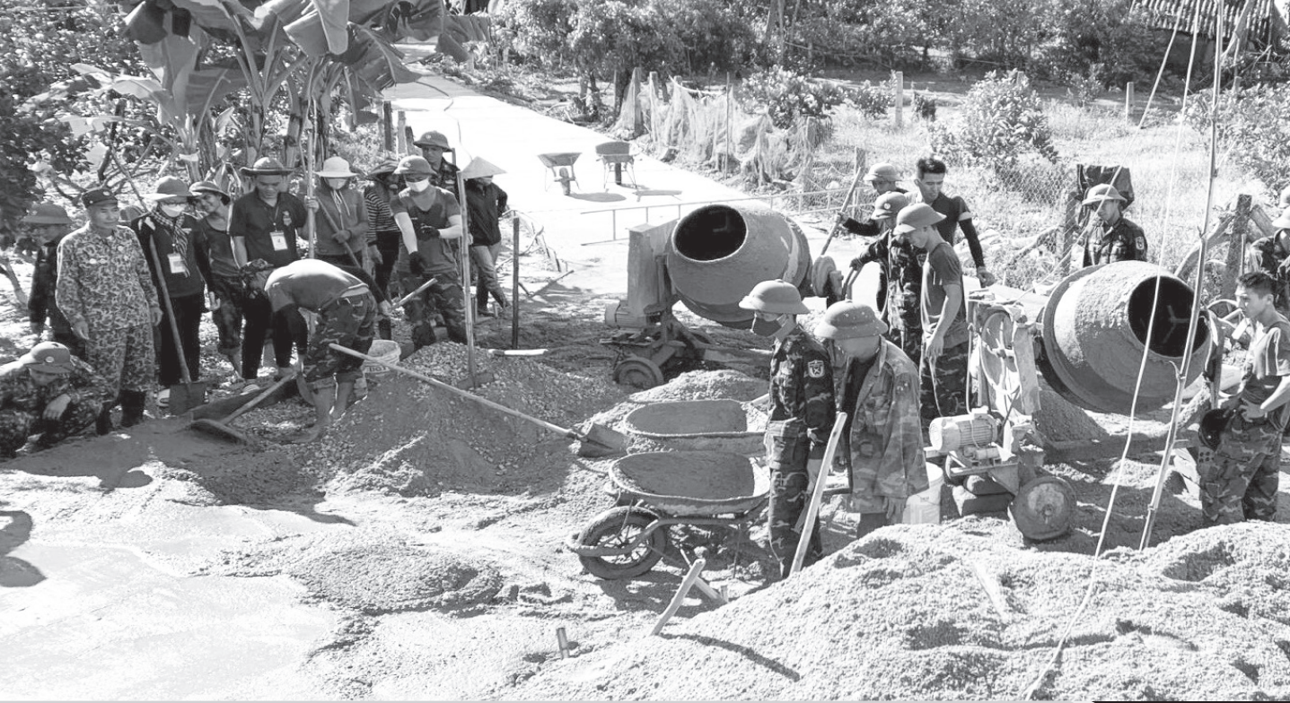
Cán bộ, chiến sĩ thuộc Lữ đoàn Pháo binh 16 (Quân khu 4) giúp Nhân dân thôn 4, xã Hà Linh làm đường giao thông nông thôn.