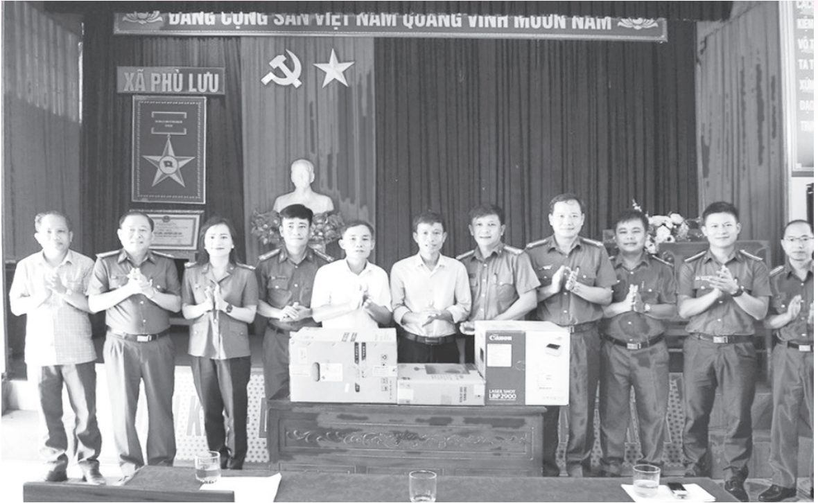
Thực hiện chương trình đỡ đầu công an xã trong thực hiện chuyển đổi số