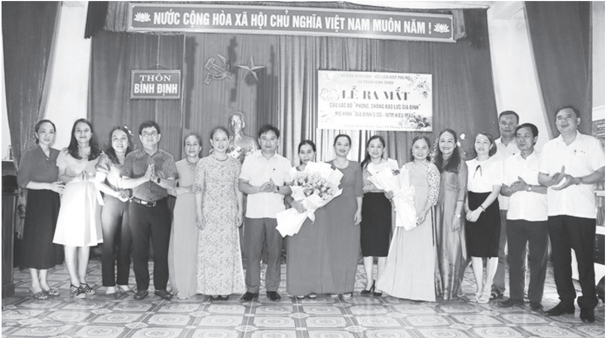
Lễ ra mắt câu lạc bộ “Gia đình 5 có - Nông thôn mới kiểu mẫu” tại thôn Bình Định, xã Thái Bình Thịnh, huyện Đức Thọ