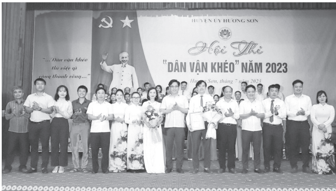
Lãnh đạo Ban Dân vận Tỉnh ủy và lãnh đạo huyện ủy Hương Sơn trao giải Nhất Hội thi cho Đảng bộ thị trấn Phố Châu

Hội thi dân vận khéo năm 2023 huyện Hương Sơn đã khép lại với nhiều dấu ấn tốt đẹp, là điểm nhấn quan trọng trong công tác tuyên truyền triển khai thực hiện Nghị quyết đại hội Đảng bộ các cấp và Nghị quyết Đại hội toàn quốc lần thứ XIII của Đảng. Đồng thời là diễn đàn bổ ích để cán bộ, công chức giao lưu học hỏi kiến thức, kinh nghiệm, kỹ năng và phương pháp tiến hành công tác dân vận, qua đó góp thực hiện thắng lợi các nhiệm vụ chính trị của địa phương đơn vị.