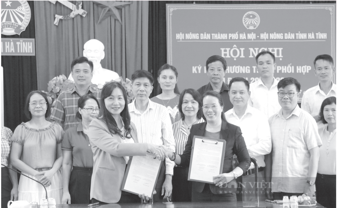
Lãnh đạo Hội Nông dân Hà Nội và Hội Nông dân Hà Tĩnh ký kết chương trình phối hợp giai đoạn 2022-2023.