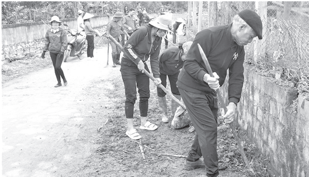
Bà con nhân dân xã Hà Linh ra quân xây dựng nông thôn mới năm 2023

Là huyện miền núi có rất nhiều khó khăn, song với cách làm thiết thực, hiệu quả, những năm qua, công tác dân vận của hệ thống chính trị tại địa phương đã được các cấp ủy đảng, chính quyền, Mặt trận Tổ quốc, các đoàn thể chính trị - xã hội từ huyện đến cơ sở tập trung quan tâm lãnh đạo, chỉ đạo, phối hợp triển khai thực hiện và đạt được nhiều kết quả khá tích cực, nhất là trong xây dựng nông thôn mới, góp phần hoàn thành các tiêu chí quan trọng, đời sống của Nhân dân ngày càng được cải thiện rõ nét.