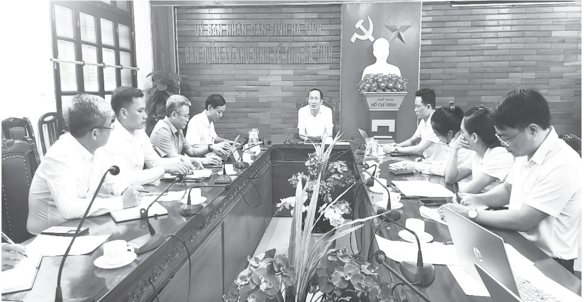
Ban Thường vụ Đảng ủy Khối các cơ quan và doanh nghiệp tỉnh làm việc với Ban Chấp hành Đảng bộ Ban Quản lý Khu kinh tế tỉnh về công tác phát triển tổ chức đảng và đảng viên