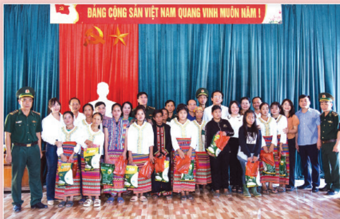
Ban Dân vận Tỉnh ủy tặng 46 suất quà cho đồng bào dân tộc Chứt tại Bản Rào Tre (tháng 7/2023)