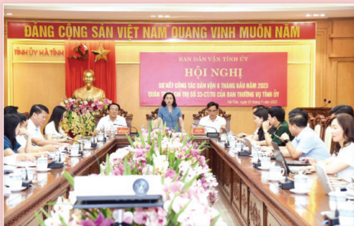
Hội nghị sơ kết công tác Dân vận 6 tháng đầu năm 2023 quản trị chi thị số 33-CT/TU của Ban Thường vụ Tỉnh ủy