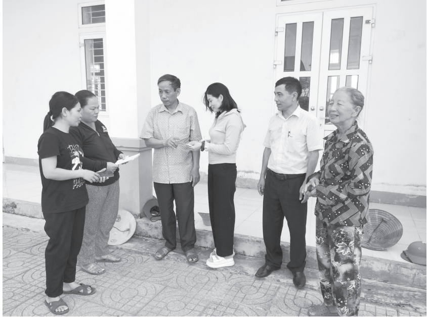
Tổ trưởng tổ dân phố luôn lắng nghe tâm tư, nguyện vọng của bà con trong tổ

Tổ dân phố 2, thị trấn Thạch Hà có 230 hộ với trên 900 nhân khẩu, có 52 đảng viên, trong đó có 39 đảng viên sinh hoạt chính thức. Tổ có địa bàn rộng, đời sống Nhân dân chủ yếu sản xuất nông nghiệp, trình độ dân trí không đồng đều, được sáp nhập từ tổ dân phố 3 và 4. Khi mới sáp nhập, cán