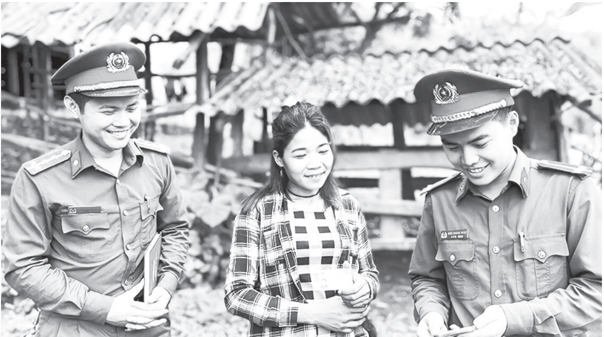
Công an xã Hương Liên (huyện Hương Khê) hướng dẫn người dân thực hiện chuyển đổi số

quả trong thực hiện Chuyển đổi số. Cùng với đó, kể từ ngày 1/1/2023, theo Luật Cư trú 2020, sổ tạm trú, sổ hộ khẩu giấy chính thức được bãi bỏ trong tất cả những giao dịch thủ tục hành chính phục vụ nhân dân. Đây được xem như một dấu mốc “lịch sử” đối với công tác quản lý hành chính. Thay