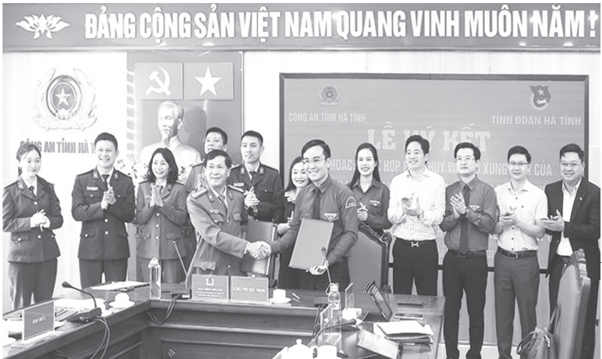
Đoàn thanh niên, Công an tỉnh Hà Tĩnh ký kết chương trình phối hợp chuyển đổi số