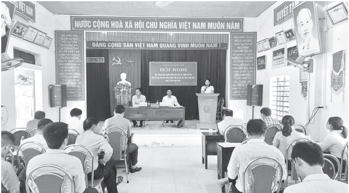
Tiếp xúc đối thoại trong công tác Giải phóng mặt bằng, hỗ trợ tái định cư

Thời gian qua, việc tổ chức tiếp xúc, đối thoại trực tiếp của người đứng đầu cấp ủy, chính quyền thị xã và các xã, phường với Nhân dân ở thị xã Kỳ Anh luôn được quan tâm thực hiện có hiệu quả. Qua đó, góp phần phát huy sức mạnh của cả hệ thống chính trị và Nhân dân trong công tác xây dựng Đảng, chính quyền trong sạch, vững mạnh; thúc đẩy phát triển kinh tế - xã hội, xây dựng nông thôn mới, đô thị văn minh và công tác Giải phóng mặt bằng, giữ vững ổn định an ninh chính trị, trật tự, an toàn xã hội trên địa bàn.