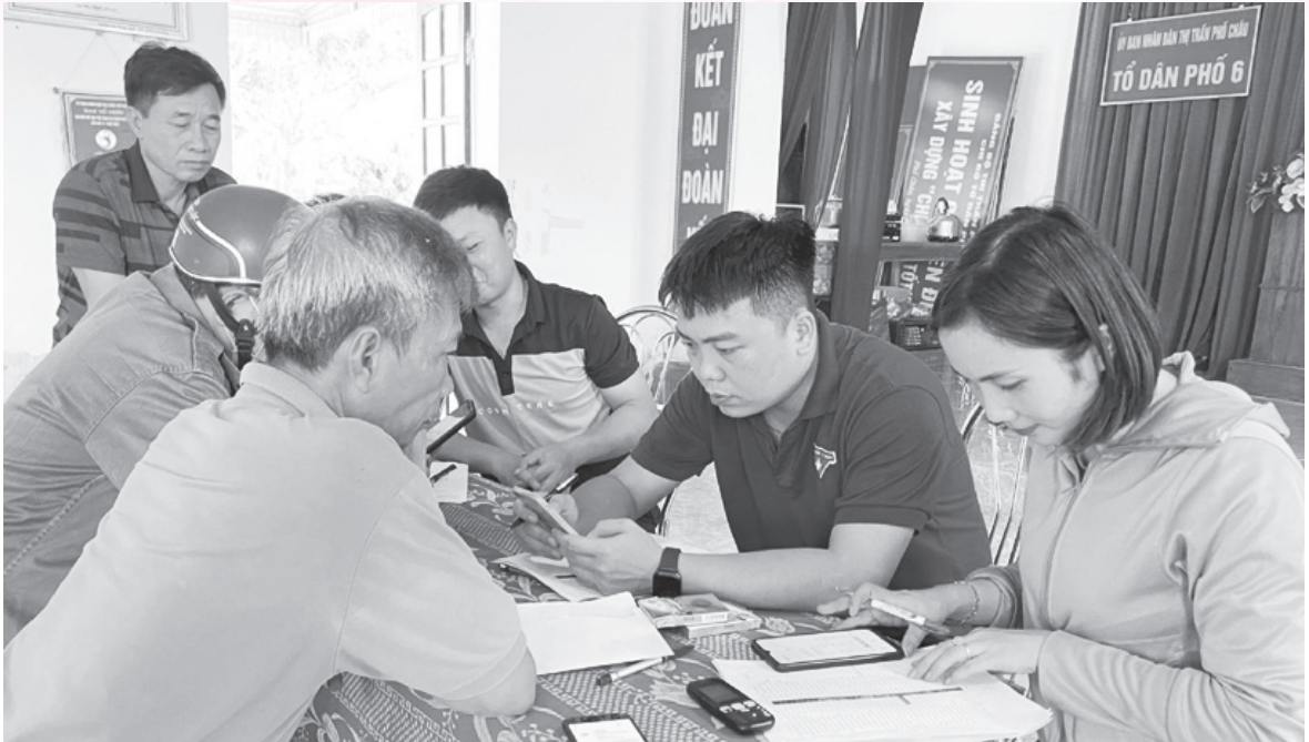
Đoàn viên thanh niên tích cực tham gia hỗ trợ việc cài đặt định danh điện tử cho người dân