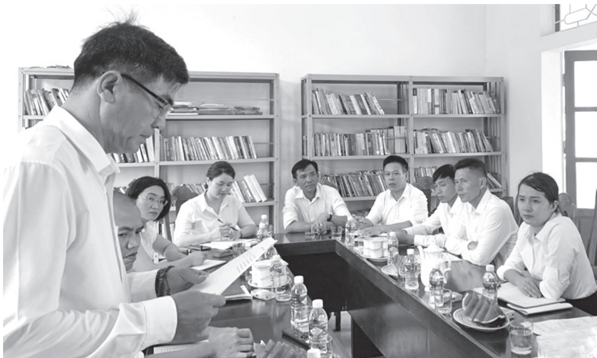
Chi bộ Trung tâm Văn hóa - Truyền thông huyện Lộc Hà sinh hoạt chuyên đề “Giữ trọn lời thề đảng viên”

Thấm nhuần lời dạy của Chủ tịch Hồ Chí Minh: “Cán bộ là cái gốc của mọi công việc”, “muôn việc thành công hay thất bại đều do cán bộ tốt hay kém”, thời gian qua, Đảng bộ huyện Lộc Hà luôn nêu cao tinh thần “Học tập và làm theo tấm gương đạo đức, phong cách Hồ Chí Minh, phát huy vai trò tiên phong của Cán bộ, đảng viên trong mọi phong trào, nhất là việc đưa chủ trương, nghị quyết của Đảng vào cuộc sống, góp phần xây dựng tổ chức Đảng ngày càng trong sạch vững mạnh, phát triển kinh tế - xã hội tại địa phương.