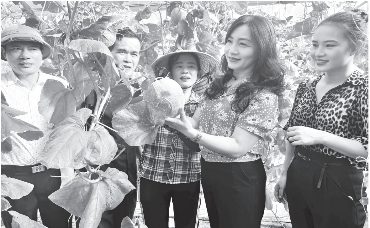
Mô hình dưa lưới của chi hội nghề nghiệp sản xuất rau và dưa an toàn thôn Bằng Sơn, xã Thạch Châu, huyện Lộc Hà từ nguồn hỗ trợ vay vốn của Quỹ hỗ trợ nông dân tỉnh

Trong những năm qua, Hội Nông dân Hà Tĩnh luôn đoàn kết, đổi mới nội dung, phương thức hoạt động, xây dựng tổ chức Hội vững mạnh; nâng cao chất lượng, hiệu quả các phong trào thi đua, đẩy mạnh các hoạt động hỗ trợ nông dân và đã đạt được nhiều kết quả nổi bật, góp phần quan trọng vào nhiệm vụ phát triển kinh tế xã hội của địa phương, nâng cao đời sống vật chất, tinh thần cho hội viên, nông dân.