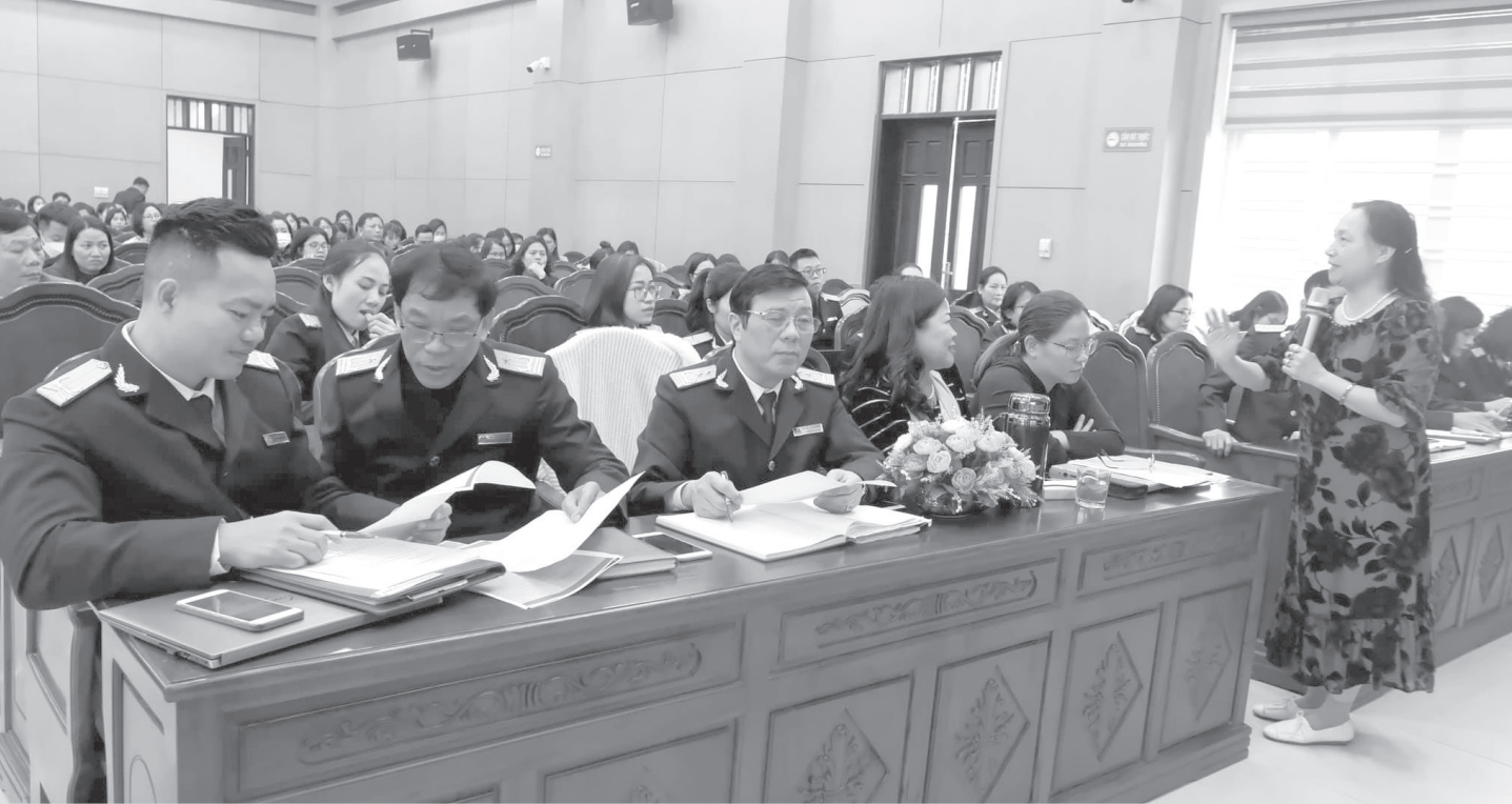
Quang cảnh một cuộc tập huấn tại Hội trường Cục Thuế Hà Tĩnh.