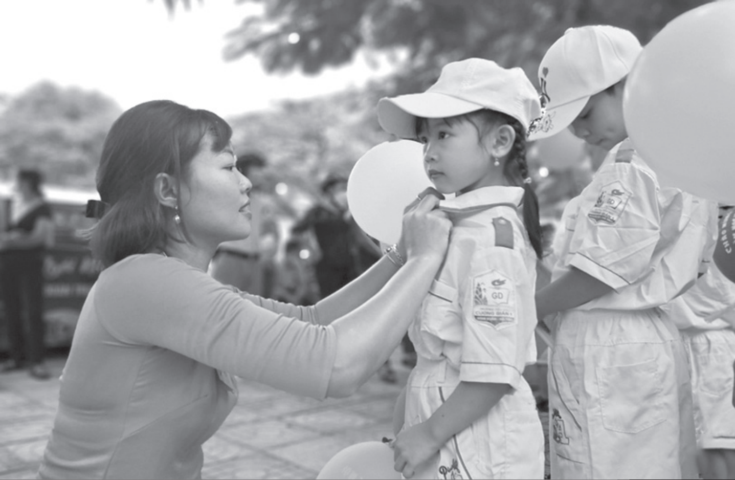
Học sinh lớp 1 Trường Tiểu học Cương Gián 1 (Nghị Xuân) trong lễ khai giảng năm học 2022 - 2023.