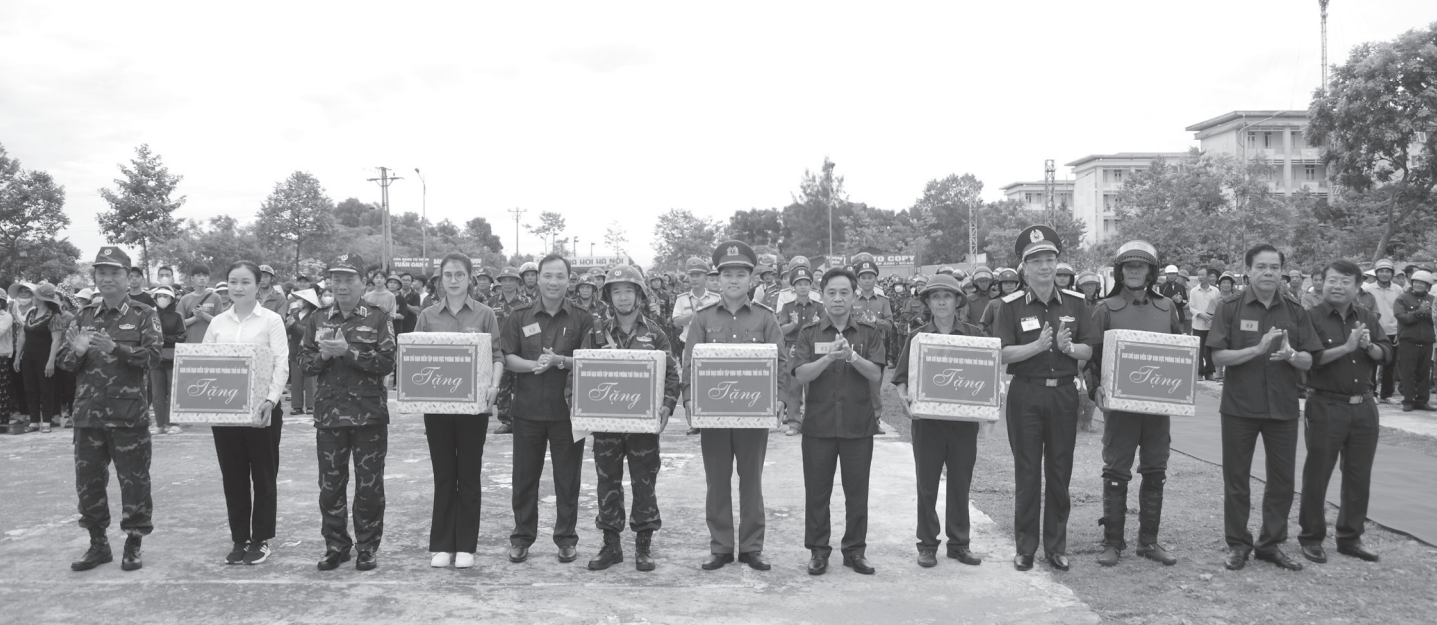
Thường trực Tỉnh ủy và Thủ trưởng Bộ Tư lệnh Quân khu 4 động viên các lực lượng tham gia thực binh trong diễn tập KVPT tỉnh.