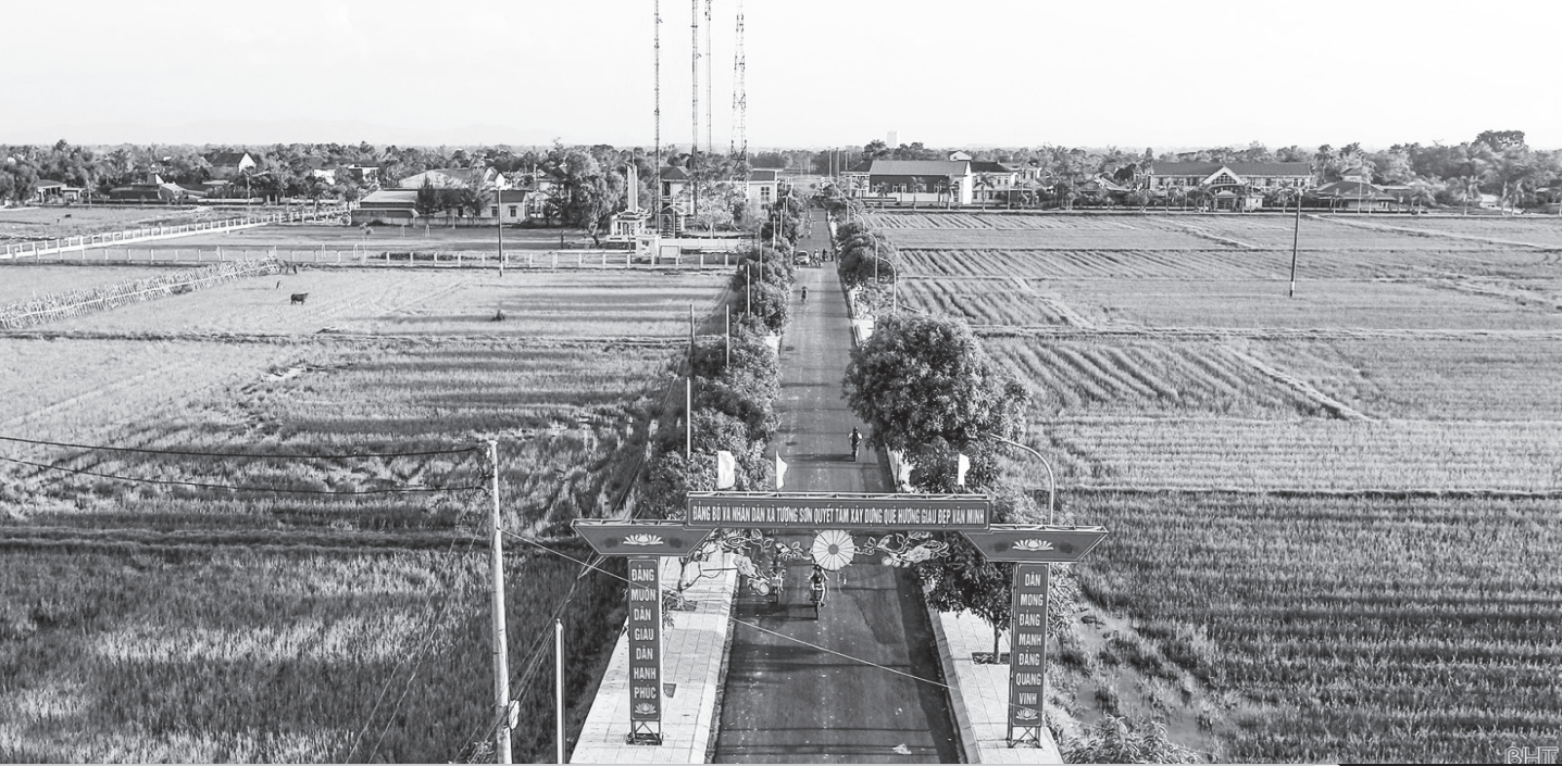
Hà Tĩnh cơ bản đạt tiêu chí quy hoạch trong Đề án xây dựng tỉnh đạt chuẩn NTM.