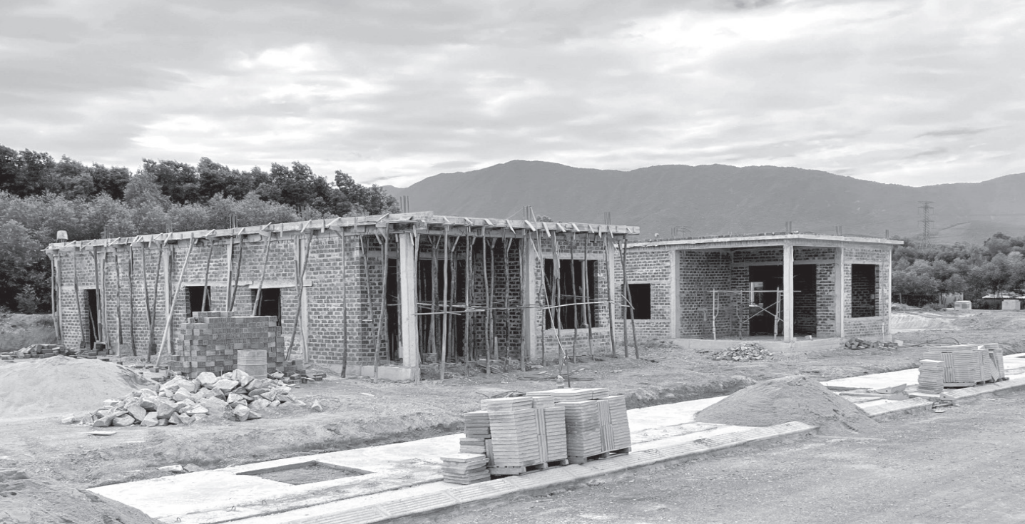
Khu tái định cư cao tốc Bắc - Nam ở thôn Hoa Tiến, xã Kỳ Hoa, thị xã Kỳ Anh.