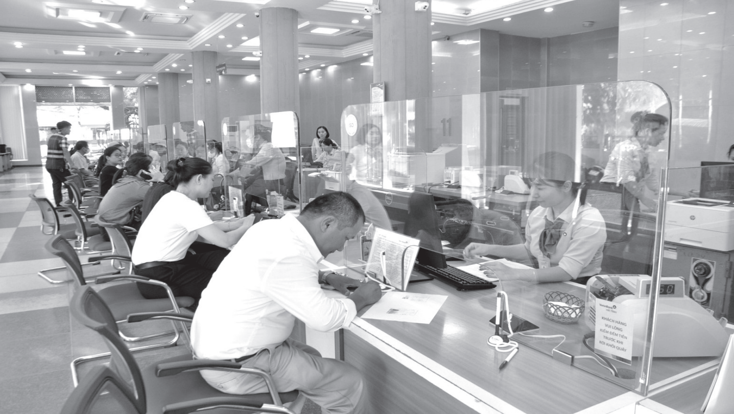
Ngân hàng đồng hành cùng người dân, doanh nghiệp.