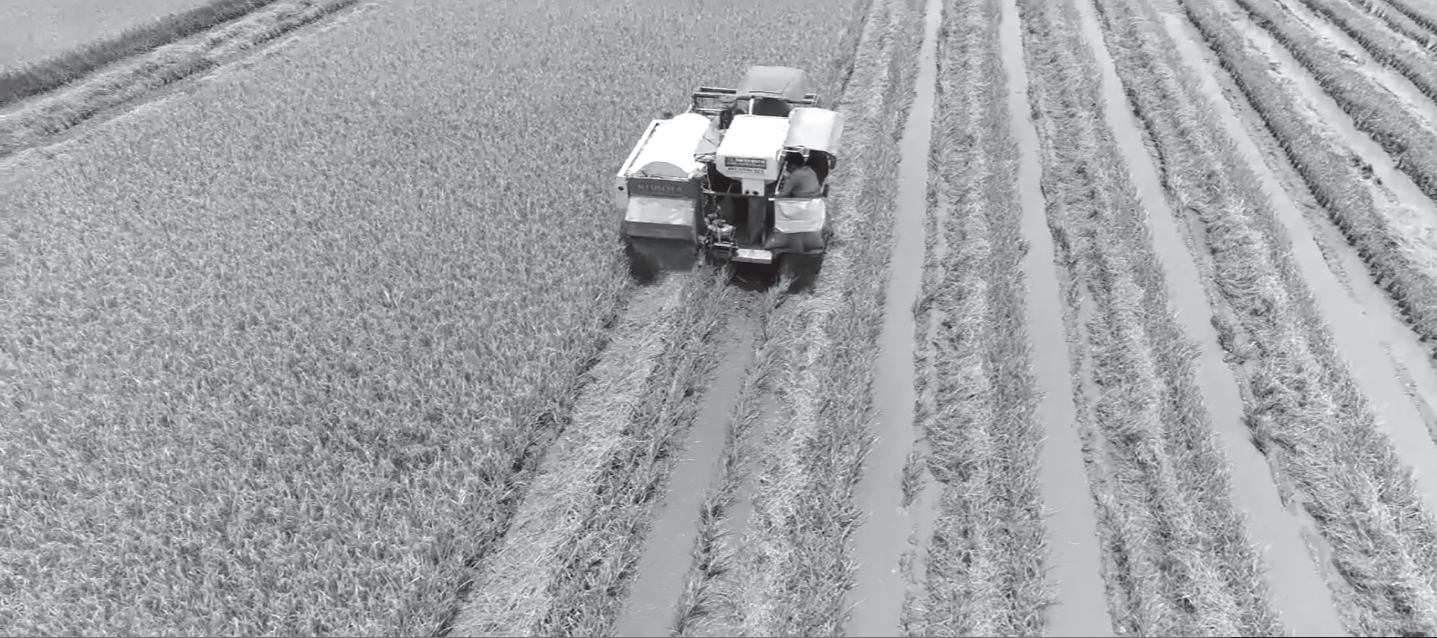
Những cánh đồng sau chuyển đổi, đưa máy móc công suất lớn vào sản xuất.