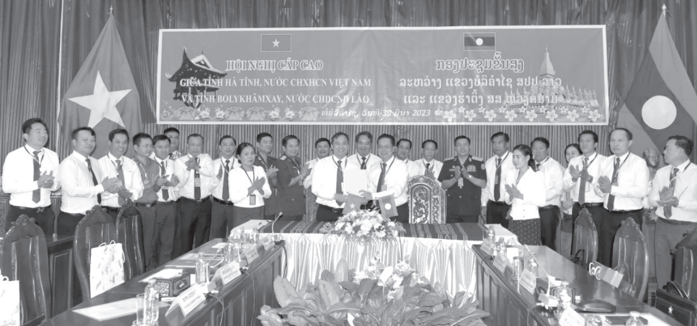
Hội đàm cấp cao thường niên giữa tỉnh Hà Tĩnh và tỉnh Bolikhamsay (Tháng 3/2023).