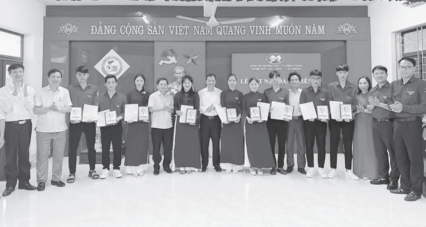
Đồng chí Hoàng Trung Dũng - UV BCH TW Đảng, Bí thư Tỉnh ủy cùng lãnh đạo Huyện ủy và Đảng ủy Nhà trường trao Quyết định cho các đảng viên mới ở trường THPT Lý Chính Thắng.