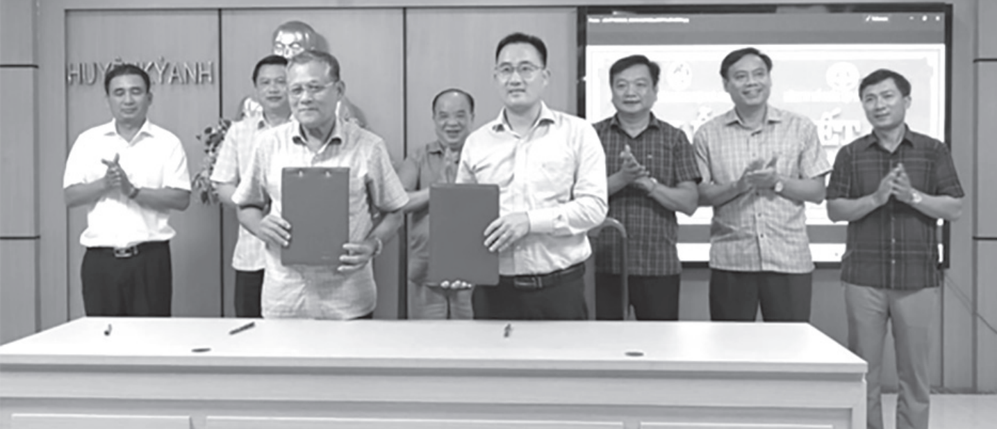
Huyện Kỳ Anh và Tập đoàn Quế Lâm ký kết hợp tác về phát triển nông nghiệp hữu cơ, nông nghiệp tuần hoàn.