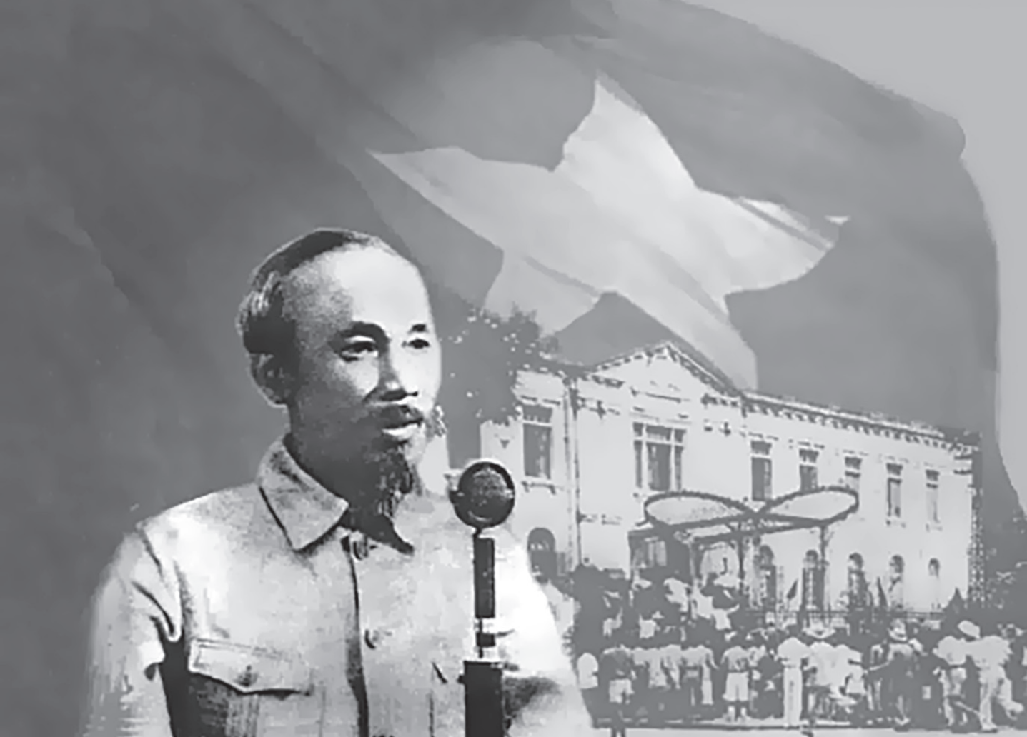
Bác Hồ đọc bản Tuyên ngôn Độc lập tại Quảng trường Ba Đình vào ngày 02/9/1945.