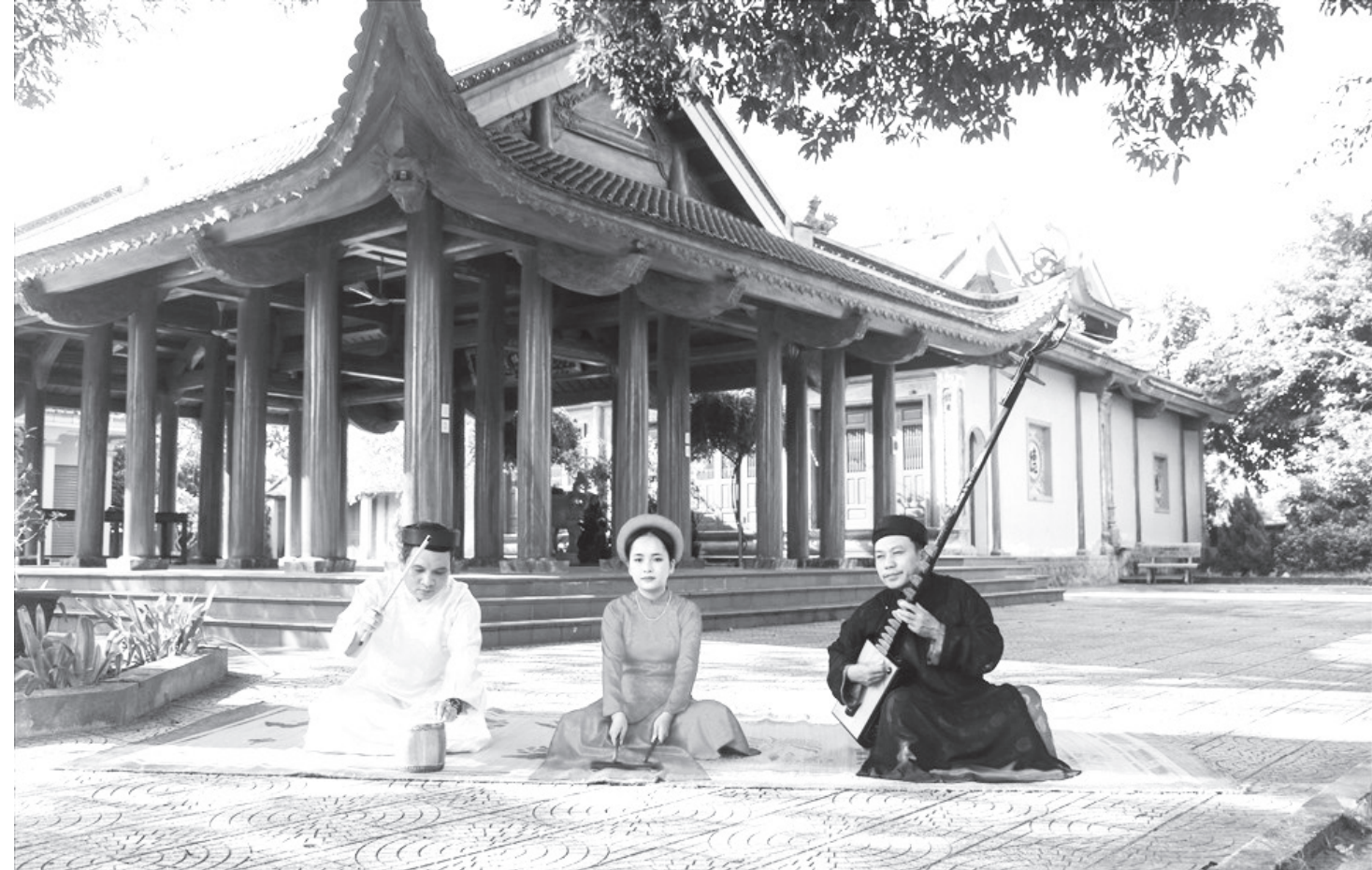
Ca trù Cổ Đạm - Tinh hoa văn hóa độc đáo cần được gìn giữ, bảo vệ và phát huy.