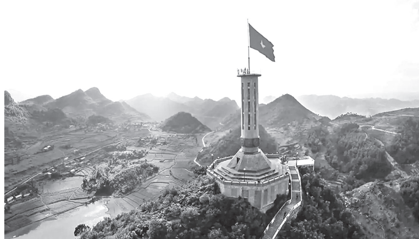
Thiên liêng cột cờ Lũng Cú.