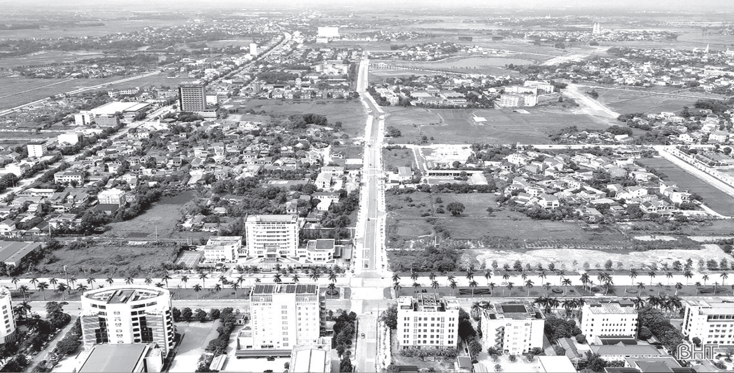
Diện mạo thành Sen đang từng ngày thêm sáng - xanh - sạch - đẹp.