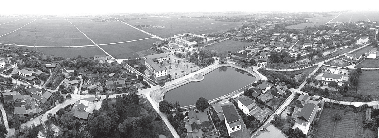
Làng quê Cẩm Thành chuyển mình sau nhiều năm xây dựng nông thôn mới