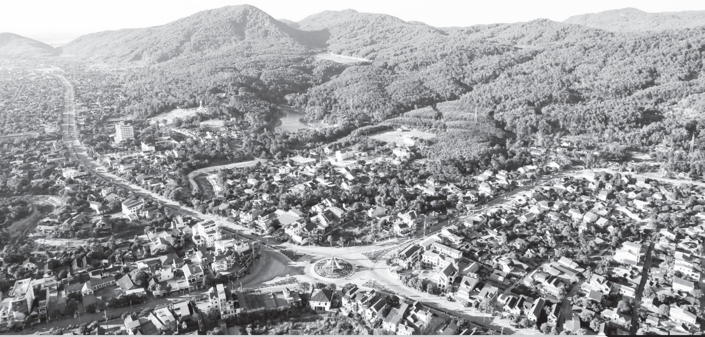
Thị xã Hồng Lĩnh hôm nay.