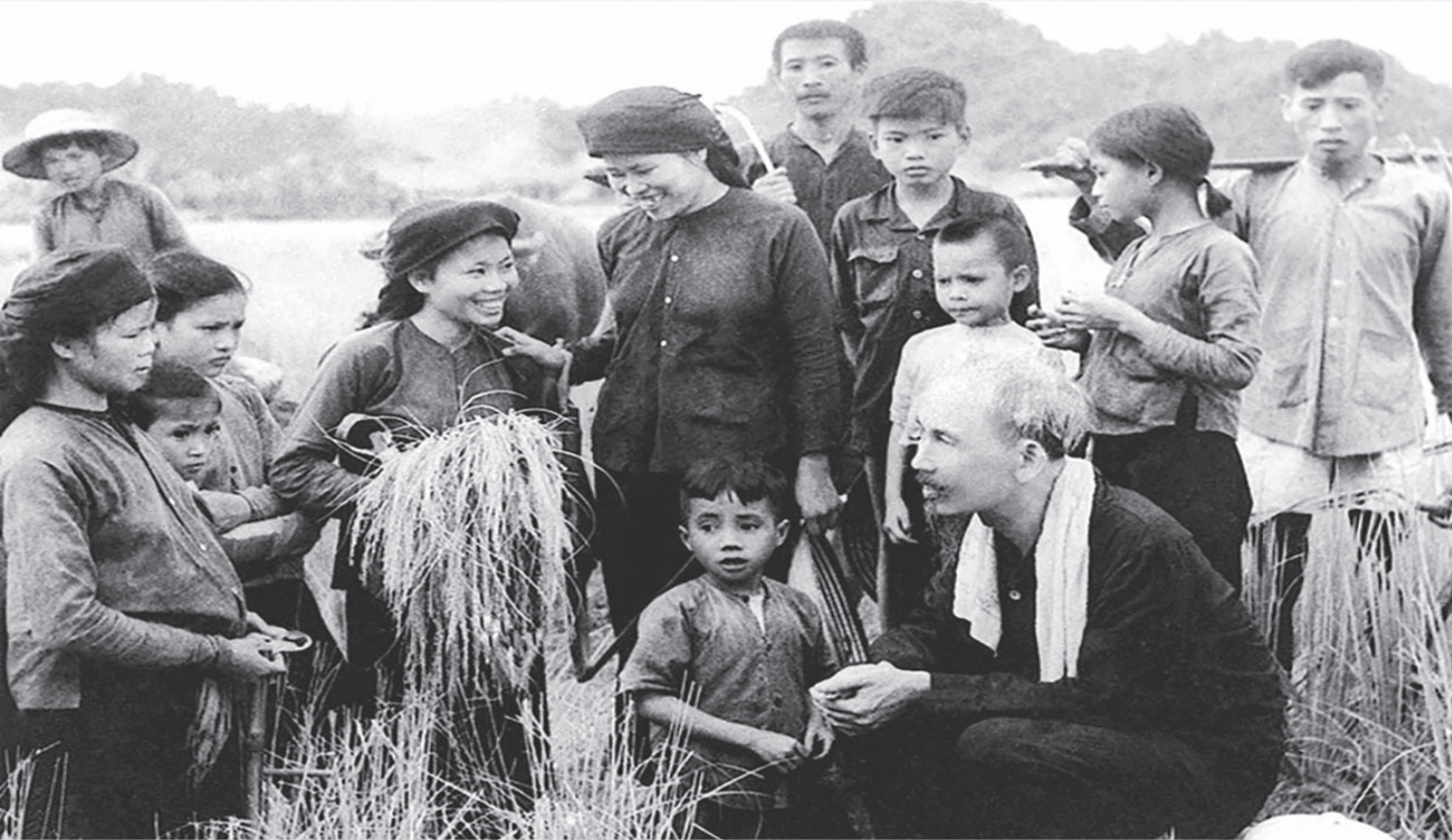
Chủ tịch Hồ Chí Minh thăm đồng bào Hùng Sơn, xã Phục Linh, huyện Đại Từ, tỉnh Thái Nguyên (1954).