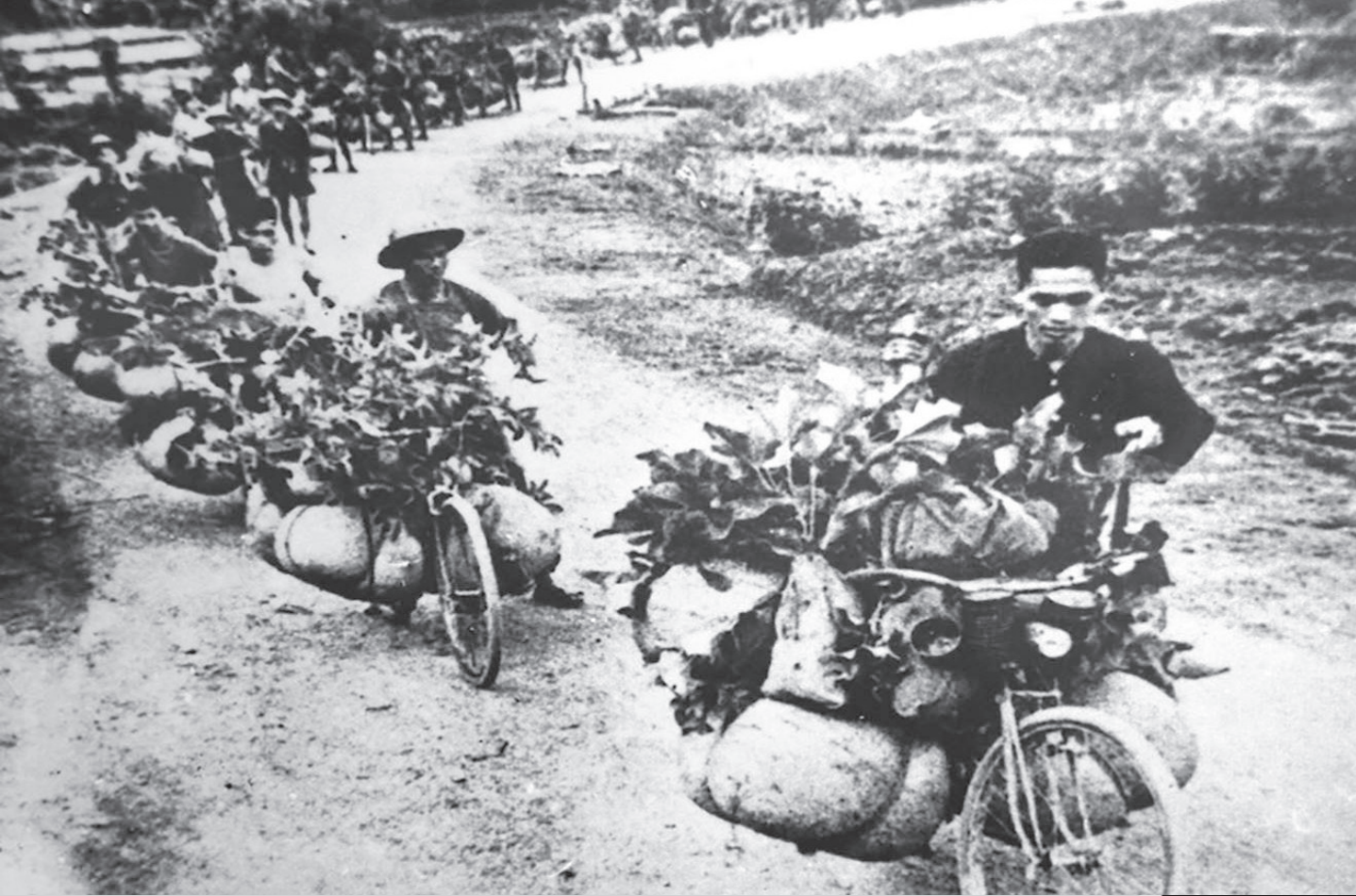
Đoàn dân công xe đạp chở vận chuyển hàng phục vụ bộ đội tại chiến trường Điện Biên Phủ năm 1954.