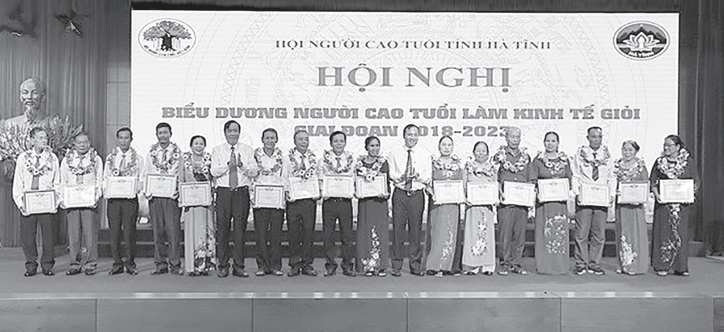
Hội nghị biểu dương người cao tuổi làm kinh tế giỏi