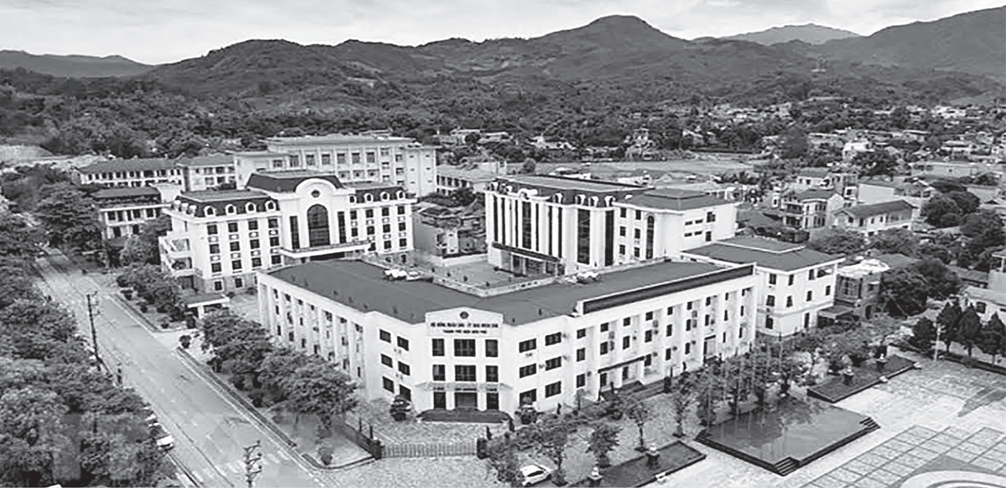
Một góc phường Him Lam thành phố Điện Biên Phủ hôm nay.