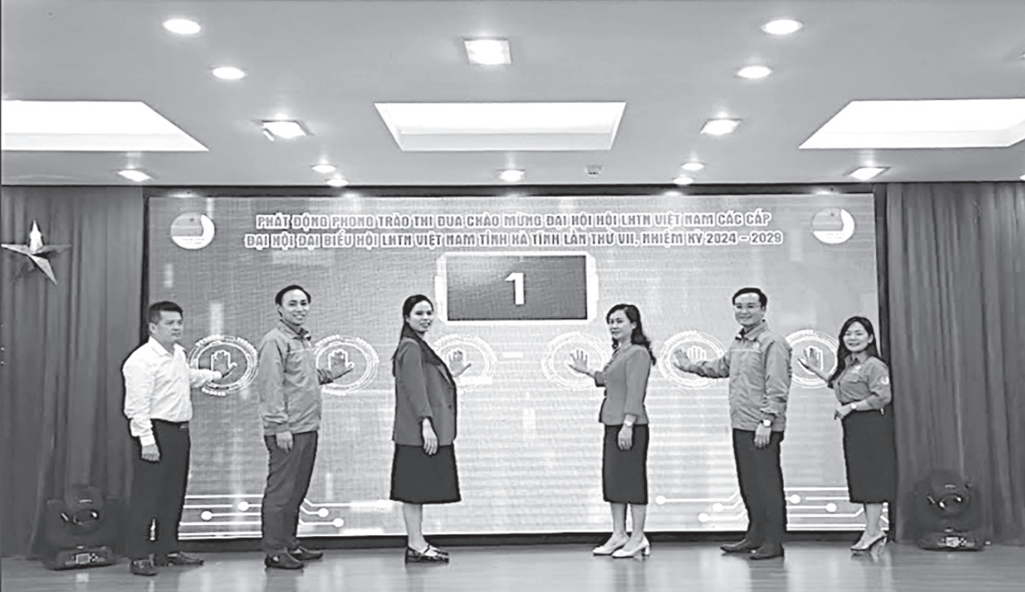
Lễ phát động Chào mừng Đại hội LHTN Việt Nam các cấp.