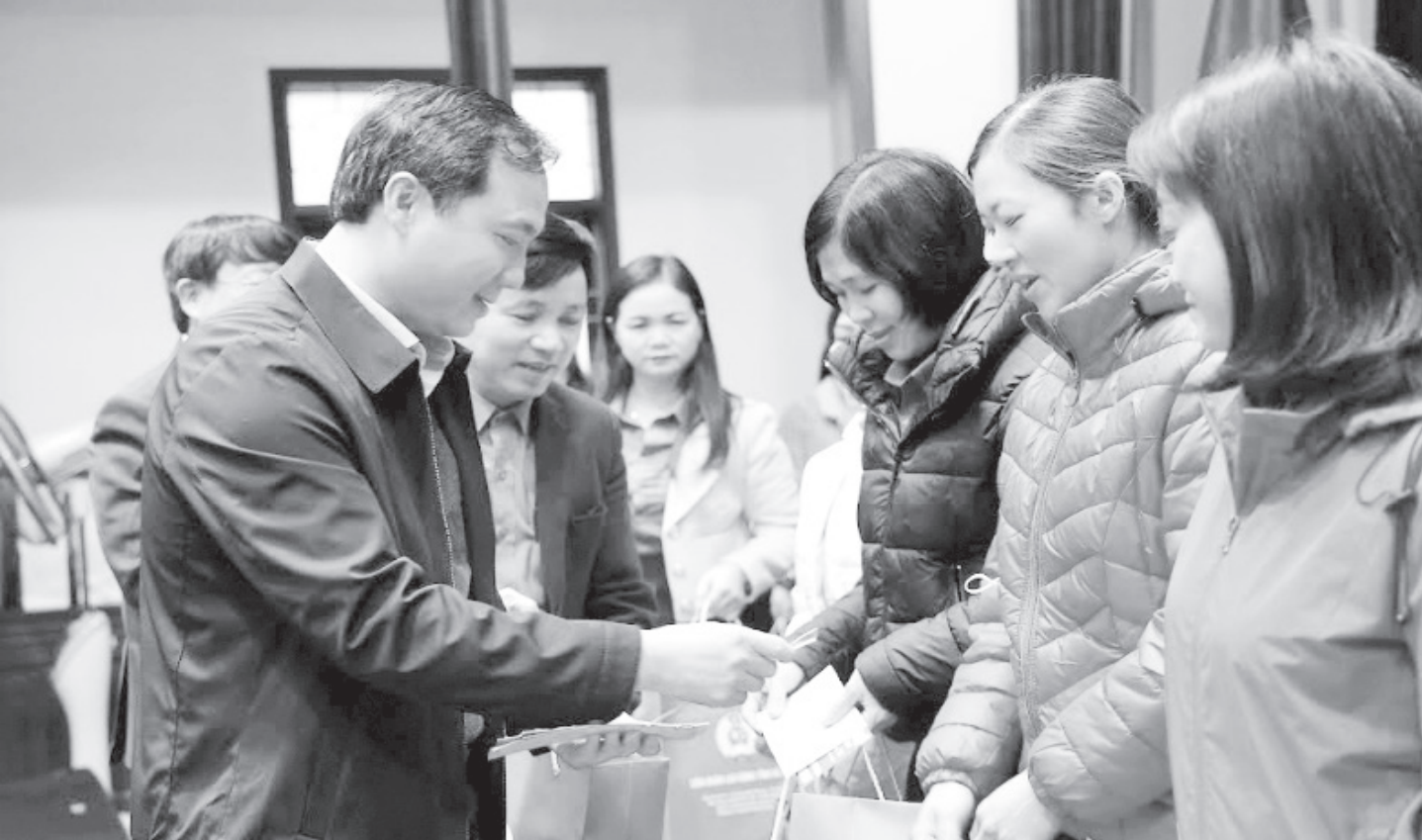
Bí thư Tỉnh ủy Hoàng Trung Dũng dự và trao quà cho công nhân lao động tại chương trình Tết sum vầy - Xuân chia sẻ năm 2024 do Liên đoàn Lao động Thành phố Hà Tĩnh tổ chức.