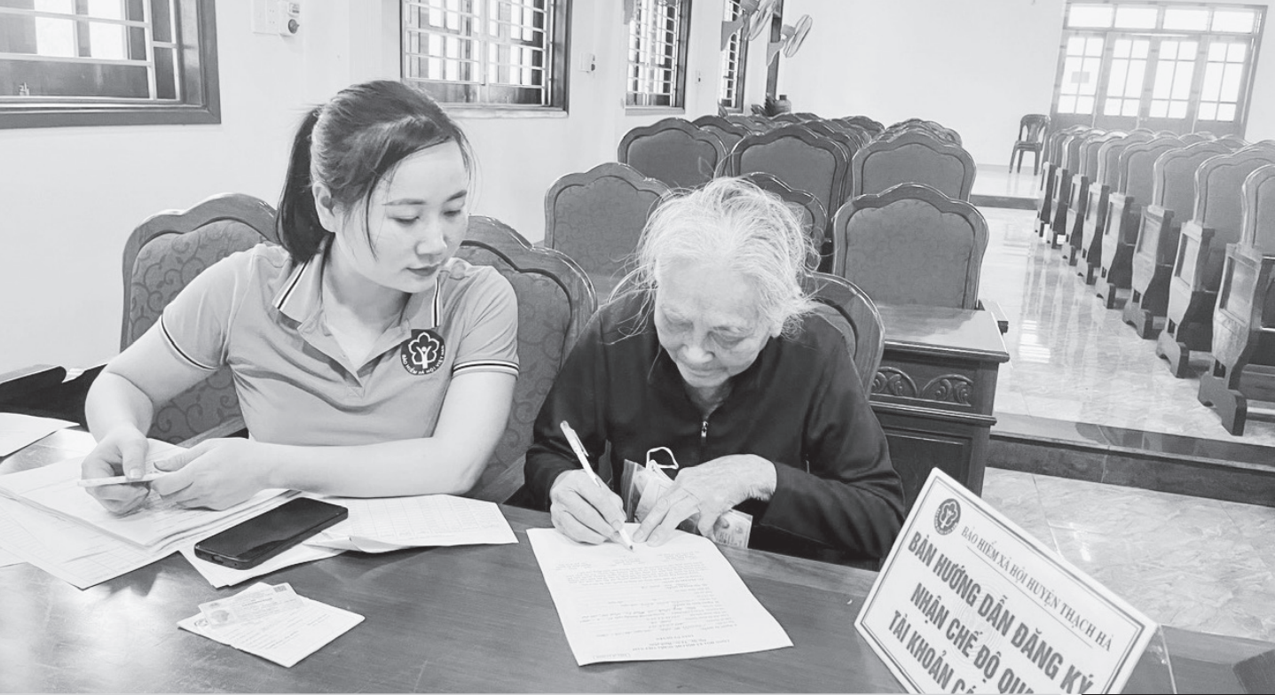
Viên chức BHXH huyện Thạch Hà hướng dẫn người dân đăng ký nhận chế độ BHXH qua tài khoản cá nhân, tại điểm chi trả xã Thạch Trị.