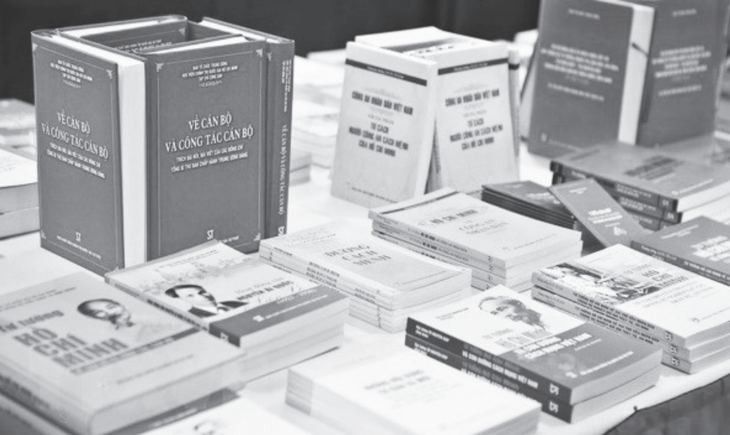
Học tập lý luận chính trị không chỉ là trách nhiệm, nghĩa vụ mà còn là quyền lợi của mỗi cán bộ, đảng viên