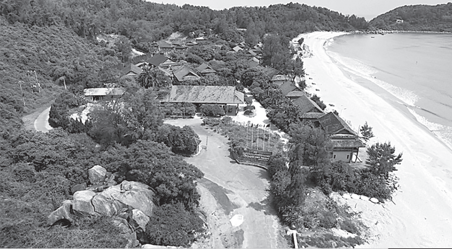
Bãi biển Quỳnh Viên bên núi Long Ngâm (Thạch Hải, Thạch Hà) ngày nay với huyền tích Chử Đồng Tử tâm sư học đạo