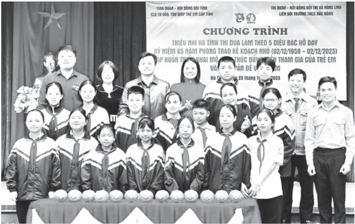
Hội đồng Đội tỉnh Hà Tĩnh triển khai mô hình “Nuôi heo tiết kiệm” trong các liên đội, đội viên toàn tỉnh

Hòa cùng dòng chảy lịch sử 83 năm phát triển và trưởng thành của tổ chức Đội TNTP Hồ Chí Minh, dưới sự chăm lo, dìu dắt của cấp ủy, chính quyền, tổ chức Đoàn phụ trách trực tiếp, Đội TNTP Hồ Chí Minh tỉnh Hà Tĩnh đã và đang phát huy vai trò là tổ chức của thiếu nhi, triển khai nhiều hoạt động, phong trào đồng hành cùng đội viên, thiếu nhi trong học tập, rèn luyện.