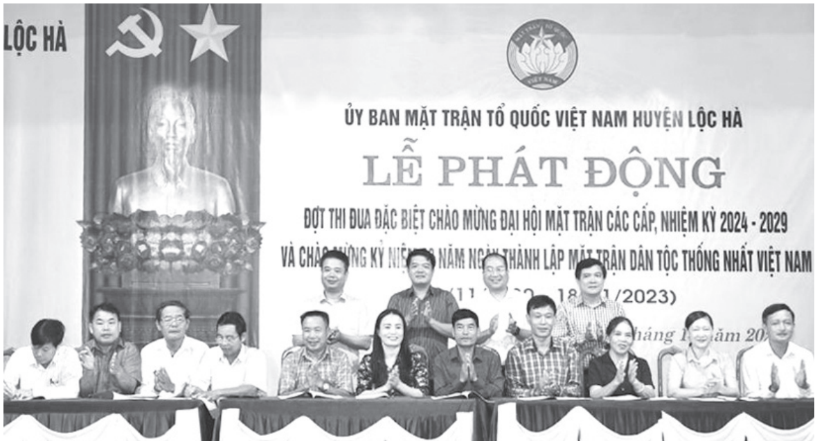
Ủy ban MTTQ Việt Nam huyện Lộc Hà tổ chức Lễ phát động đợt thi đua đặc biệt chào mừng Đại hội MTTQ các cấp nhiệm kỳ 2024-2029

Năm 2024 là năm diễn ra Đại hội Mặt trận Tổ quốc Việt Nam các cấp, tiến tới Đại hội đại biểu MTTQ Việt Nam tỉnh Hà Tĩnh lần thứ XV, nhiệm kỳ 2024 - 2029. Đây là sự kiện chính trị quan trọng đối với Mặt trận Tổ quốc Việt Nam các cấp và các tầng lớp Nhân dân, nhằm tổng kết, đánh giá tình hình, kết quả thực hiện công tác Mặt trận từ cơ sở đến tỉnh trong nhiệm kỳ qua, đồng thời rút ra những bài học kinh nghiệm, xây dựng phương hướng, nhiệm vụ trong nhiệm kỳ tới.