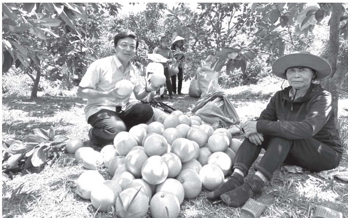
“Người dân thôn Phú Lễ, xã Hương Trạch vui mừng, phấn khởi thu hoạch mùa bưởi Phúc Trạch”

Việc chỉ đạo, vận động xây dựng khu dân cư thông minh thể hiện sự bắt nhịp của người dân trong cuộc cách mạng 4.0, nông thôn Hương Khê đang chuyển mình mạnh mẽ trong thực hiện công cuộc chuyển đổi