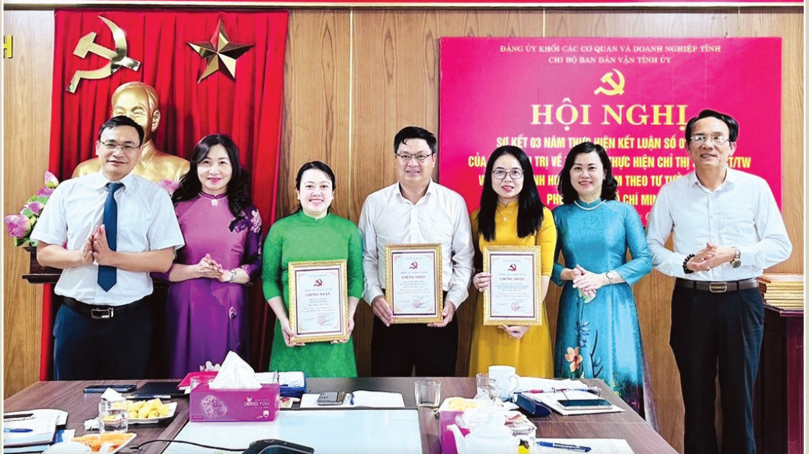
Chi bộ Ban Dân vận Tổ chức hội nghị sơ kết 03 năm thực hiện Kết luận số 01 - KL/TW và biểu dương các điển hình tiên tiến trong học tập và làm theo lời Bác, giai đoạn 2021 - 2024