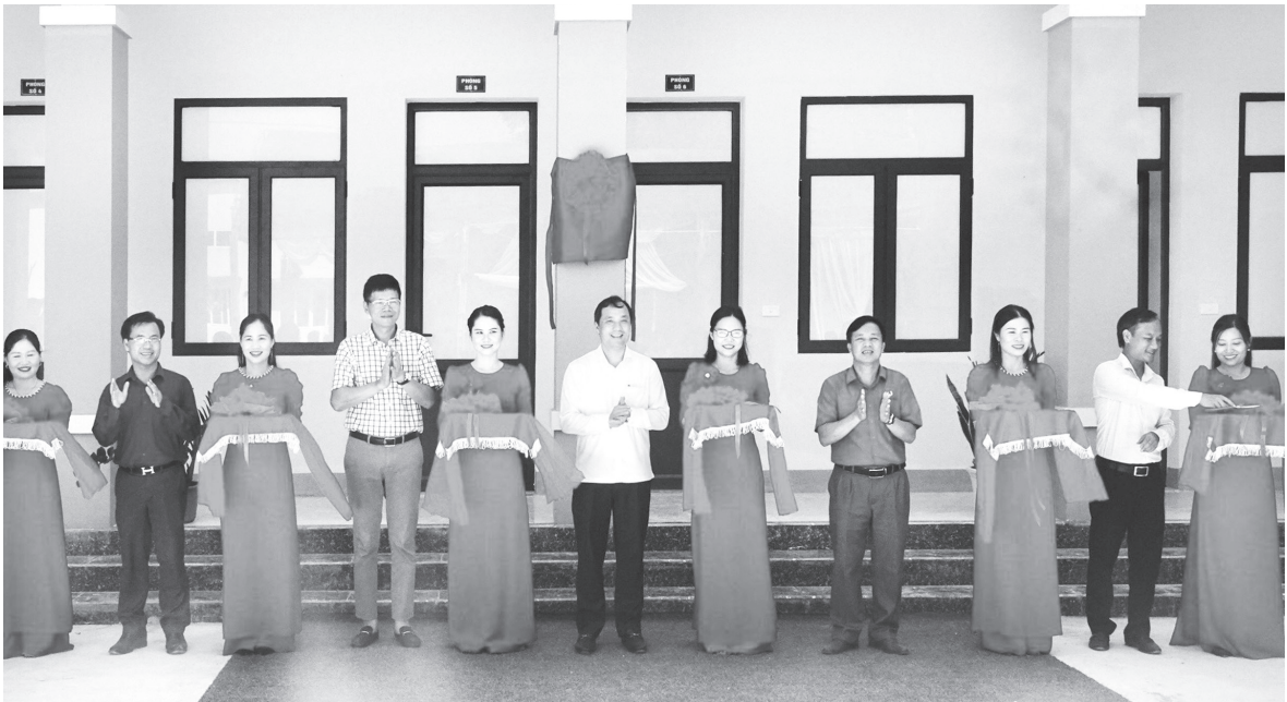
Đ/c Hoàng Trung Dũng - UVBCH TW Đảng, Bí thư Tỉnh ủy, Chủ tịch HĐND tỉnh cùng lãnh đạo Báo Lao động, LĐLĐ tỉnh cắt băng khánh thành Nhà nội trú cho đoàn viên tại xã miền núi Hương Liên, huyện Hương Khê

Trong những năm qua, với sự quan tâm lãnh đạo, chỉ đạo của Ban Chấp hành Đảng bộ tỉnh, Ban Thường vụ Tỉnh ủy và cấp ủy các cấp, phát huy vai trò của cả hệ thống chính trị, công tác dân vận trên địa bàn tỉnh không ngừng đổi mới và nâng cao chất lượng, hiệu quả hoạt động, đạt được nhiều kết quả thiết thực góp phần quan trọng vào những thành tựu chung của tỉnh nhà, nhân lên niềm tin giữa Đảng, chính quyền và Nhân dân.