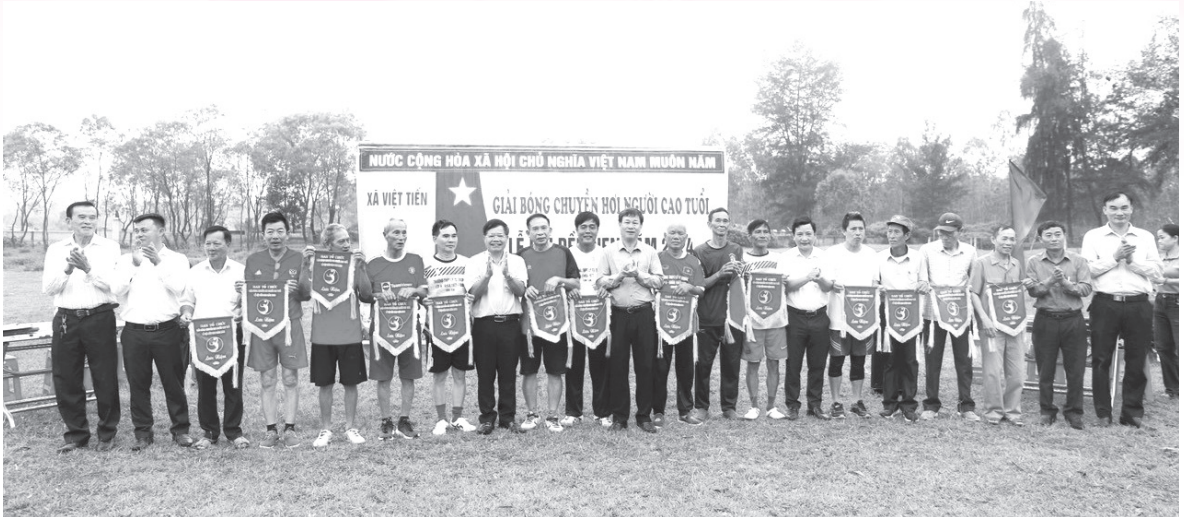
Người cao tuổi Hà Tĩnh hằng say tham gia các phong trào thể dục, thể thao

95% NCT); 24.840 NCT được hưởng trợ cấp bảo trợ xã hội; 49.488 NCT hưởng trợ cấp lương hưu; 53.400 NCT hưởng chế độ BHXH. Trong năm 2023, các cấp hội phối hợp với bệnh viện các tuyến huyện, tỉnh thăm khám, kê đơn, phát thuốc miễn phí, mổ mắt cho 122.439 NCT và có 58.223 NCT có số theo dõi sức khoẻ ban đầu.