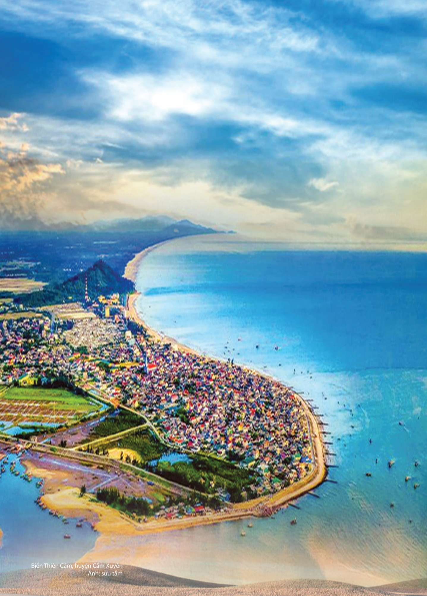
Biển Thiên Cầm, huyện Cẩm Xuyên