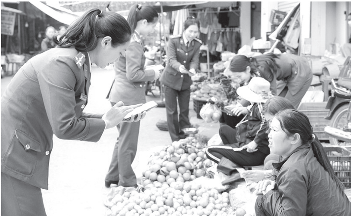
Các lực lượng tổ chức tuyên truyền, cài đặt VNeID mức độ 2 tại chợ Phố Châu

an ninh nhân dân vững chắc. Thời gian qua, công an huyện Hương Sơn đã chỉ đạo tập trung đẩy mạnh công tác xây dựng phong trào toàn dân bảo vệ an ninh Tổ quốc với nhiều cách làm hay, sáng tạo, đạt được những kết quả đáng ghi nhận.