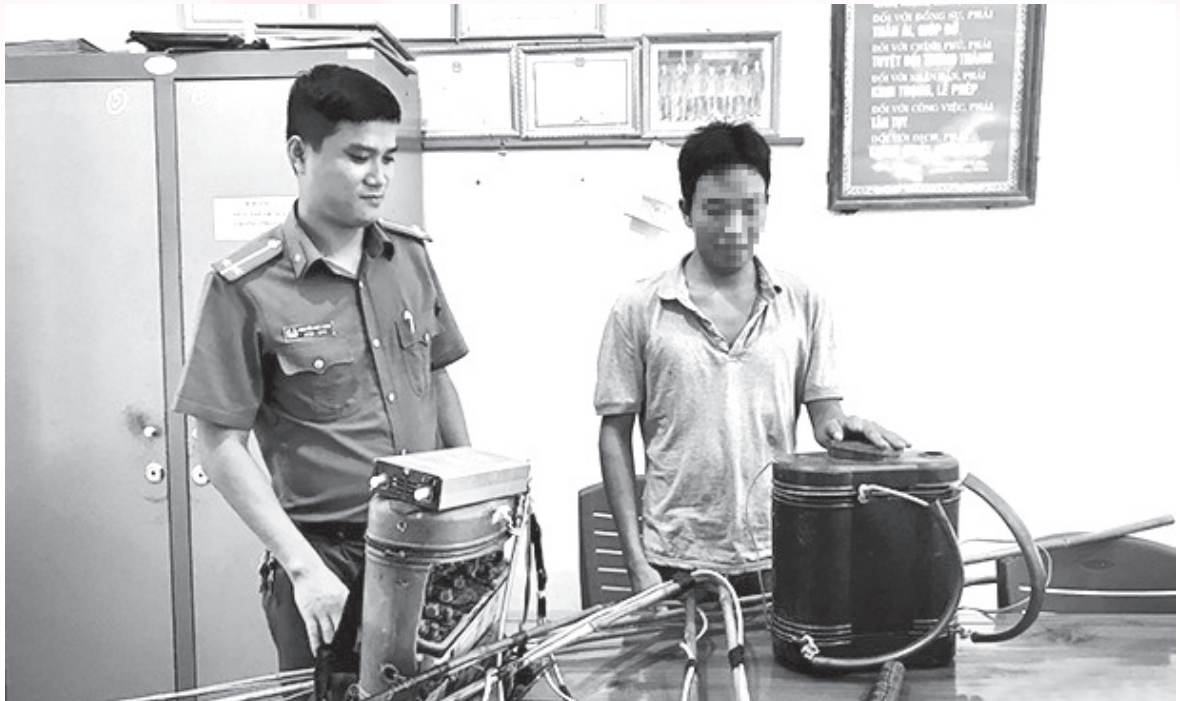
Công an huyện Hương Sơn vận động người dân giao nộp bình kích điện