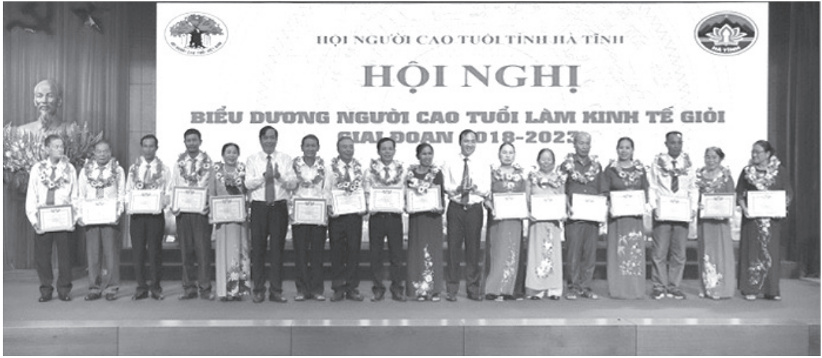
Người cao tuổi làm kinh tế giỏi giai đoạn 2018 - 2023 được Hội người cao tuổi tỉnh nhà biểu dương