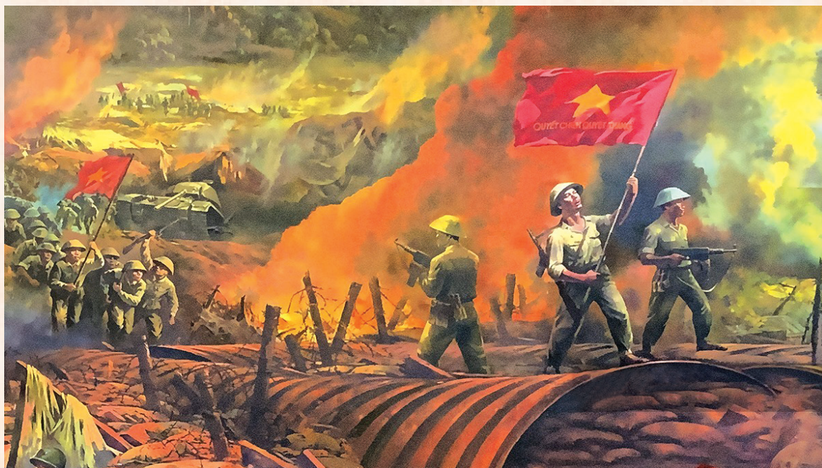
Ngày 7/5/1954: Chiến dịch Điện Biên Phủ giành thắng lợi

Ngày 7/5/1954, chiến dịch lịch sử Điện Biên Phủ kết thúc. Chiến thắng lịch sử Điện Biên Phủ “lừng lẫy năm châu, chấn động địa cầu” là chiến thắng lớn nhất trong 9 năm kháng chiến trường kỳ chống thực dân Pháp, mở đường đi tới thắng lợi của ta tại Hội nghị Giơnevơ năm 1954. Trong chiến công vang dội này có sự đóng góp đáng kể của quân và dân Hà Tĩnh.