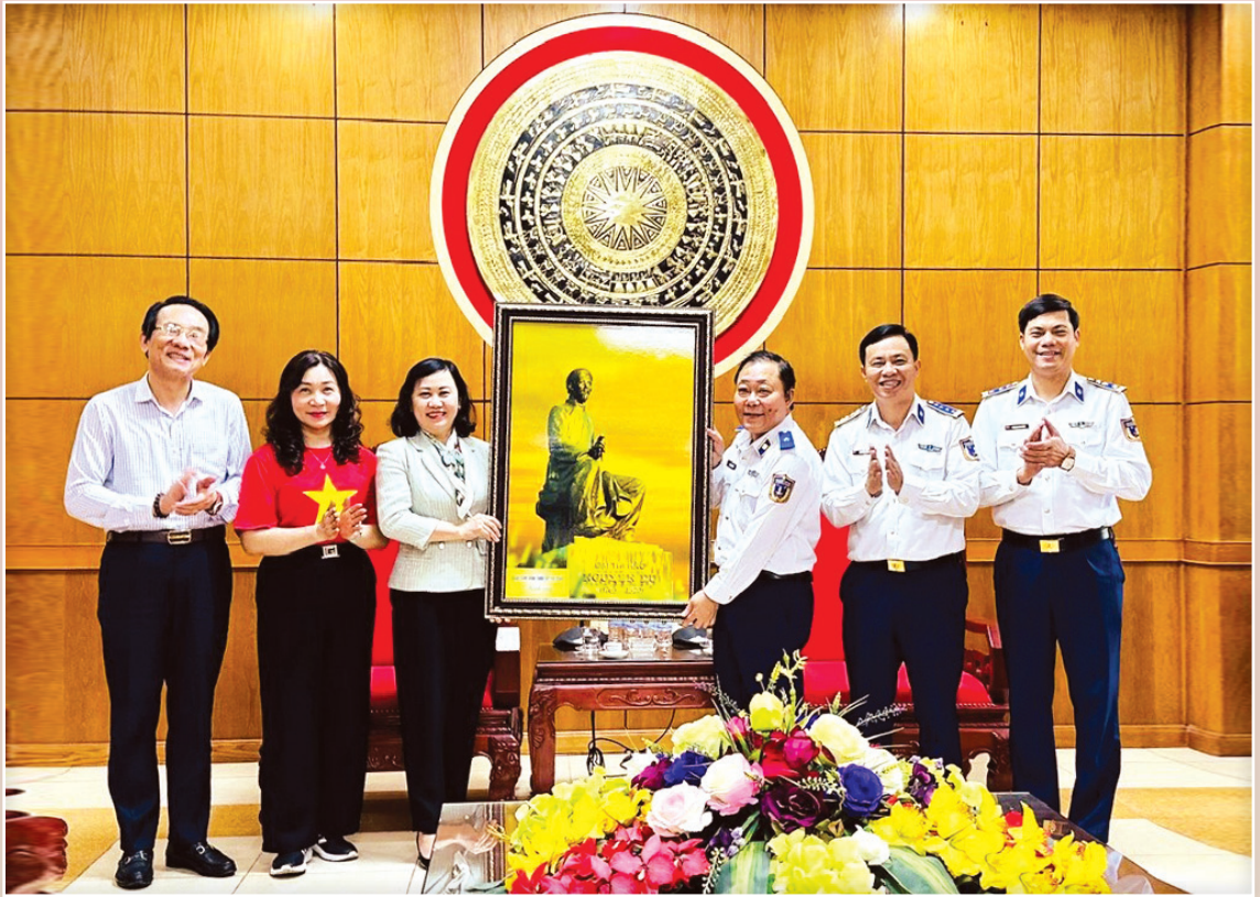
Lãnh đạo Ban Dân vận Tỉnh ủy Hà Tĩnh tặng tranh kỷ niệm cho Bộ Tư Lệnh Cảnh sát biển vùng 1 nhân chuyến trao đổi kinh nghiệm về chương trình "Cảnh sát biển đồng hành cùng ngư dân" tháng 3/2024