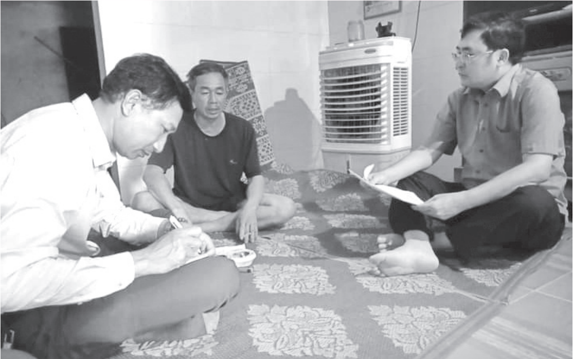
Cán bộ dân vận trực tiếp đến từng gia đình hộ dân để tuyên truyền, vận động giải phóng mặt bằng hạng mục Bãi Xi, nhà máy Nhiệt điện II, tại xã Kỳ Lợi