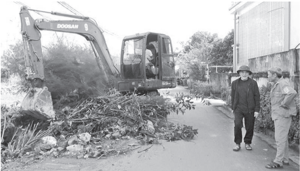
Người dân Tổ Dân Phố Đại Nghĩa, thị trấn Đức Thọ đồng thuận và phân khởi làm nương thoát nước ở khu dân cư - công trình chào mừng kỷ niệm 120 năm ngày sinh Đồng chí Trần Phú - Tổng Bí thư đầu tiên của Đảng (01/5/1904 - 01/5/2024)

phục vụ xây dựng NTM, 100% xã đạt chuẩn NTM, 1 xã đạt NTM kiểu mẫu. Đặc biệt năm 2020, Đức Thọ được Thủ tướng Chính phủ công nhận huyện đạt chuẩn NTM. Kết quả đó có sự đóng góp quan trọng của công tác dân vận của cả hệ thống chính trị các cấp trong toàn huyện.