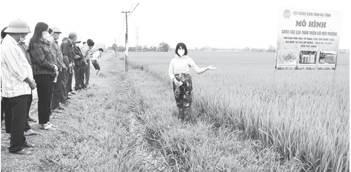
Hội Nông dân Hà Tĩnh triển khai mô hình canh tác lúa thân thiện với môi trường tại xã Tân Lâm Hương

kỳ, do vậy trách nhiệm của các cấp hội đóng vai trò rất quan trọng trong việc phát động phong trào “Nông dân thi đua sản xuất, kinh doanh giỏi đoàn kết giúp nhau làm giàu và giảm nghèo bền vững” đến tuyên truyền, vận động, hướng dẫn cán bộ hội viên, nông dân xây dựng và nhân rộng các mô hình. Chỉ tính riêng năm 2023, các cấp Hội Nông dân toàn tỉnh đã tổ chức 4.345 buổi tuyên truyền cho 437.126 lượt hội viên nông dân về chủ trương, nghị quyết của Đảng, chính sách, pháp luật của Nhà nước, nhất là trong sản xuất nông nghiệp theo hướng công nghệ cao, trong chuyên dịch cơ cấu kinh tế, tích tụ ruộng đất... thông qua nhiều hình thức đa dạng, phong phú. Hàng năm, Hội Nông dân tỉnh xây dựng kế hoạch tổ chức phát