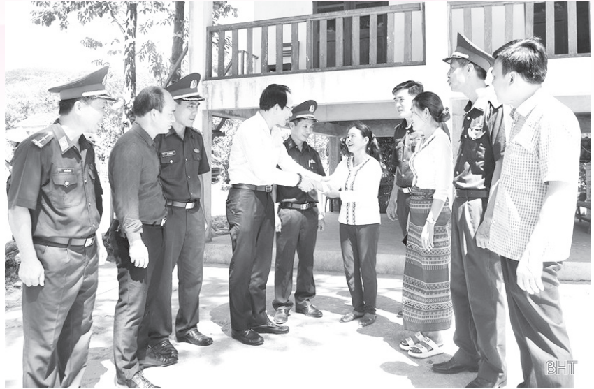
Đoàn công tác Ban Dân vận Tỉnh ủy đến thăm các hộ dân tộc Chứt tại bản Rào Tre