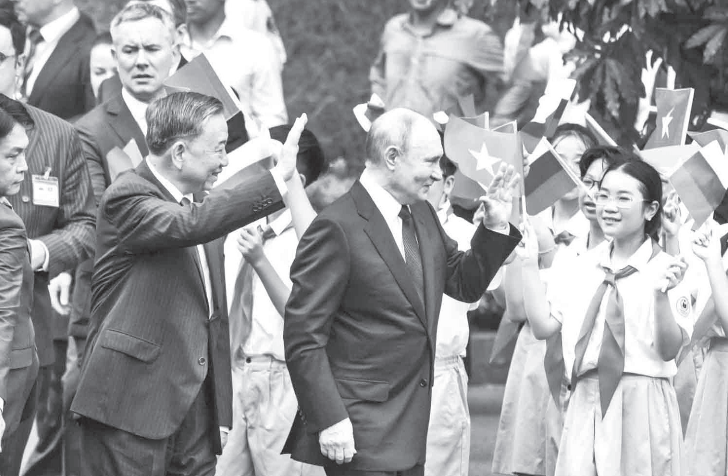
Chủ tịch nước Tô Lâm và Tổng thống Putin vẫy chào các em thiếu nhi tham gia lễ đón.