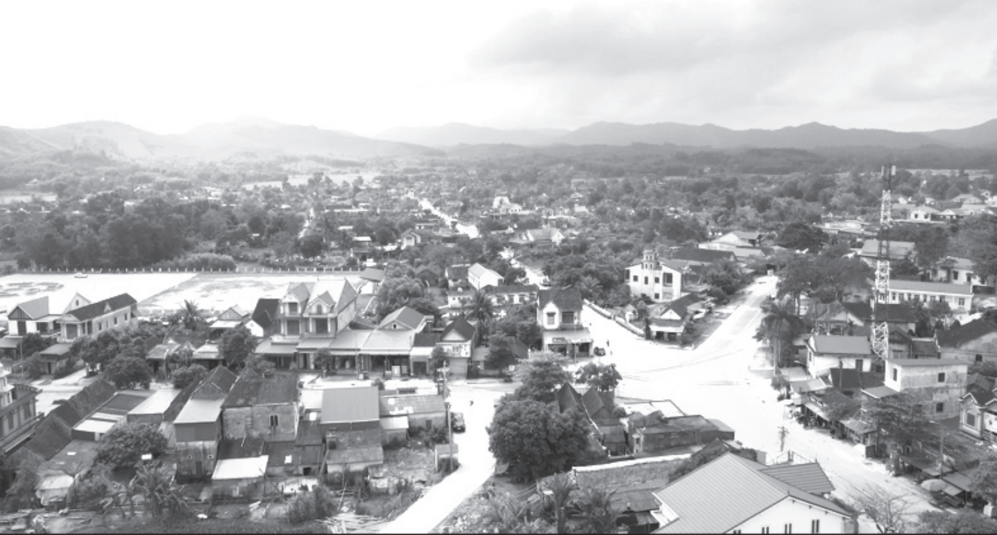
Thị trấn Đồng Lộc hôm nay