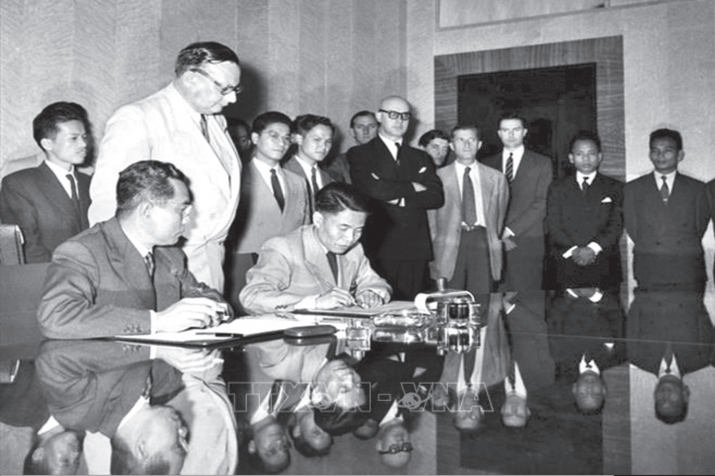
Ngày 20/7/1954, Thủ trưởng Bộ Quốc phòng Tạ Quang Bửu thay mặt Chính phủ và Bộ Tổng tư lệnh Quân đội nhân dân Việt Nam ký Hiệp định đình chiến ở Việt Nam. Ngay sau đó, Hiệp định đình chiến ở Lào và Campuchia cũng được ký kết.