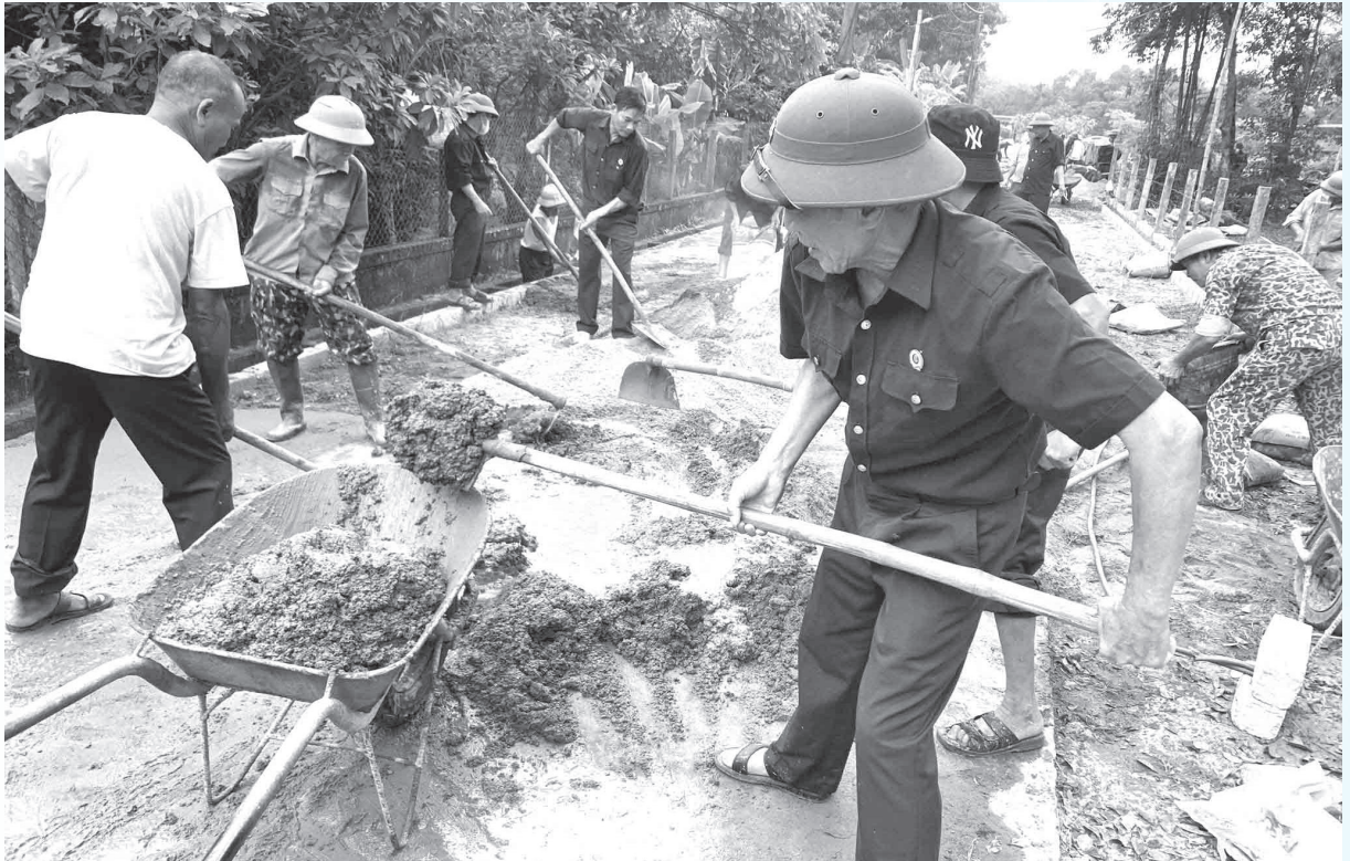
Sôi nổi khí thế xây dựng nông thôn mới ở các địa phương huyện Thạch Hà