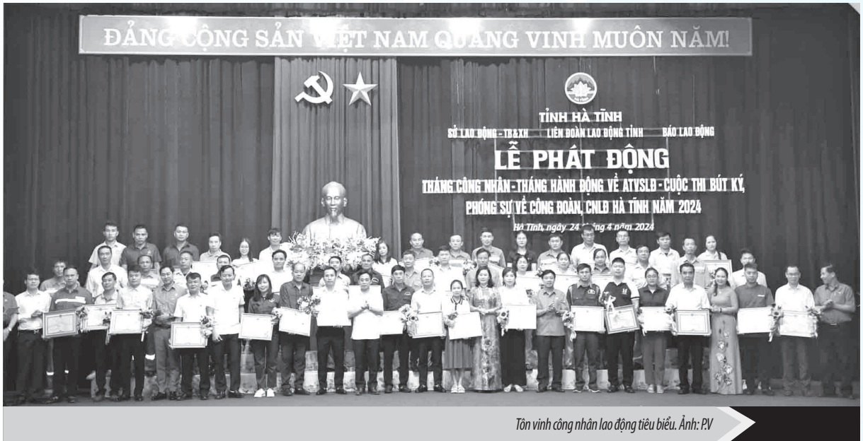
Tôn vinh công nhân lao động tiêu biểu.

TUV, Chủ tịch Liên đoàn Lao động tỉnh Hà Tĩnh