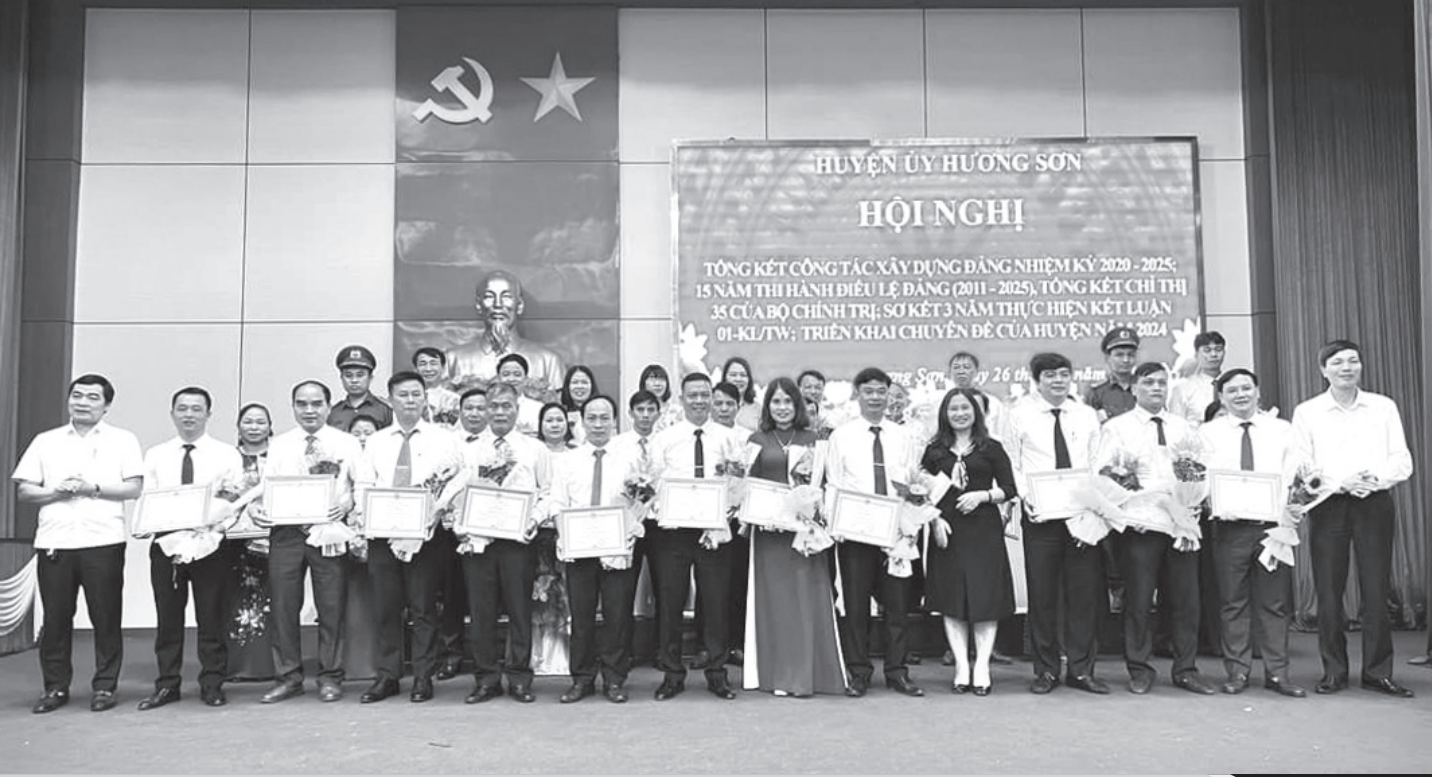
Hương Sơn vinh danh các tập thể, cá nhân điển hình trong học tập và làm theo Bác.

ĐẢNG CỘNG SẢN VIỆT NAM QUANG VINH MUÔN NĂM!