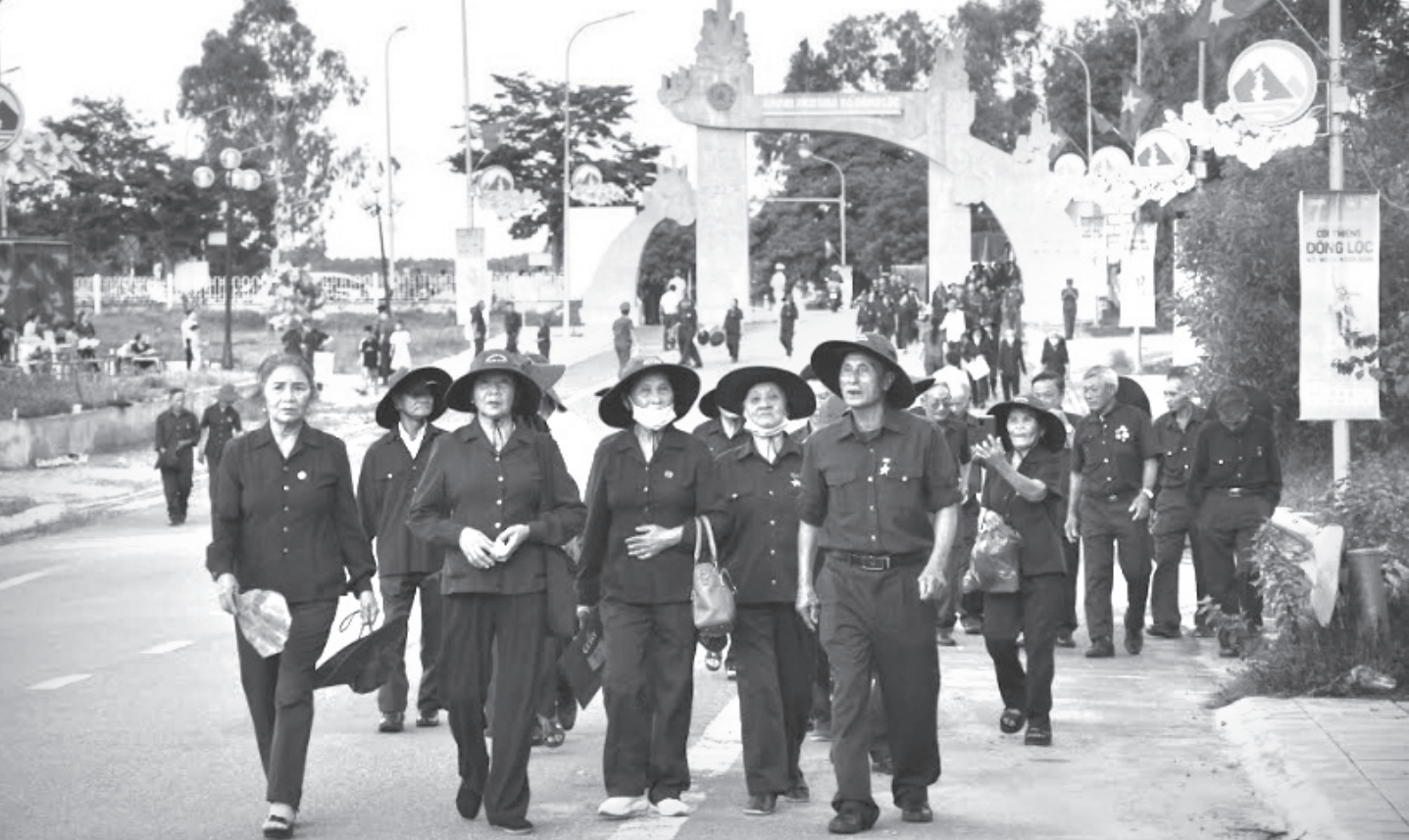
Các cựu TNXP về thăm Đồng Lộc