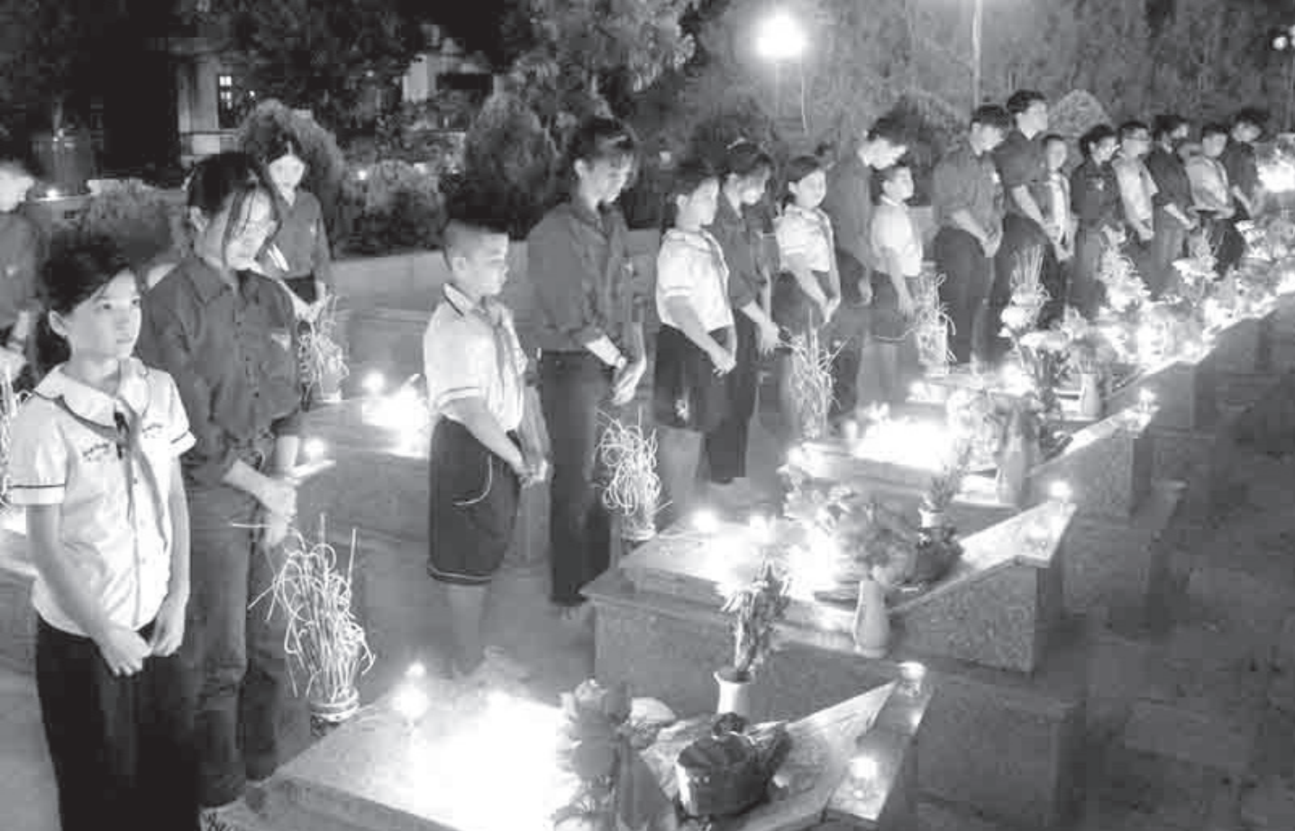
Lễ thắp nến tri ân các anh hùng liệt sĩ thể hiện đạo lý “Uống nước nhớ nguồn”, bày tỏ lòng biết ơn sâu sắc đối với sự hy sinh to lớn của lớp lớp thế hệ cha anh.