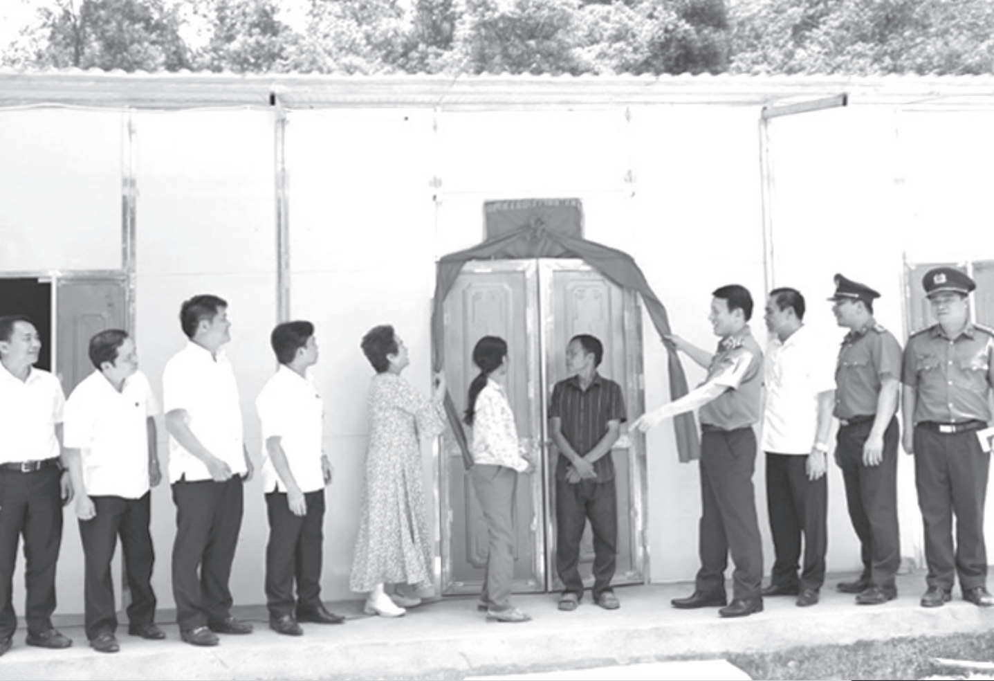
Bộ Công an phối hợp trao tặng nhà tình nghĩa cho người dân Hà Tĩnh