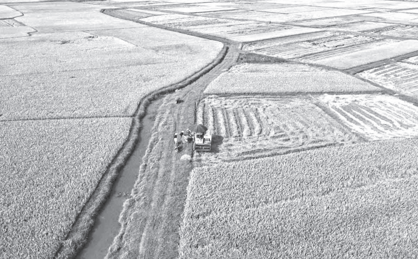
Bà con nông dân thu hoạch lúa vụ Xuân năm 2024.