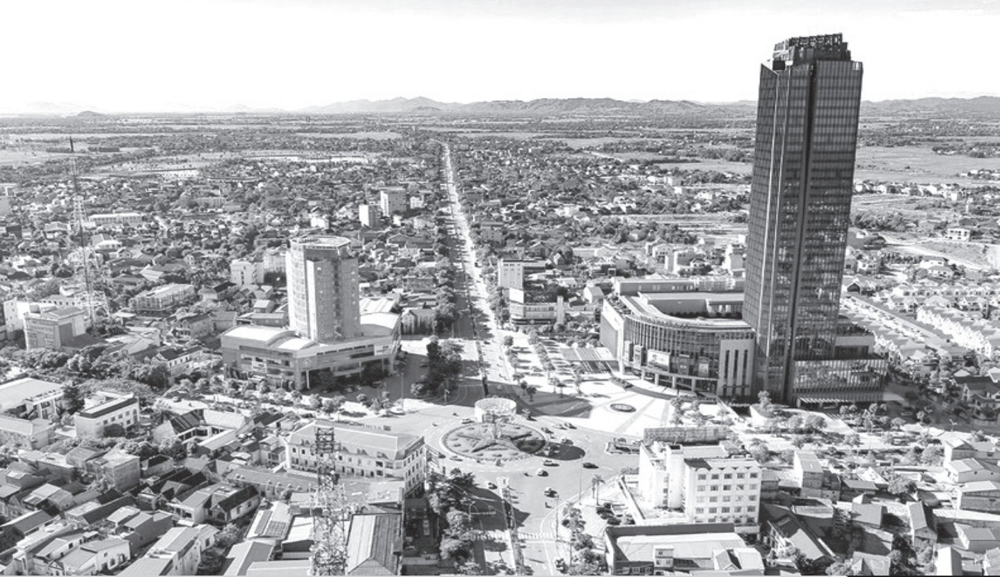
Thành phố Hà Tĩnh ngày nay.