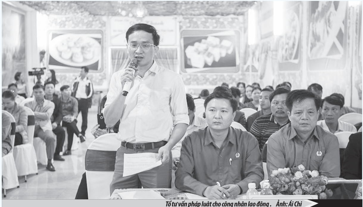
Tổ tư vấn pháp luật cho công nhân lao động.