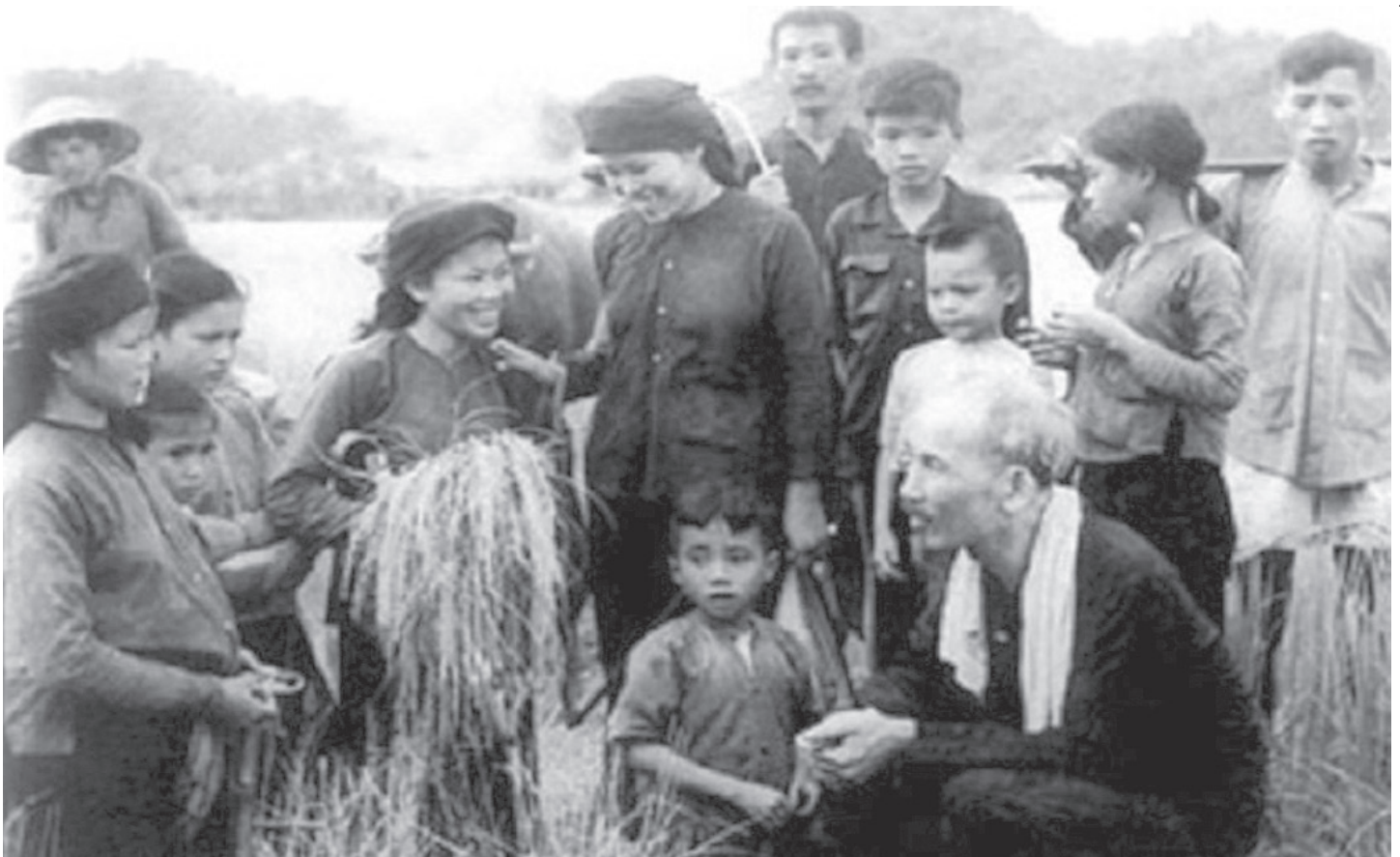
Ảnh: Bác ra đồng cùng bà con nông dân.