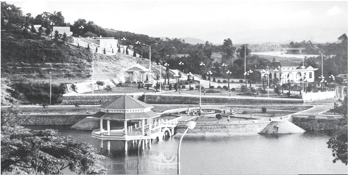
Khu lưu niệm Cố Tổng Bí thư Trần Phú