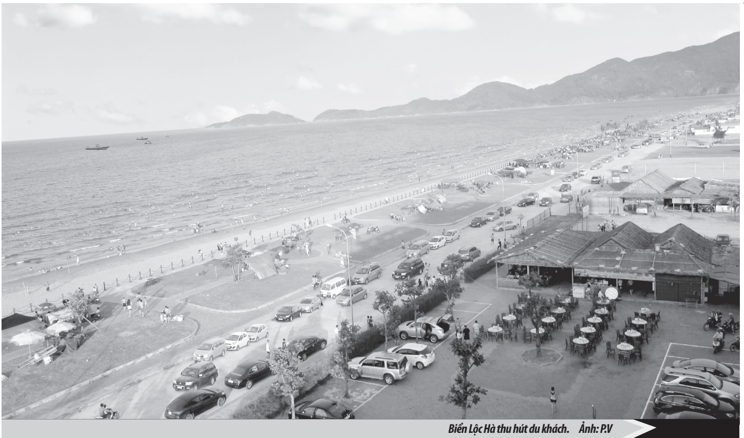
Biển Lộc Hà thu hút du khách.