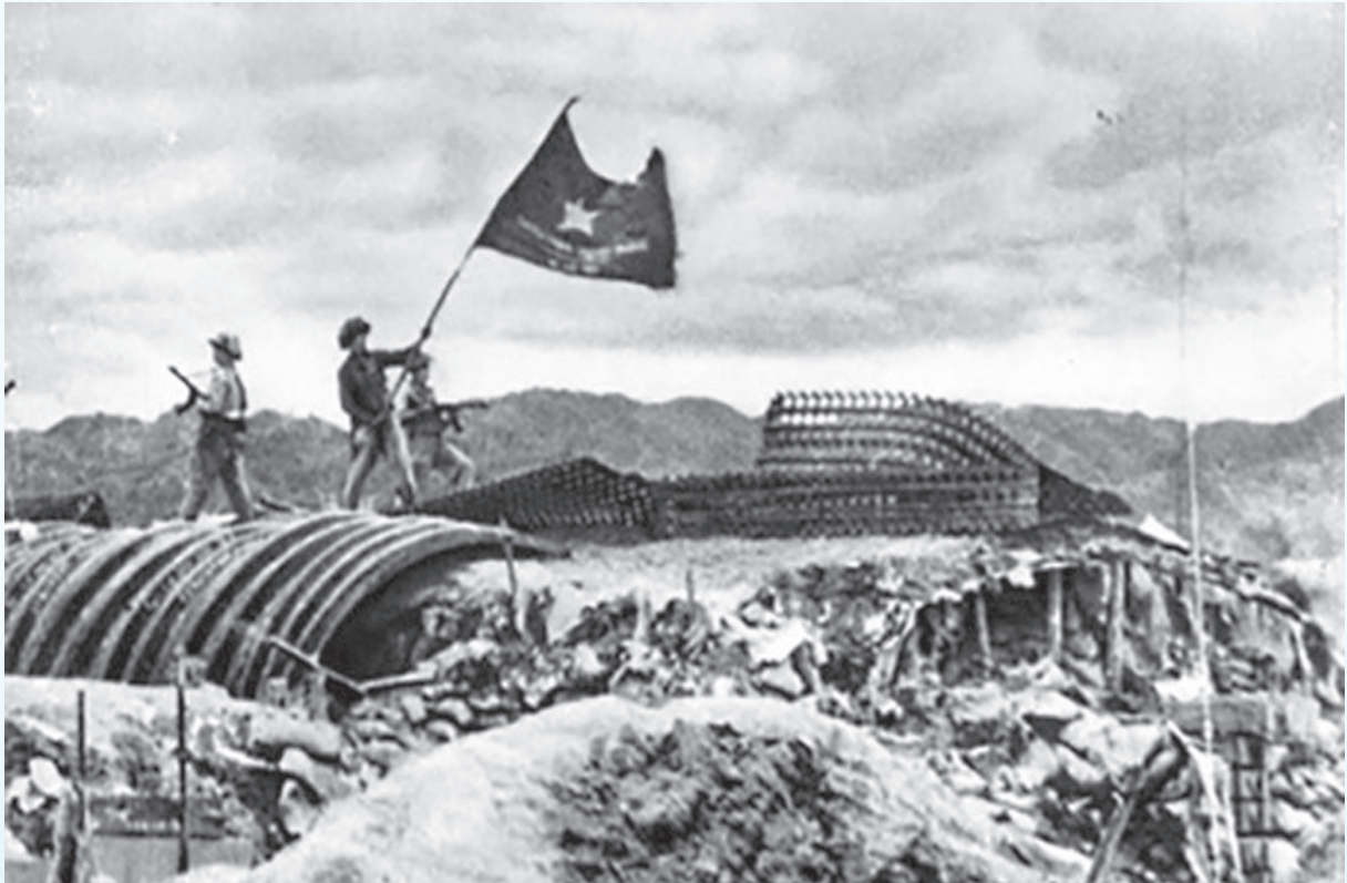
Chiến thắng Điện Biên Phủ.

Thắng lợi của Chiến dịch Điện Biên Phủ bắt nguồn từ nhiều nguyên nhân, song sức mạnh của khối đại đoàn kết toàn dân tộc là một trong những nhân tố quyết định. Sức mạnh to lớn đó dựa trên nền tảng tư tưởng Hồ Chí Minh, tạo nên chiến thắng lừng lẫy năm châu, chấn động địa cầu; trở thành bài học kinh nghiệm mang tính nguyên tắc; có ý nghĩa lý luận và thực tiễn sâu sắc trong công cuộc xây dựng và bảo vệ Tổ quốc; vì mục tiêu dân giàu, nước mạnh, dân chủ, công bằng, văn minh.