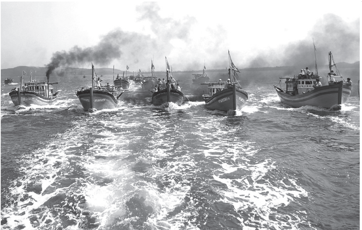
Ra khơi.