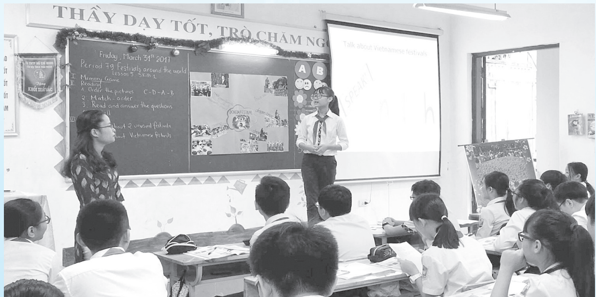
Đổi mới phương pháp dạy học: Ảnh minh họa

Trong khi nhiều cơ quan báo chí, nhiều luật sư, nhiều nhà giáo lên tiếng kịp thời, phân tích thấu đáo, bình luận có lý, có tình nhằm giúp công luận có một cái nhìn đúng đắn, khách quan về vụ việc, thì đáng tiếc vẫn có những ý kiến nhìn nhận vấn đề mang nặng tính áp đặt chủ quan, thiếu thiện chí, thiếu nhân văn,