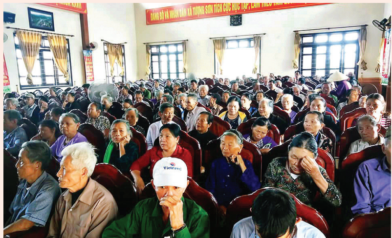
Hội nghị Phổ biến giáo dục pháp luật cho người cao tuổi tại xã Tượng Sơn, huyện Thạch Hà

Ban Chỉ đạo giao nhiệm vụ trực tiếp cho Phòng Tư pháp - Cơ quan thường trực của Ban, đồng thời là Cơ