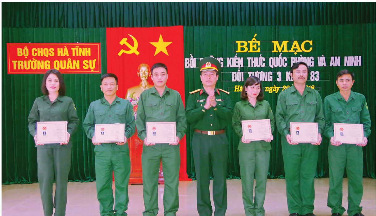
Bế mạc Bồi dưỡng kiến thức quốc phòng - an ninh đối tượng 3 khóa 86

H à Tĩnh là địa bàn chiến lược quan trọng của quân khu 4; là trọng điểm quốc phòng của cả nước; Tuy nhiên quá trình xử lý một số bộ phận còn thờ ơ cho rằng Quốc phòng là của Quân đội, An ninh là của Công an. Bồi dưỡng kiến thức Quốc phòng – An ninh (KTQPAN) cho các đối tượng là việc làm quan trọng, thường xuyên của cấp ủy Đảng, chính