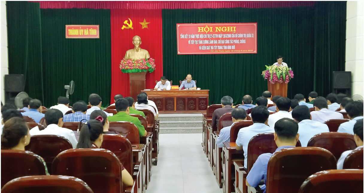
BTV Thành ủy tổng kết 10 năm thực hiện Chỉ thị 21 của Bộ Chính trị về tăng cường kiểm soát ma túy trong tình hình mới

Cùng với quá trình xây dựng thành phố đô thị loại II, xây dựng Đảng bộ trong sạch, vững mạnh, ngang tầm nhiệm vụ; cấp ủy, chính quyền thành phố Hà Tĩnh thường xuyên chú trọng tập trung lãnh đạo, chỉ đạo công tác cải cách tư pháp, đặt nhiệm vụ cải cách tư pháp trong mối quan hệ chặt chẽ với các yêu cầu, nhiệm vụ phát triển kinh tế - xã hội, đảm bảo quốc phòng - an ninh, giữ gìn trật tự an toàn xã hội của địa phương; nhằm xây dựng các cơ quan tư pháp ngày càng vững mạnh, bảo vệ công lý, thượng tôn pháp luật và bảo vệ quyền con người; góp phần thực hiện mục tiêu xây dựng thành phố Hà Tĩnh phát triển theo hướng văn minh, hiện đại, bền vững.