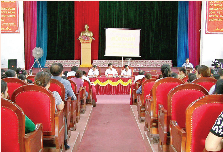
Lãnh đạo thị xã Kỳ Anh tổ chức đối thoại trực tiếp với công dân

Xác định công tác đối thoại với nhân dân và công tác tiếp công dân, giải quyết khiếu nại, tố cáo là nhiệm vụ quan trọng, thường xuyên của cả hệ thống chính trị nhằm kịp thời nắm bắt tâm tư, nguyện vọng, giải quyết quyền, lợi ích hợp pháp, chính đáng của nhân dân, góp phần giữ vững ổn định chính trị, trật tự an toàn xã hội ở địa phương.