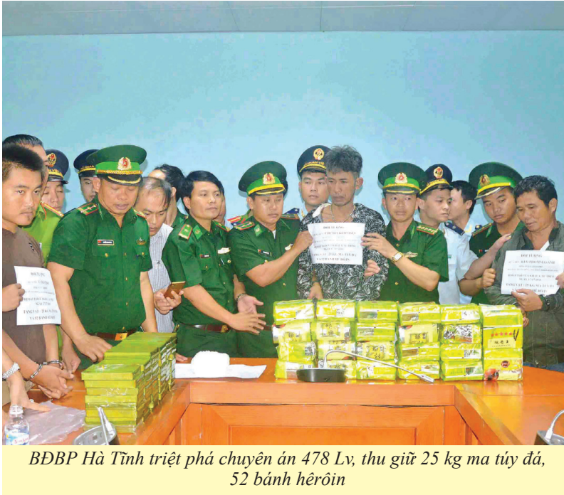
BĐBP Hà Tĩnh triệt phá chuyên án 478 Lv, thu giữ 25 kg ma túy đá, 52 bánh heroin

trật tự an toàn xã hội trên 2 tuyến biên giới tiếp tục diễn biến phức tạp. Bộ Chỉ huy BĐBP Hà Tĩnh tiếp tục lãnh đạo chỉ đạo, thực hiện tốt các nhiệm vụ: