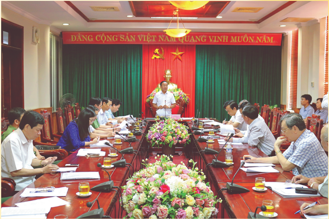
Thường trực Tỉnh ủy giao ban với các cơ quan khối Nội chính