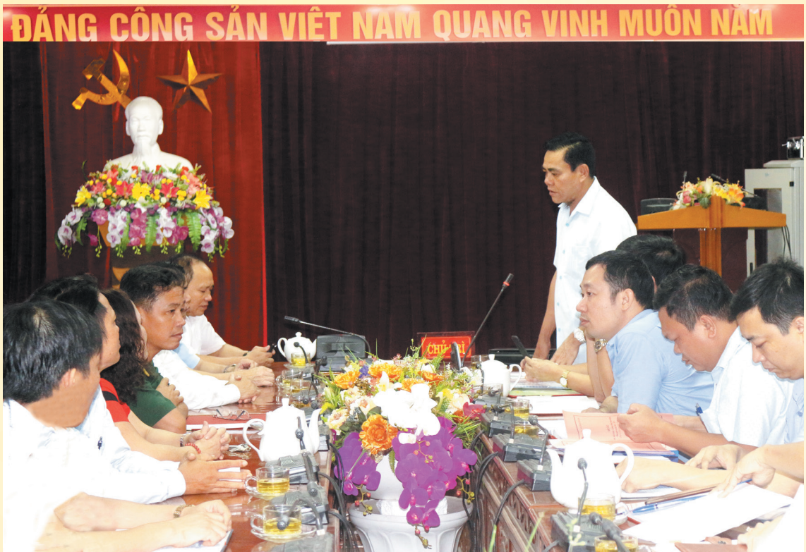
Đoàn công tác Ban Nội chính Tỉnh ủy làm việc với huyện Cẩm Xuyên