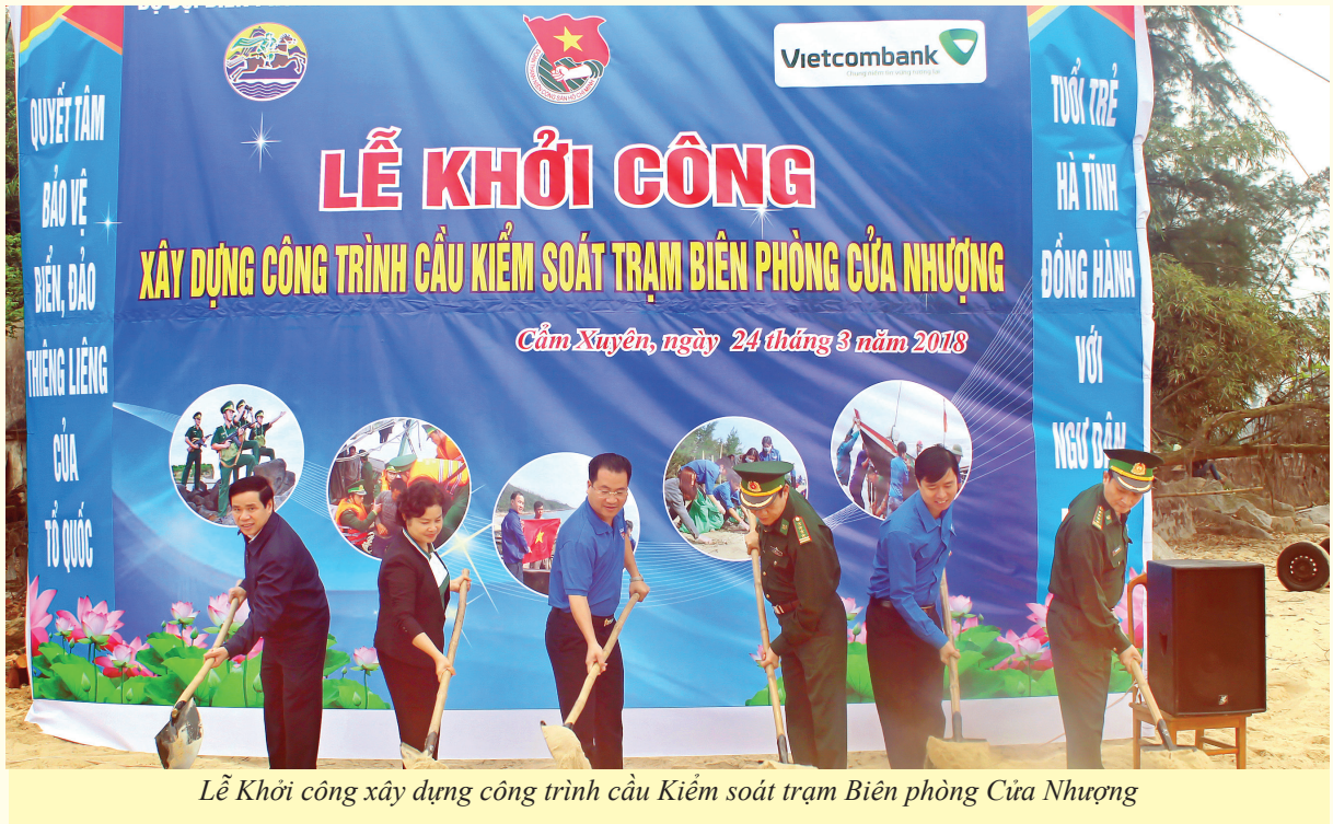
Lễ Khởi công xây dựng công trình cầu Kiểm soát trạm Biên phòng Cửa Nhượng

cấp sẵn sàng xông pha, đảm nhận những việc mới, việc khó, luôn có mặt kịp thời tại các điểm nóng, các địa bàn khó khăn tham gia giữ gìn ANTT, ATXH. Ngay sau khi xảy ra sự cố môi trường biển, Ban Thường vụ Tỉnh đoàn đã nhanh chóng thành lập Tổ công tác vào cắm chốt tại các xã, phường của thị xã Kỳ Anh tổ chức tuyên truyền, vận động ĐVTN và nhân dân ổn định tư tưởng, không bị kích động tham gia gây rối; tuyên truyền, vận động bà con nhân dân tích cực tham gia bầu cử Quốc hội khóa XIV, HĐND các cấp. Thành lập các Đội thanh niên tình nguyện tại chỗ và chi viện phối hợp