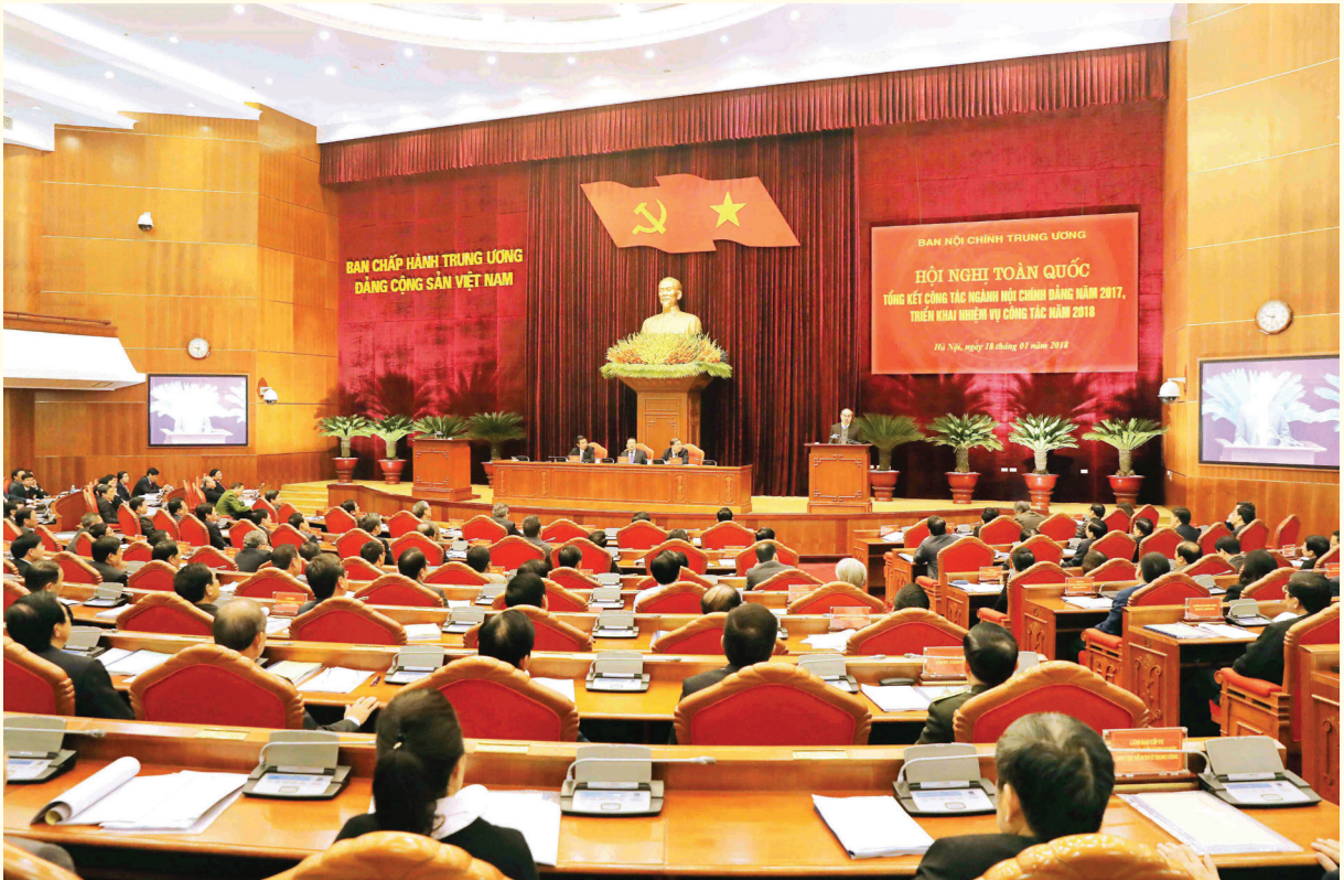
Hội nghị toàn quốc về công tác nội chính và phòng chống tham nhũng

Có thể nói tập trung xuyên tạc, nguy hiểm, tuyên truyền về chống tham nhũng là một trong những “con bài chính trị” nguy hiểm mà các thế lực thù địch đang lợi dụng để chống phá ta. Trước thực tế, tham nhũng đang là vấn đề hết sức nhức nhối và nhạy cảm gắn liền