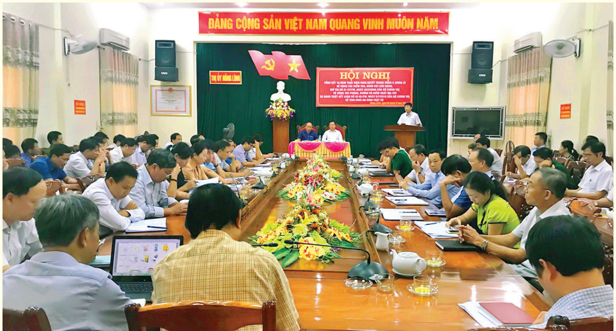
Hội nghị Tổng kết 10 năm thực hiện Nghị quyết TW 5 về tăng cường công tác kiểm tra, giám sát

T hời gian qua, nhiều chủ trương, nghị quyết, cơ chế, chính sách của thị xã Hồng Lĩnh được ban hành cơ bản đáp ứng yêu cầu thúc đẩy phát triển trên các lĩnh vực, Thị xã Hồng Lĩnh trở thành điểm sáng, đặc biệt là phát triển công nghiệp – tiểu thủ công nghiệp và thương mại - dịch vụ, thực hiện tốt xã hội hóa xây dựng các trung tâm thương mại, siêu thị và xây dựng các tiêu chí hạ tầng