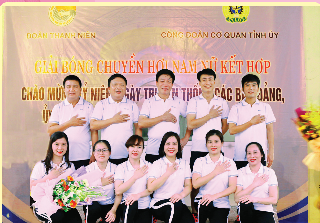
Đội bóng chuyên Ban Nội chính Tỉnh ủy tham gia giải bóng chuyên hời chào mừng kỷ niệm Ngày truyền thống của các Ban Đảng, Ủy ban Kiểm tra, Văn phòng cấp ủy năm 2018

Bản tin Nội chính Hà Tĩnh mong nhận được ý kiến đóng góp, cộng tác của các đồng chí và bạn đọc.