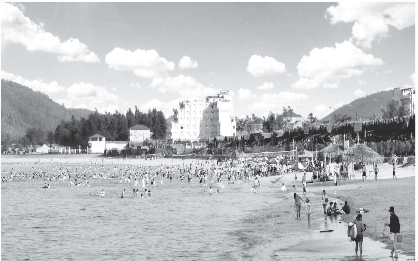
Bãi biển Thiên Cẩm.