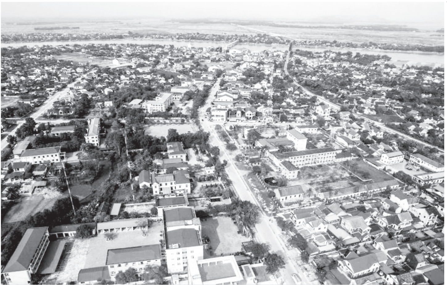
Thị trấn Đức Thọ hôm nay.