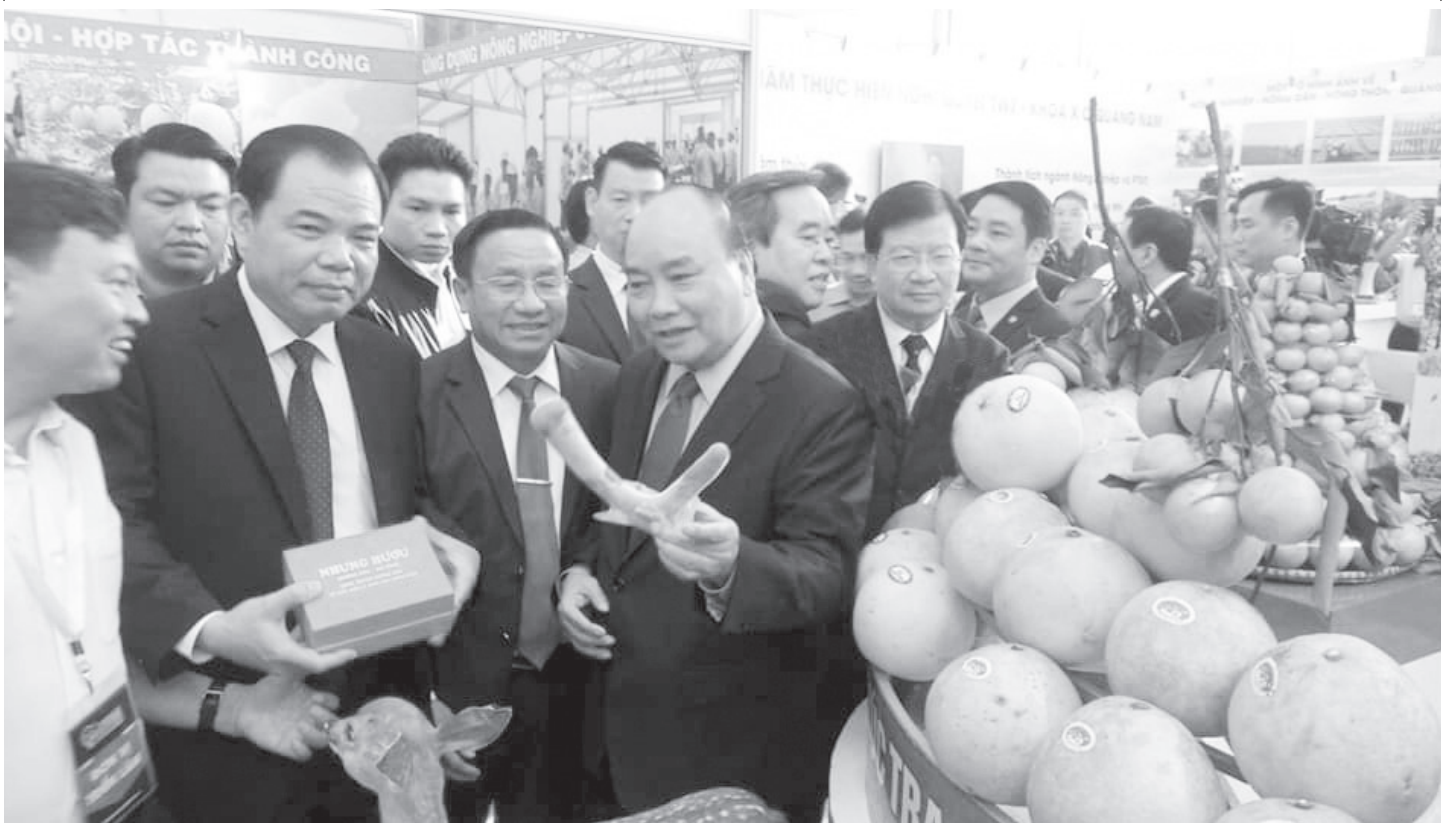
Thủ tướng Nguyễn Xuân Phúc cùng các đồng chí lãnh đạo Trung ương, lãnh đạo tỉnh tham quan gian hàng nông sản của Hà Tĩnh tại Hội nghị triển lãm 10 năm thực hiện Nghị quyết “Tam nông”.