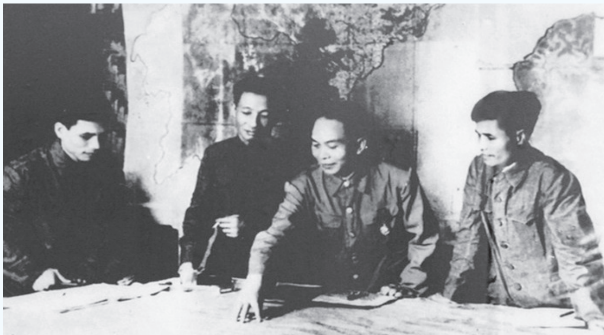
Đại tướng Võ Nguyên Giáp chỉ đạo cách đánh trong trận Điện Biên Phủ.