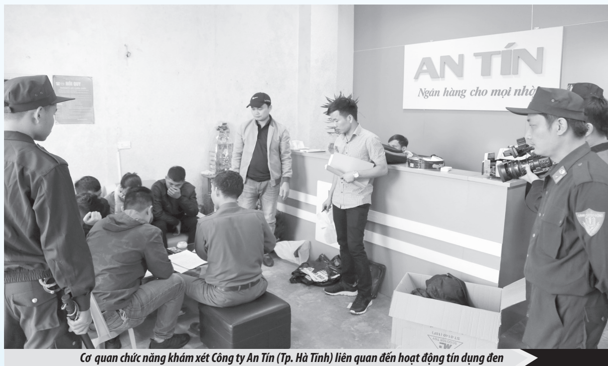
Cơ quan chức năng khám xét Công ty An Tín (Tp. Hà Tĩnh) liên quan đến hoạt động tín dụng đen