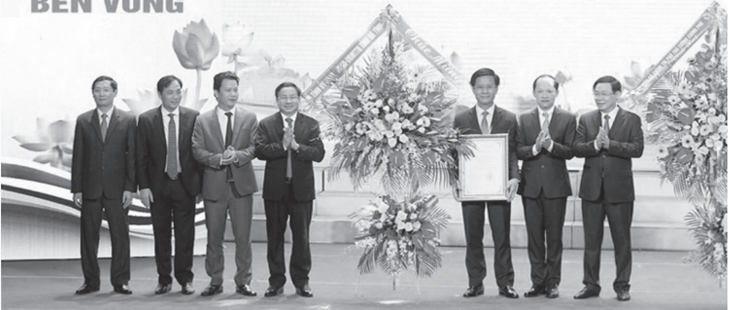
Phó Thủ tướng Chính phủ Vương Đình Huệ và các đồng chí lãnh đạo tỉnh trao bằng công nhận Thành phố Hà Tĩnh là đô thị loại II trực thuộc tỉnh.