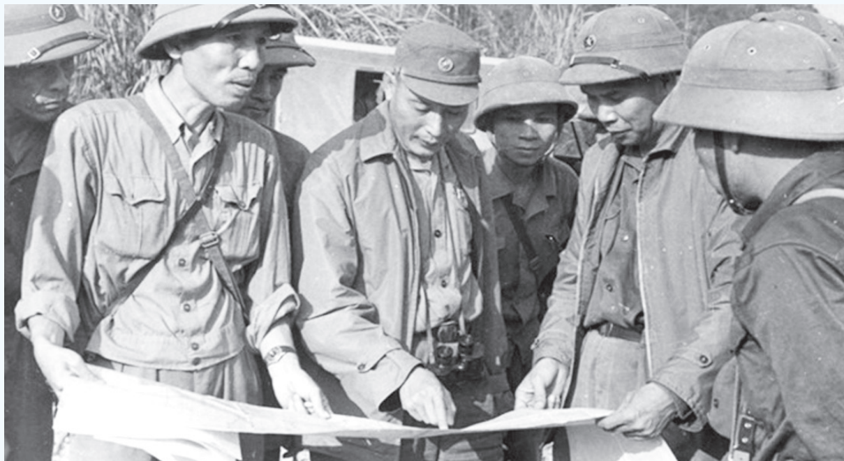
Trung tướng Đồng Sỹ Nguyên (giữa) nghe báo cáo về tình hình xăng dầu và vận tải khu vực 471 (ảnh chụp năm 1971). Ảnh tư liệu