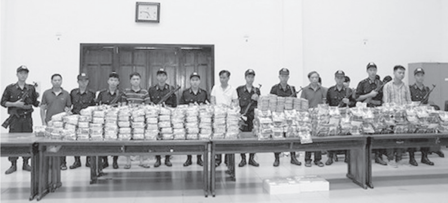
Công an Hà Tĩnh phối hợp với ngành bắt giữ các đối tượng, thu hồi 640kg ma túy “đá” và 100 bánh heroin.