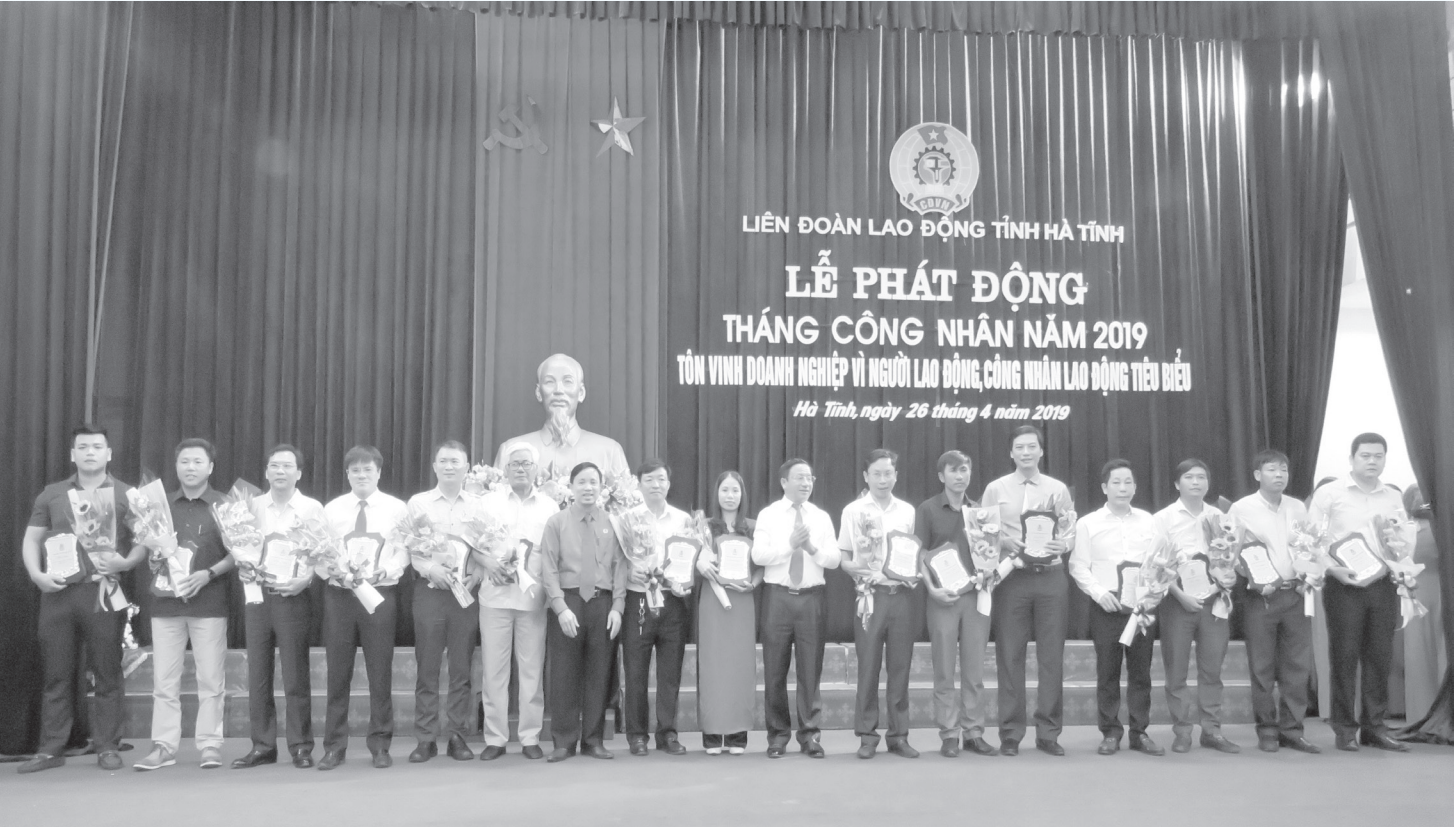
Đồng chí Lê Đình Sơn, UV BCH TW Đảng, Bí thư Tỉnh ủy, Chủ tịch HĐND tỉnh và lãnh đạo LĐLĐ tỉnh trao tặng bằng khen của UBND tỉnh cho CNLĐ tiêu biểu