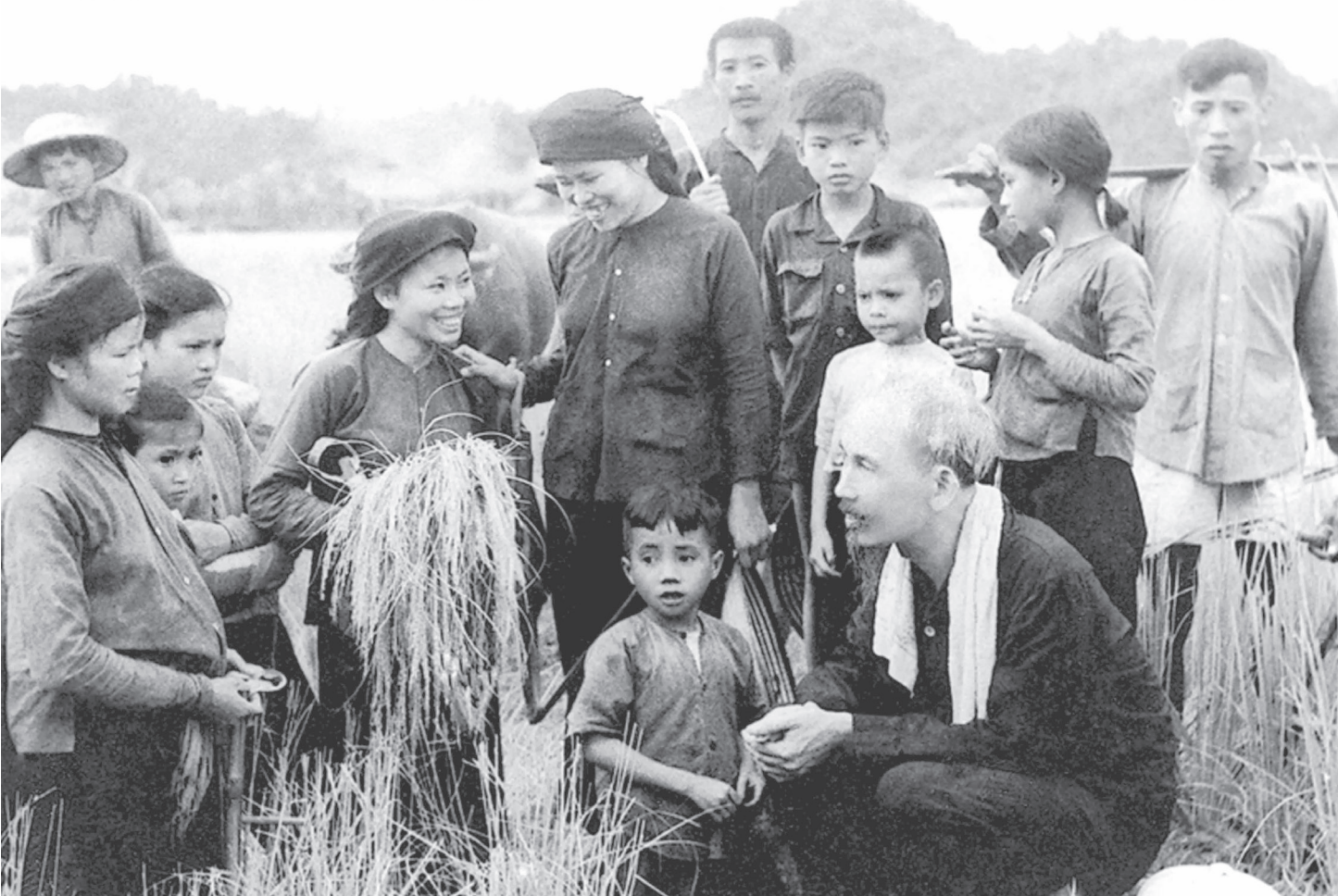
Chủ tịch Hồ Chí Minh thăm đồng bào Hùng Sơn, xã Phục Linh, huyện Đại Từ, tỉnh Thái Nguyên năm 1954