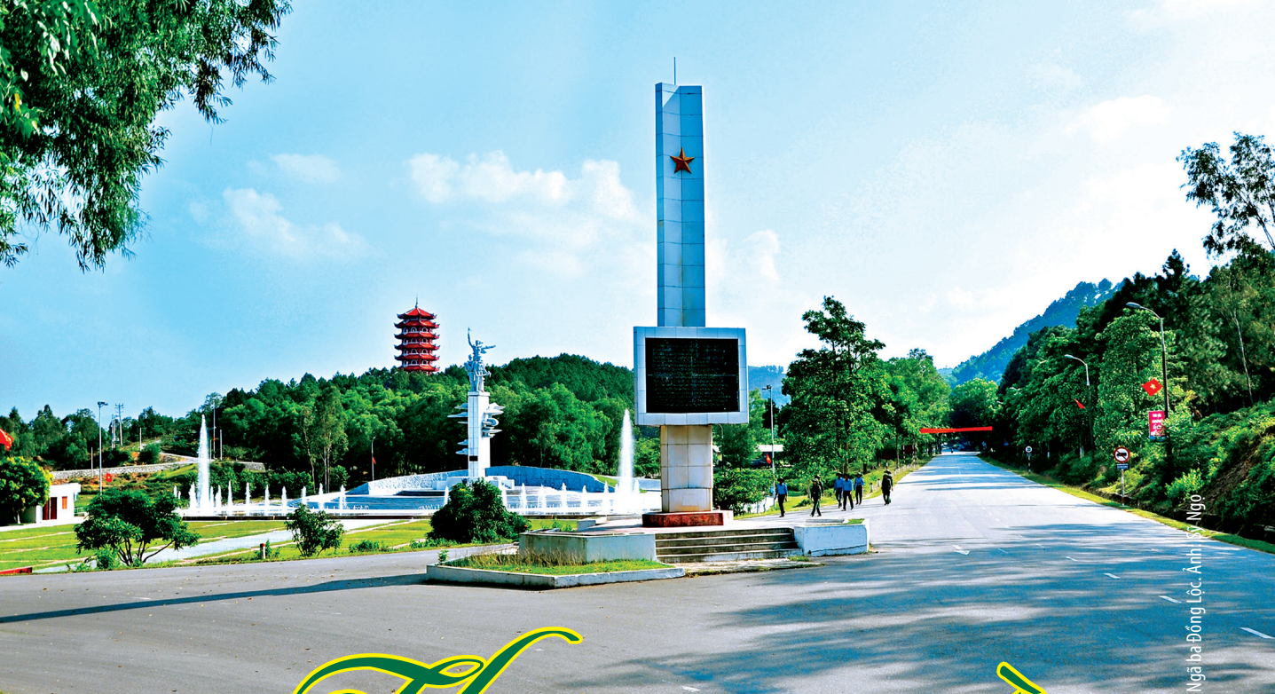
Ngã ba Đồng Lộc, Ảnh: Kỳ Ngô