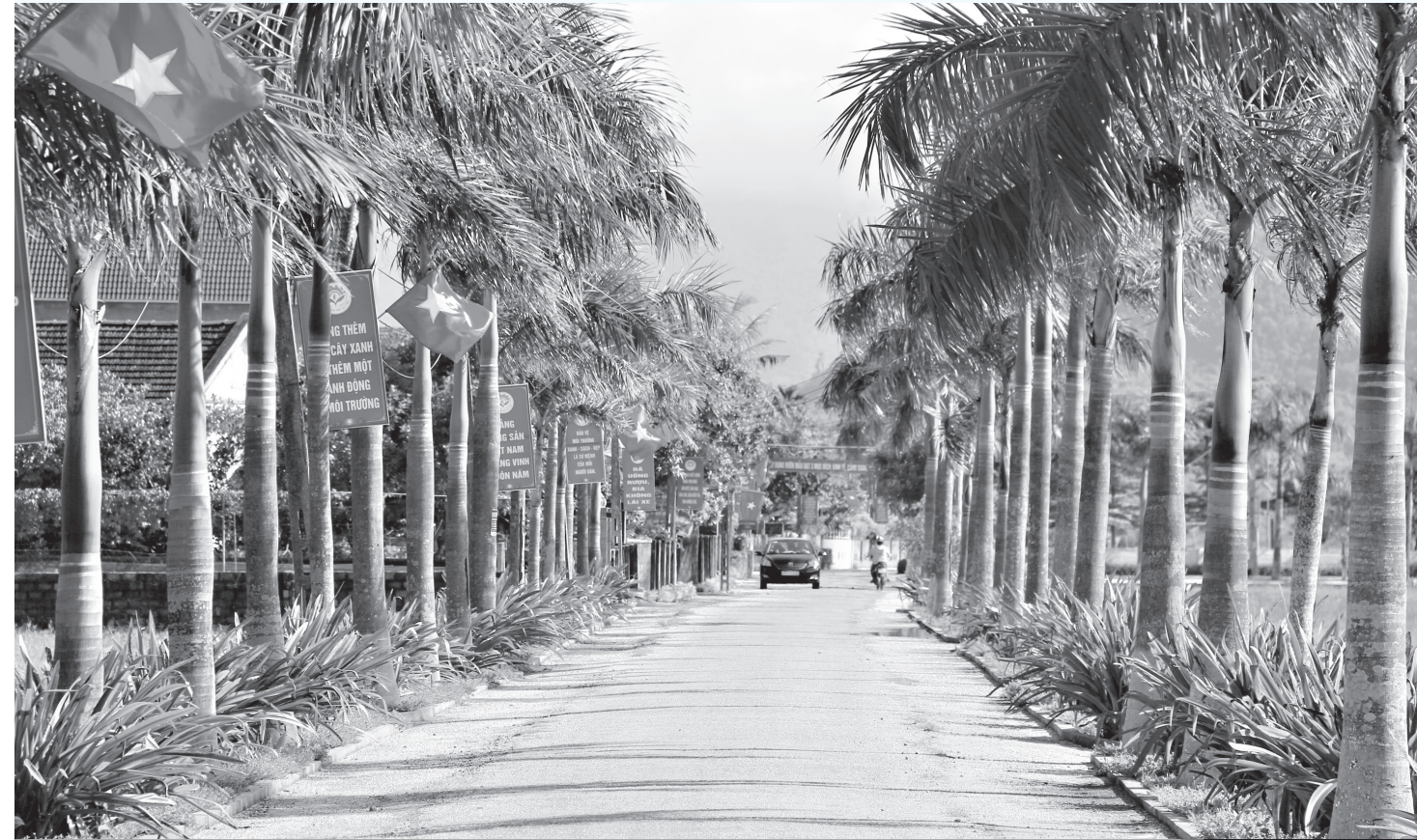
Nghi Xuân hướng đến huyện nông thôn mới văn hóa kiểu mẫu của cả nước