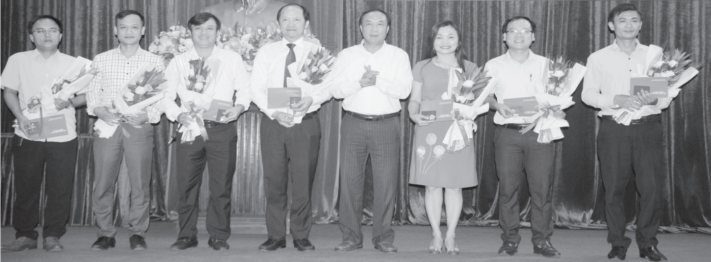
Trao Kỷ niệm chương "Vì sự nghiệp tuyên giáo" cho các đồng chí đã có đóng góp vào quá trình xây dựng và phát triển sự nghiệp Tuyên giáo của Đảng.