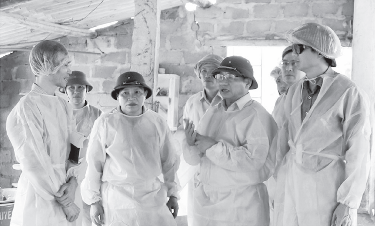
Đ/c Lê Đình Sơn - UVBCHTW Đảng, Bí thư Tỉnh ủy, Chủ tịch HĐND tỉnh cùng đoàn công tác của tỉnh kiểm tra công tác phòng chống bệnh DTLCP tại huyện Cẩm Xuyên.