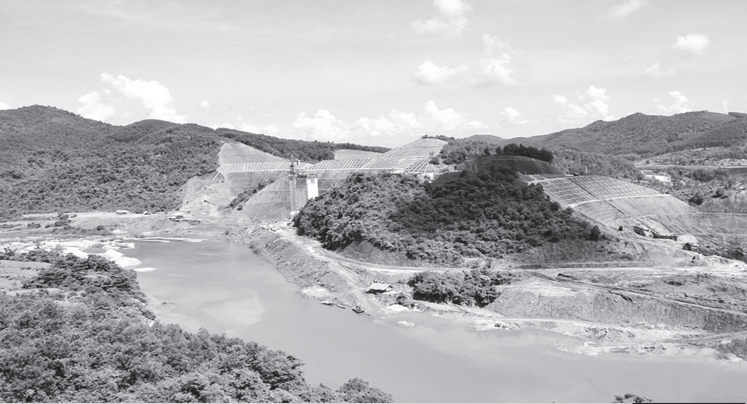
Một góc Công trình thủy điện Ngàn Trươi - Cẩm Trang.