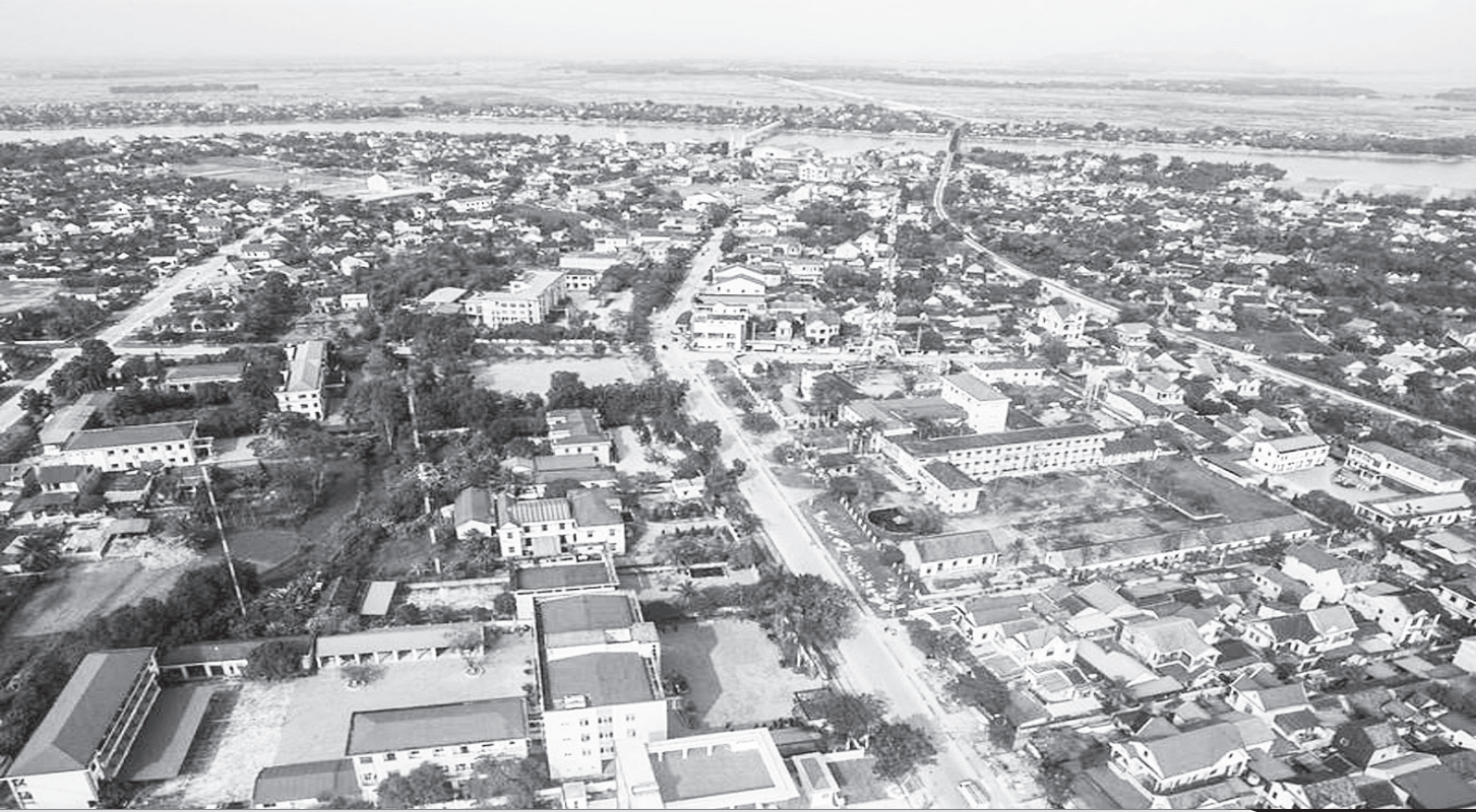
Toàn cảnh thị trấn Đức Thọ hôm nay.