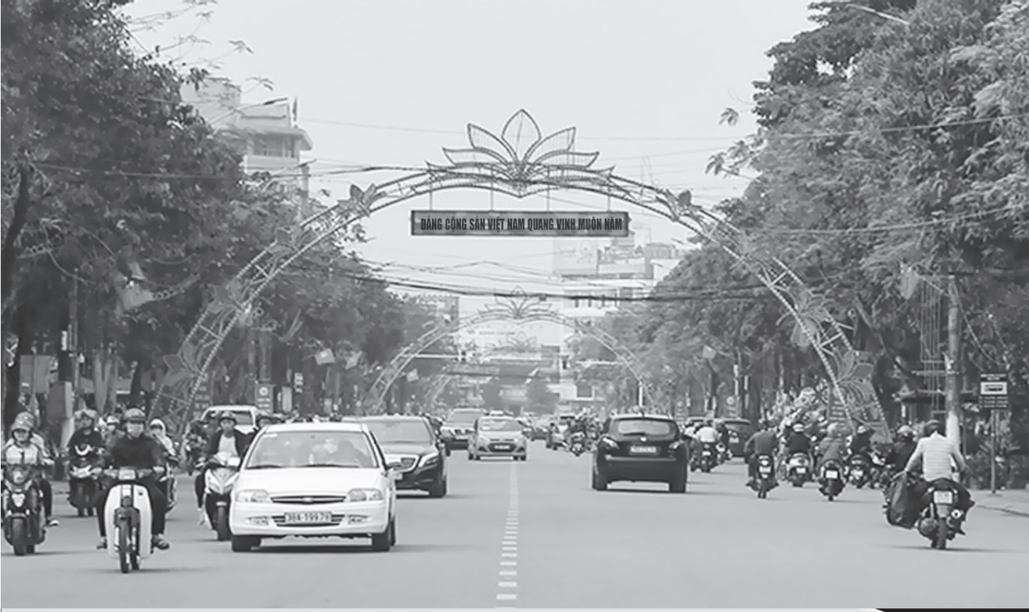
Thành phố Hà Tĩnh rực rỡ cờ hoa chào mừng ngày lễ lớn.