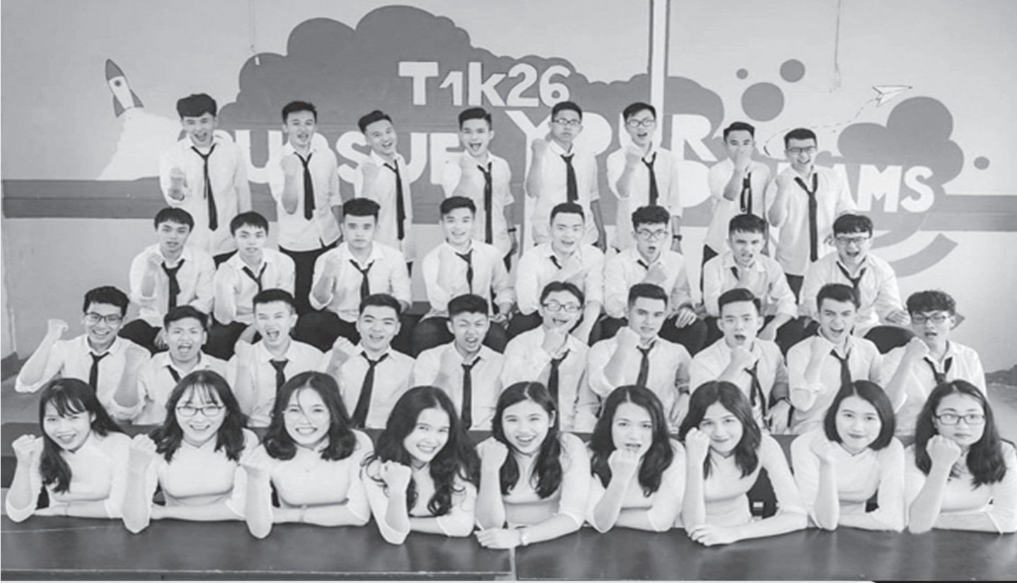
Lớp 12 Toán 1, Trường THPT Chuyên Hà Tĩnh vẫn giữ nguyên thành tích đỉnh cao với 12 em có điểm số đăng ký thi đại học từ 27 trở lên.