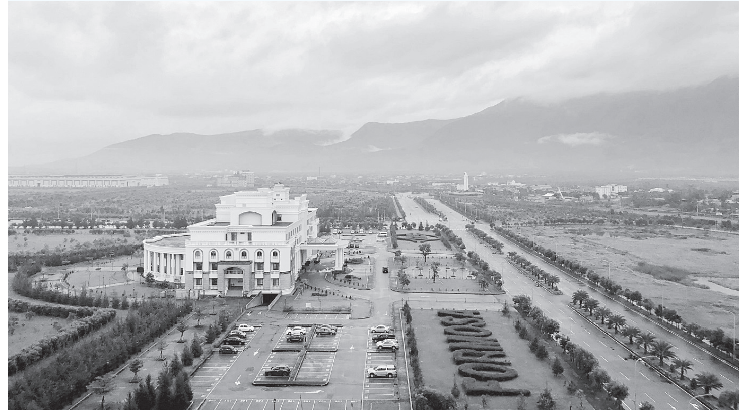
Toàn cảnh Công ty TNHH Formosa Hà Tĩnh.