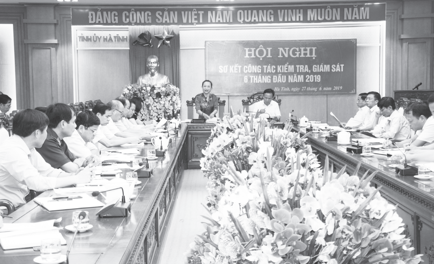
Ủy ban Kiểm tra Tỉnh ủy tổ chức Hội nghị sơ kết công tác Kiểm tra, giám sát 6 tháng đầu năm 2019

KỶ NIỆM 71 NĂM NGÀY TRUYỀN THỐNG NGÀNH KIỂM TRA CỦA ĐẢNG (16/10/1948-16/10/2019)