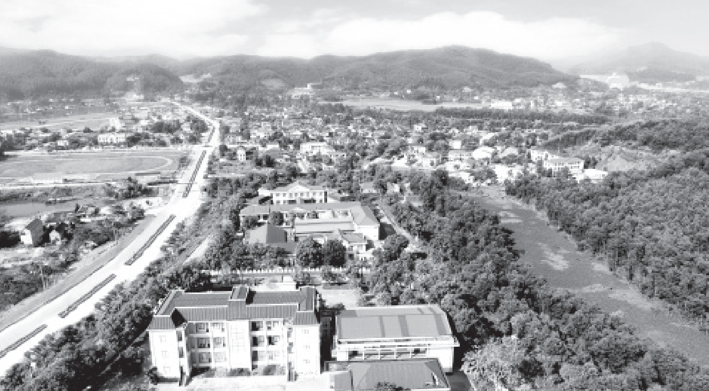
Toàn cảnh thị trấn Vũ Quang.