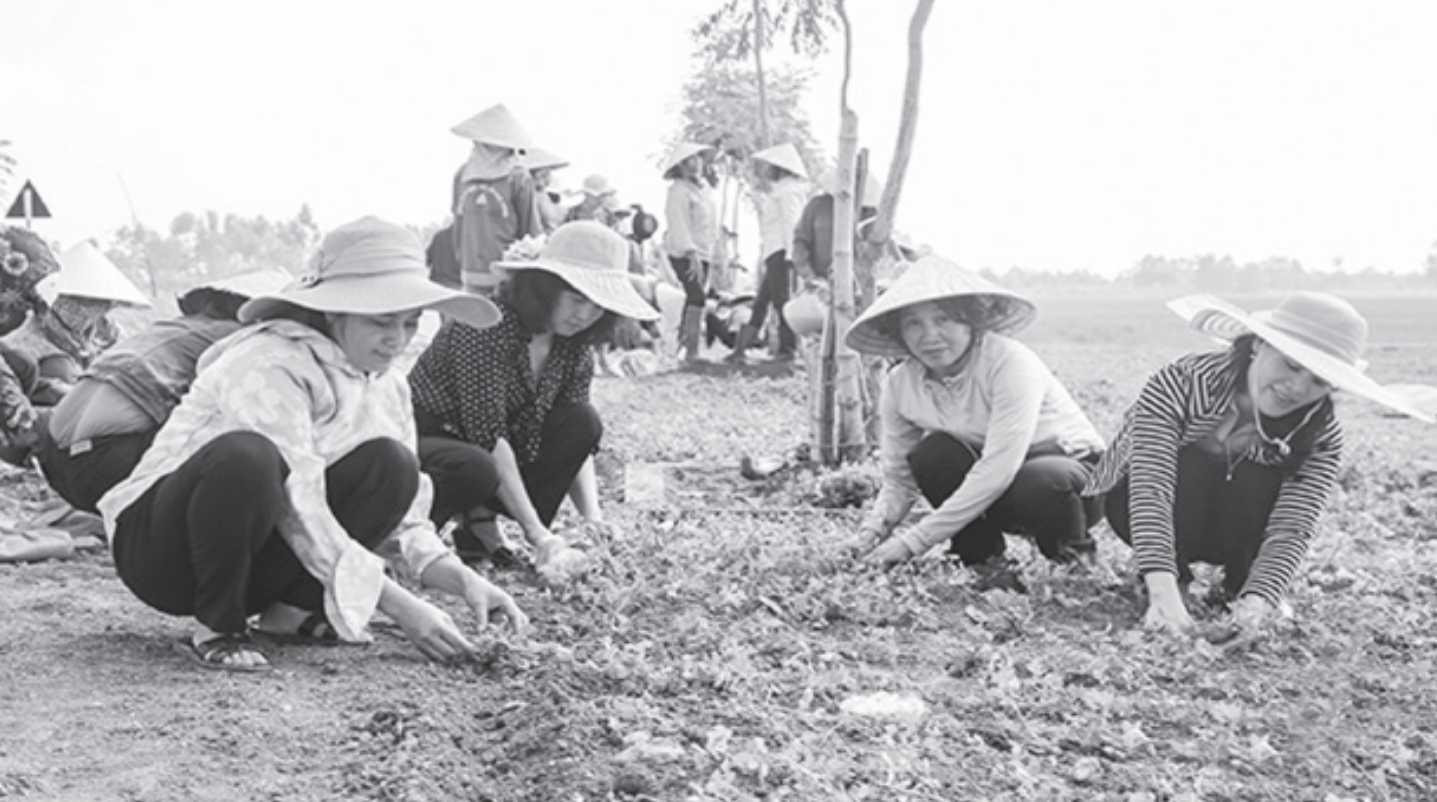
Hội LHPN tỉnh ra quân cùng chị em phụ nữ xã Gia Hanh, huyện Can Lộc chung tay bảo vệ môi trường.

KỶ NIỆM 89 NĂM NGÀY THÀNH LẬP HỘI LIÊN HIỆP PHỤ NỮ VIỆT NAM (20/10/1930-20/10/2019)