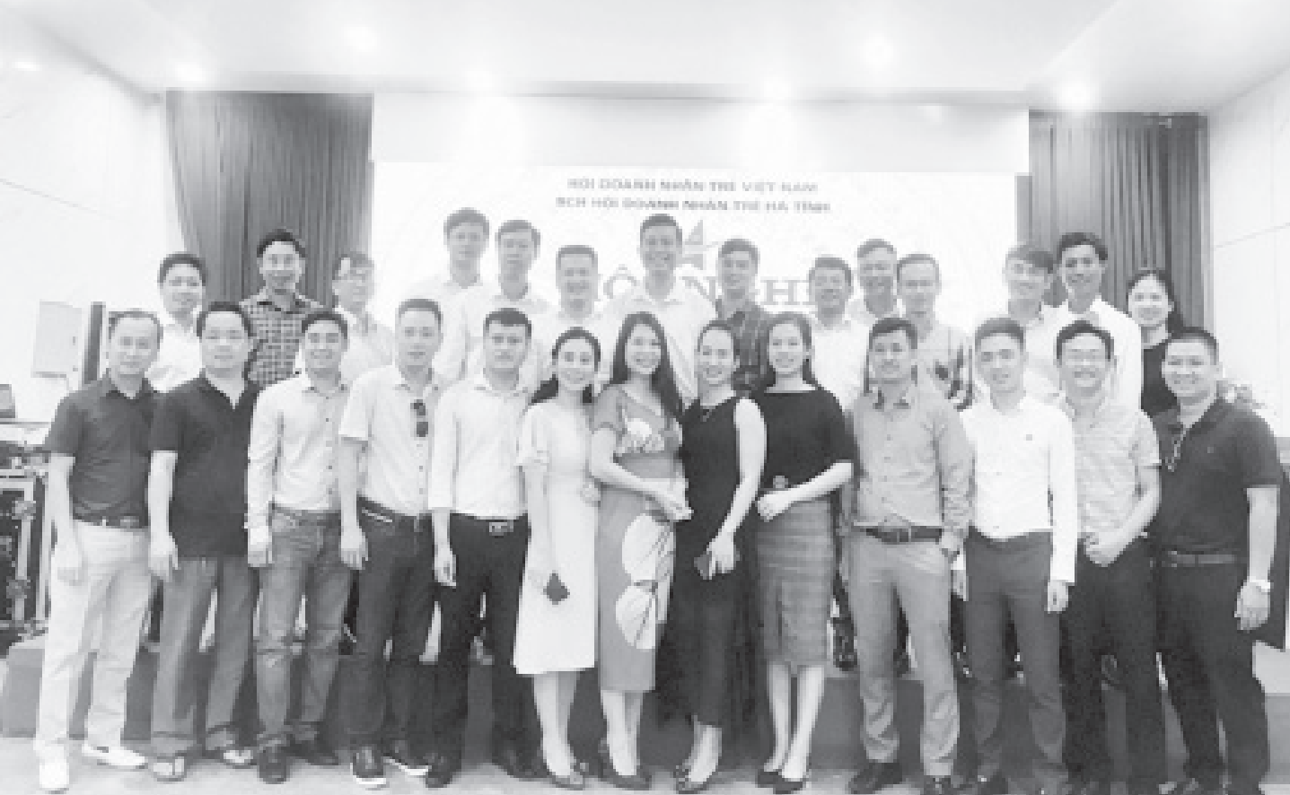
Hiệp hội doanh nghiệp trẻ - nơi thổi bùng ngọn lửa khởi nghiệp tại Hà Tĩnh.

KỶ NIỆM 74 NĂM NGÀY DOANH NHÂN VIỆT NAM (13/10/1945-13/10/2019)