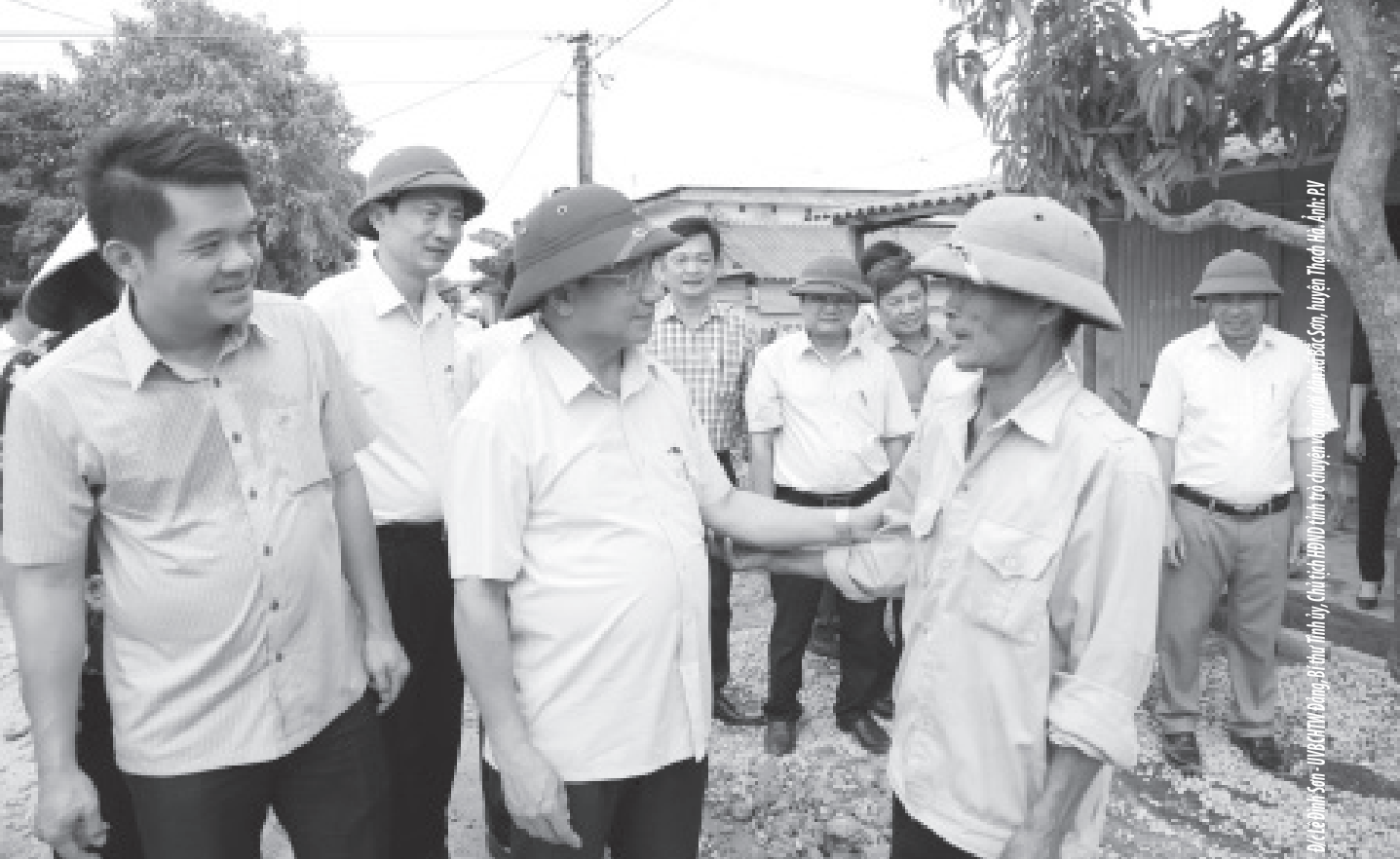
Đài truyền hình Sơn - 118 CHTV Đông - Bộ tư Tỉnh ủy, Chủ tịch HĐND tỉnh trợ chuyên và người dân xã Sơn, huyện Thuận Hải, Antr. PV

KỶ NIỆM 89 NĂM NGÀY TRUYỀN THỐNG CÔNG TÁC DÂN VẬN CỦA ĐẢNG (15/10/1930-15/10/2019)