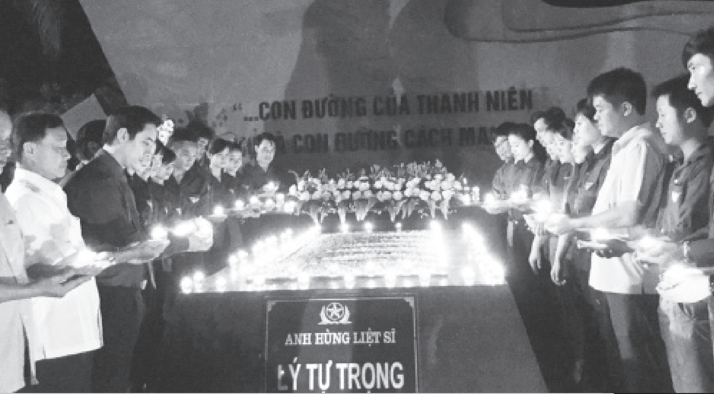
Tuổi trẻ Hà Tĩnh thắp nến tri ân anh hùng liệt sĩ Lý Tự Trọng.

KỶ NIỆM 63 NĂM NGÀY TRUYỀN THỐNG HỘI LIÊN HIỆP THANH NIÊN VIỆT NAM (15/10/1956-15/10/2019)