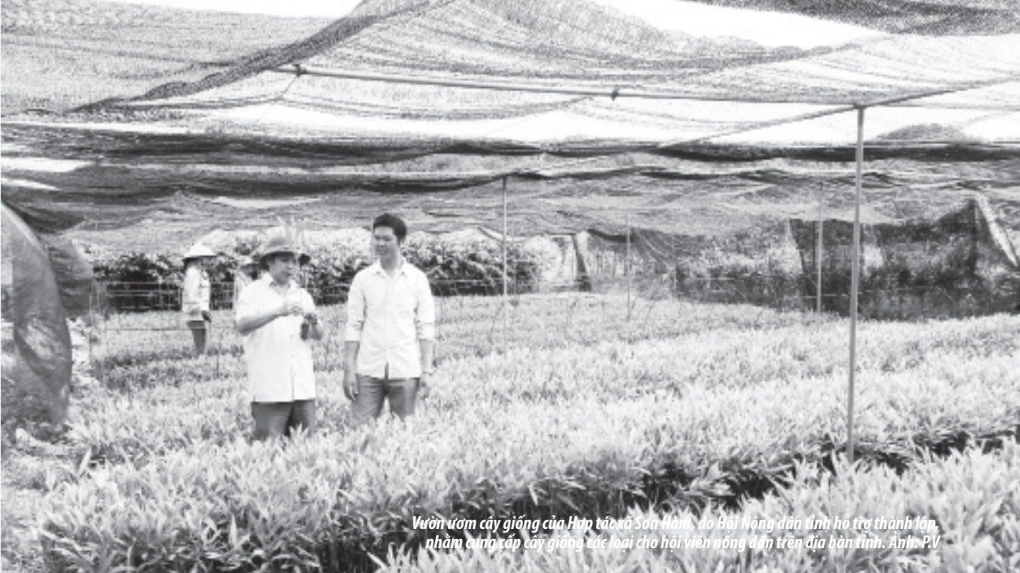
Vườn ươm cây giống của Hợp tác xã Sơn Nam, do Hội Nông dân tỉnh hỗ trợ thành lập, nhằm cung cấp cây giống các loại cho hội viên nông dân trên địa bàn tỉnh.

KỶ NIỆM 89 NĂM NGÀY THÀNH LẬP HỘI NÔNG DÂN VIỆT NAM (14/10/1930-14/10/2019)