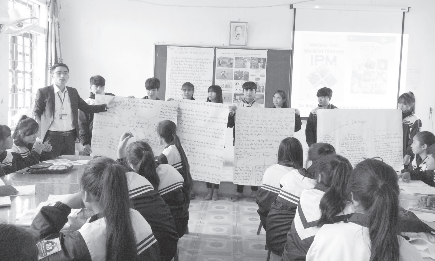
Đổi mới phương pháp dạy học.