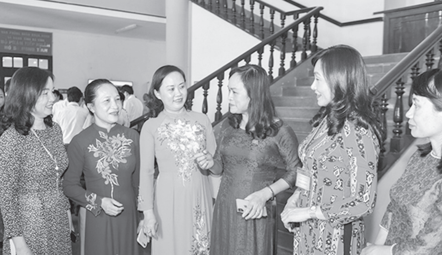
Công tác cán bộ nữ luôn được cấp ủy, chính quyền tỉnh Hà Tĩnh quan tâm chỉ đạo và đạt những kết quả quan trọng.