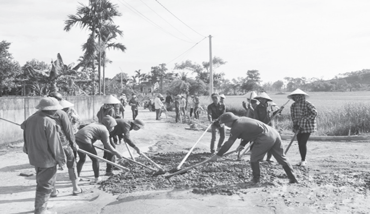
Chung tay xây dựng nông thôn mới.