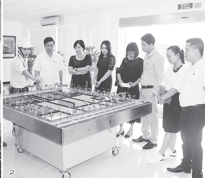
Các đoàn công tác tham quan các mô hình ứng dụng khoa học kỹ thuật trên địa bàn Hà Tĩnh.