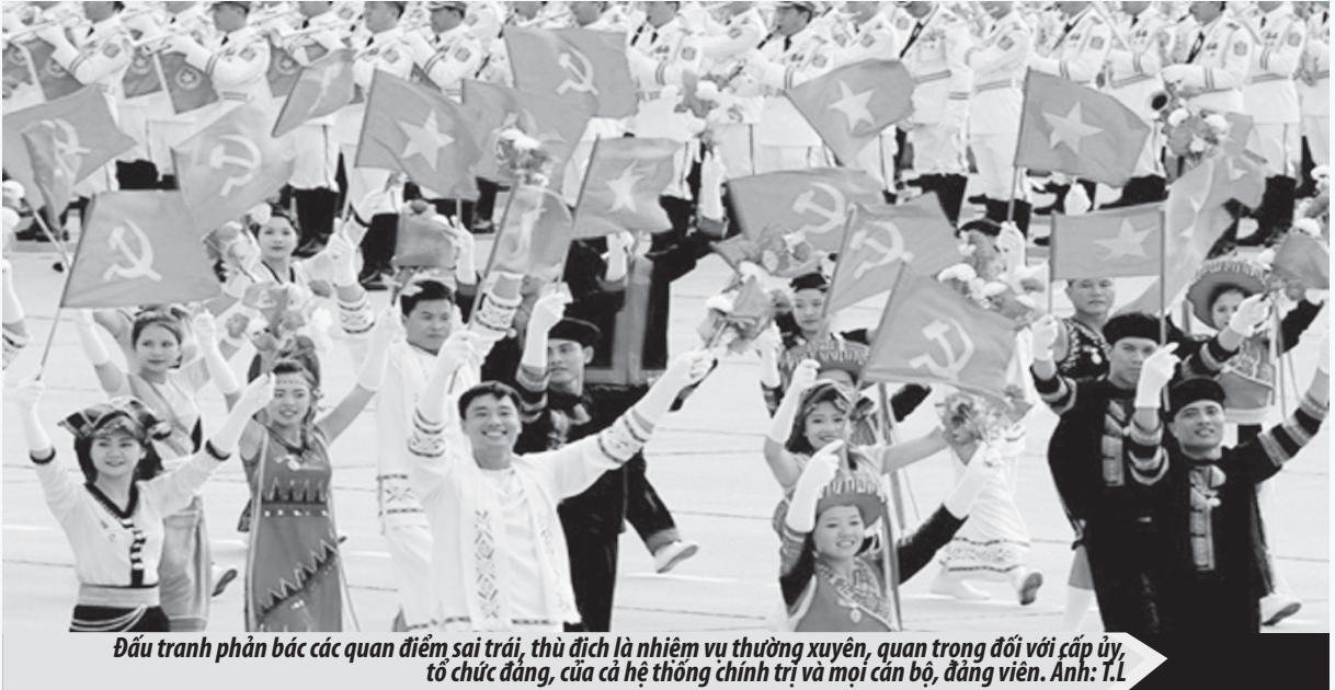
Đấu tranh phân bác các quan điểm sai trái, thù địch là nhiệm vụ thường xuyên, quan trọng đối với cấp ủy, tổ chức đảng, của cả hệ thống chính trị và mọi cán bộ, đảng viên.