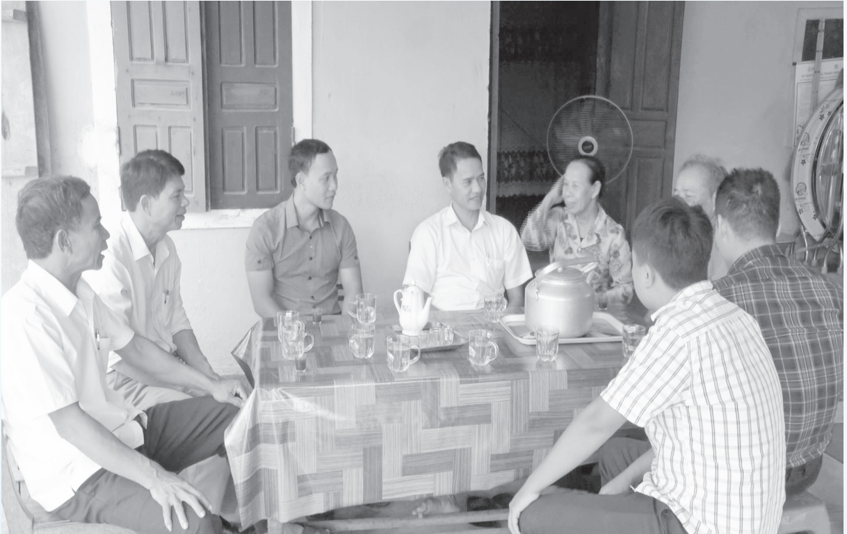
Các báo cáo viên Đảng ủy xã Kỳ Hoa phối hợp với Hội đồng BT-TĐC - GPMB thị xã tuyên truyền chủ trương giải phóng mặt bằng triển khai dự án tại thôn Hoa Trung, xã Kỳ Hoa, TX Kỳ Anh.

Để đưa thông tin đến với người dân thuận lợi và hiệu quả nhất, điều đầu tiên phải nói đến vai trò của đội ngũ báo cáo viên cơ sở, bởi đây là những người sống ở trong lòng dân, vừa nói dân nghe, vừa nghe dân nói, nói những nhịp cầu giữa ý Đảng với lòng dân. Thời gian qua, cấp ủy, chính quyền thị xã Kỳ Anh đã xây dựng, kiên toàn, phát huy vai trò quan trọng của đội ngũ báo cáo viên cơ sở. Qua đó góp phần phát triển kinh tế, giữ vững an ninh chính trị, trật tự an toàn xã hội