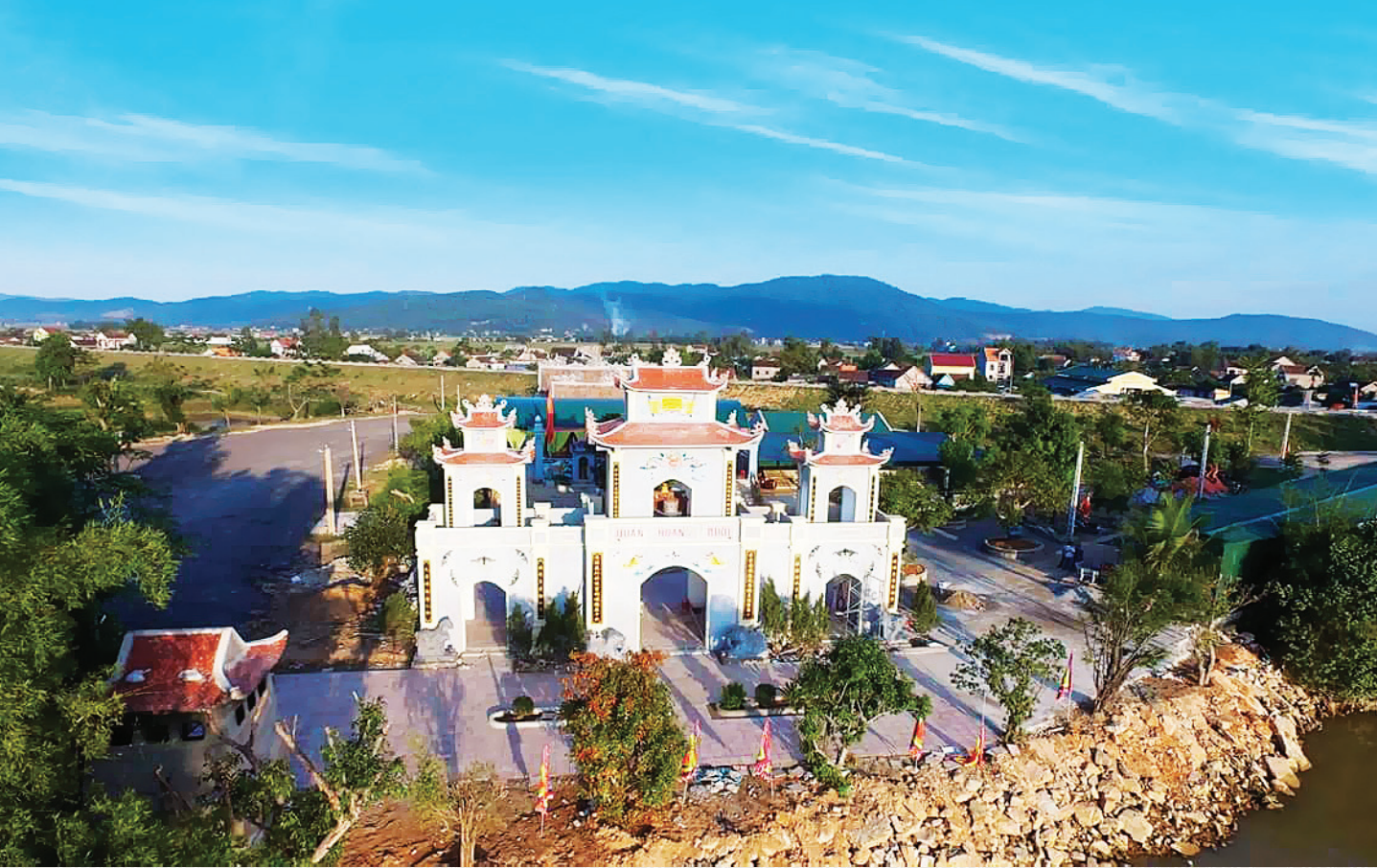
Toàn cảnh Đền Cả (phường Trung Lương) sau khi được trùng tu.