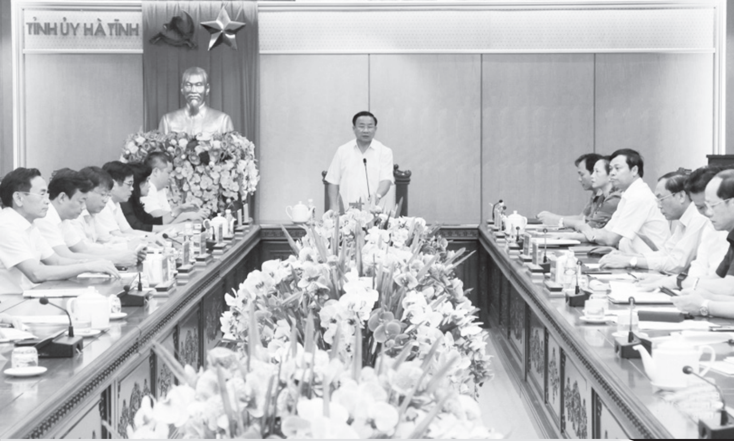
Ban Thường vụ Tỉnh ủy họp bàn về công tác cán bộ của tỉnh.