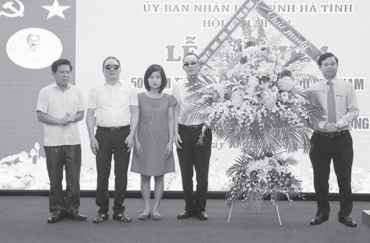
Các đồng chí lãnh đạo tỉnh tặng hoa chúc mừng Hội Người mù Hà Tĩnh.