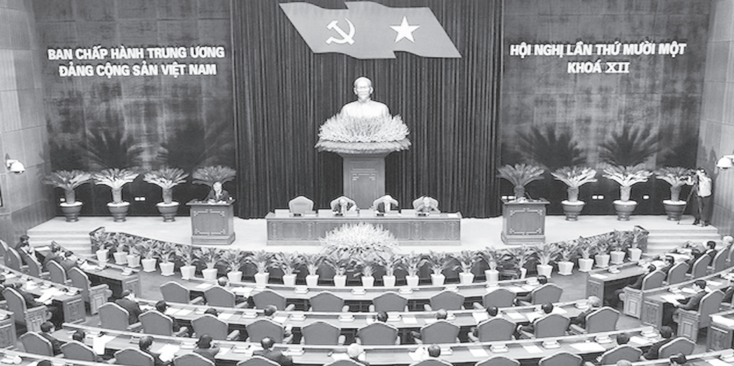
Toàn cảnh bế mạc Hội nghị lần thứ 11, Ban Chấp hành Trung ương Đảng, khóa XII