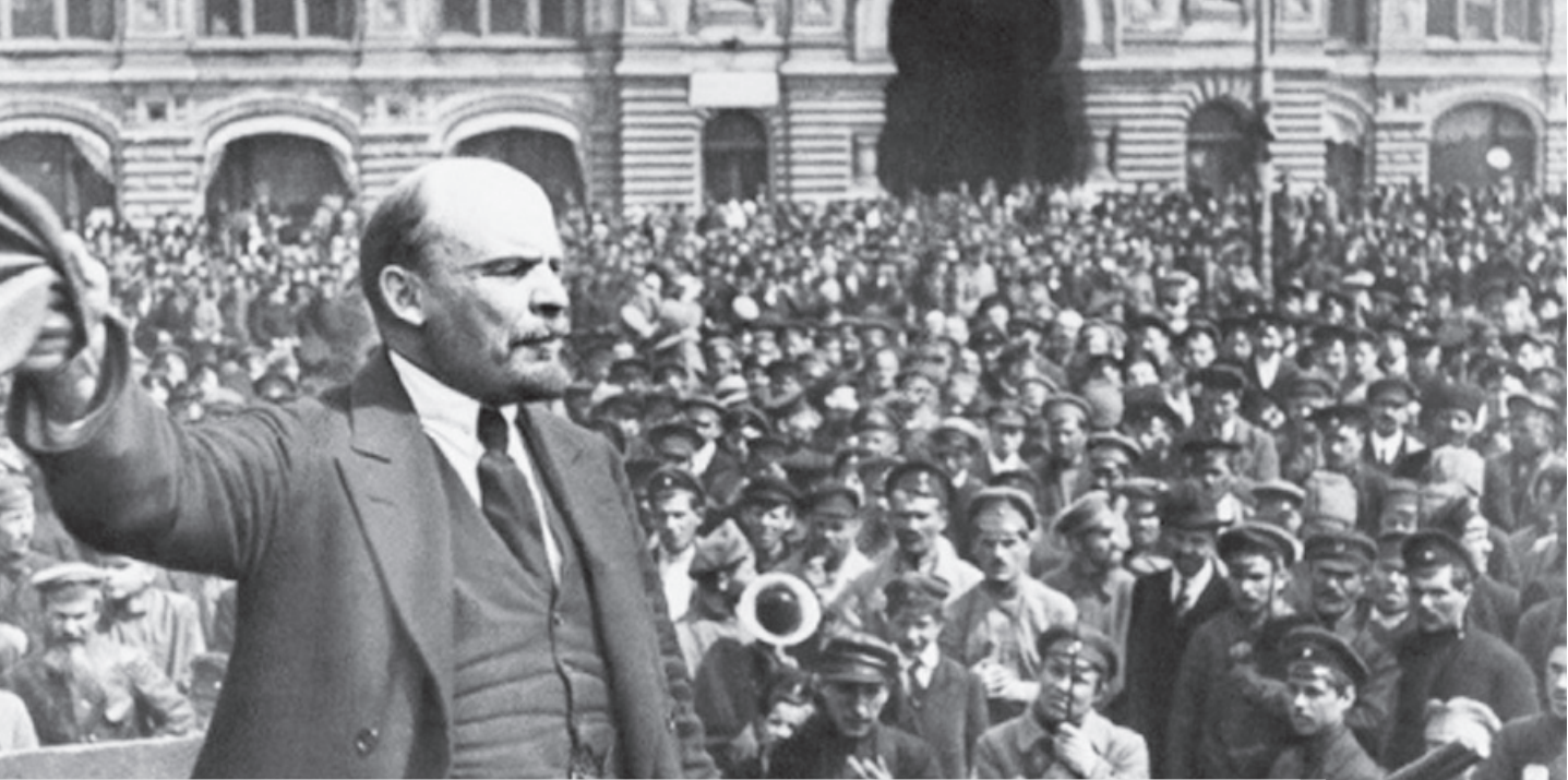
V.I. Lê nin và cách mạng Tháng Mười Nga.