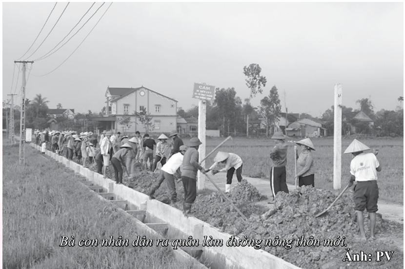
Bà con nhân dân ra quân làm đường nông thôn mới.

Can Lộc có diện tích tự nhiên 30.212 hecta, dân số toàn huyện gần 13 vạn người, 18 đơn vị hành chính (16 xã, 02 thị trấn). Đảng bộ huyện có 38 tổ chức cơ sở Đảng với 8.440 đảng viên. Năm 2020 là năm diễn ra đại hội Đảng các cấp nhiệm kỳ 2020 - 2025, Can Lộc vinh dự là một trong hai đơn vị cấp huyện được chọn là đơn vị Đại hội điểm của tỉnh, cùng với đó xã Thượng Lộc cũng được chọn là đơn vị đại hội điểm cấp cơ sở của tỉnh. Bên cạnh các nhiệm vụ chính trị tập trung phục vụ đại hội, cấp ủy và chính quyền huyện đặc biệt quan tâm lãnh đạo, chỉ đạo đẩy mạnh các phong trào thi đua yêu nước, nhất là phong trào thi đua “Dân vận khéo” trên các lĩnh vực với hơn 80 công trình đăng ký chào mừng Đại hội đảng các cấp, dự kiến kinh phí hơn 110 tỷ đồng và hàng trăm mô hình, điển hình dân