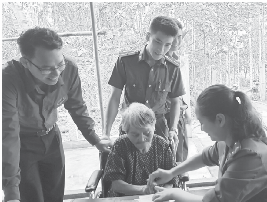
Tuổi trẻ Công an Hà Tĩnh trợ giúp người dân làm chứng minh thư tại nhà.

T r o n g n h ữ n g n ă m q u a, Đảng ủy Công an tỉnh thực hiện phong trào thi đua “Dân vận khéo” gắn với thực hiện Chỉ thị 05 của Bộ Chính trị về “Đẩy mạnh học tập và làm theo tư tưởng, đạo đức Hồ Chí Minh” và phong trào “Học tập, thực hiện 6 điều Bác Hồ dạy CAND”; quán triệt các văn bản chỉ đạo của Ban Dân vận Trung ương, Ban Dân vận Tỉnh ủy và Bộ Công an về công tác dân vận và “Dân vận khéo”; tăng cường tuyên truyền, vận động nhân dân tích cực tham gia tố giác tội phạm; phòng, chống tội phạm và tệ nạn xã hội; tham gia xây dựng phong trào toàn dân bảo vệ an ninh tổ quốc (ANTQ), tập trung hướng vào giải quyết ổn định các điểm “nóng”, các địa bàn, lĩnh vực trọng