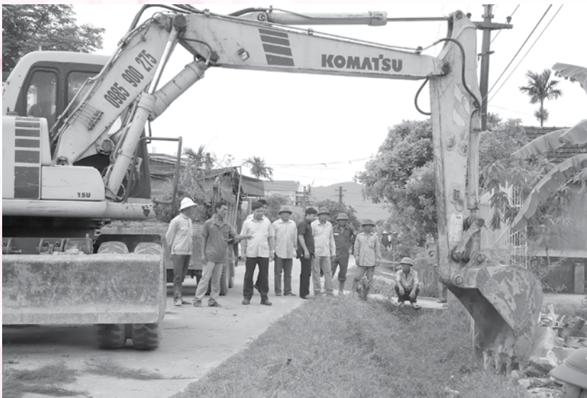
Đ/c Phạm Đăng Nhật kiểm tra tiến độ xây dựng nông thôn mới tại xã Cẩm Hòa - Cẩm Xuyên.

công tác dân vận trong cơ quan hành chính nhà nước, chính quyền các cấp trong tình hình mới; Chỉ thị số 06 - CT/TU, ngày 14/01/2016 của Ban Thường vụ Tỉnh ủy về tăng cường lãnh đạo và nâng cao hiệu quả công tác dân vận của cơ quan nhà nước các cấp. Ban Thường vụ huyện ủy đã ban hành Quy chế tiếp công dân, đối thoại với công dân định kỳ, đồng thời lãnh