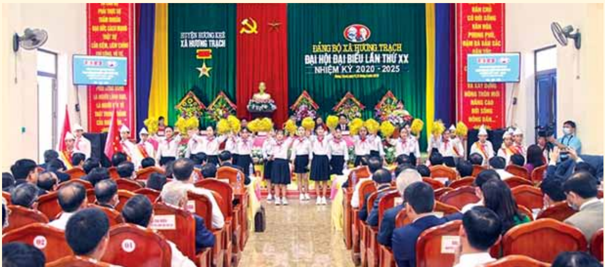
Toàn cảnh Đại hội Đảng bộ xã Hương Trạch lần thứ XX.

Đại hội Đảng các cấp nhiệm kỳ 2020 – 2025, tiến tới Đại hội Đảng bộ tỉnh lần thứ XIX, Đại hội đại biểu toàn quốc lần thứ XIII của Đảng là đợt sinh hoạt chính trị sâu rộng trong toàn Đảng, toàn dân và toàn quân. Do đó, cần phải phát huy tốt vai trò của công tác dân vận, nắm chắc tình hình nhân dân; huy động sức mạnh của cả hệ thống chính trị để củng cố sự đồng thuận xã hội; huy động tiềm lực, trí tuệ của nhân dân để góp phần tạo nên thành công của đại hội.