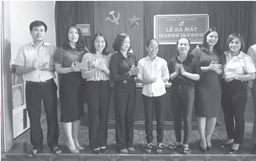
Lễ ra mắt Câu lạc bộ “Sống tốt đời đẹp đạo” tại huyện Can Lộc.

Tháng 6/2012, Hội phụ nữ xã Thạch Trung đã tiên phong thành lập CLB “Xây dựng gia đình hạnh phúc, sống tốt đời đẹp đạo”. Khi mới thành lập, CLB chỉ có 100 thành viên tham gia. Việc triển khai các hoạt động CLB bước đầu được Hội Phụ