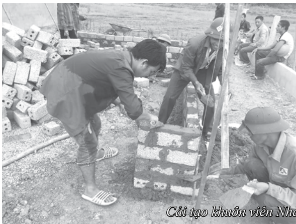
Cải tạo khuôn viên Nhà văn hóa xã.

Ngoài ra, người đứng đầu cấp ủy, chính quyền quan tâm công tác tiếp dân, đối thoại với nhân dân theo Quy định 11-QĐi/TW và Quyết định 657-QĐ/TU. Qua tiếp xúc, đối thoại, người dân được bày tỏ tâm tư, nguyện vọng, phản ánh, kiến nghị; góp ý