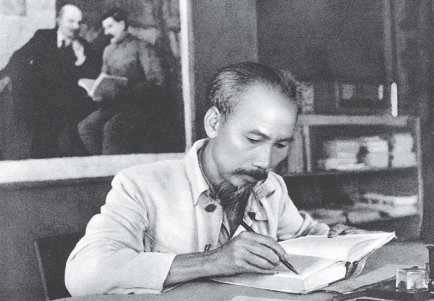
Chủ tịch Hồ Chí Minh.