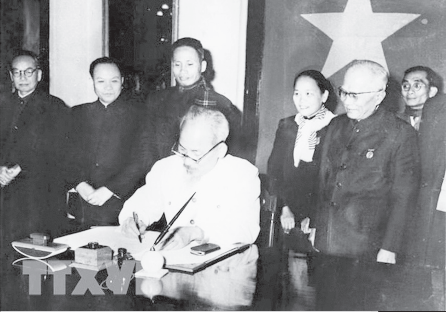
Chủ tịch Hồ Chí Minh ký Sắc lệnh số 1, công bố Hiến pháp mới năm 1959.