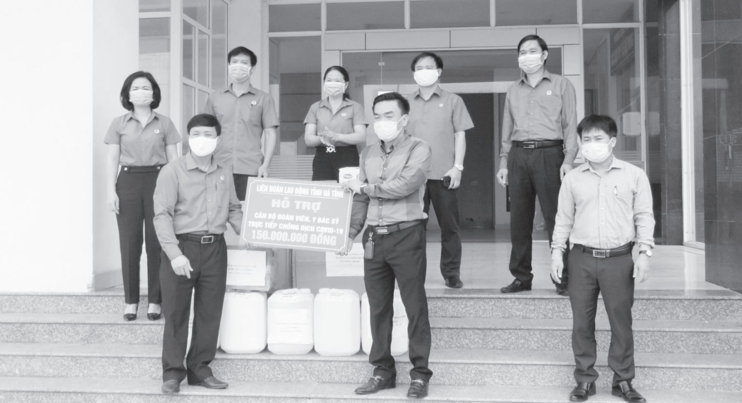
Liên đoàn Lao động tỉnh hỗ trợ Trung tâm Kiểm soát bệnh tật tỉnh phòng chống dịch Covid-19.