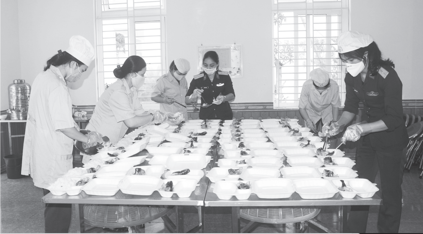
Chi em phụ nữ Ban CHQS TP Hà Tĩnh chế biến món ăn phục vụ công dân cách ly tại TP Hà Tĩnh.