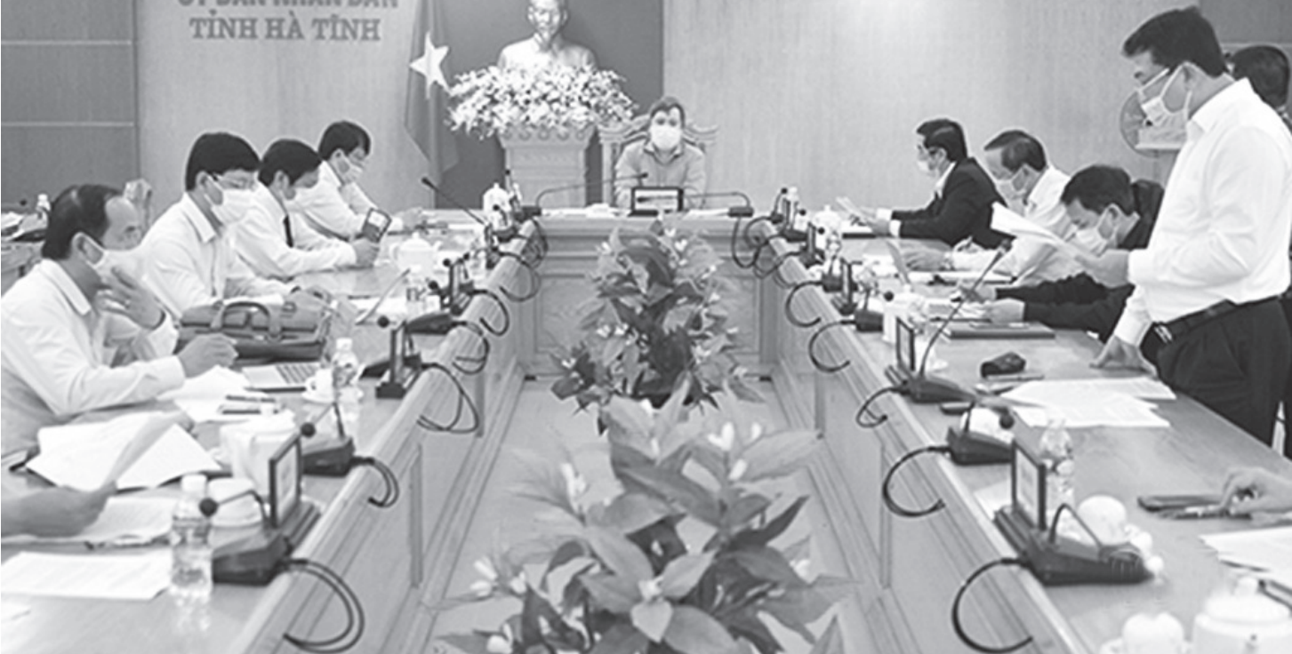
UBND tỉnh tổ chức Hội nghị bàn một số nhiệm vụ, giải pháp về việc triển khai thực hiện Nghị quyết số 42/NQ-CP ngày 09/4/2020 của Chính phủ về các biện pháp hỗ trợ người dân gặp khó khăn bởi dịch Covid-19