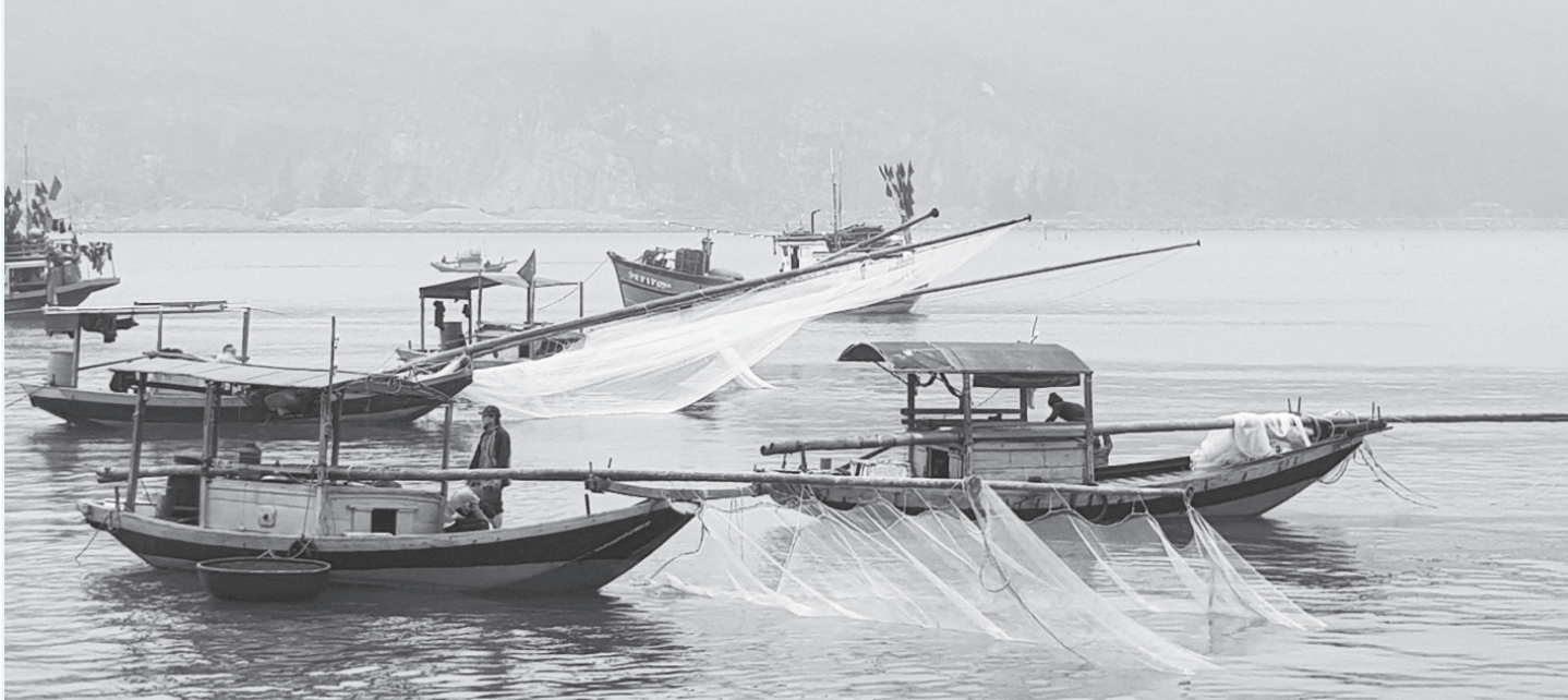
Những chiếc thuyền của ngư dân vừa ra biển đánh đã ruốc trở về