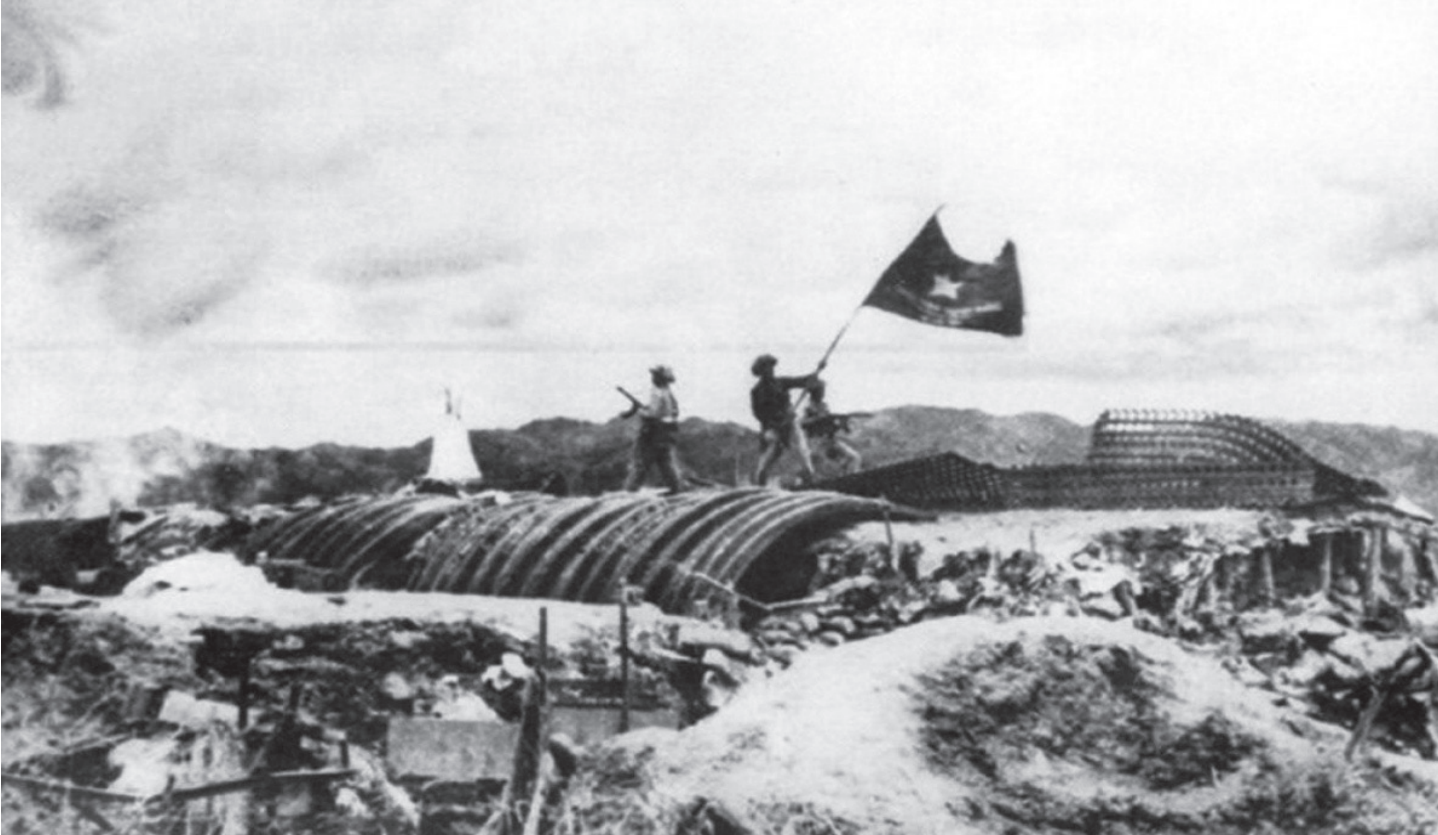
17 giờ chiều ngày 7/5/1954, lá cờ "Quyết chiến, quyết thắng" của quân đội ta bay phấp phới trên nóc hầm tướng Đờ Cát-xơ-ri, báo hiệu sự toàn thắng của chiến dịch Điện Biên Phủ lịch sử.