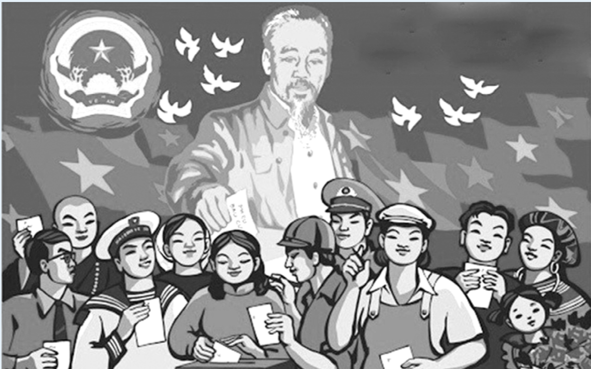
Ảnh minh họa.