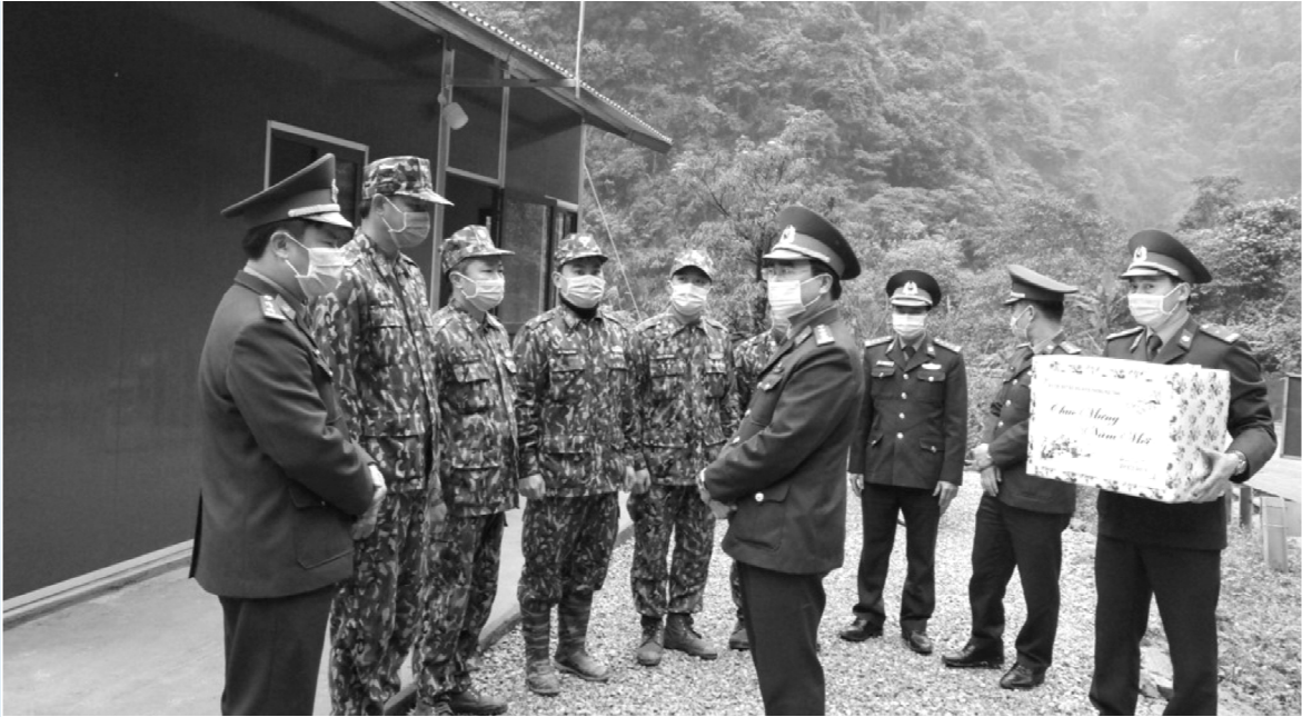
Thượng tá Võ Tiến Nghị thăm, động viên và chúc Tết cán bộ, chiến sỹ trực tiếp làm nhiệm vụ chốt chặn Covid-19 trên biên giới.