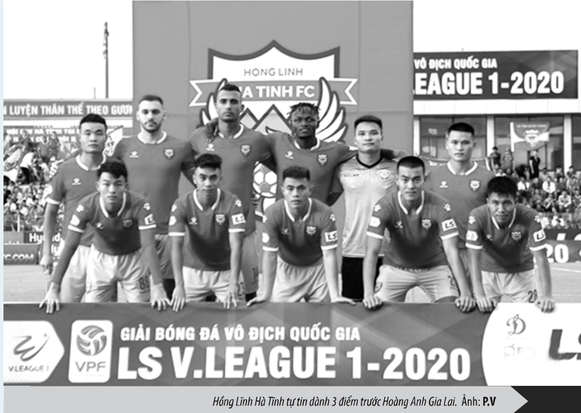
Hồng Lĩnh Hà Tĩnh tự tin dành 3 điểm trước Hoàng Anh Gia Lai.