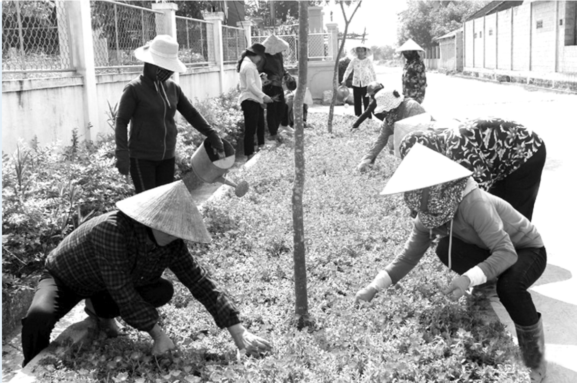
Chị em phụ nữ thôn giáo Bình Yên (xã Xuân Lộc, Can Lộc, Hà Tĩnh) chung tay xây dựng khu dân cư NTM kiểu mẫu.