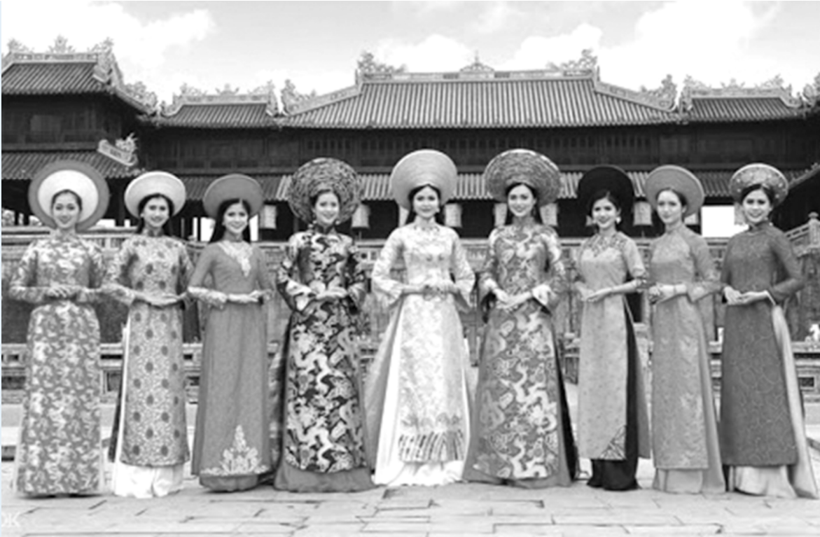
Lan tỏa Cuộc thi “Duyên dáng Áo dài qua ảnh”.