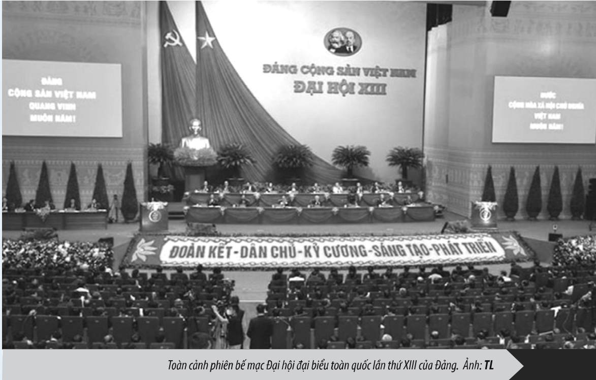
Toàn cảnh phiên bế mạc Đại hội đại biểu toàn quốc lần thứ XIII của Đảng.