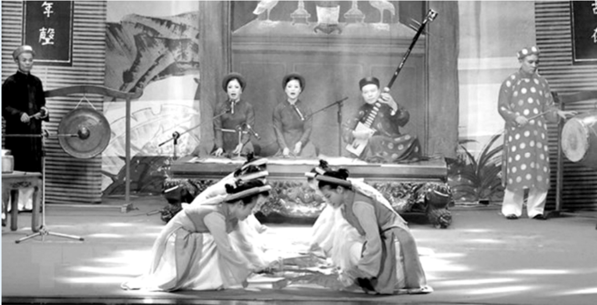
Một tiết mục của đoàn ca trù Hà Tĩnh. Ảnh: Công Tường