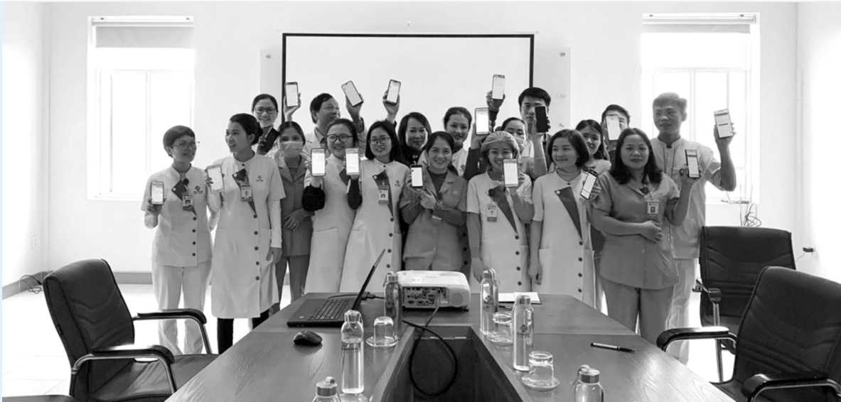
100% người lao động tại Bệnh viện Đa khoa Sài Gòn - Hà Tĩnh được hướng dẫn cài đặt và sử dụng ứng dụng VssID.