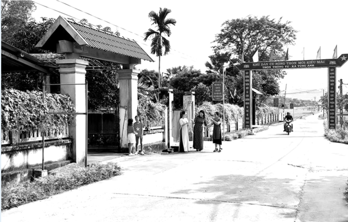
Khu dân cư nông thôn mới kiểu mẫu ở xã Tùng Ảnh (Đức Thọ).