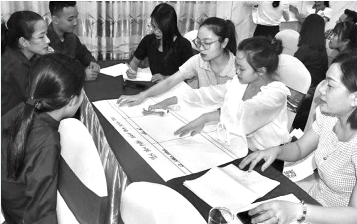
Đoàn viên, thanh niên thảo luận, trình bày các ý tưởng, phương pháp khởi sự kinh doanh (tháng 01/2020).