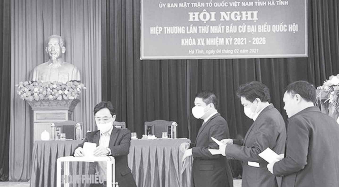
Các đại biểu lấy ý kiến bằng hình thức bỏ phiếu kín các nội dung liên quan đến hiệp thương về số lượng, cơ cấu, thành phần đại biểu Quốc hội khóa XV