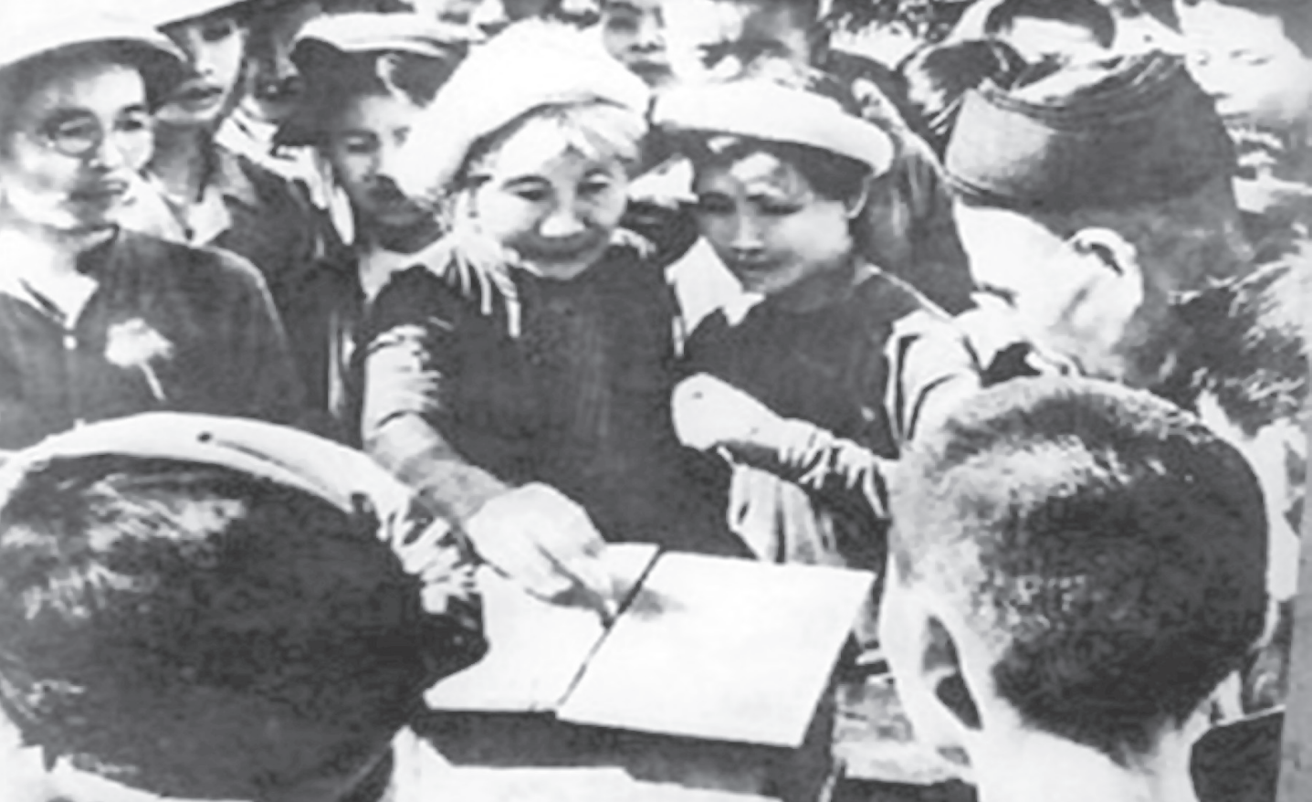
Cử tri ngoại thành Hà Nội bỏ phiếu bầu đại biểu Quốc hội khóa I ngày 06/01/1946.