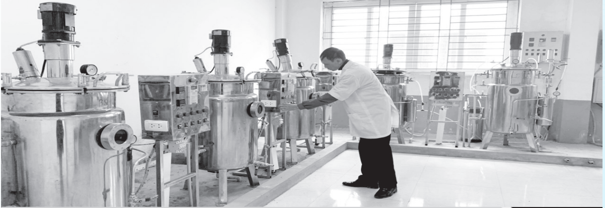
Một số hình ảnh của Trung tâm ứng dụng tiến bộ KHCN Hà Tĩnh

Là một đơn vị trực thuộc Sở Khoa học - Công nghệ, hoạt động theo cơ chế tự chủ, những năm qua, đặc biệt là năm 2020, mặc dù gặp không ít khó khăn do tác động của thiên tai, dịch bệnh nhưng Trung tâm Ứng dụng tiến bộ khoa học công nghệ (KHCN) đã nỗ lực hoạt động và đạt nhiều kết quả đáng ghi nhận.