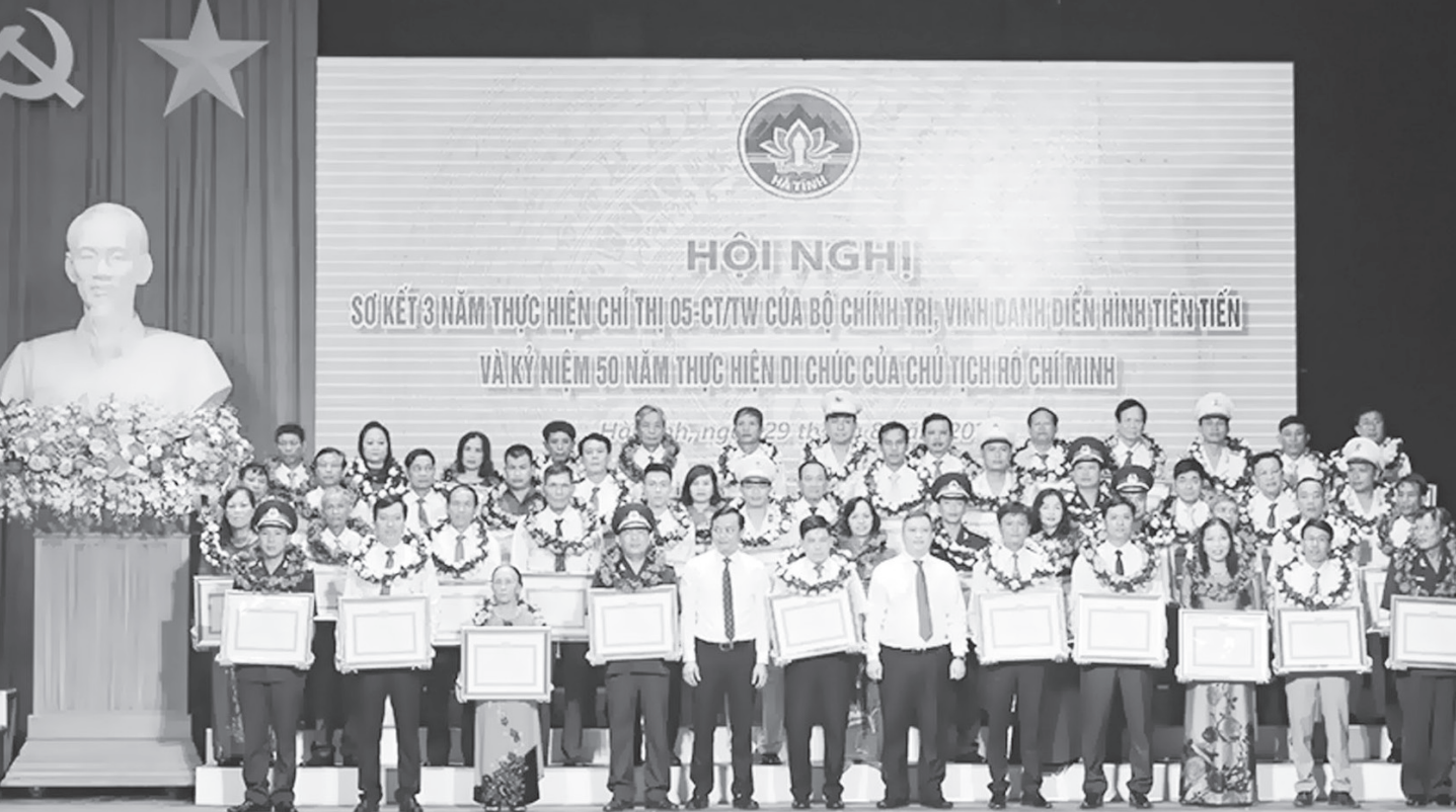
Hội nghị sơ kết 3 năm thực hiện Chỉ thị số 05 của Bộ Chính trị