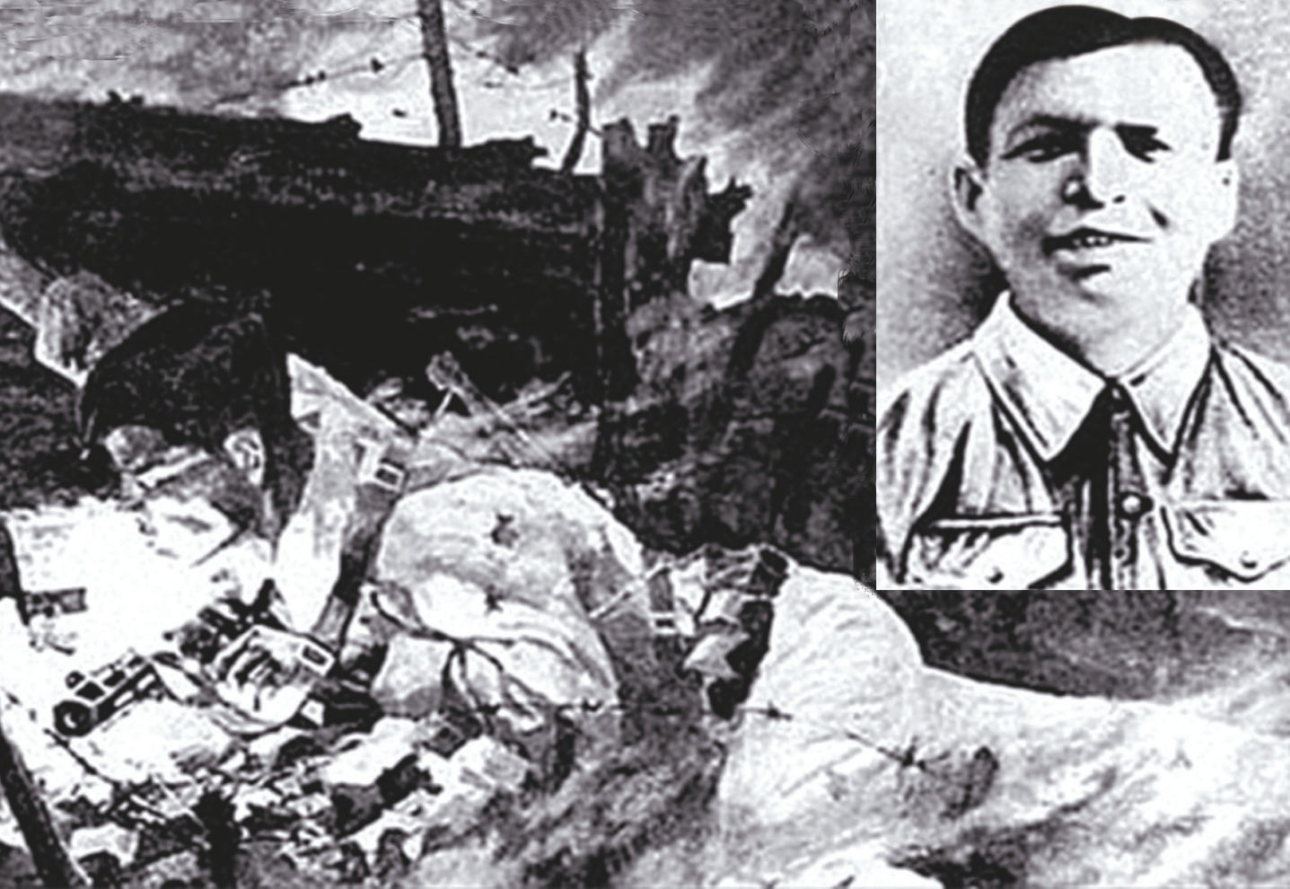
Anh hùng Phan Đình Giót.