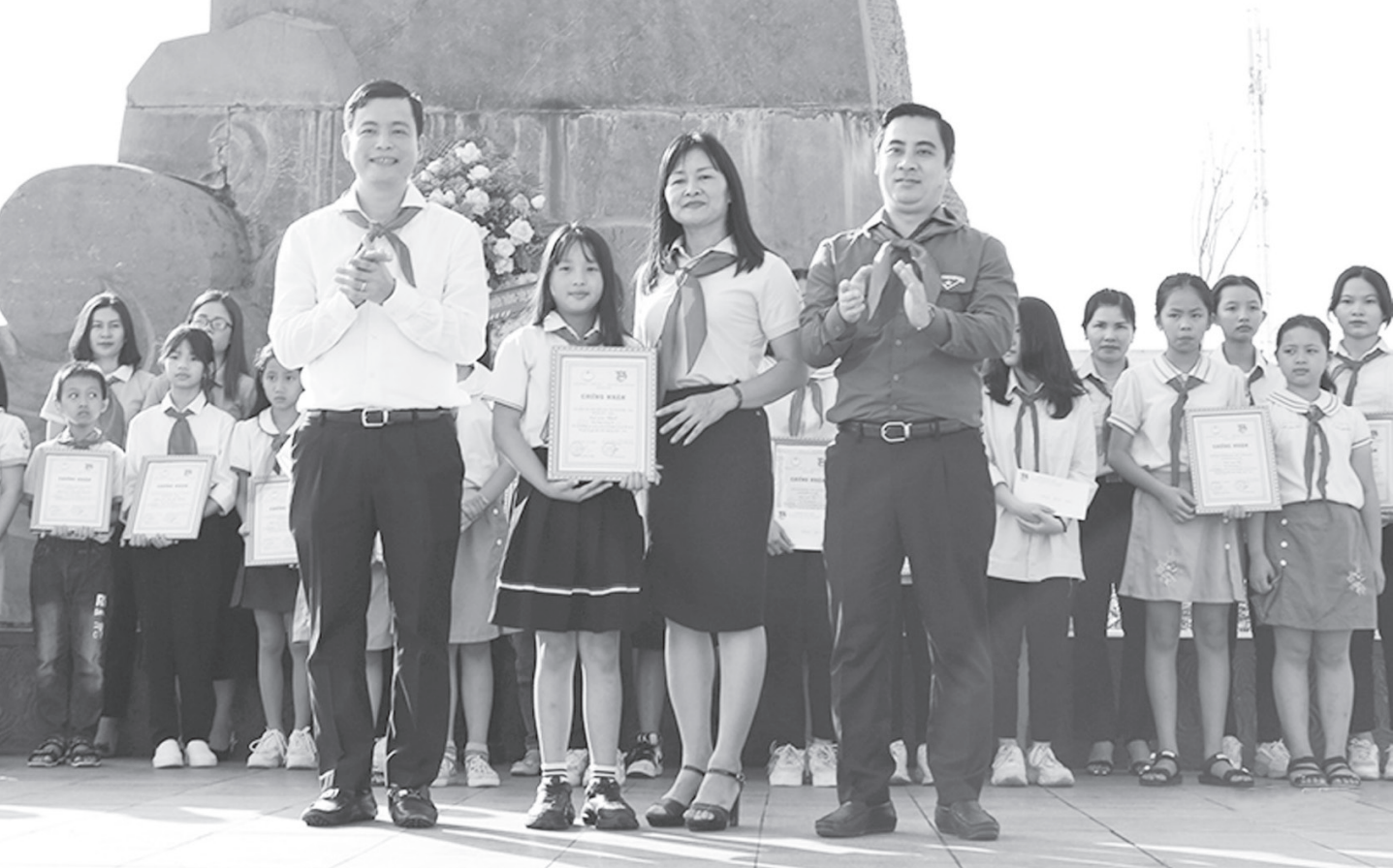
Lãnh đạo tỉnh, Tỉnh đoàn trao giải Nhất cuộc thi video clip “Em yêu Tổ quốc Việt Nam” cho Trường TH thị trấn Đức Thọ