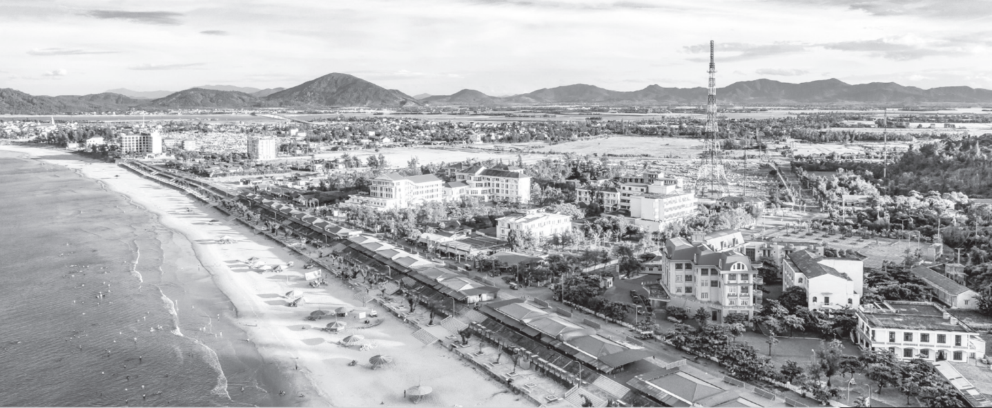
Bãi biển Thiên Cẩm.