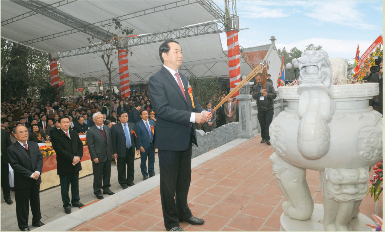
Chủ tịch nước Trần Đại Quang thắp hương tưởng niệm Vua Mai Hắc Đế