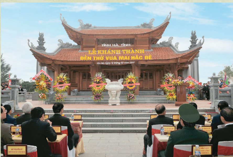
Vua Mai Hắc Đế có khuôn viên hơn 7.000m 2 , trong đó diện tích xây dựng gần 1.000m 2 với nhiều hạng mục

Sau khi Vua Mai Hắc Đế mất, để tưởng nhớ công ơn của ông cùng các tướng sỹ, nhân dân nhiều nơi trong nước đã lập đền thờ phụng, trong đó có đền Mai Hắc Đế tại quê nhà nay là thôn Mai Lâm, xã Mai Phú, huyện Lộc Hà, tỉnh Hà Tĩnh.