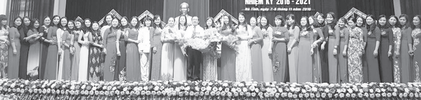
Đại hội đại biểu Liên hiệp Phụ nữ tỉnh Hà Tĩnh lần thứ XV