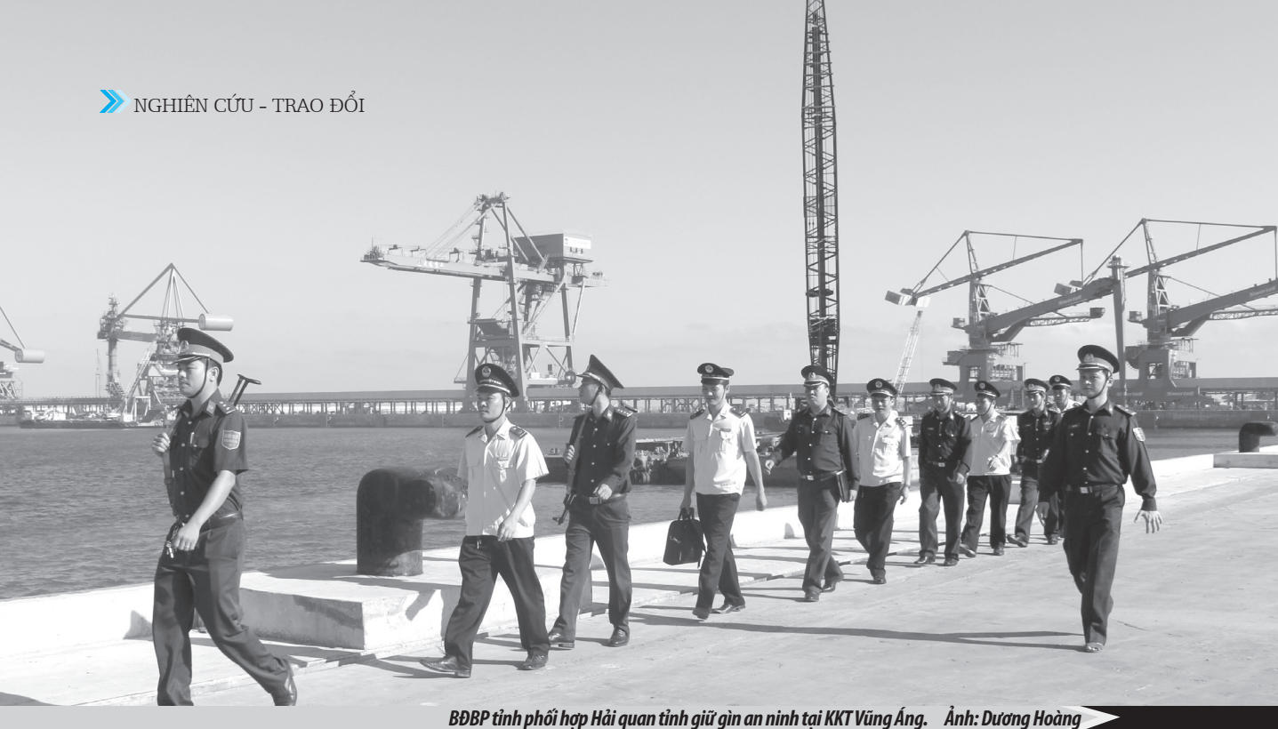
BĐBP tỉnh phối hợp Hải quan tỉnh giữ gìn an ninh tại KKT Vũng Áng.