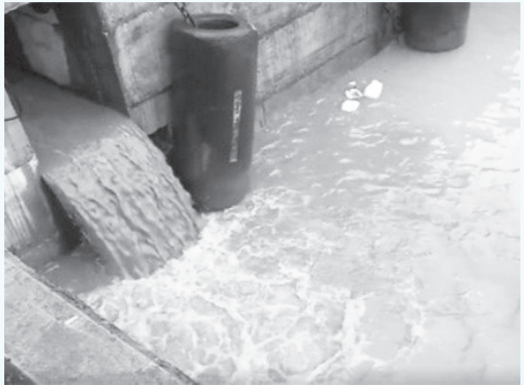
Hình ảnh gán ghép công xả thải bị các trang mạng cho rằng của Formosa Hà Tĩnh.

Thời gian gần đây, trên các trang mạng xã hội và internet xuất hiện nhiều thông tin xấu độc, bịa đặt, xuyên tạc chống phá Đảng, Nhà nước ta. Một số vụ việc bị cắt ghép, xáo xào nhằm kích động, chia rẽ khối đại đoàn kết toàn dân tộc. Trước tình trạng đó, đòi hỏi các cơ quan chức năng phải có những biện pháp tích cực để ngăn chặn, mỗi cán bộ, đảng viên phải tỉnh táo trong tiếp cận để tránh rơi vào âm mưu của các thế lực thù địch.