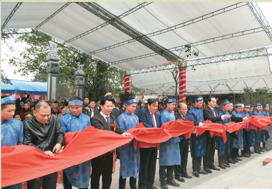
Các đại biểu cắt băng khánh thành Đền thờ Vua Mai Hắc Đế