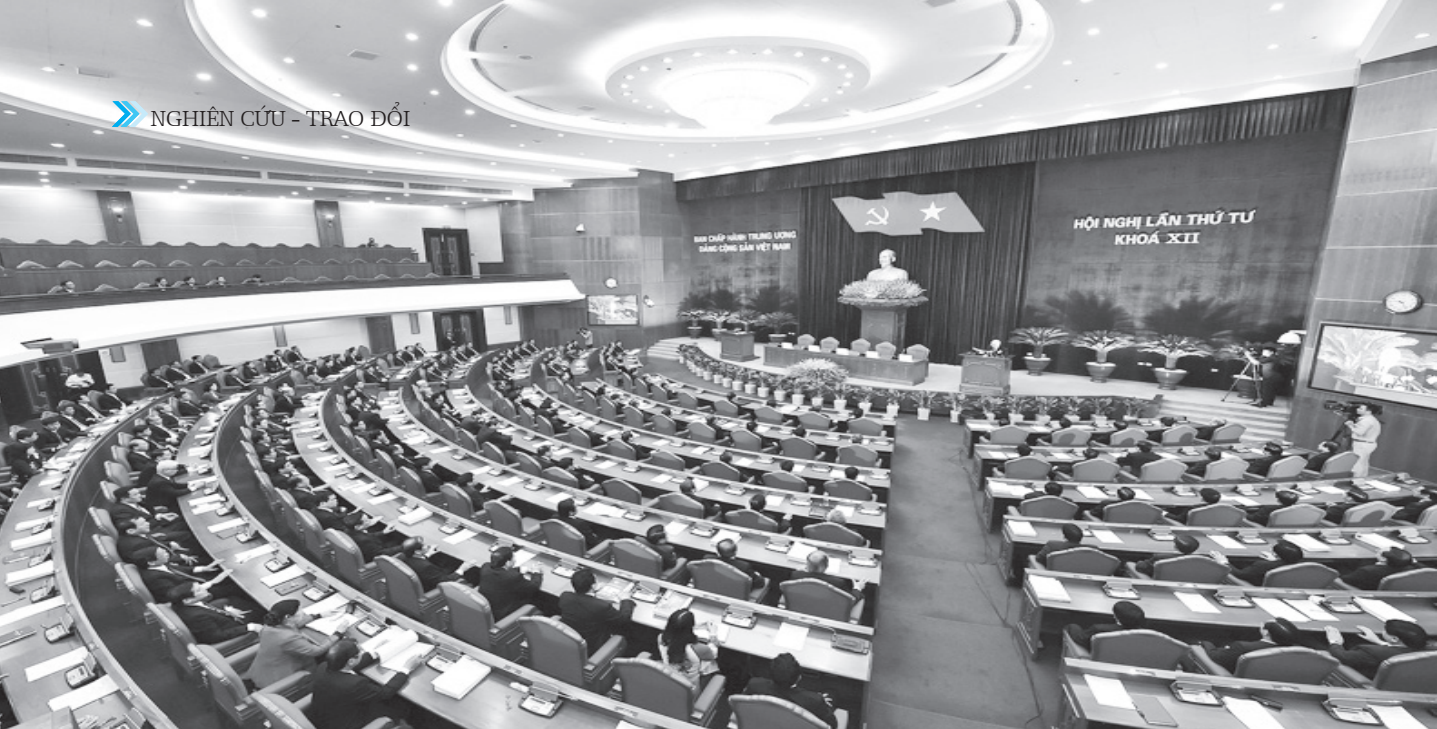
Toàn cảnh Hội nghị lần thứ tư - BCH Trung ương Đảng khóa XII.