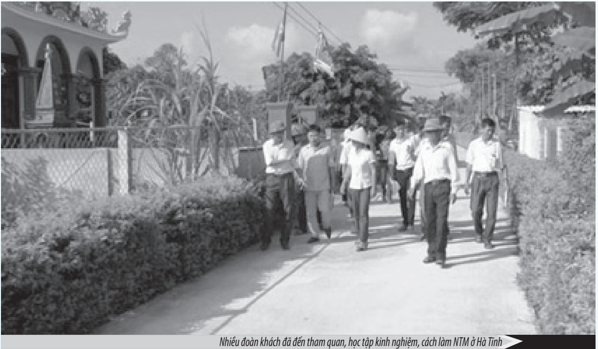
Nhiều đoàn khách đã đến tham quan, học tập kinh nghiệm, cách làm NTM ở Hà Tĩnh