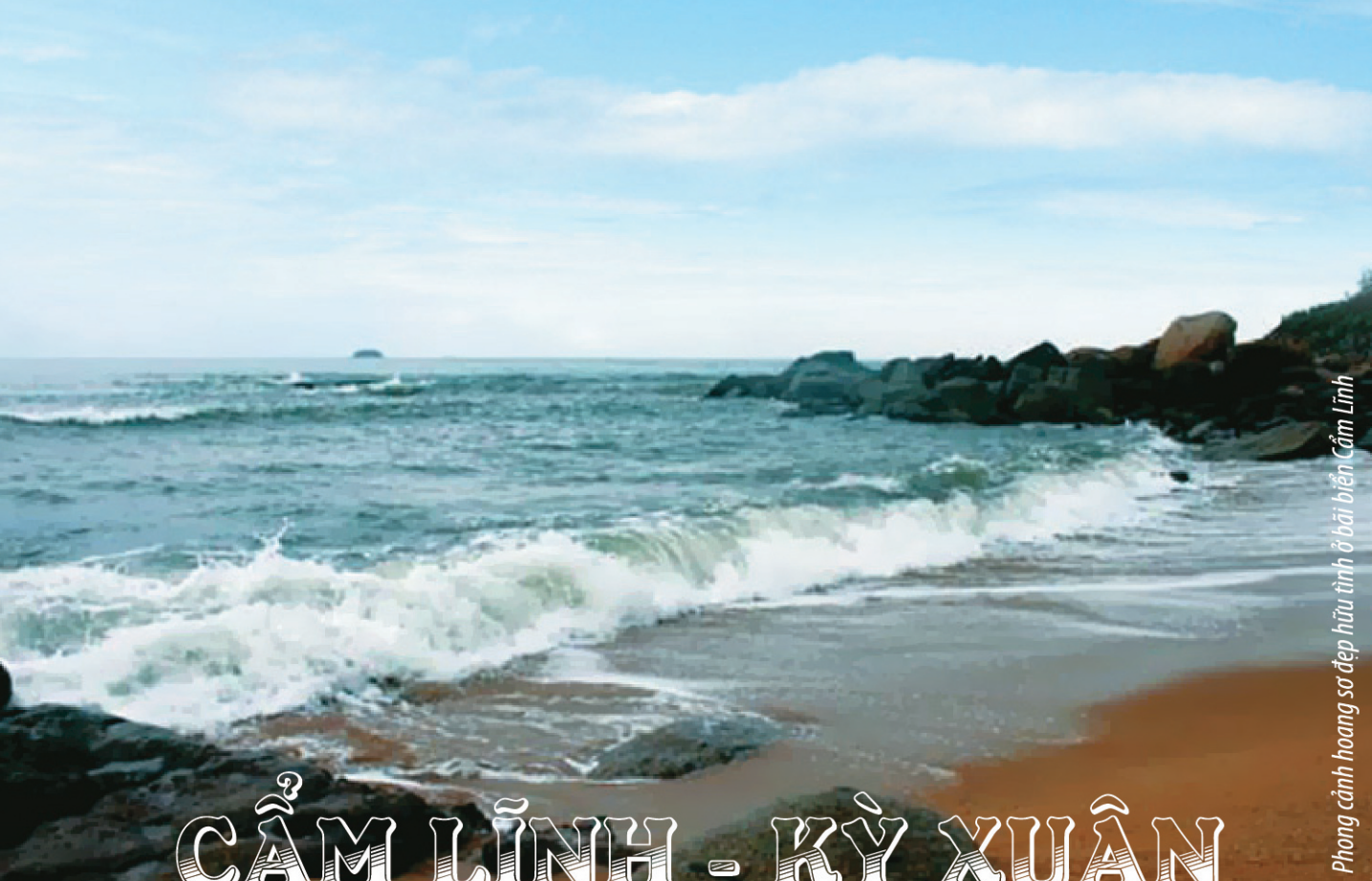
Phong cảnh hoang sơ đẹp hữu tình ở bãi biển Cẩm Lĩnh