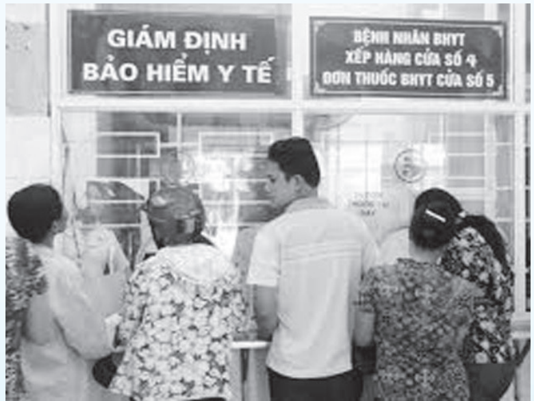
Đón tiếp bệnh nhân bảo hiểm y tế