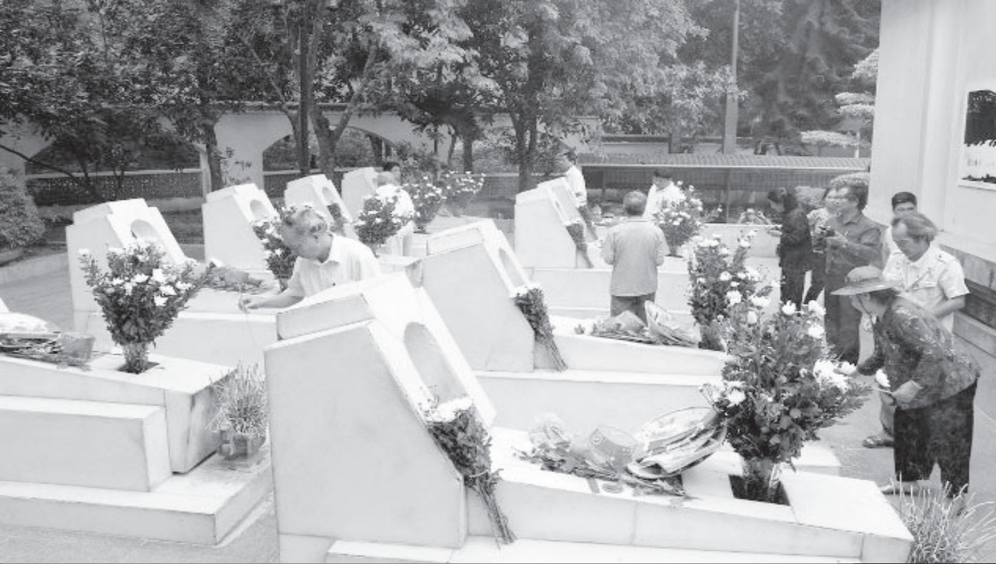
Thắp hương tưởng nhớ 10 cô gái thanh niên xung phong tại Ngã ba Đồng Lộc