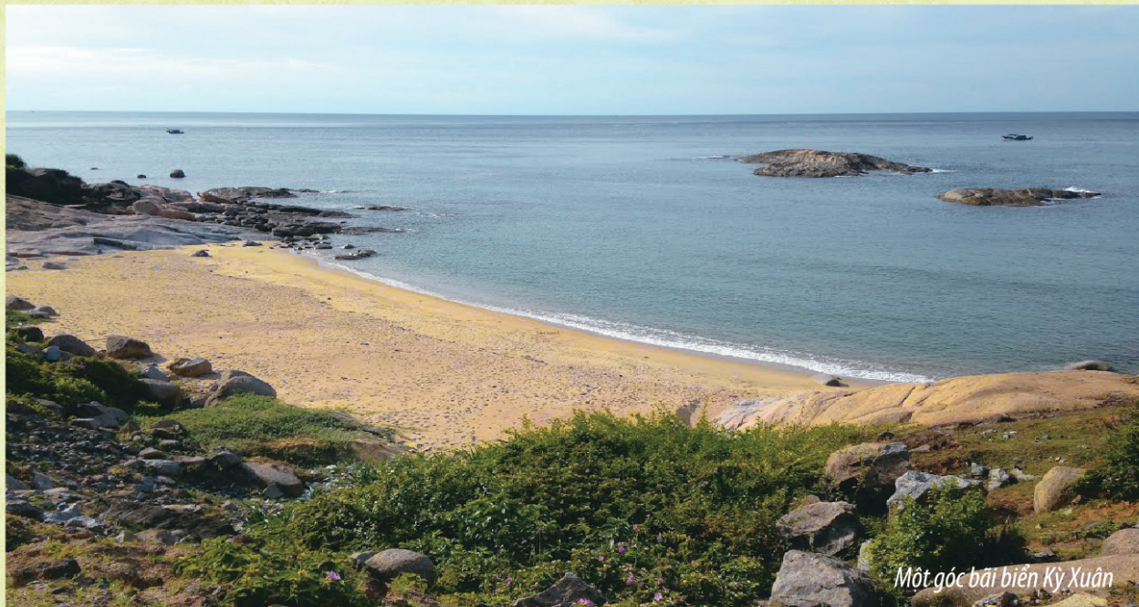
Một góc bãi biển Kỳ Xuân

lượng, hợp khẩu vị, giá hợp lý. Tiếng lành đồn xa, nên thời gian gần đây số khách ngoài địa phương tổ chức nhóm, hộ gia đình đến đây nghỉ mát, du lịch bắt đầu tăng đáng kể, nhất là vào dịp hè. Nay mai đầu tư, quy hoạch đúng hướng, nơi đây sẽ trở thành điểm du lịch lý tưởng không thua gì Thiên Cẩm, Thạch Hải, Cửa Lò... Người dân chúng tôi cũng được hưởng lợi, có công ăn việc làm, cải thiện cuộc sống”.