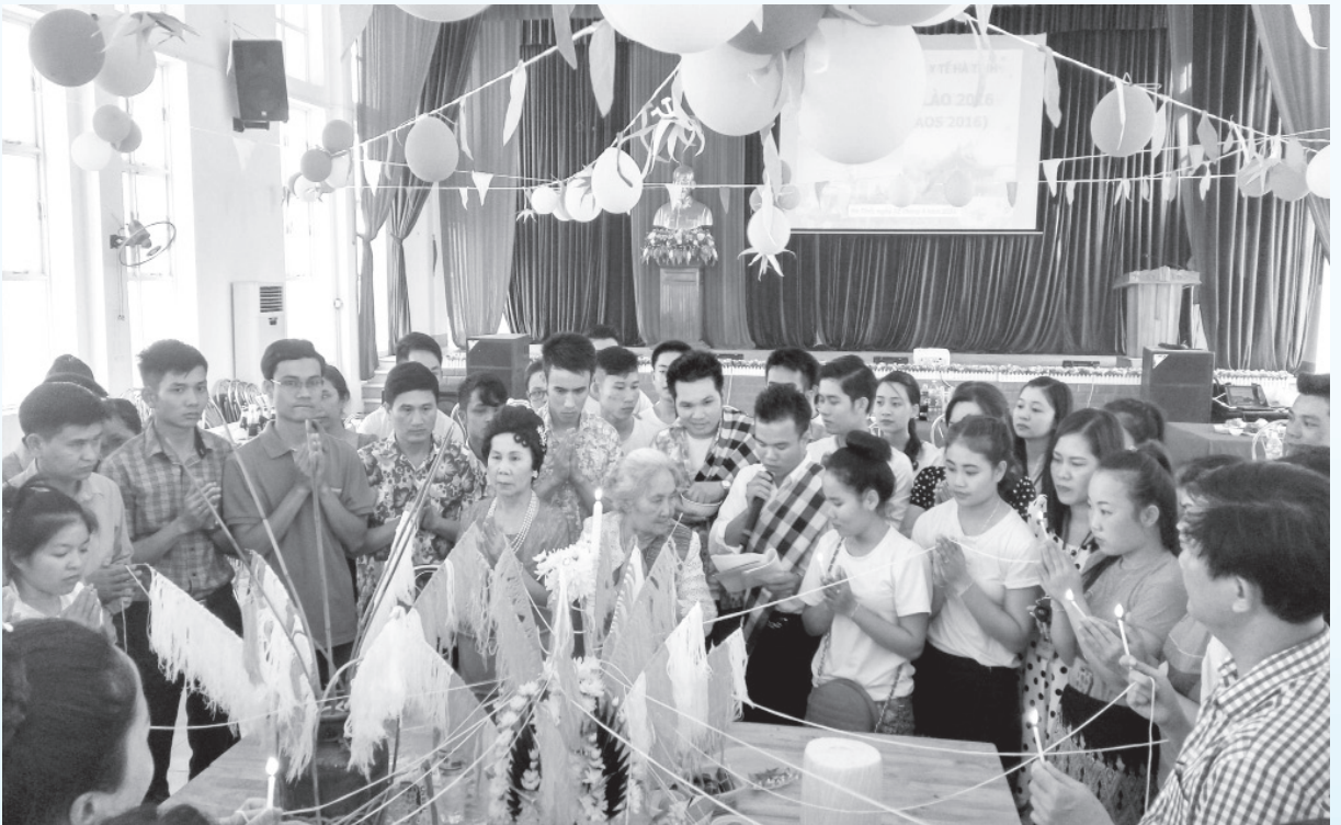
Đám ấm Tết Bunpimay của sinh viên Lào