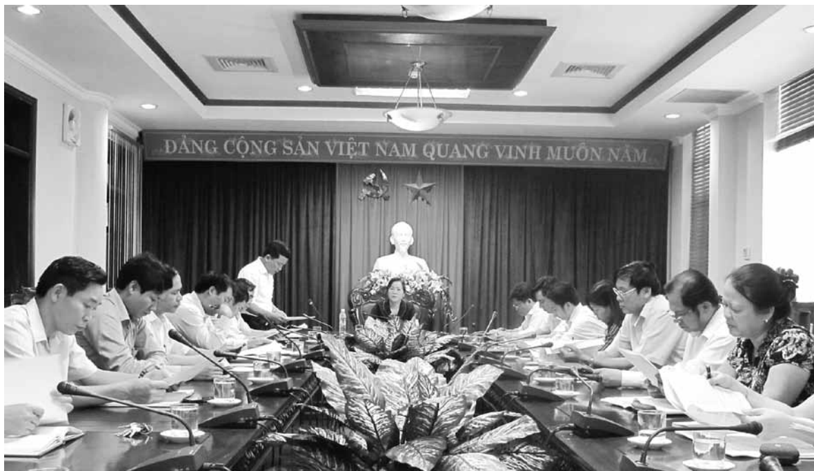
Hội nghị giao Ban giữa Ban Dân vận Tỉnh ủy với MTTQ và các đoàn thể