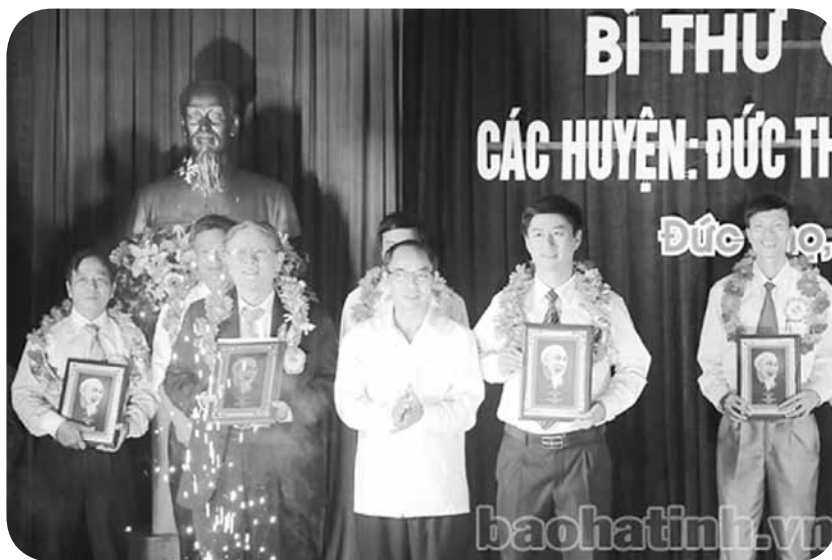
Đ/c Nguyễn Thiện - UVBTV Tỉnh ủy, Phó chủ tịch Thường trực UBND tỉnh trao giải cho các thí sinh.

Hội thi lần này các thí sinh trải qua 3 phần thi: tự giới thiệu, nhận thức về Đảng và xử lý tình huống. Ở phần thi tự giới thiệu: hầu hết các thí sinh đã tiến hành nội dung thi bằng hình thức sân khấu hóa được chuẩn bị công phu với sự tham gia của các đoàn viên, hội viên là những hạt nhân trong phong trào văn hóa – văn nghệ ở cơ sở. Với việc lồng ghép các làn điệu dân ca, ví, dặm Nghệ Tĩnh đã làm cho màn chào hỏi của các thí sinh thêm phần cuốn hút, hấp dẫn, mang lại nhiều cung bậc cảm xúc cho cán bộ, đảng viên và bà con nhân dân đến xem và cổ vũ. Ở phần thi nhận thức về Đảng: