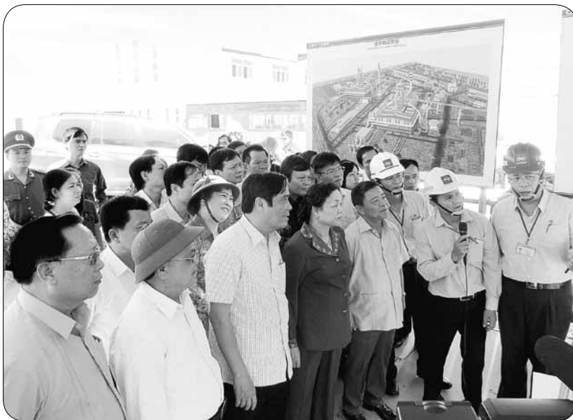
Đồng chí Hà Thị Khiết - Bí thư TW Đảng, Trưởng Ban Dân vận TW cùng các đ/c lãnh đạo Ban Dân vận TW và lãnh đạo tỉnh làm việc tại Khu kinh tế Vũng Áng

Ngay từ những ngày đầu thành lập, Đảng ta đã đặt nhiệm vụ Dân vận lên hàng đầu. Cương lĩnh đầu tiên của Đảng đã xác định: Đảng phải “thâu phục” cho được đại đa số công nhân, đại số nông dân, trí thức... Cương lĩnh đó trở thành khẩu hiệu hành động cho công tác dân vận trong việc tập hợp, đoàn kết các tầng lớp nhân dân vào