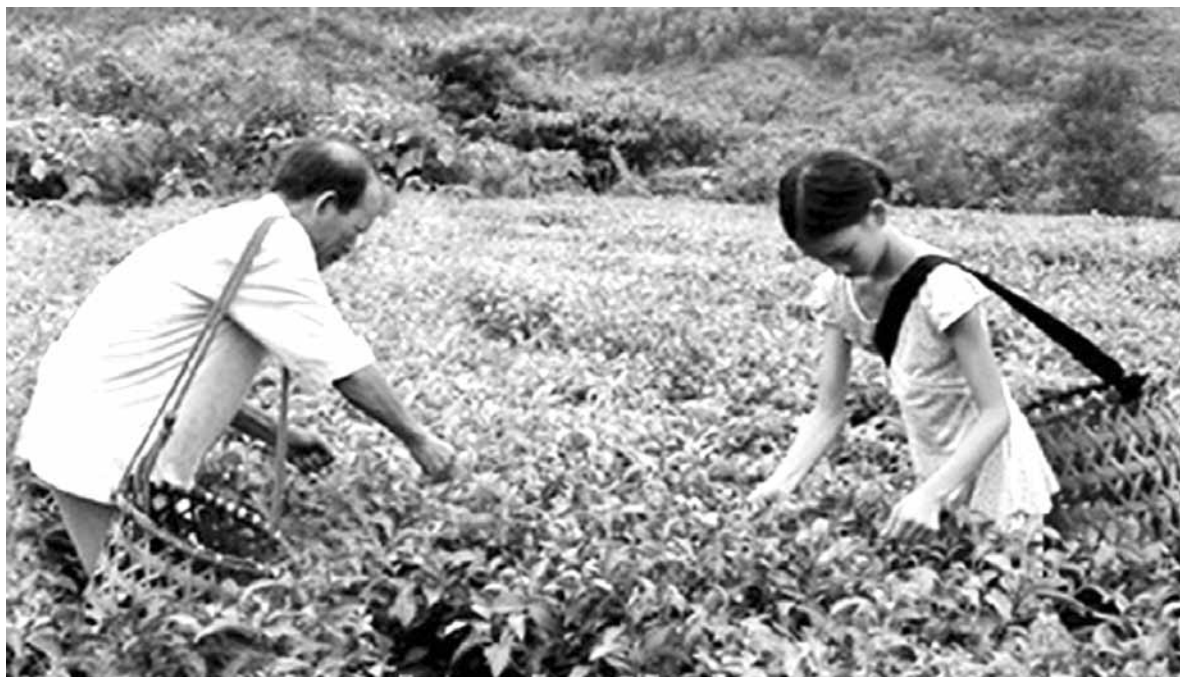
Sản phẩm chè Kỳ Thượng Kỳ anh – mô hình sản xuất theo chuỗi giá trị