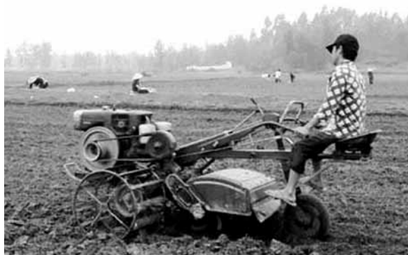
Nông dân Vũ Quang tích cực đưa cơ giới hóa vào sản xuất.

Thôn 7, xã Sơn Giang, huyện Hương Sơn có 101 hộ dân với 437 khẩu, Chi bộ có 15 đảng viên. Nhận thức đầy đủ, sâu sắc về vai trò, vị trí của công tác dân vận trong công cuộc xây dựng và phát triển của địa phương, Chi bộ thôn đã vận dụng linh hoạt tư tưởng công tác dân vận của Bác vào thực hiện phong trào xây dựng nông thôn mới và đạt được kết quả đáng ghi nhận, trong đó nổi bật là việc huy động nội lực để xây dựng nhà văn hoá và phát triển kinh tế của thôn.