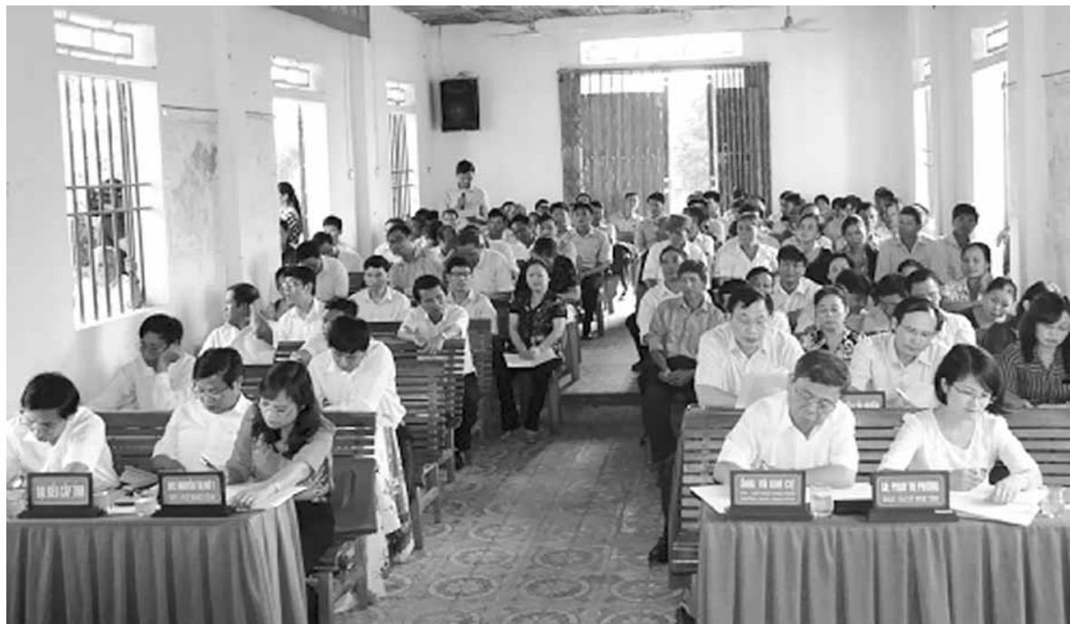
Đại biểu Quốc hội tỉnh tiếp xúc cử tri tại xã Đức Lập - Đức Thọ.

Ủy viên BTV Tỉnh ủy, Bí thư Thành ủy Thành phố Hà Tĩnh