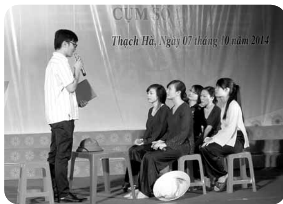
Tình huống - được diễn xuất bởi các đoàn viên cơ quan Tỉnh ủy