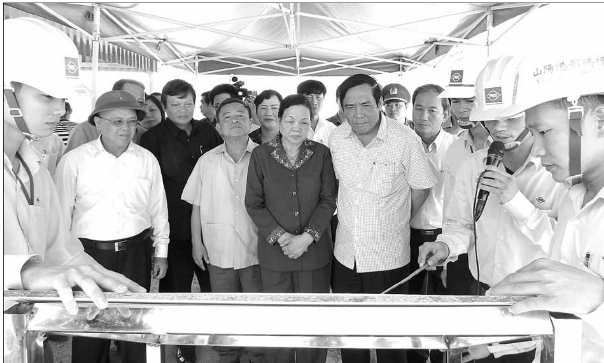
Các đại biểu tham quan Khu kinh tế Vũng Áng