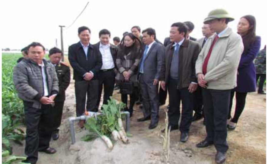
Các đ/c lãnh đạo Ban Dân vận Tỉnh uỷ, Ban Dân vận các huyện, thành, thị uỷ và Đảng uỷ trực thuộc tham quan mô hình trồng rau trên cát tại xã Thạch Văn.

Dưới sự lãnh đạo của cấp ủy Đảng, Mặt trận Tổ quốc phối hợp với chính quyền, các