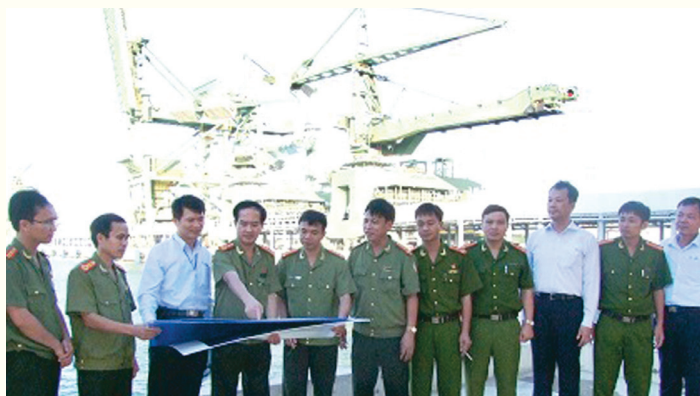
Lãnh đạo Công an tỉnh kiểm tra công tác đảm bảo an ninh trật tự tại khu vực cầu cảng thuộc dự án Formosa

Lãnh đạo, chỉ đạo triển khai thực hiện tốt công tác bảo vệ chính trị nội bộ, an ninh kinh tế, an ninh văn hóa - tư tưởng, an ninh mạng, an ninh biên giới, vùng biển, an ninh nông thôn, bảo vệ bí mật nhà nước; bảo vệ tuyệt đối an toàn các mục tiêu quan trọng, các sự kiện chính trị, văn hóa của địa phương. Phát huy vai trò trách nhiệm của cấp ủy, chính quyền địa phương, nhất là nơi có các công trình, dự án trọng điểm. Tăng cường quản lý Nhà nước trong việc thực hiện đầu tư có