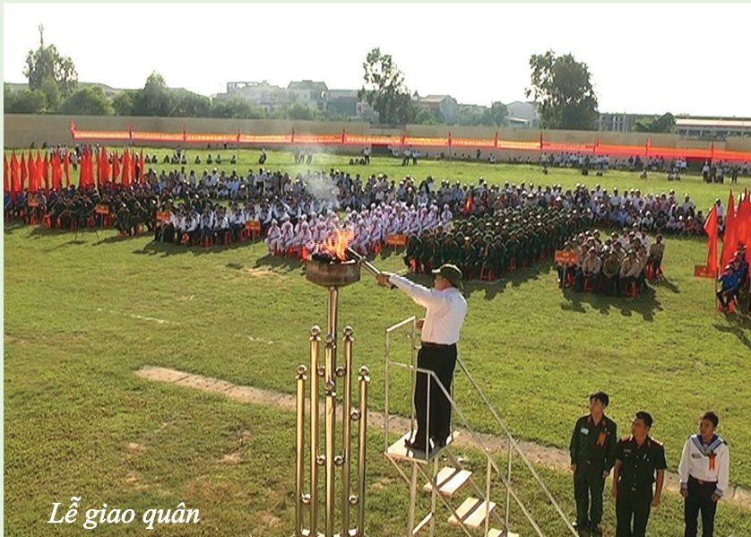
Lễ giao quân

Cùng với việc đẩy mạnh phát triển KT-XH, công tác QP-AN thường xuyên được quan tâm, củng cố đáp ứng yêu cầu, nhiệm vụ bảo vệ Tổ quốc. Trong đó, quan tâm xây dựng cơ sở vững mạnh toàn diện, cụm an toàn làm chủ - sẵn sàng chiến đấu; tổ chức, giáo dục QP-AN cho các đối tượng; diễn tập chiến đấu trị an, tìm kiếm cứu nạn, phòng chống lụt bão. Lực lượng Công an luôn chủ động trong công tác phòng ngừa và đấu tranh với các loại tội phạm nhằm giữ vững ANTT. Đồng thời, triển khai thực hiện các kế hoạch đảm bảo an ninh chính trị nội bộ, đảm bảo an ninh văn hóa thông tin, phối hợp với lực lượng chức năng làm tốt công tác tuyên truyền, phổ biến giáo dục pháp luật để người dân nâng cao ý thức cảnh giác với các loại tội phạm, duy trì, nâng cao chất lượng hoạt động của các mô hình tự quản, tăng cường công tác quản lý hành chính về trật tự xã hội. Bên cạnh đó, huyện đã chỉ đạo các đơn vị xây dựng và thực