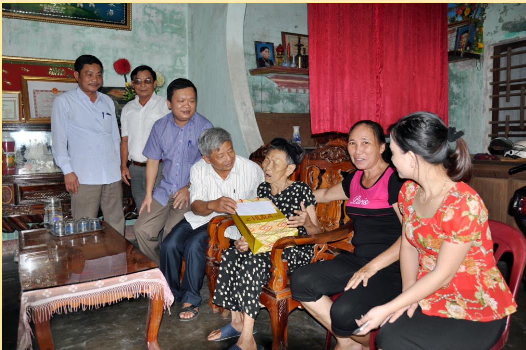
Ban Nội chính Tỉnh ủy đến thăm và tặng quà các gia đình chính sách tại huyện Nghi Xuân, Cẩm Xuyên nhân ngày thương binh liệt sỹ 27/7