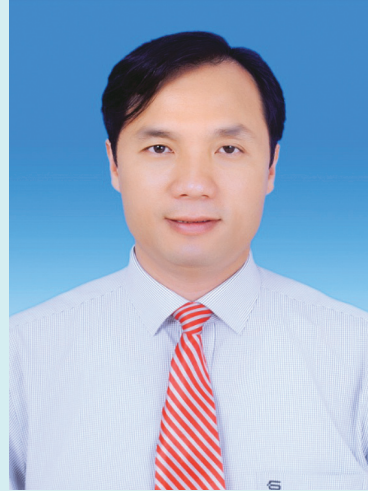
HOÀNG TRUNG DŨNG UVBTV Tỉnh ủy, Bí thư Thành ủy Hà Tĩnh

Bước vào nhiệm kỳ 2015 - 2020 trong điều kiện có nhiều thuận lợi song phải đối mặt với không ít khó khăn, thách thức; Đảng bộ và nhân dân thành phố Hà Tĩnh quyết tâm phát huy những kết quả đạt được, thực hiện thắng lợi mục tiêu: xây dựng thành phố giàu mạnh, văn minh, hiện đại; xứng đáng với vị thế trung tâm tỉnh lỵ; đạt đô thị loại II trước năm 2018