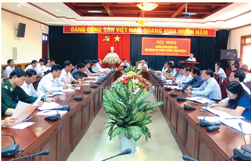
Ban Nội chính Tỉnh ủy tổ chức Hội nghị tập huấn, hướng dẫn triển khai công tác nội chính và phòng, chống tham nhũng

Tuyên truyền sâu rộng trong toàn Đảng bộ và nhân dân về vị trí, vai trò và tầm quan trọng của công tác nội chính đối với sự phát triển kinh tế - xã hội, đảm bảo quốc phòng - an ninh, đề thống nhất nhận thức và hành động, tạo nên sức mạnh tổng hợp thực hiện thắng lợi các mục tiêu, nhiệm vụ đề ra.