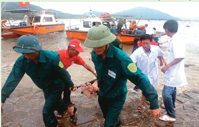
Diễn tập phòng chống lụt bão

Ba là, tăng cường công tác quản lý nhà nước về QP - AN. Nâng cao chất lượng xây dựng, huấn luyện lực lượng dân quân tự vệ, dự bị động viên Công an xã, Công an viên bảo đảm về số lượng và chất lượng, giải quyết các vụ việc ngay tại cơ sở; xây dựng thể trận an ninh nhân dân gắn với quốc