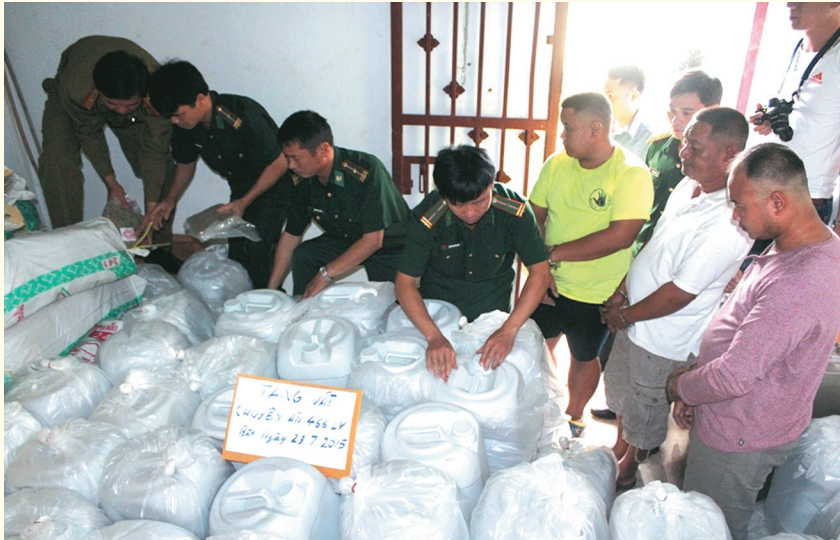
Bộ đội Biên phòng Hà Tĩnh triệt phá đường dây 5,5 tấn ma túy

của tỉnh; tham mưu cho UBND tỉnh triển khai kế hoạch thực hiện Đề án “Tăng cường phổ biến giáo dục pháp luật cho cán bộ, nhân dân khu vực biên giới, hải đảo” giai đoạn 2013- 2016 đạt kết quả tốt; phối hợp với Học viện Chính trị Khu vực I - Học viện Chính trị Quốc gia Hồ Chí Minh tổ chức lớp “Bồi dưỡng kiến thức về dân tộc, tôn giáo và chủ trương, chính sách của Đảng, Nhà nước ta đối