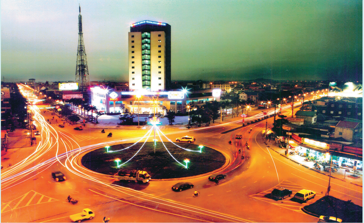
Một góc thành phố Hà Tĩnh về đêm

ơ sở về Thành phố. Chỉ tính riêng trong dịp đại hội Đảng bộ cơ sở nhiệm kỳ 2015 - 2020, trong số 16 xã, phường, Thành phố đã thay đổi 10 Bí thư Đảng ủy, 10 Chủ tịch UBND, 09 Chủ tịch HĐND và 11 Chủ tịch Ủy ban MTTQ xã phường. Thực hiện Chỉ thị 36 của Bộ Chính trị, Ban Thường vụ Thành ủy đã vận động 21 đồng chí cán bộ cốt cán xã, phường không đủ tuổi tái cử theo quy định nghỉ hưởng chế độ.