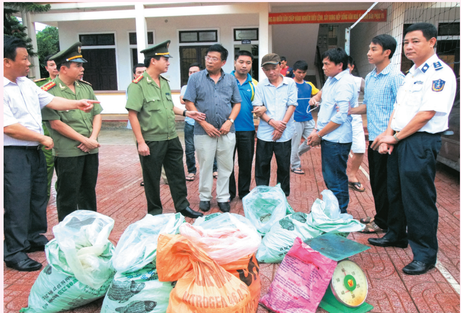
Giám đốc Công an tỉnh trực tiếp xuống hiện trường động viên Ban chuyên án bắt 2 đối tượng vận chuyển 300kg thuốc nổ qua địa bàn TP Hà Tĩnh

phường, thị trấn không tệ nạn ma túy” tại các địa bàn: TP Hà Tĩnh, TX Hồng Lĩnh, huyện Thạch Hà, Lộc Hà... Phối hợp các lực lượng tập trung đấu tranh khám phá các đường dây mua bán ma túy từ Lào về Việt Nam. Phát hiện, bắt giữ 86 vụ, 134 đối tượng mua bán, vận chuyển, tàng trữ, vận chuyển trái phép pháo, thu giữ gần 1.000kg pháo các loại; đã khởi tố 24 vụ, 40 bị can về tội tàng trữ, vận chuyển, buôn bán hàng cấm; phát hiện, xử lý 65 trường hợp đốt pháo trái phép. Điều tra khám phá 212 vụ, 356 đối tượng phạm pháp hình sự