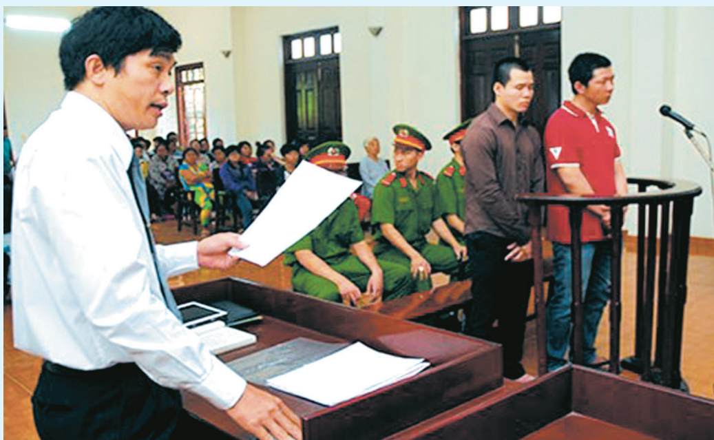
Luật sư tranh tụng tại phiên tòa