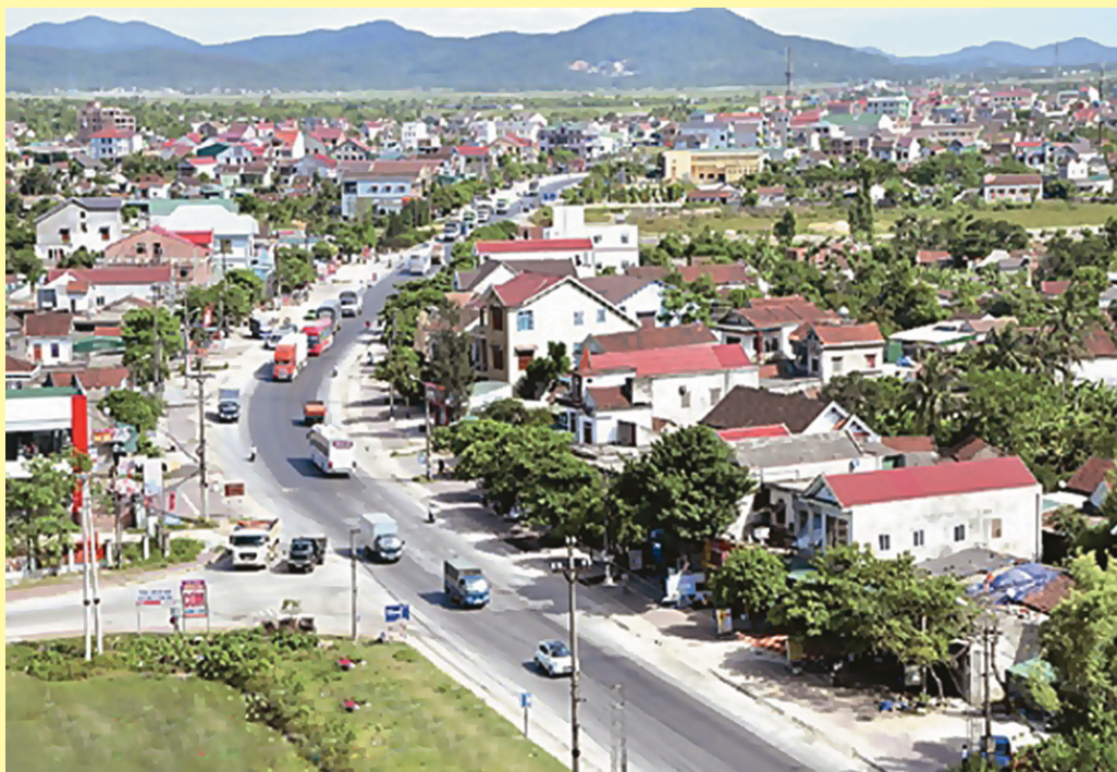
Một góc Thị xã Kỳ Anh - Hà Tĩnh

Bản tin Nội chính Hà Tĩnh mong nhận được ý kiến góp ý, cộng tác của các đồng chí và bạn đọc.