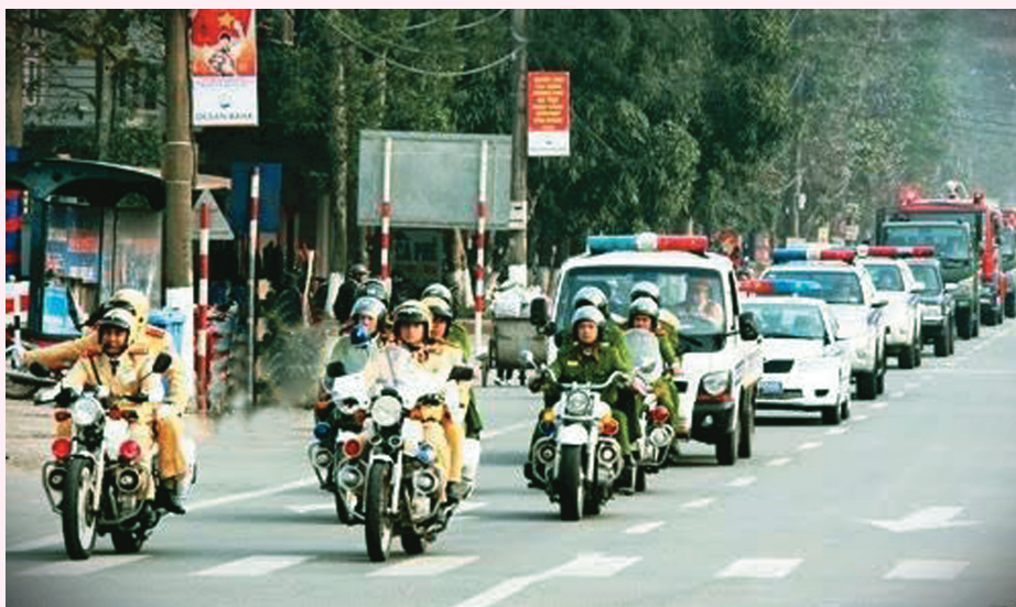
Công an Hà Tĩnh mở đợt cao điểm tấn công trấn áp tội phạm

Mở các đợt cao điểm tấn công, trấn áp và truy nã tội phạm, giải quyết những vấn đề phức tạp về tội phạm trên các tuyến, địa bàn trọng điểm. Đối với Khu Kinh tế Vũng Áng, tập trung chỉ đạo thực hiện các giải pháp mang tính đột phá trong phòng ngừa, ngăn chặn, đấu tranh triệt phá các băng, nhóm tội phạm, nhất là các băng, nhóm hoạt động liên tỉnh, từ nơi khác đến hoạt động trên địa bàn tỉnh; tăng cường đấu tranh với