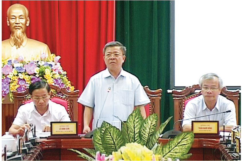
Các đồng chí Bí thư Tỉnh ủy, Phó Bí thư Thường trực, Phó Bí thư, Chủ tịch UBND tỉnh chủ trì Hội nghị Ban Chấp hành Đảng bộ tỉnh mở rộng thảo luận, thống nhất thông qua việc ban hành Nghị quyết

Đồng chí Bí thư Tỉnh ủy yêu cầu: (1) Các đảng đoàn, ban cán sự đảng, đảng ủy trực thuộc và các huyện, thành, thị ủy tổ chức quán triệt sâu rộng Nghị quyết; gắn với tổ chức kiểm điểm, đánh giá tình hình